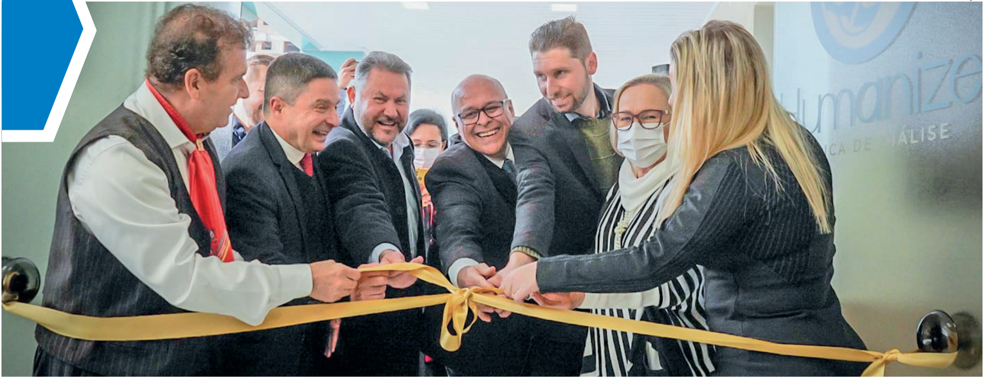
Desenlace da fita inaugural marcou a abertura oficial