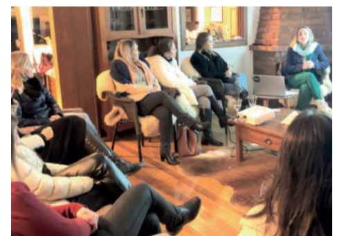
Palestra em encontro do grupo