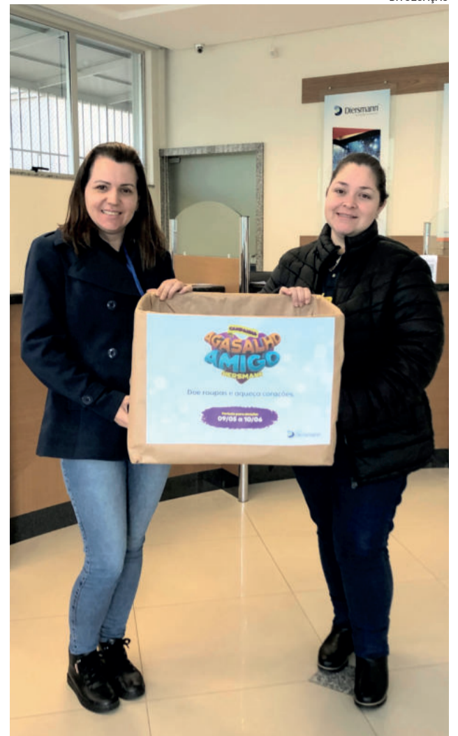
Unidades de Atendimento recebem as doações de segunda a sexta-feira em horário comercial e sábados das 8h às 12h

Arroio do Meio: R. Dr. João Carlos Machado, 453 Bom Retiro do Sul: Av. Sen. Pinheiro Machado, 1039 – Sala 04 Cruzeiro do Sul: R. General Neto, 157 Encantado: R. Júlio de Castilhos, 892 Estrela: R. Geraldo Pereira, 450 Lajeado (dois pontos de recolhimento): R. Santos Filho, 115 – Sala 03 ou Av. João Alberto Schmidt, 733 (Memorial Montanha) Roca Sales: R. 31 de março, 39 – Sala 03 Santa Cruz do Sul (dois pontos de recolhimento): R. Sen. Pinheiro Machado, 460 ou Arroio Grande – Av. Dep. Euclides Nicolau Kliemann, 2480 (Crematório) Teutônia: R. 3 de outubro, 155 Venâncio Aires: R. Tiradentes, 640