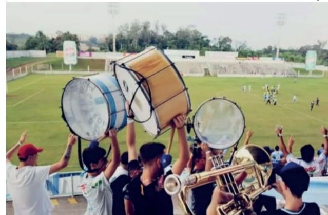
A banda acompanha o clube desde 2015

Classificação: Santa Cruz-RS (18); Pelotas (15); Inter-SM (12); Lajeadense (11); Avenida (10); Guarani-VA (9); São Gabriel (7); São Paulo-RS (6).