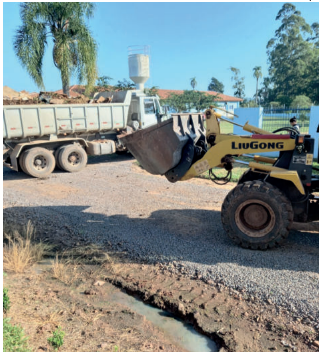
Objetos recolhidos eram potenciais criadouros de mosquito

especialmente os moradores dos trajetos em questão, tendo em vista que essa alteração no trânsito é fundamental para a segurança de todos. Em pontos estratégicos, haverá pessoas realizando o suporte, fiscalização e concedendo orientações aos motoristas e participantes da rústica. Dentro do possível, busque por rotas alternativas. Dúvidas podem ser esclarecidas por meio dos canais oficiais do Município de Poço das Antas.