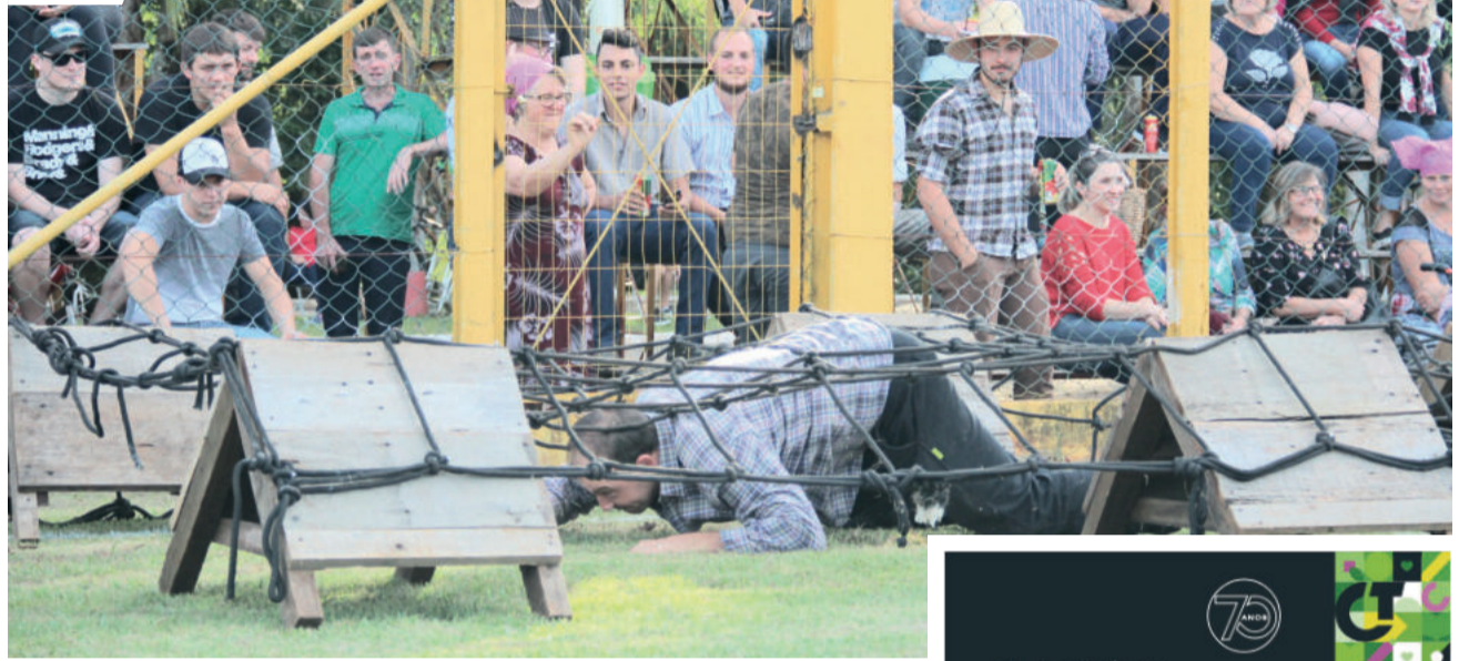
Jogos Germânicos acontecem hoje (21) à tarde

Pediram perdão ao homem, que perdoou, mas não adiantou. Minutos depois quando voltavam para cidade, muitas pessoas presenciaram, o chão tremeu, uma rachadura enorme abriu e engoliu o prefeito e o pastor. Todos dizem que foram direto para o inferno pagar pelo que fizeram.