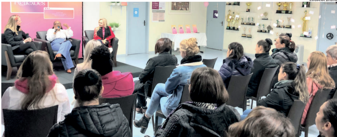
Presidente participou de evento com colaboradoras