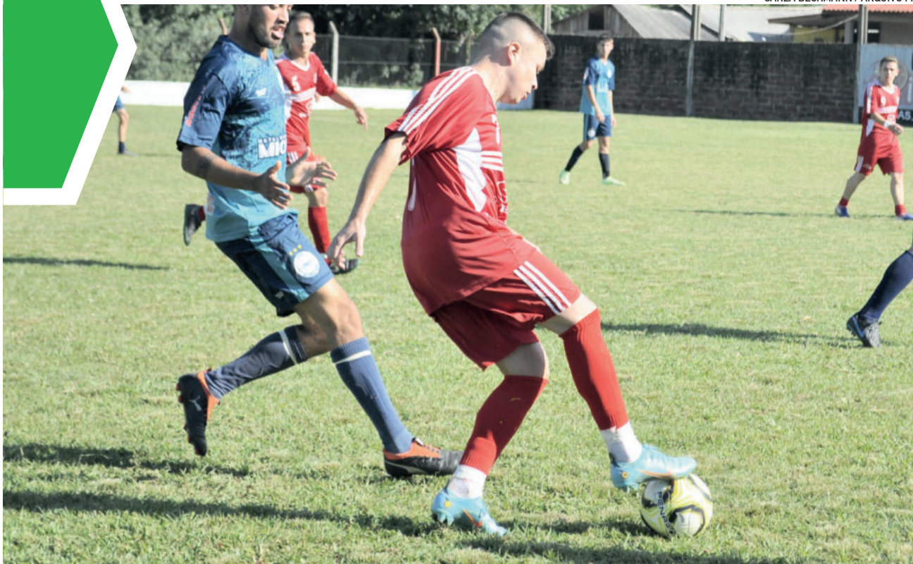
Bola volta a rolar após um feriado e um adiamento