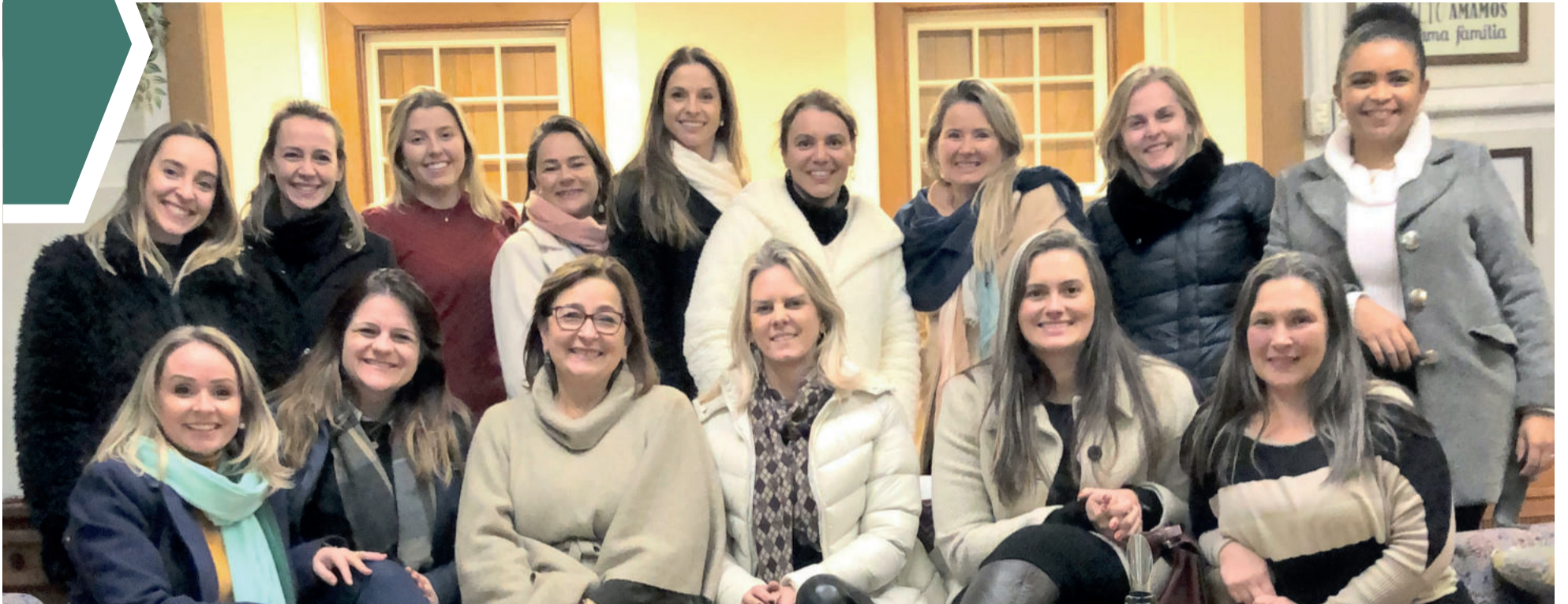
Mulheres participantes na noite