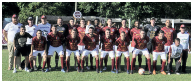
Boavistense tenta a vaga em casa