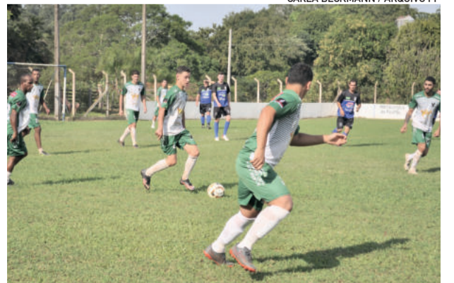
Jogos retornam no dia 29 de maio