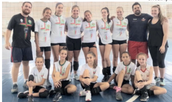
Juventus joga na Associação da Água