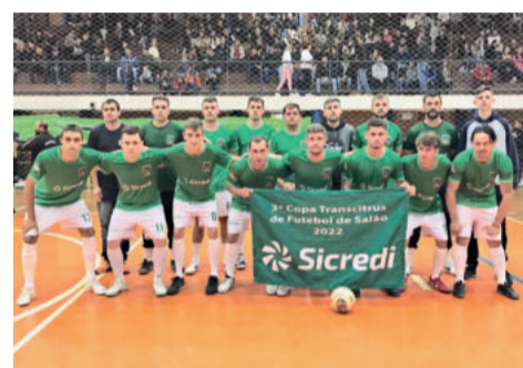
Pareci Novo cofrontra com Poço das Antas