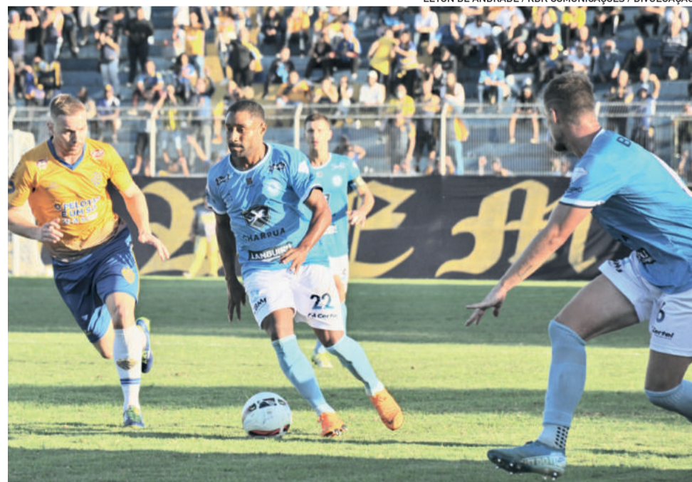
Lajeadense abriu o placar, mas não conseguiu segurar diante do Pelotas