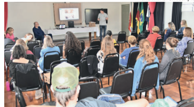
Encontro com autores foi uma das primeiras ações do projeto