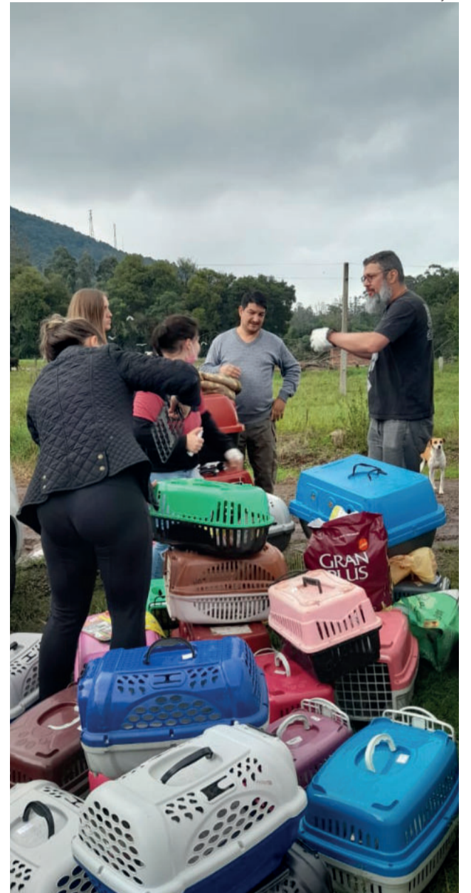
Grupo contou com 12 voluntários e famílias da vizinhança para realizar a captura