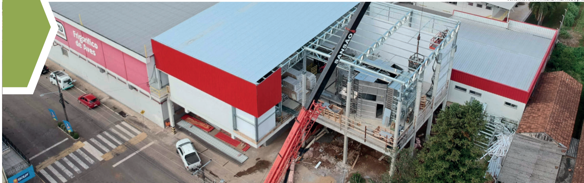
Obras no Frigorífico de Aves, em Westfália, estão divididas em três etapas