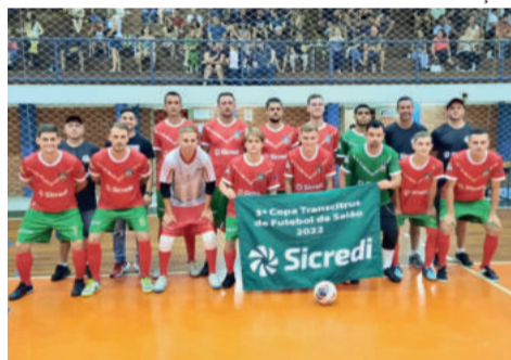
Salvador do Sul recebe Maratá em casa