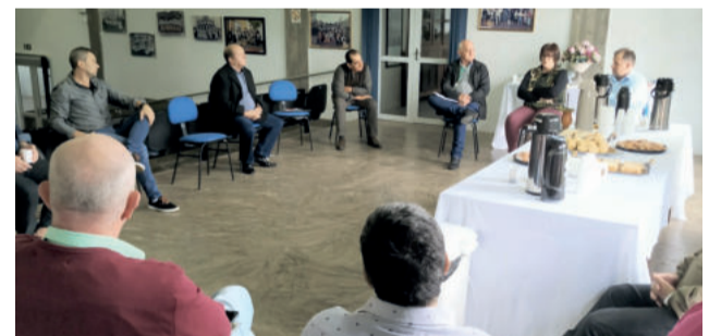
Prefeitos e vices debateram temas diversos

Em pauta estiveram as ações de castração, os programas de turismo e uma palestra com a empresa JCB - Máquinas Pesadas. A reunião também tratou de temas gerais que competem ao setor público. O momento é importante para troca de experiências entre os gestores.