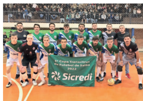
Maratá encara o líder Salvador do Sul