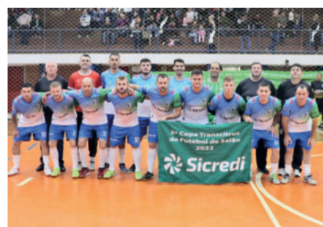
Poço das Antas enfrenta a Seleção de Pareci Novo