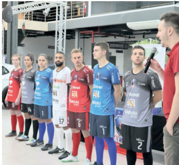
Uniformes para a temporada 2022

O time feminino também disputará o Gauchão de Futsal Série A e a Taça Farroupilha de Futsal Feminino Região dos Vales 2022. A estreia do elenco na competição dos Vales será diante da Teutônia Futsal neste sábado (7/5), às 20h, no Complexo Esportivo da Univates, em Lajeado. O jogo de volta ocorre no dia 14 de maio em Teutônia. As finais estão previstas para os dias 21 e 28 de maio.