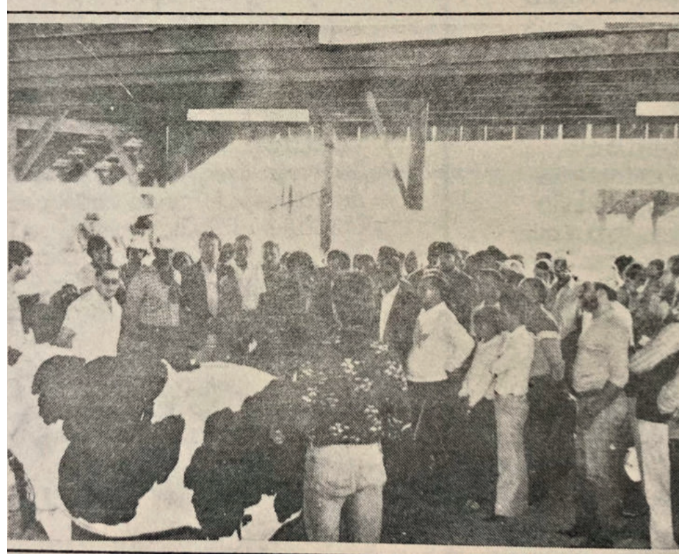
Primeira Festa de Maio aconteceu em frente a Rodoviária em Languiru

Ela lembra com carinho das edições anteriores onde se divertia com os shows e brinquedos, e principalmente a parte do comércio,