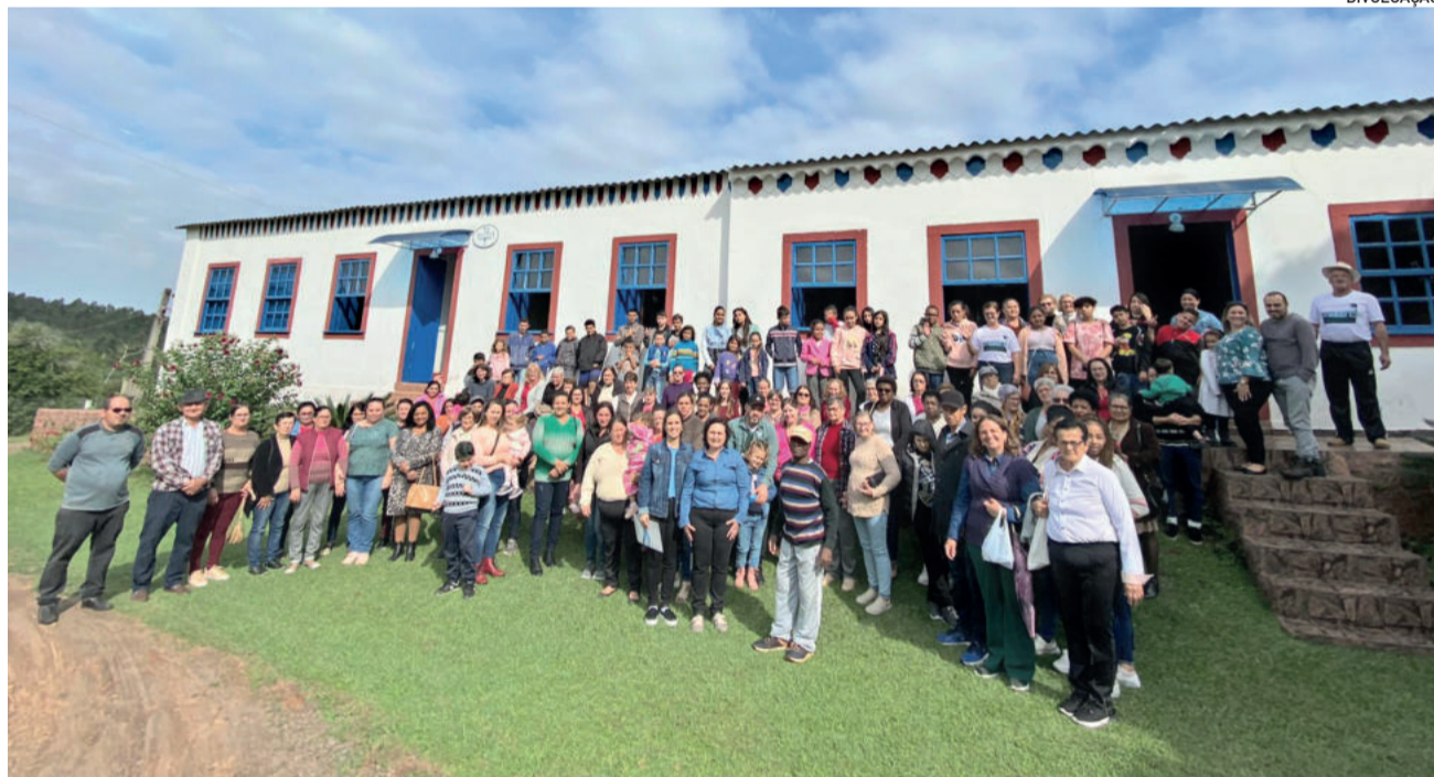
Grupo conheceu o casarão de Fazenda Juliana, ponto turístico da cidade