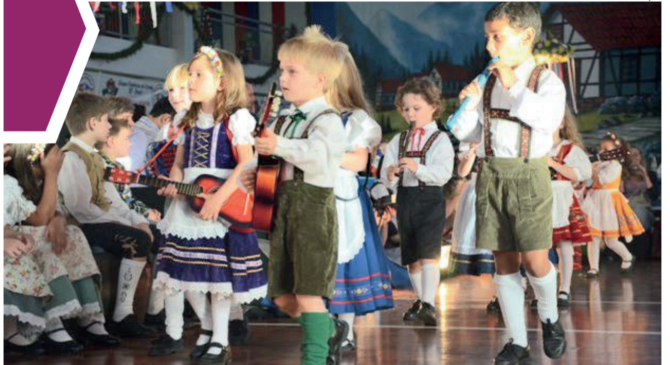
Festival do Chucrute é um dos eventos mais tradicionais da Maifest