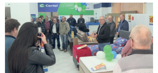
Certel inaugurou primeiro ponto de atendimento