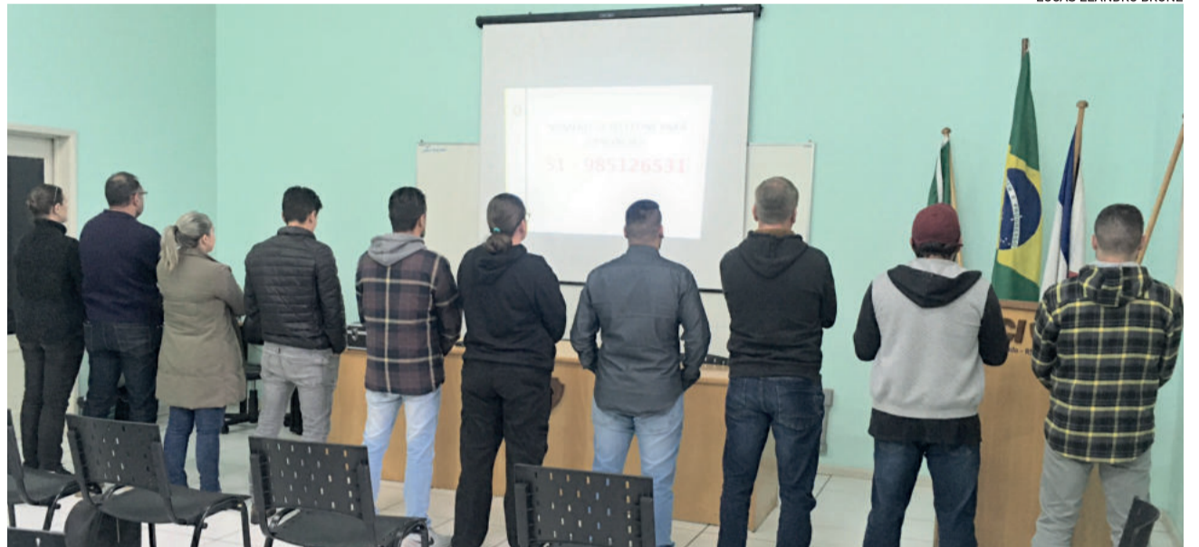
Agência de Inteligência do CRPO VT: foto feita de costas porque os agentes trabalham expostos a campo