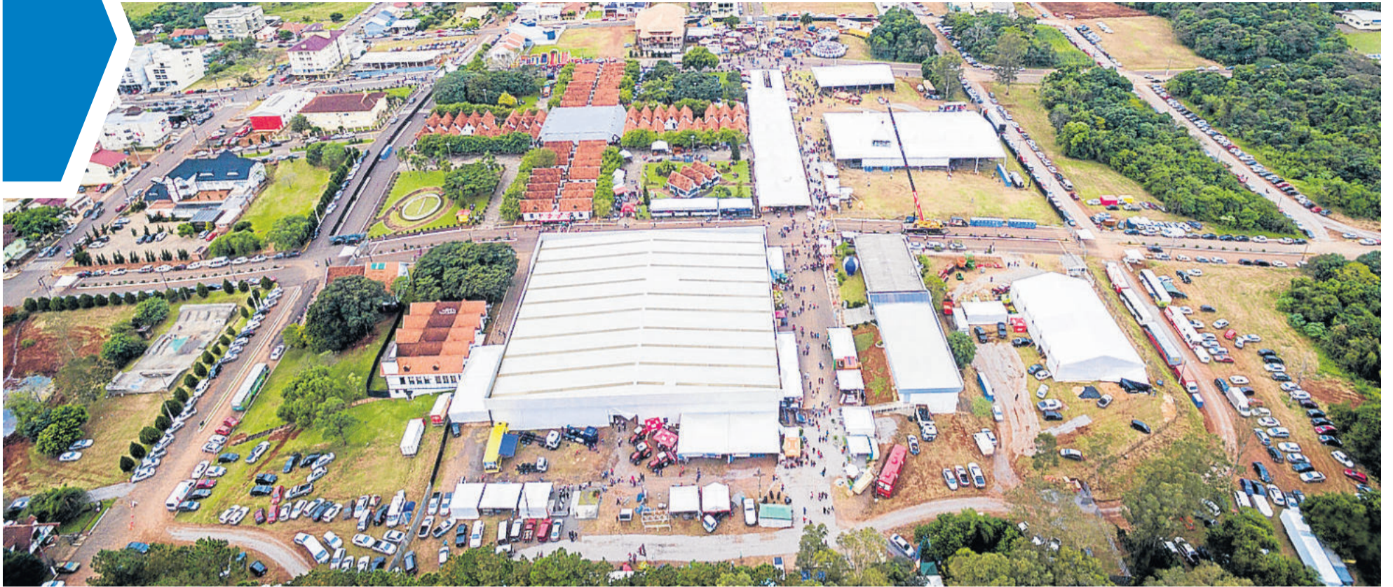
Festa de Maio é o maior evento de Teutônia e um dos maiores da região