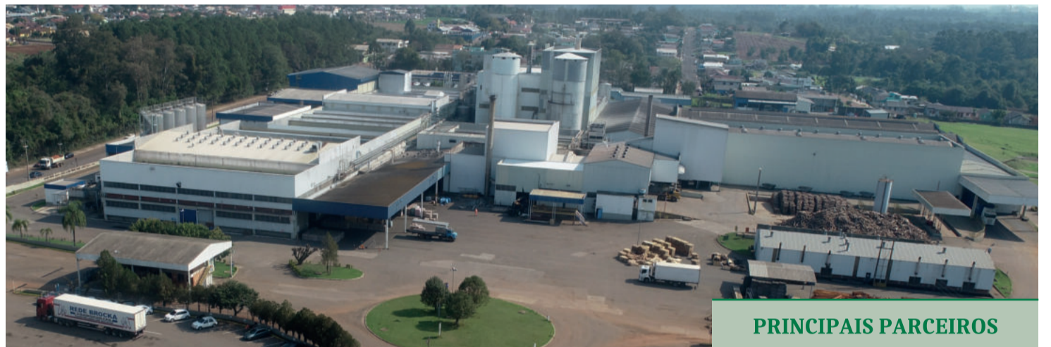
Lactalis também é parceira da Comatra

cooperativa mantém um caminhão, por exigência legal diante da Agência Nacional de Transporte Terrestre (ANTT).