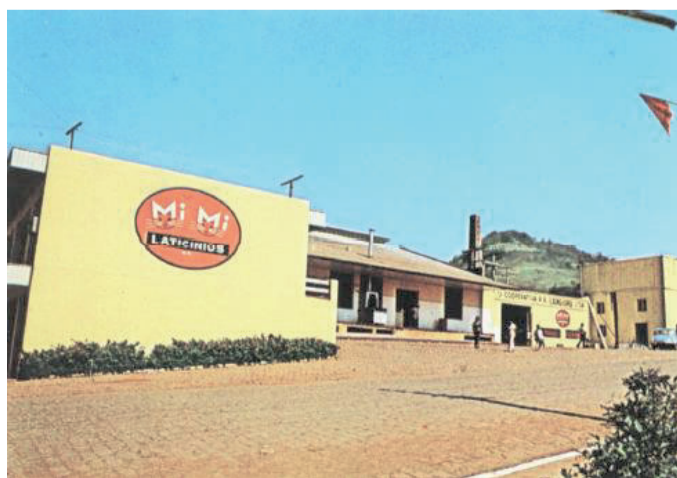
Primeira sede da Comatra funcionou dentro do prédio da antiga Laticínios da Languiru