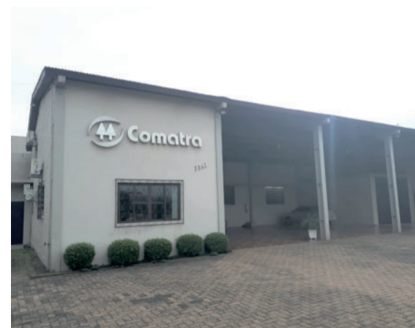
Sede atual da Comatra foi adquirida em 2006 e utilização iniciou em 2007