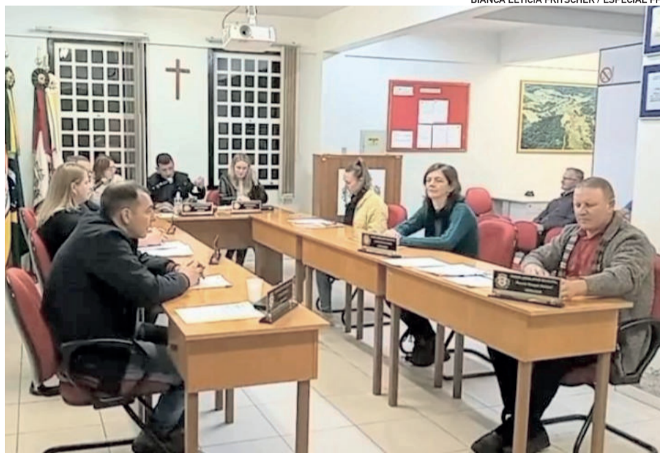
Sessão foi a primeira do mês de junho