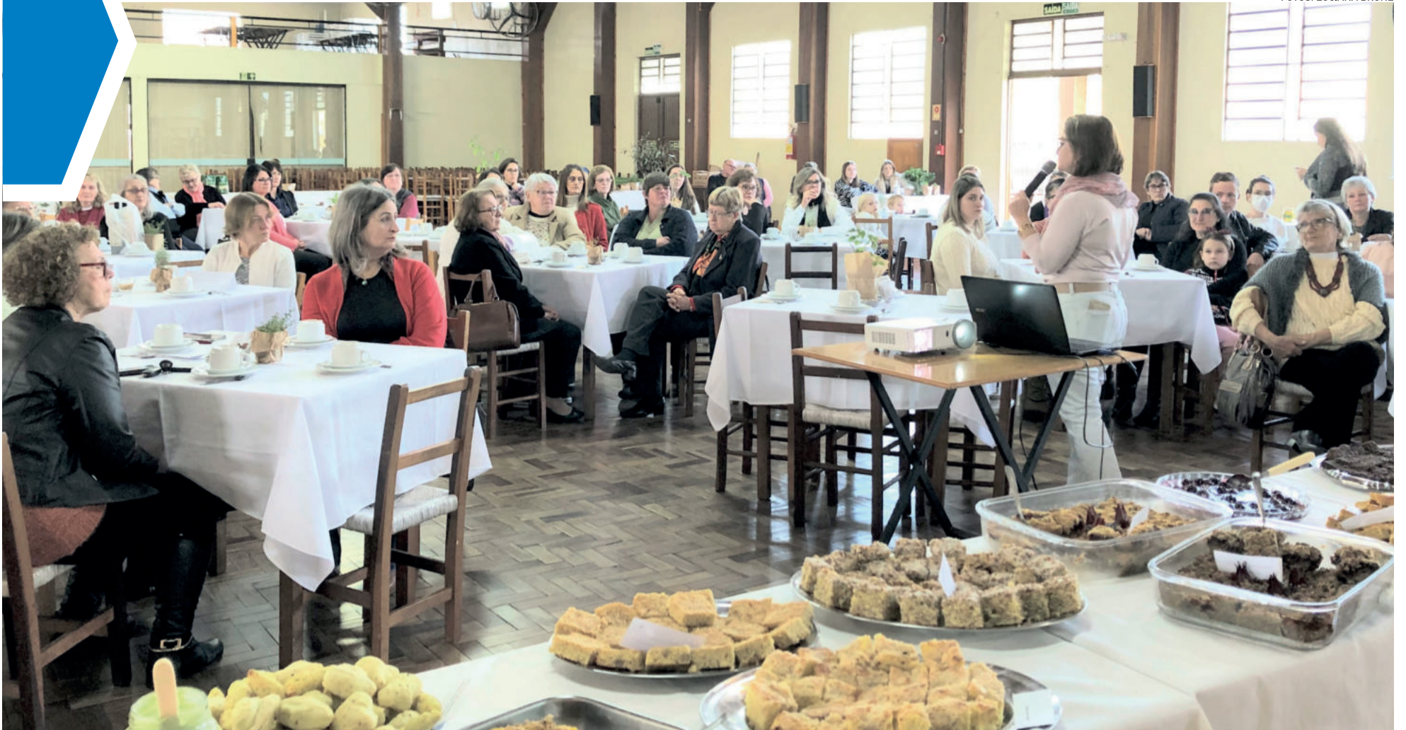
Café foi servido na Comunidade Redentor