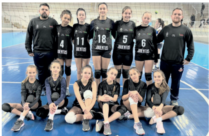
Mirim vai jogar a final da Série Ouro