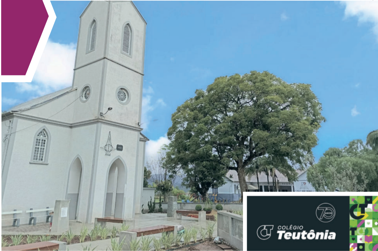
Comunidade de Linha Clara celebra os 150 anos de colonização, com inauguração de praça revitalizada