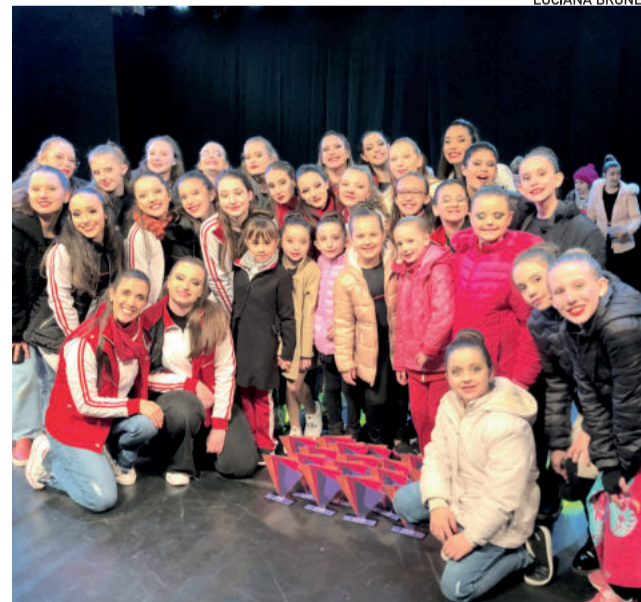
Troféus recebidos na noite de sexta pelo grupo Movimentu's