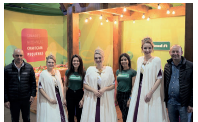
Realizadores no estande da Unimed VTRP

A feira foi um marco de retomada para Teutônia e também para a Unimed VTRP. Foi na Festa de Maio que voltamos a ter participação presencial em eventos regionais. A aproximação com a comunidade foi recompensadora. Tivemos a oportunidade de apresentar aos participantes nossos novos serviços, como o UnimedCard VTRP, e reforçar nosso propósito de cuidar com a presença do time do SOS Unimed, no ambulatório da feira. Grandes mudanças começam pequenas. Esperamos que a comunidade possa, a partir dessa experiência, se inspirar para novas mudanças. Em breve, nos vemos com novas ações na Teutofrangofest”.