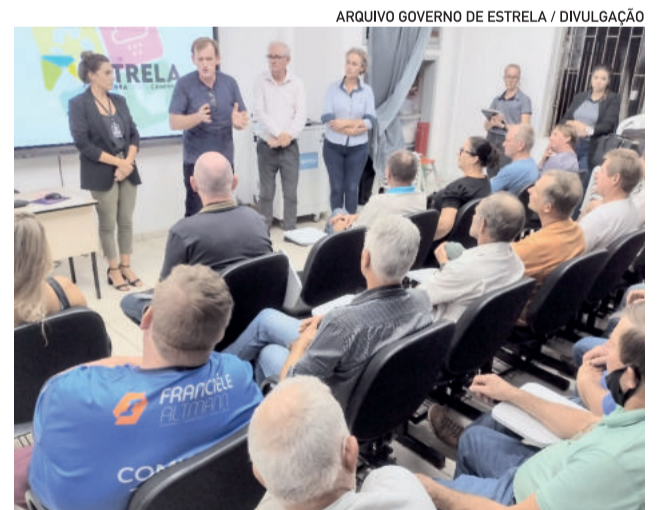
Uma das etapas da realização do Plano Municipal de Saneamento foi a apresentação do estudo para os presidentes das associações de água de Estrela, em evento realizado em março

A realização do Plano é da empresa Lógica Consultoria, contratada pelo Governo de Estrela. O estudo