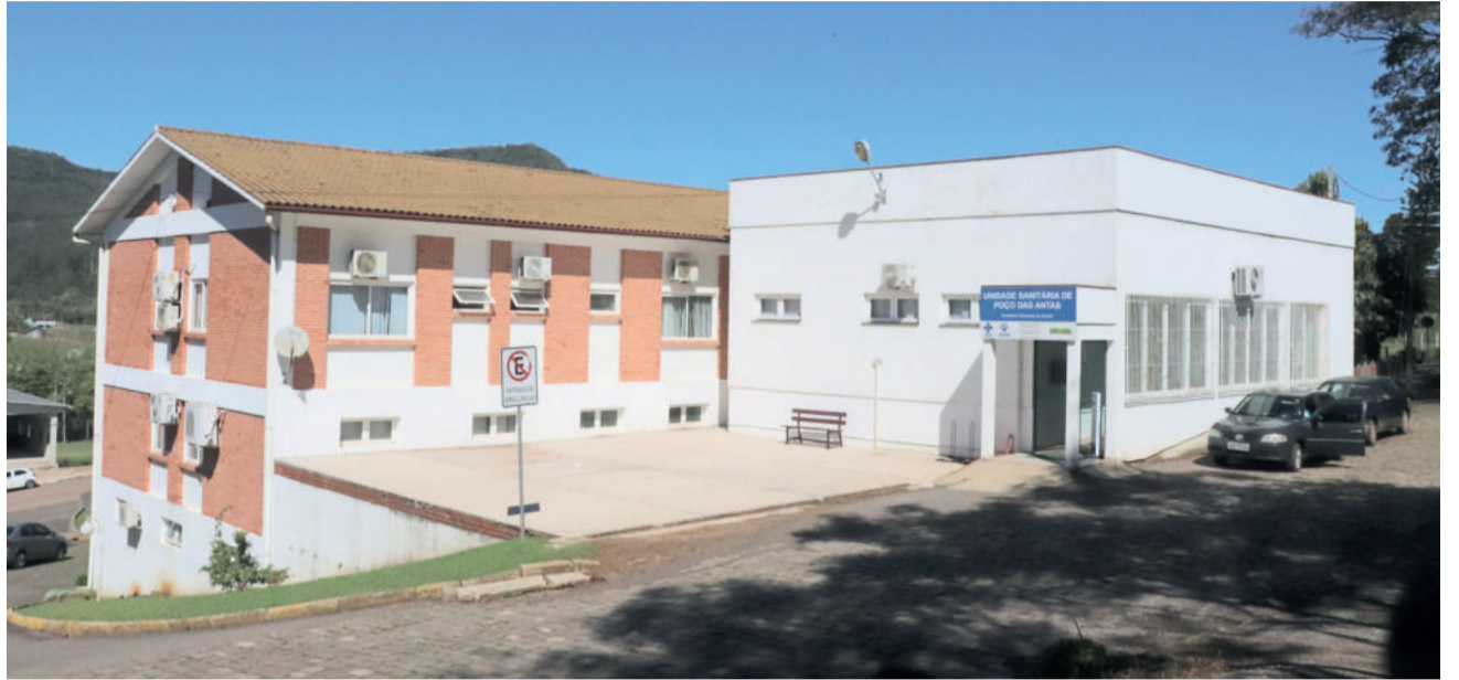
Consultas são realizadas na UBS

Para esses tipos de consultas, pacientes podem fazer o agendamento de forma presencial, junto à UBS, ou entrar em contato pelos números: (51) 99917-6911 - WhatsApp ou (51) 3773-1231.