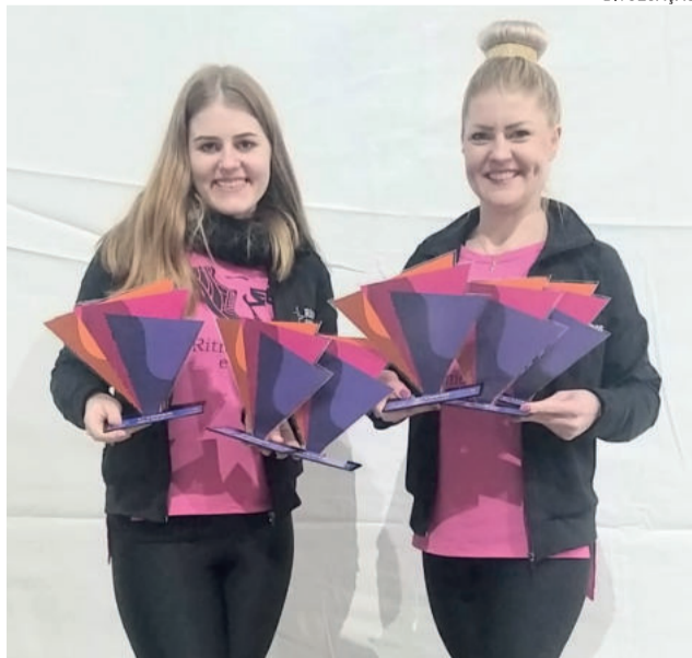
Escola Ritmos e Fitness com os troféus conquistados