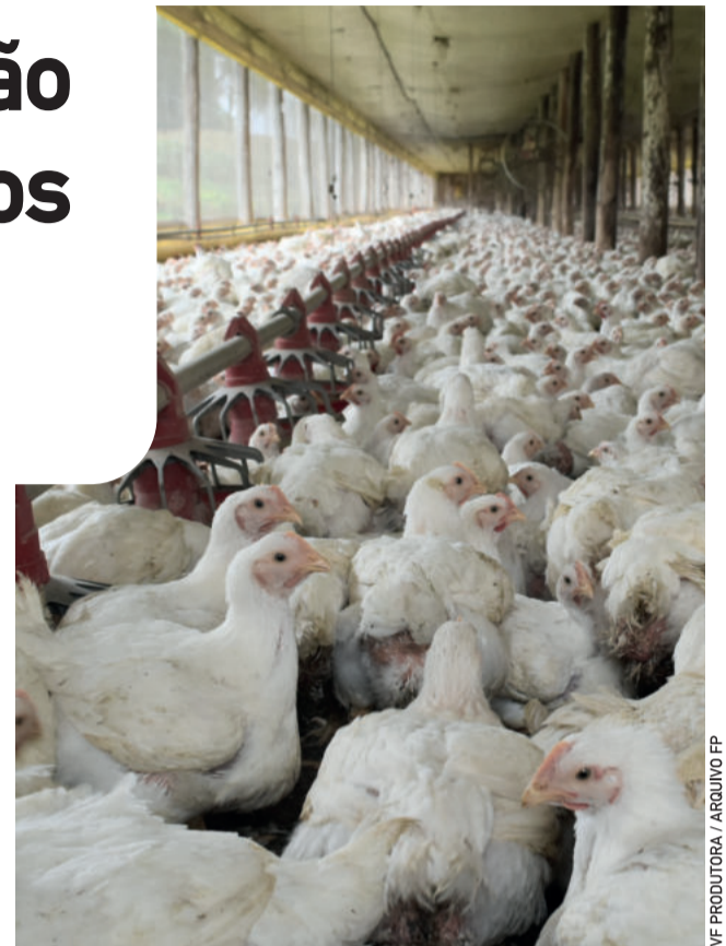
Secretaria da Fazenda (Sefaz) acatou pedido dos municípios nas integrações de Aves e Suínos