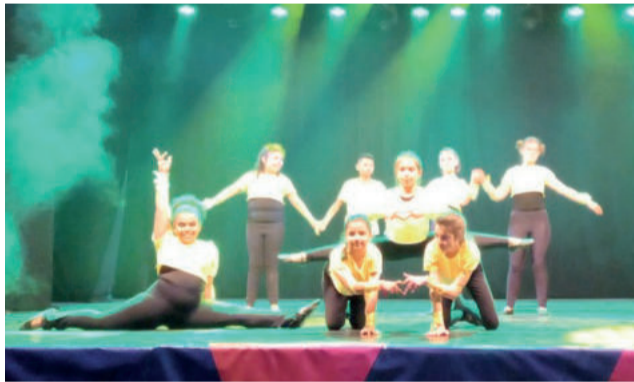
Dança e Ritmos também foi premiada em várias apresentações