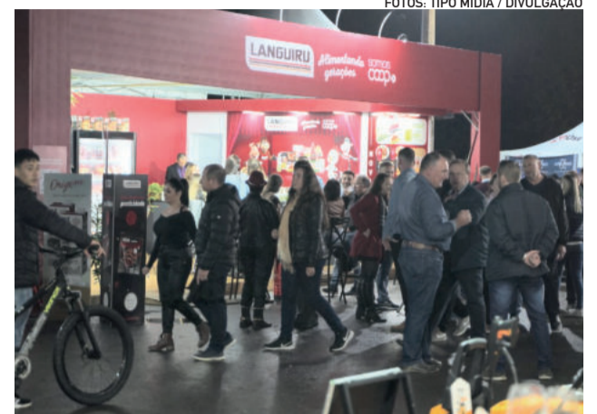
Um dos estandes da Cooperativa Languiru