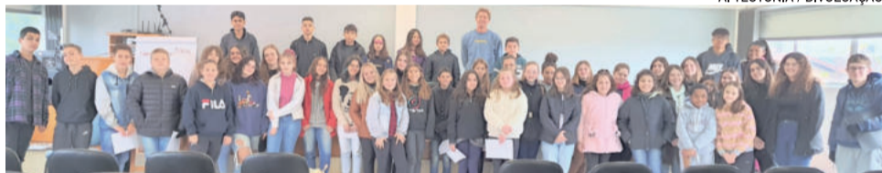
Tovens aprenderão técnicas teóricas e práticas