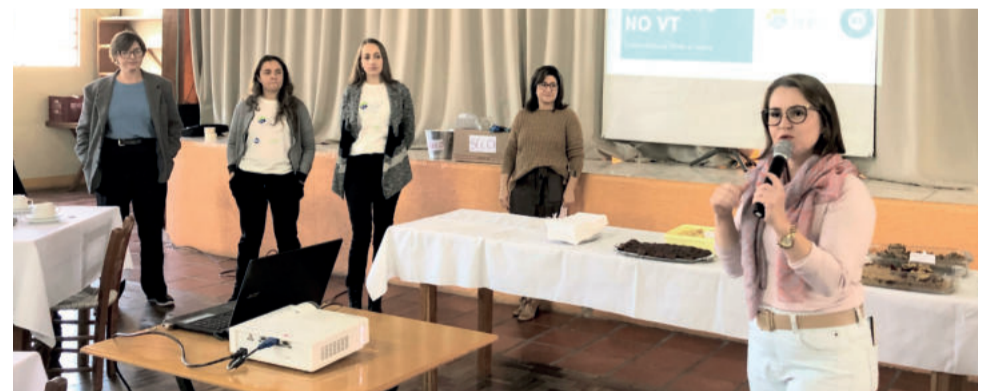
Palestras sobre lixo e reciclagem fizeram parte da programação

O evento teve palestra sobre Lixo Zero e Reciclagem, disponibilização de mudas de tempero, chás e folhas, venda de produtos orgânicos da Ecovale, pomadas e extratos, além da troca de sementes.