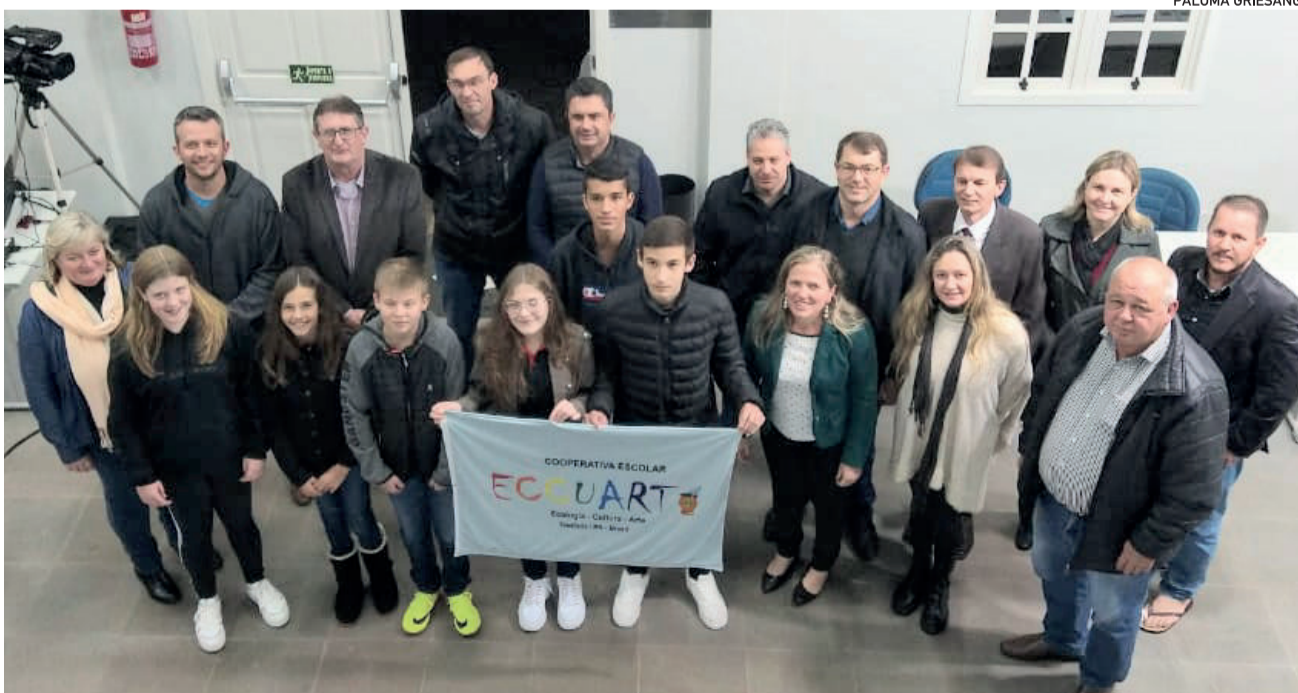
Representantes da Eccuart convidaram vereadores para comemoração dos 25 anos da cooperativa escolar

A próxima sessão da Câmara de Teutônia ocorre na terça-feira (14/6), a partir das 18h30, na sede do Legislativo, no Bairro Centro Administrativo.