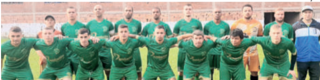
Rudibar joga pelo empate