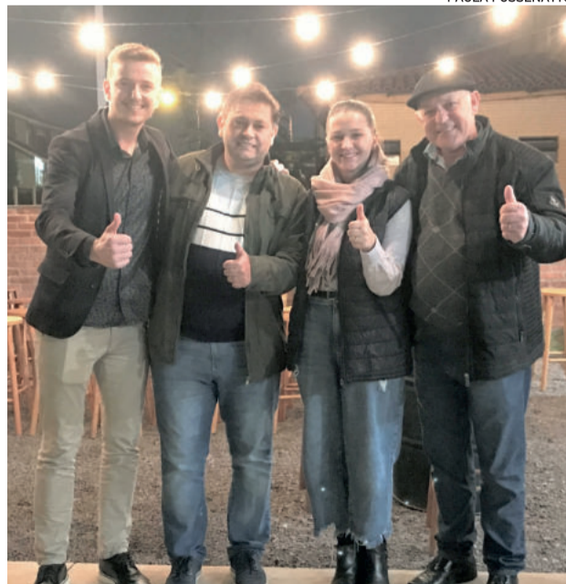
Realizadores estimam sucesso e projeção de Teutônia como cidade turística de eventos