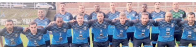
Grêmio precisa vencer no tempo normal para forçar pênaltis