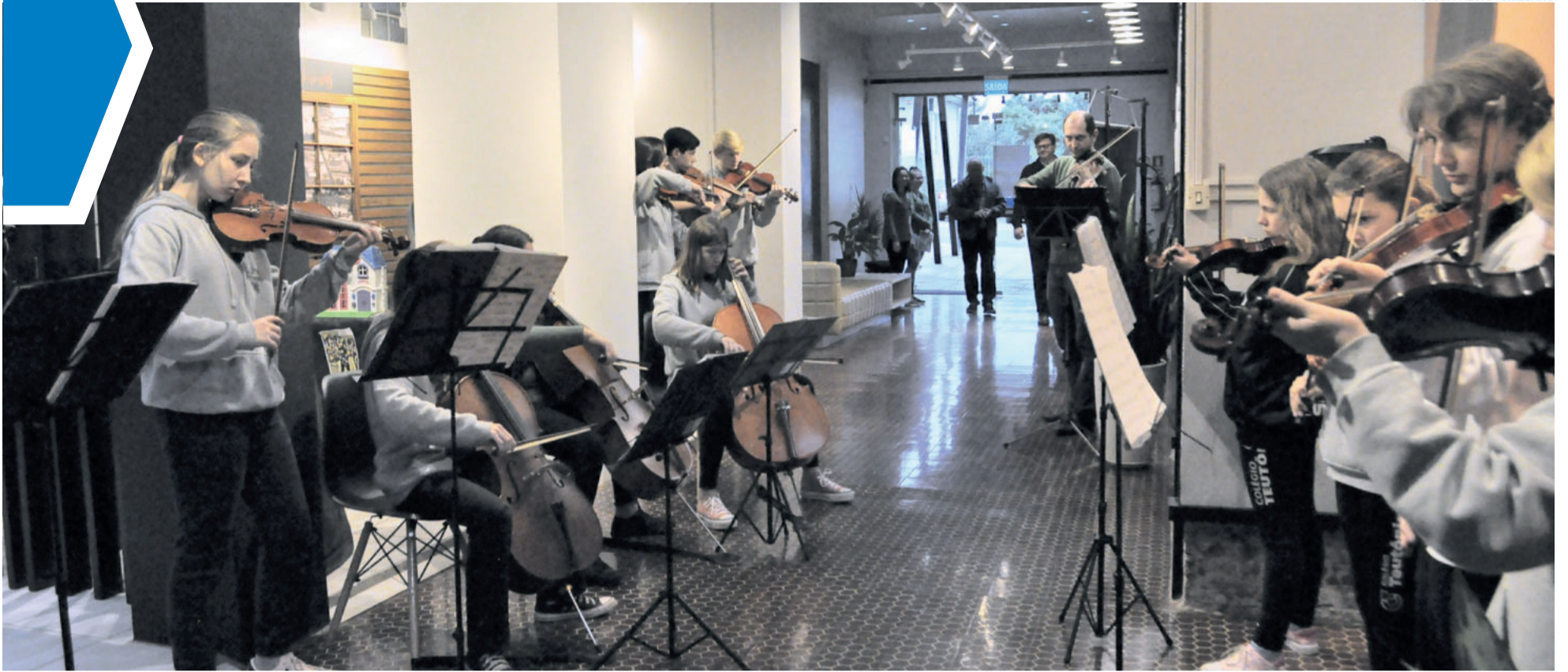
Convidados foram recepcionados pelo Conjunto Instrumental do CT