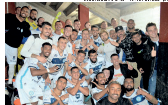
Elenco comemorou classificação antecipada