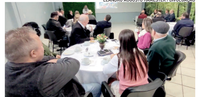
Reunião ocorreu no Auditório 01 da CIC Teutônia