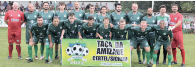
Juventude tenta vaga na final nas duas categorias