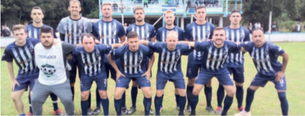
Poço das Antas joga pelo empate nos Titulares