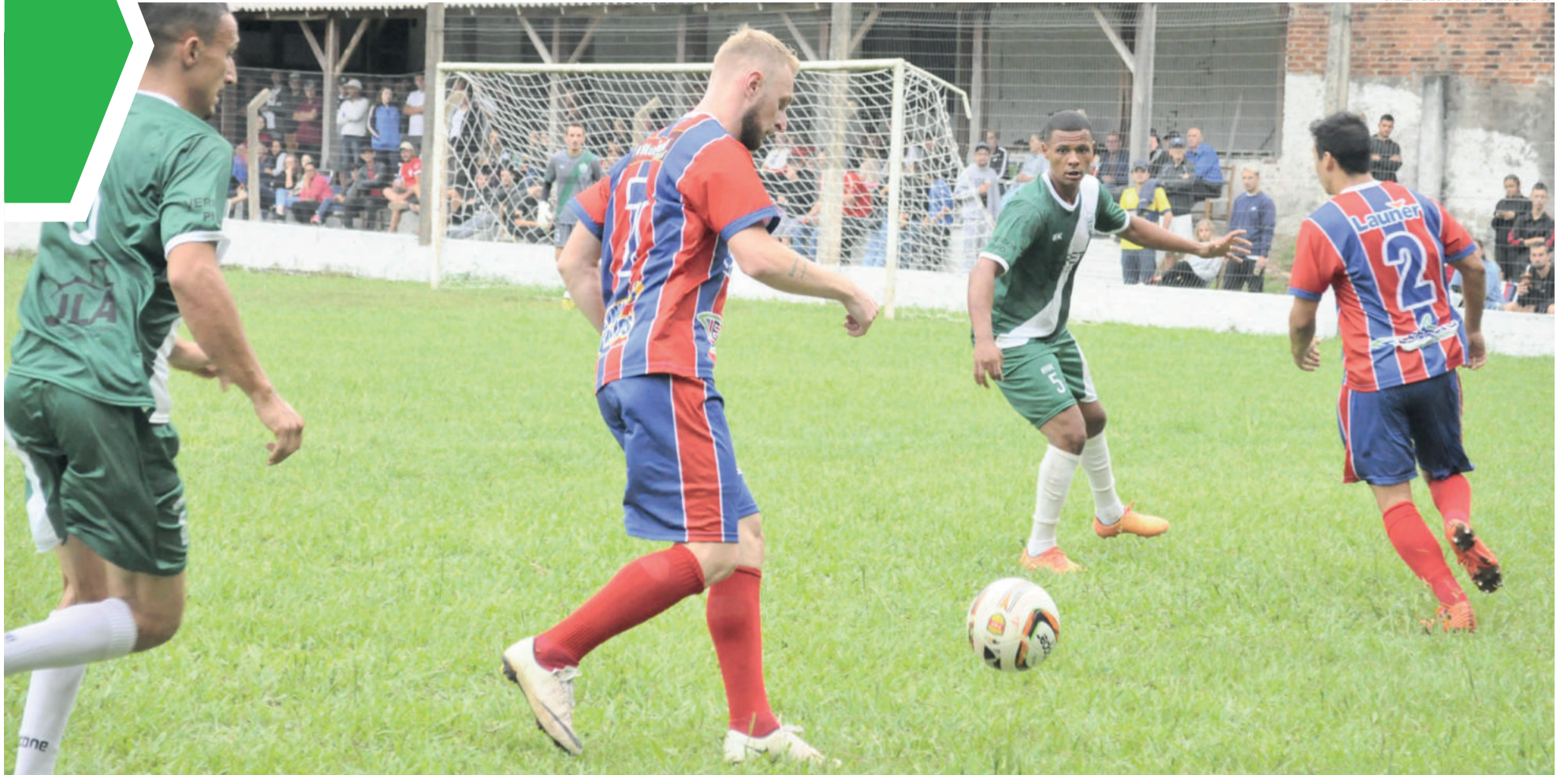
Aimoré (vermelho e azul) segue invicto na competição