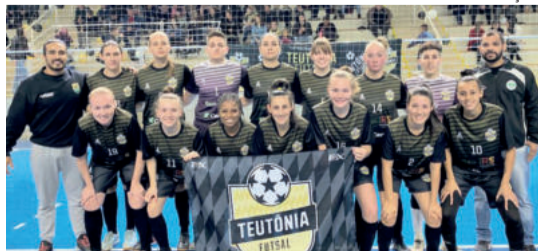
A fase semifinal será disputada em jogos de ida e volta