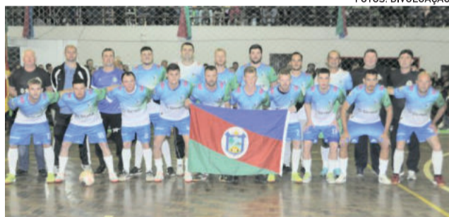
Poço das Antas (campeão 2022)

Antes do jogo principal, a organização montou um jogo festivo entre a Seleção da Transcitrus e a Associação Lajeado de Futsal (Alaf). A Seleção da Transcitrus será composta por atletas dos seis municípios que participaram da 3ª Copa Transcitrus de Futsal.