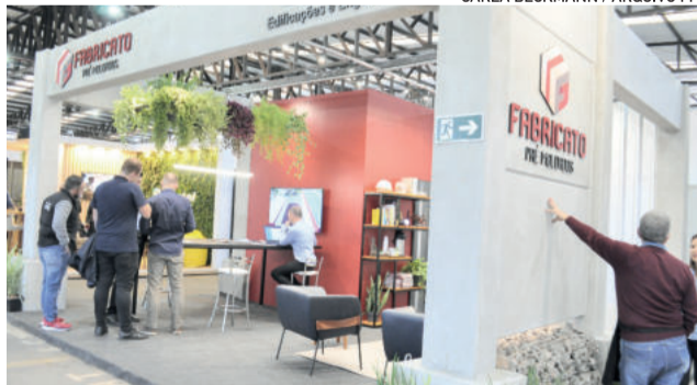
Quase todos expositores da Festa de Maio fecharam negócios e pretendem voltar em 2024

metros quadrados, cujos estandes foram disponibilizados de forma gratuita e ocupados por 21 expositores. Além disso, o Pavilhão das Agroindústrias contou com 600 metros quadrados, espaços igualmente disponibilizados gratuitamente e utilizados por 28 expositores.