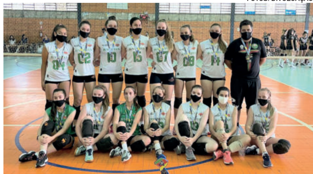
Infantil ficou em terceiro lugar da Série Prata em 2021

Na edição passada, feita em formato reduzido devido à pandemia, a Juventus conquistou títulos na Série Prata. O Infante ficou campeão (5º colocado geral) e o Infantil ficou com o terceiro lugar (6º colocado geral).