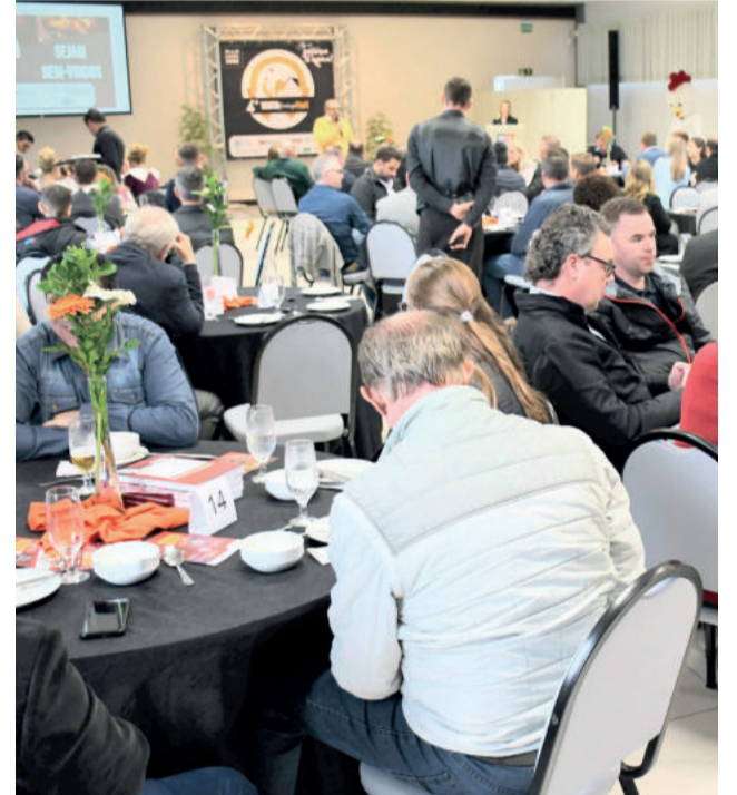
Evento de lançamento reuniu convidados na Festa de Maio