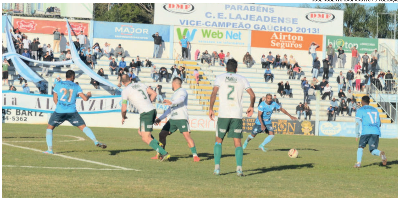
Jogo foi disputado no domingo (12/6), na Arena Alviazul, em Lajeado