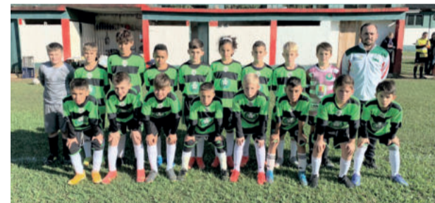
Sub-11 empatou em 1 a 1