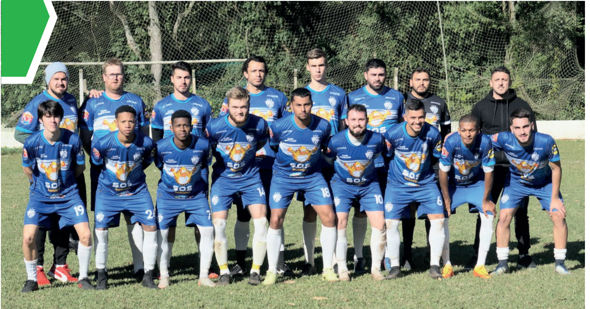
Geraldense venceu o Aimoré por 2 a 1