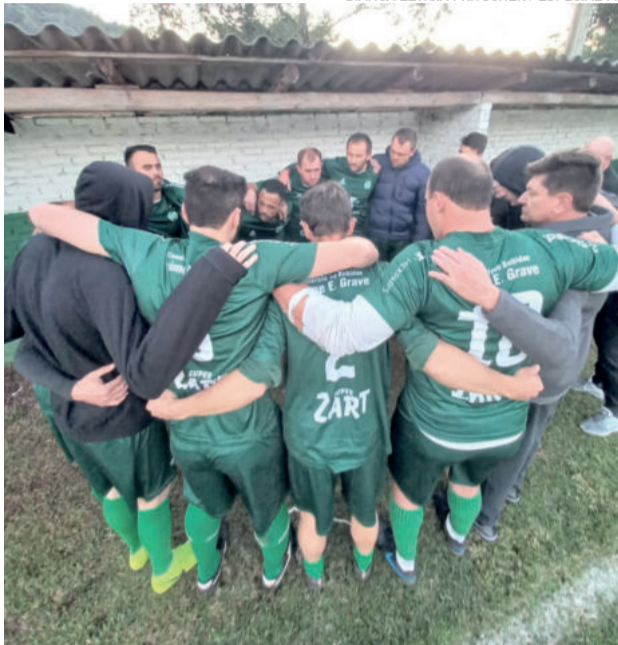
Juventude venceu no tempo normal e nos pênaltis