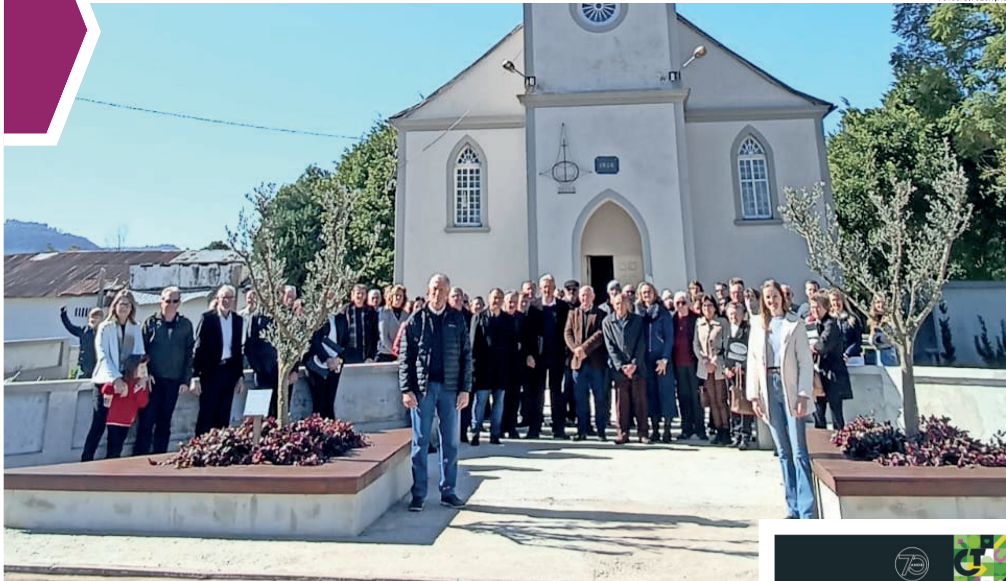
Comunidade se reuniu diante da igreja para inaugurar plantio de oliveiras