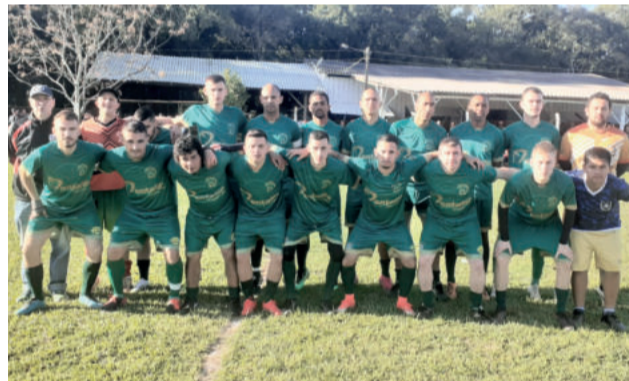
Rudibar enfrenta o Bragantino na final