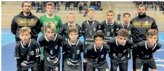
Categoria jogou dois jogos em Candelária