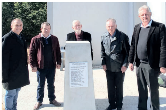
Marco dos 150 anos (1870 – 2020) foi descerrado após o culto

Ao meio dia foi servido almoço tradicional e na sequência foi realizado o leilão das ofertas de