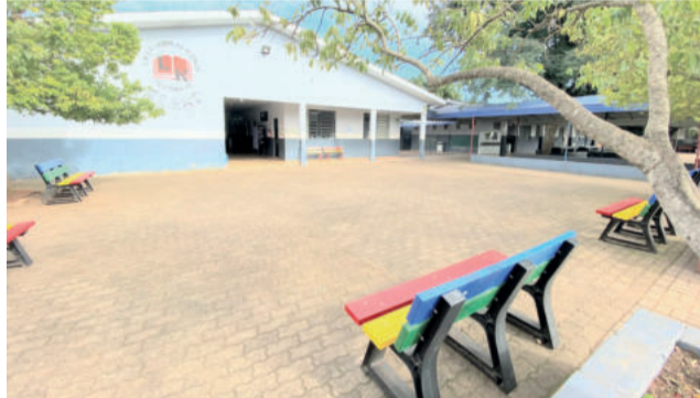
Projeto nasceu na EMEF Leopoldo Klepker, no Bairro Alesgut

desafios grandiosos para manter o bom andamento das aulas em termos de disciplina e também em termos de aprendizagem”, explica.