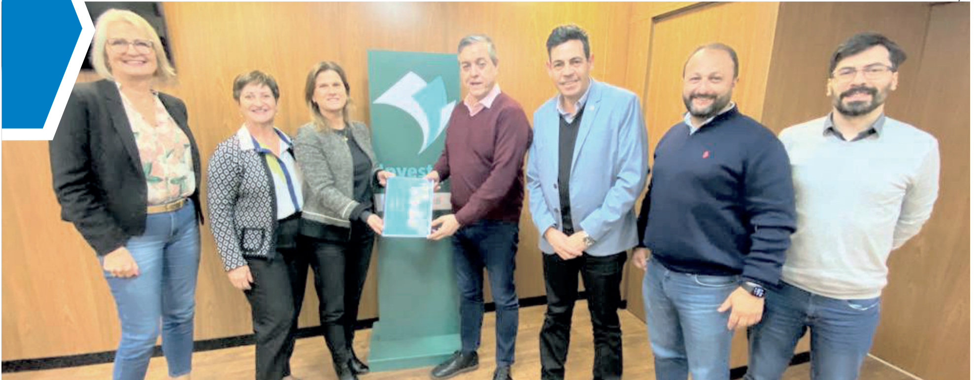
Lideranças da região protocolaram o pedido na capital e receberam o retorno positivo nesta semana

VALE DO TAQUARI ▶ ARRANJO PRODUTIVO LOCAL