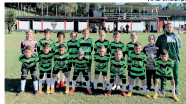
Sub-10 venceu por 2 a 0