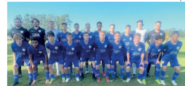
Sub-15 balançou as redes seis vezes