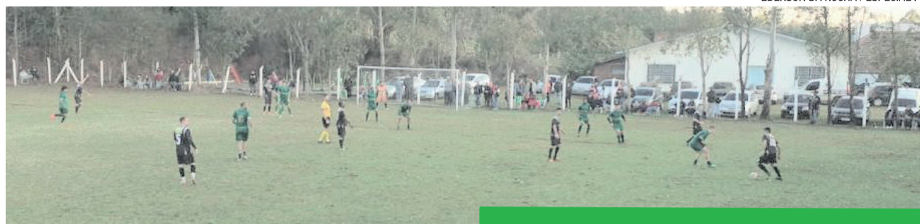
Bragantino abriu vantagem, mas Rudibar empatou

O resultado favorece o Rudibar no jogo da volta, que tem a vantagem de jogar pelo empate. O Bragantino tenta o tricampeonato. O primeiro título foi em 1994 e o segundo, em 2006. Já o Rudibar, atual campeão, busca o pentacampeonato consecutivo (2016 / 2017 / 2018 / 2019).