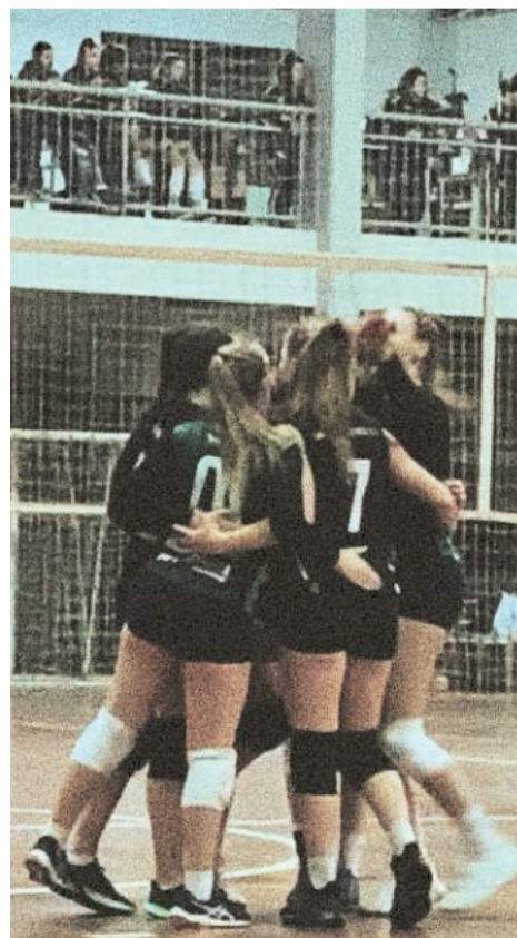
Infanto ficou em 4º lugar da Prata