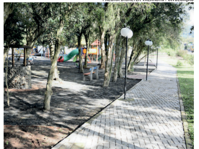
Praça recebeu diversas melhorias