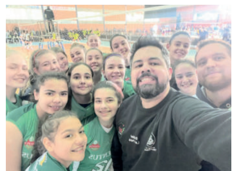
Infantil ficou em 5º lugar da Bronze