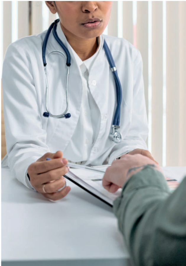
Foco do Município é o atendimento na Atenção Básica, que recebe, diariamente, muitas críticas

Ainda assim, admite que é preciso ampliar equipes e médicos. Porém, há um limitador de infraestrutura, sem espaço para ampliações. “No Centro Avançado, que é enorme, não consigo mais fazer uma escala de aumentar a equipe porque não tenho mais salas para atendimento”, justifica.