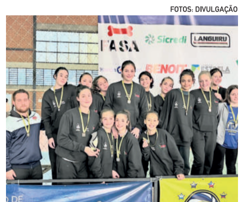
Mirim ficou em 3º lugar da Bronze