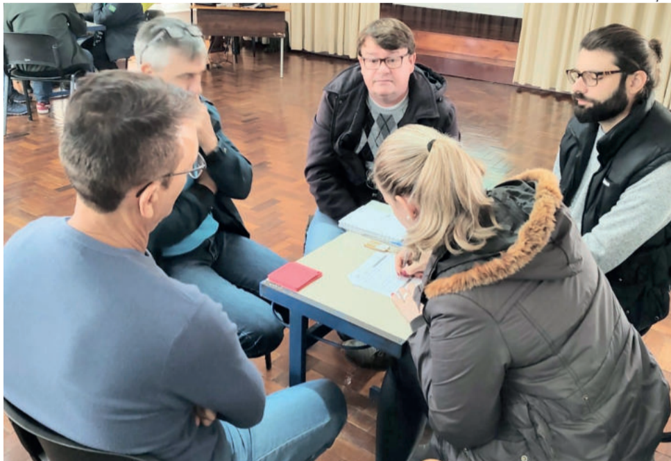
Oficinas contaram com a participação de empreendedoras da área