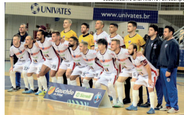
Elenco mantém os 100% de aproveitamento em Lajeado