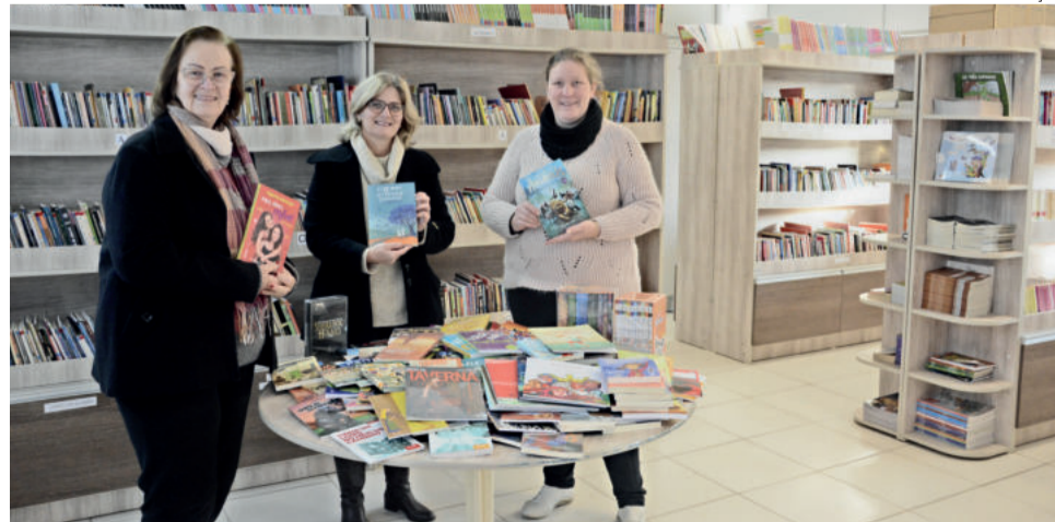
Exemplares já foram entregues à EMEF Vila Schmidt e podem ser retirados pelos estudantes