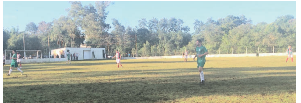
Clássico teutoniense teve vitória do Esperança

No outro jogo, Canabarense e Esperança se enfrentaram. E o time de Languiru levou a melhor, e de goleada: 5 x 1 para o Esperança.