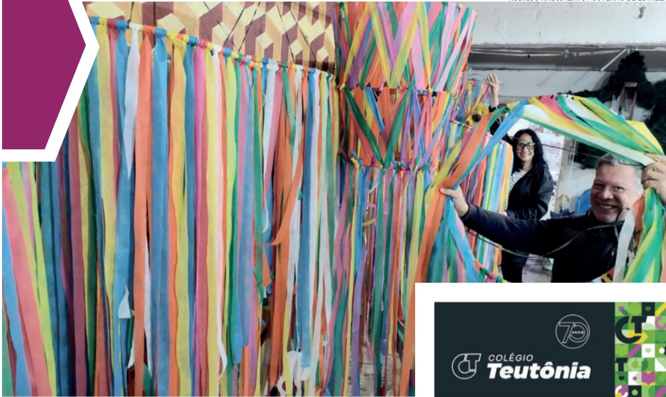
Decoração foi inspirada nas comemorações juninas do Nordeste do Brasil