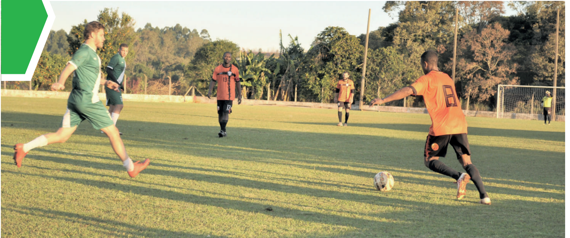
Alto da Bronze (verde) venceu o Atlético Estrelense (laranja) no confronto de domingo (19/6)