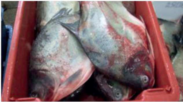
Peixe abatido por asfixia

Ao comprar um peixe fresco na feira o consumidor deve observar a conservação do peixe, este deve estar mantido em temperatura entre 0,5 e 2°C negativos; para isso o produto pode estar em um freezer, em um balcão refrigerado ou exposto no gelo numa proporção de 2/1 de peixe/gelo.