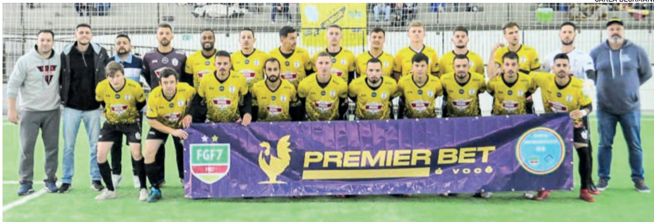
Equipe teutoniense foi para Gramado com 20 jogadores, mais massagista, comissão técnica e torcedores