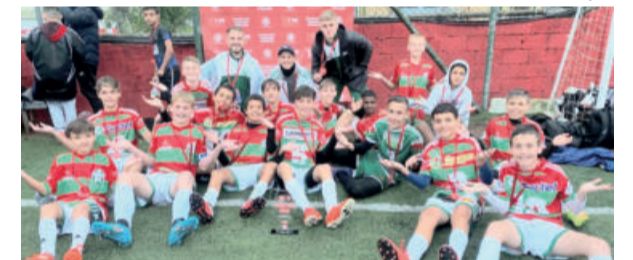
Elenco disputou cinco jogos em Alvorada