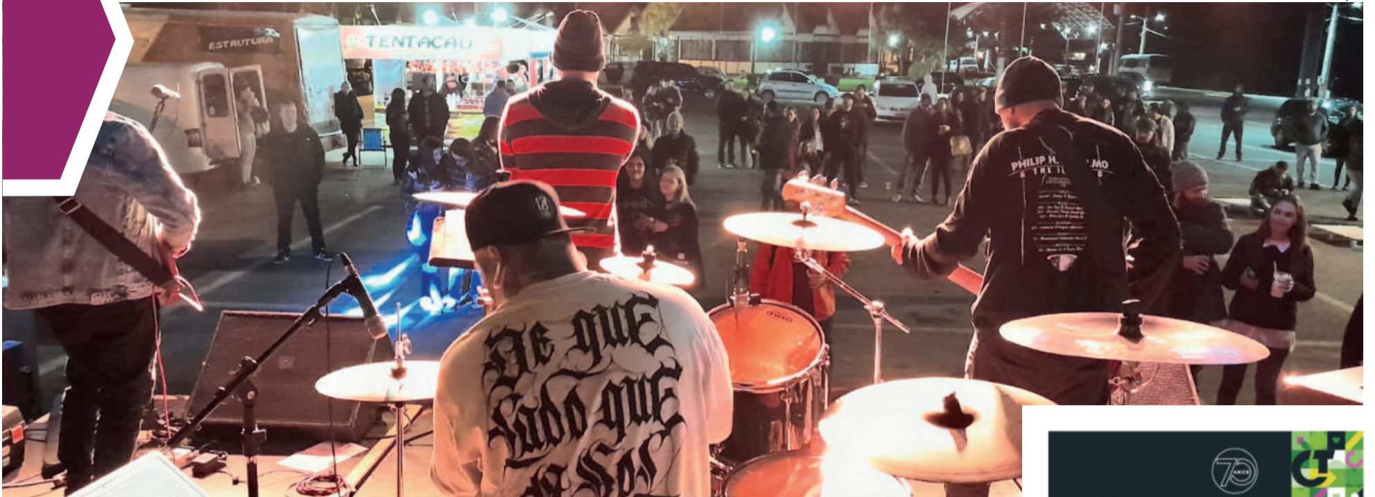
Bandas se apresentaram das 15h às 23h