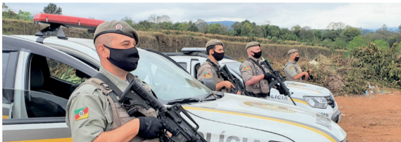
Brigada Militar, juntamente da Polícia Civil, trabalha no combate ao crime