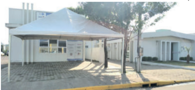
Farmácia Solidária funcionará junto ao Posto de Saúde do Centro