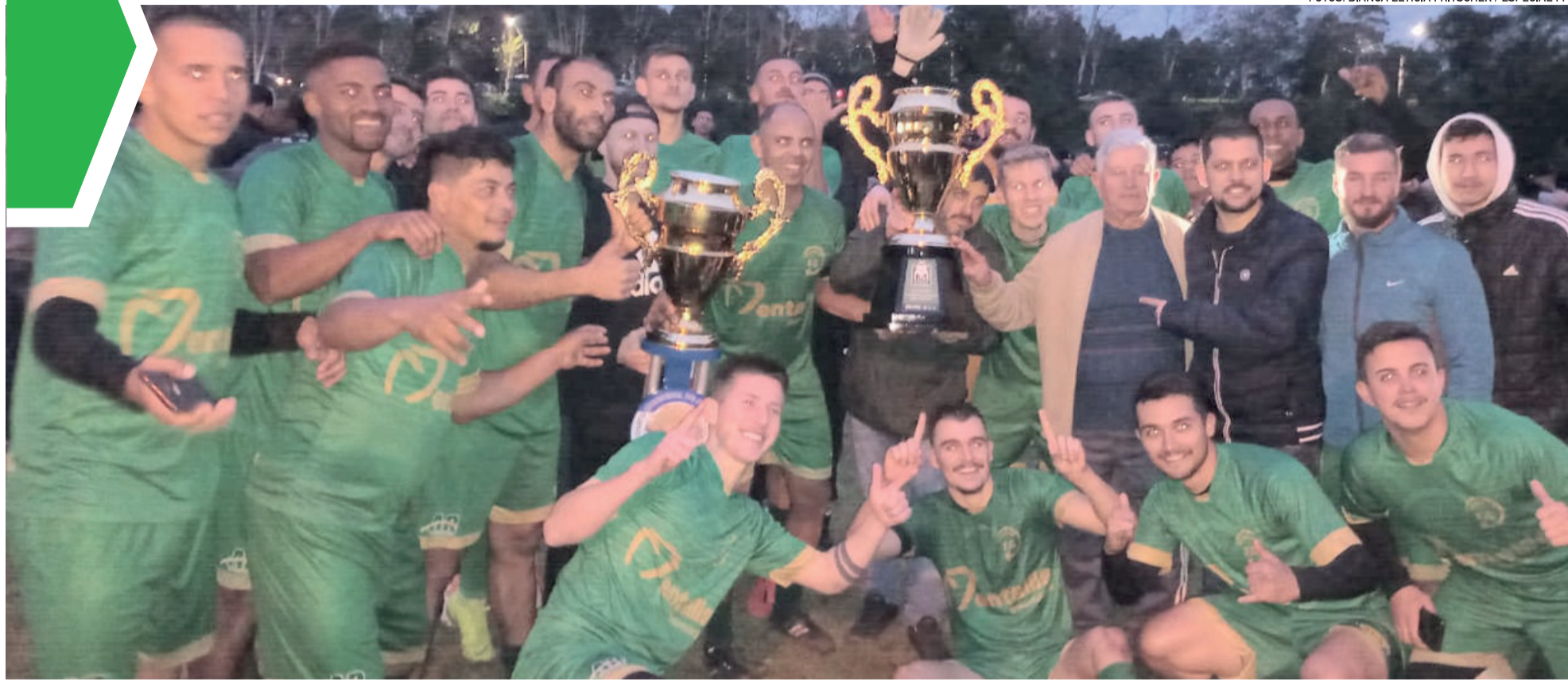
Rudibar ficou com o título após empatar com o Bragantino em 1 a 1