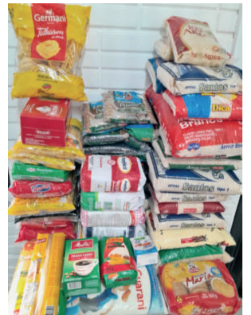
Assistência Social distribuirá os donativos recebidos

Conforme Dojão, se não fosse a solidariedade, o evento seria apenas mais um nome entre a cena artística. “Muito obrigado mesmo. Só unindo aquilo que a gente gosta, que é a música, e aquilo que a gente se propõe a fazer, que é a solidariedade, que dá certo. Música e solidariedade, esse é o foco”, afirma.