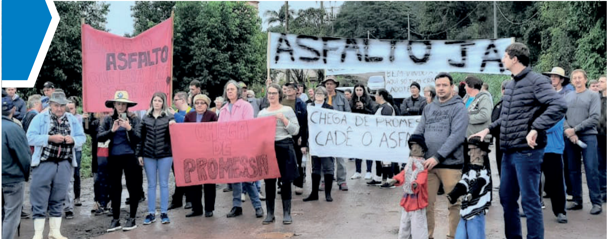
Comunidade espera pela pavimentação asfáltica há mais de 30 anos