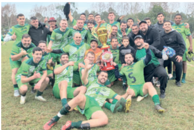
Aspirantes do Rudibar também comemorou o título na categoria