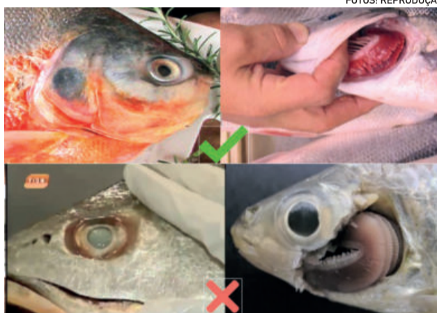
Acima um peixe fresco e abaixo um peixe deteriorado