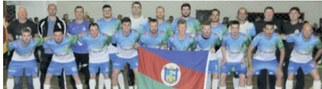
Poço das Antas (campeão 2022) /