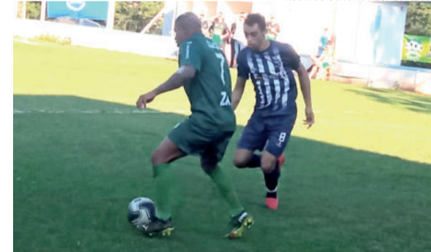
Jogo de ida foi no dia 8 de maio