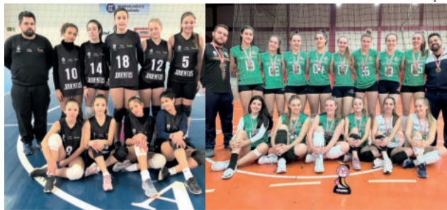
Mirim joga em casa no domingo / Infanto joga hoje em Lajeado