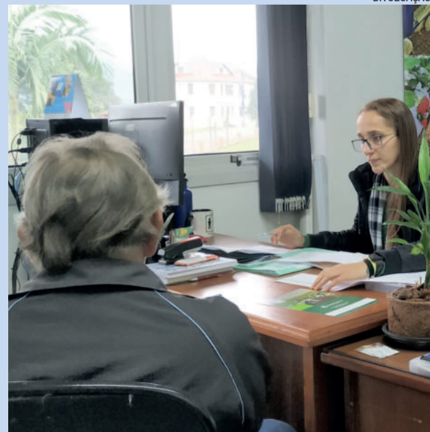
Pedidos e declaração devem ser feitos na Secretaria de Agricultura