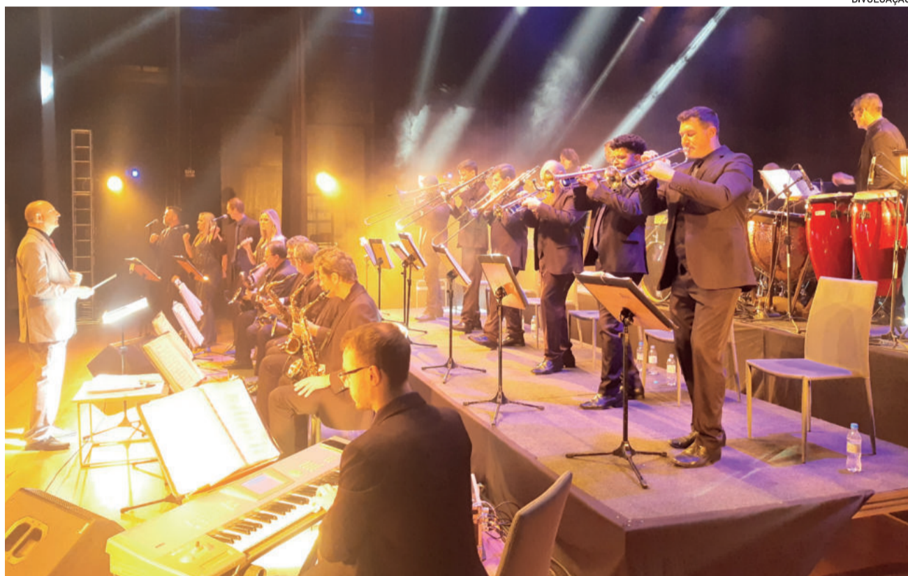
Orquestra de Teutônia é uma das mais renomadas do estado