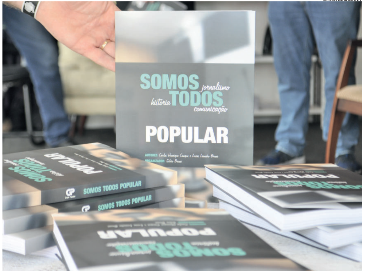
Livro “Somos Todos Popular” foi uma das publicações citadas