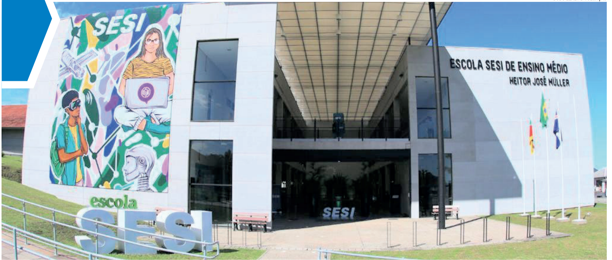
Escola em Montenegro/RS. A estrutura de Lajeado seguirá o mesmo modelo