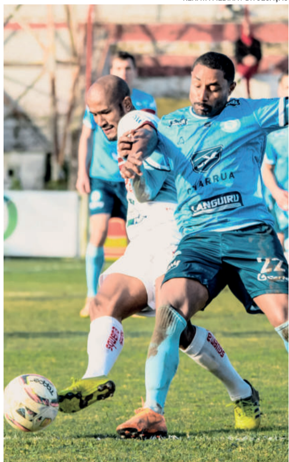
Lajeadense buscou o empate no segundo tempo de jogo