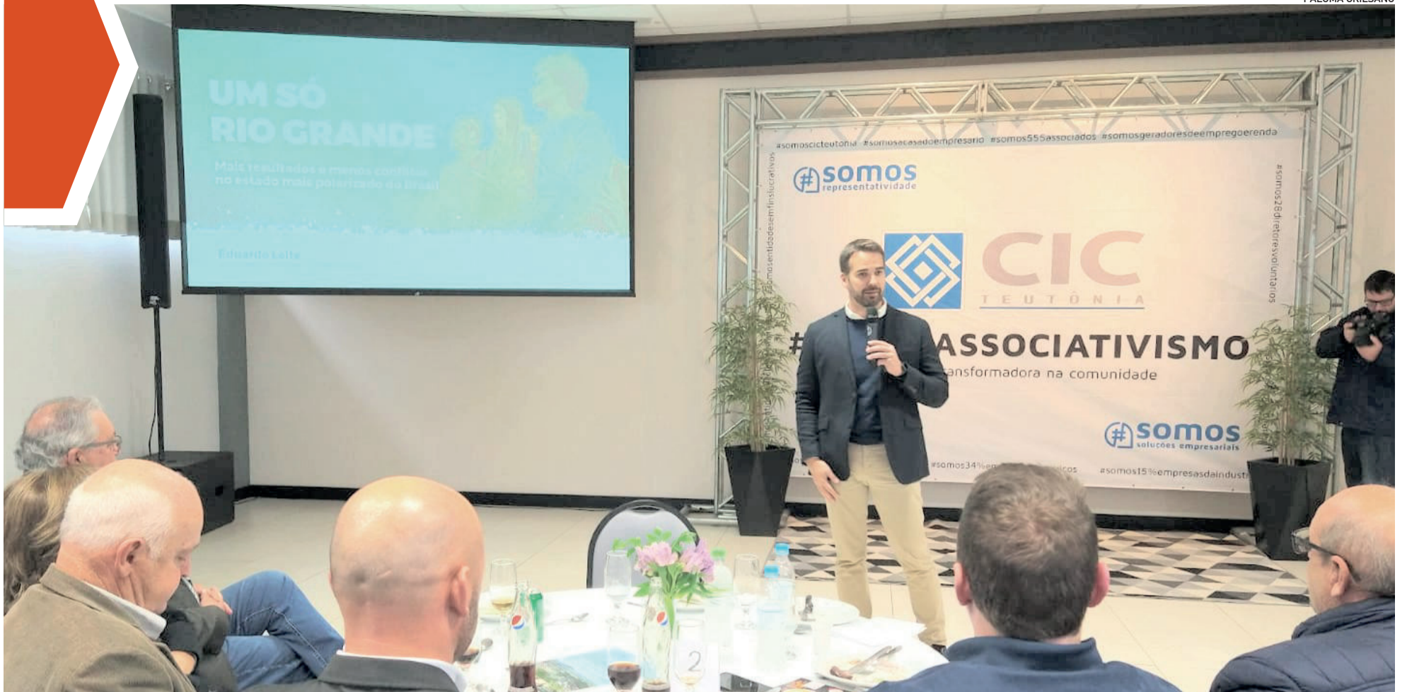
Eduardo Leite avaliou ações do governo e apontou caminhos para enfrentar a polarização