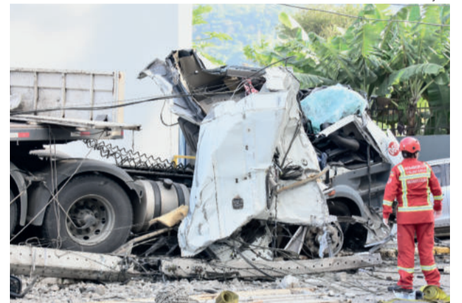
Caminhão ficou destruído com o impacto