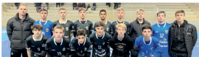
Sub-15 conseguiu o empate

A próxima rodada ainda não tem data definida. As equipes precisam decidir em conjunto.