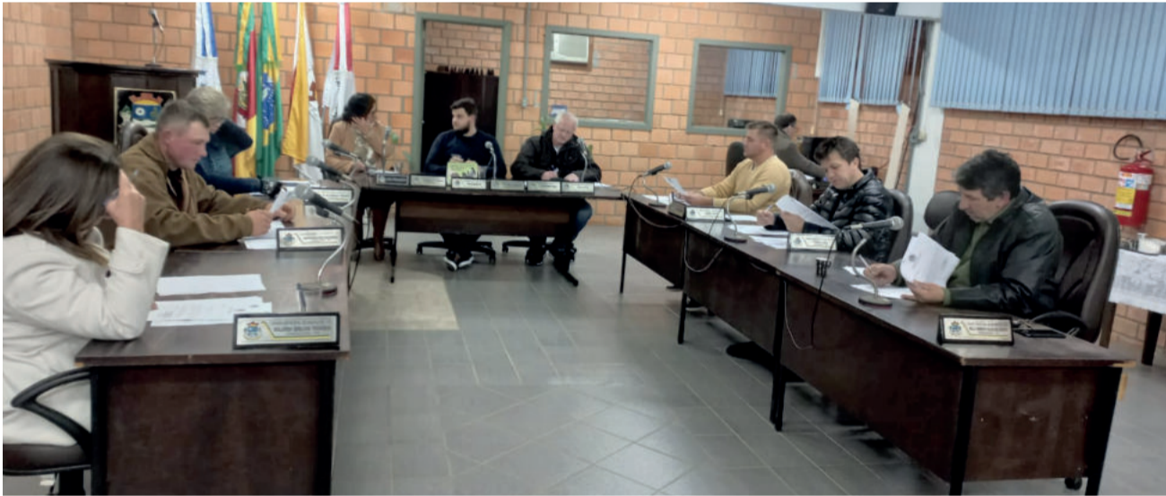
Sessão foi realizada quarta-feira à noite