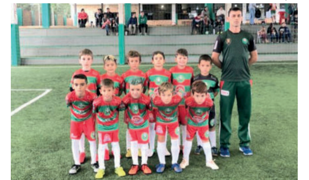
Sub-8 da Juventus