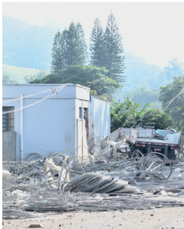
O caminhão estava carregado com bobinas de ferro