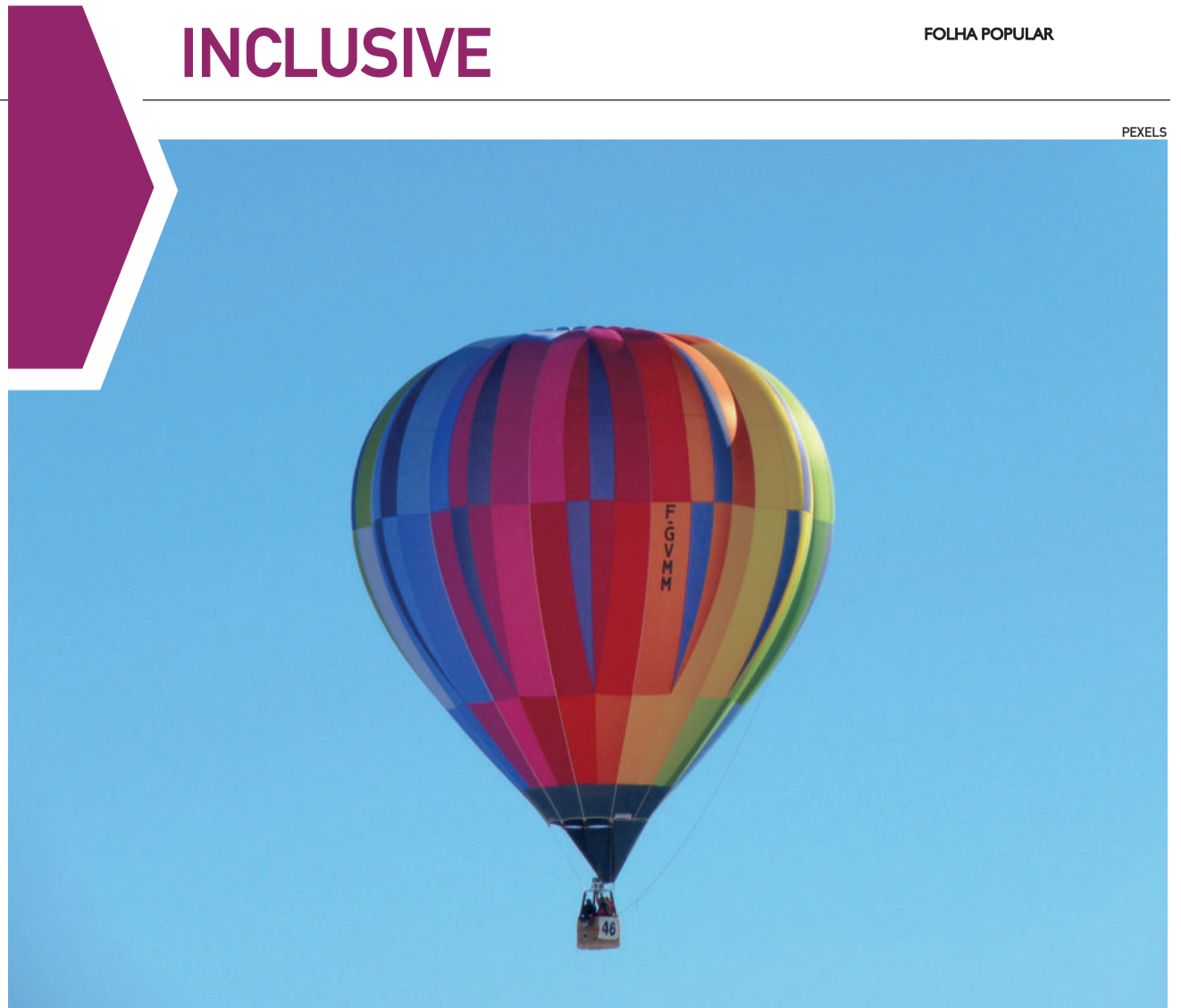
Festival de balonismo chega a Teutônia com diversas atrações

Seu Bartolomeu era o Bom Pastor disfarçado de um humilde velhinho carpinteiro, que salvou a mim e todos que tocaram no gato cinzento.