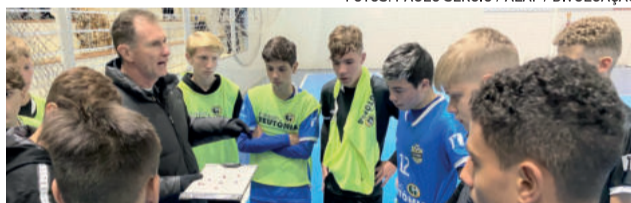
Jogos foram sediados no Gigante Azul