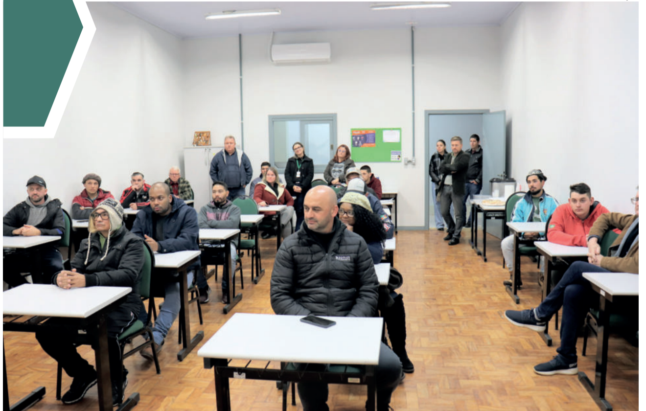
Municípios cadastrados no CadÚnico serão capacitados

A obrigatoriedade participação de todos os gestores promove mais engajamento, eles perceberem seu valor em contribuir de forma mais produtiva e veloz. A sensação de pertencimento traz mais força para a equipe e eleva a produtividade.