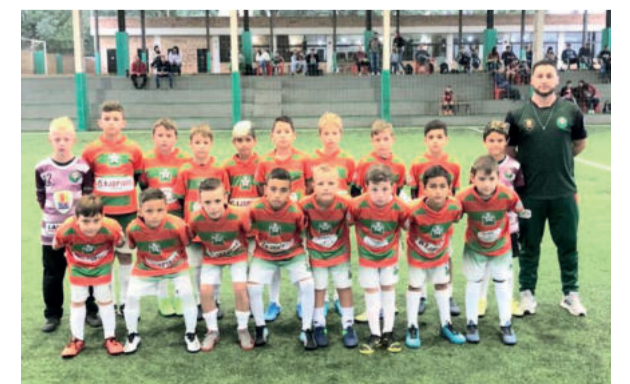
Sub-9 da Juventus