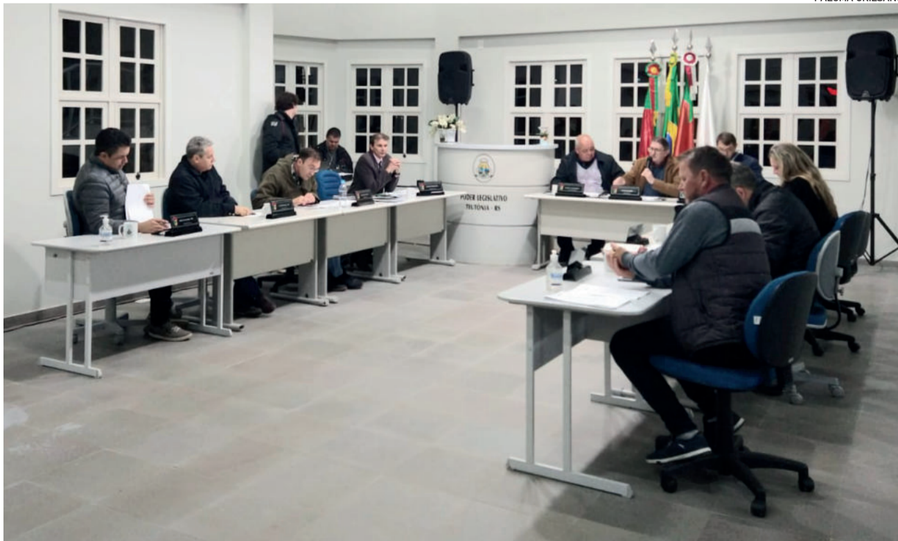
Última sessão de maio ocorreu nesta terça-feira (31/5)