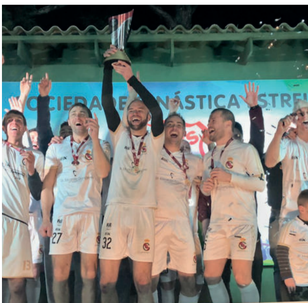
Galácticos ficou campeão na Série Prata