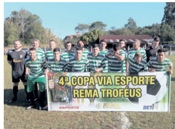
Juventude entra em campo com a vantagem de jogar pelo empate