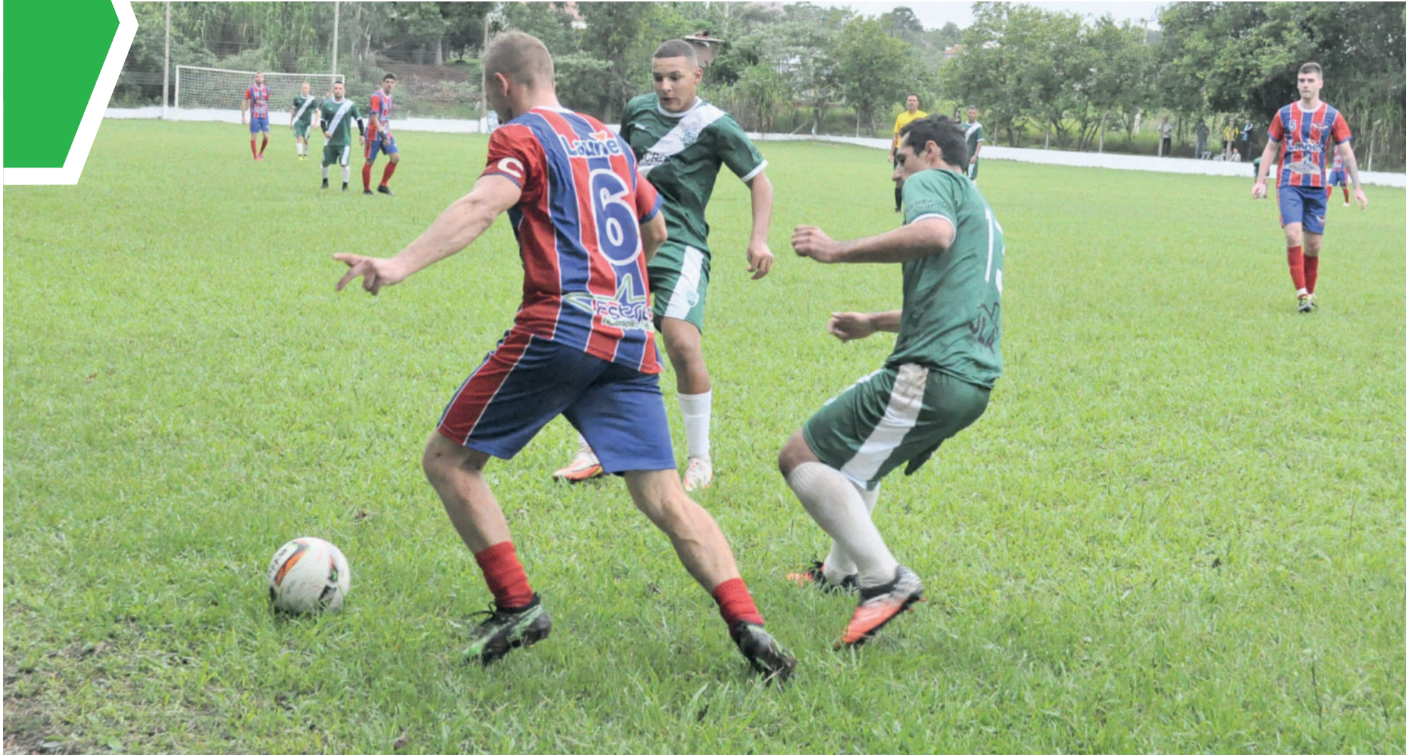
Campeonato iniciou no dia 13 de março