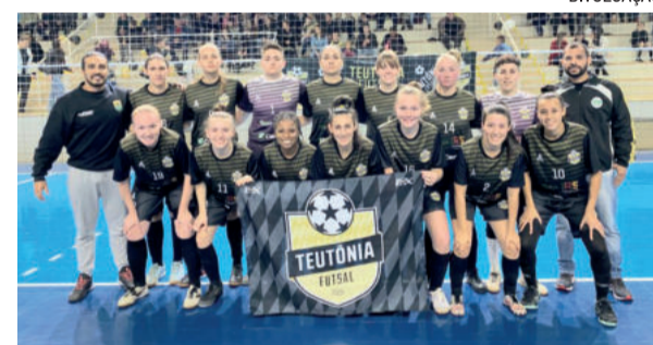
Elenco estreia na competição diante da Malgi Futsal de Pelotas