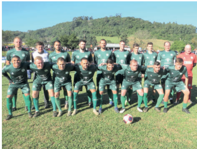
Juventude precisa correr atrás do resultado no tempo normal e nos pênaltis