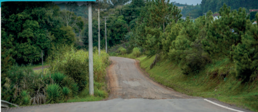
Será pavimentado um quilômetro, continuando o asfalto do acesso a estrada da comunidade de Linha Porongos