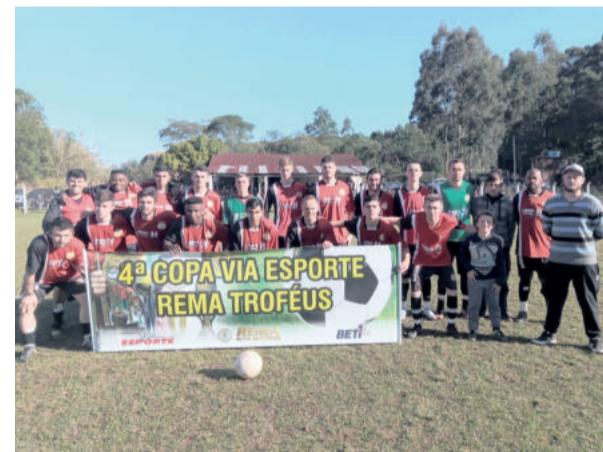
Recreativo precisa vencer no tempo normal para forçar pênaltis.