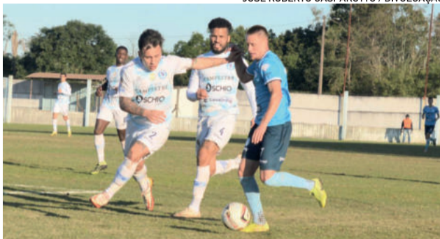
Ariel é uma das peças de 2021 e que faz diferença na temporada 2022