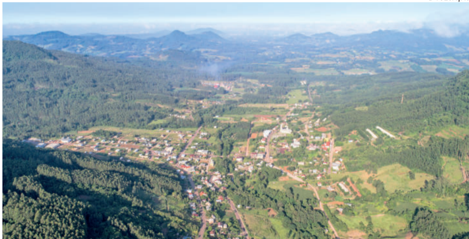
Plano Diretor é fundamental para proporcionar crescimento ordenado