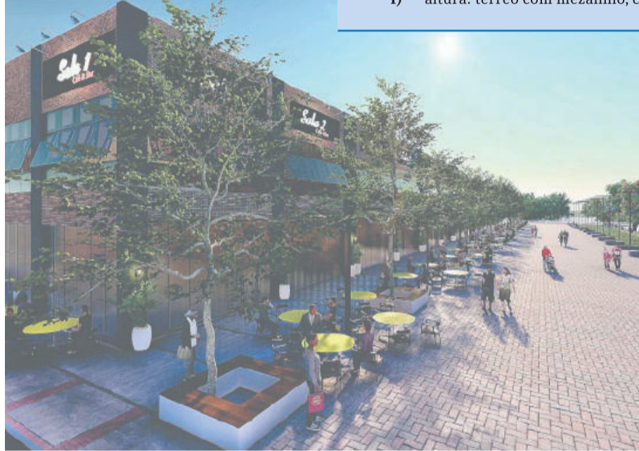
Novo estudo foi realizado pela Univates