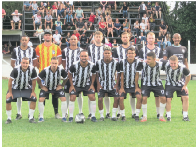
Ecas está com vantagem na decisão