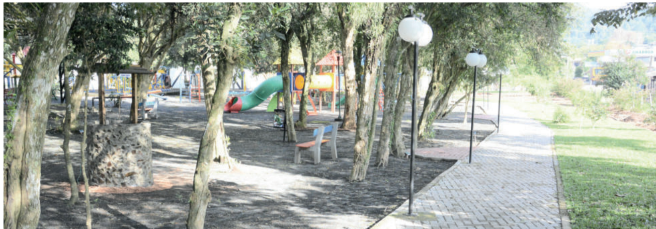
Evento marca a entrega oficial da revitalização da Praça da Amizade à comunidade