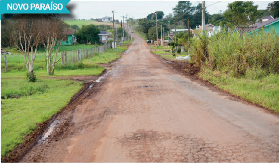
No Distrito de Novo Paraíso, pavimento será removido e novo asfalto será instalado