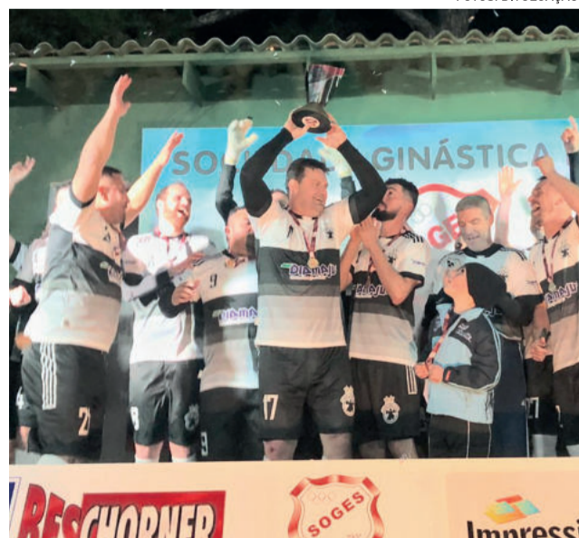
Mancha Negra/Xtotz United ficou com o título na Série Ouro