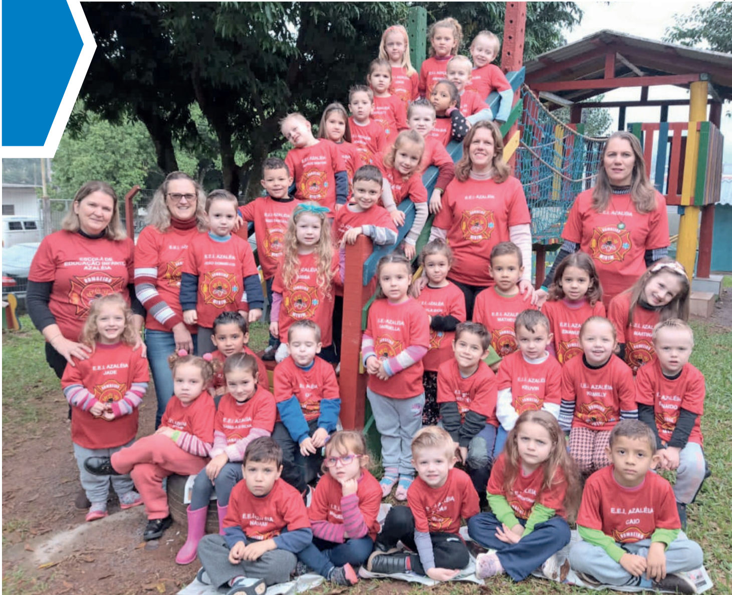
Nova turma de bombeiros mirins da Escola Azaléia