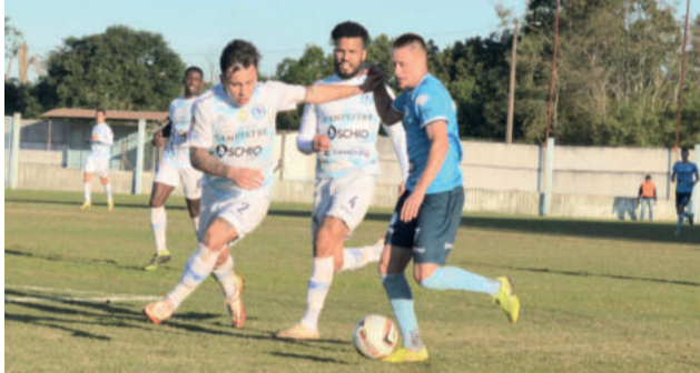
Ariel é uma das peças de 2021 e que faz diferença na temporada 2022