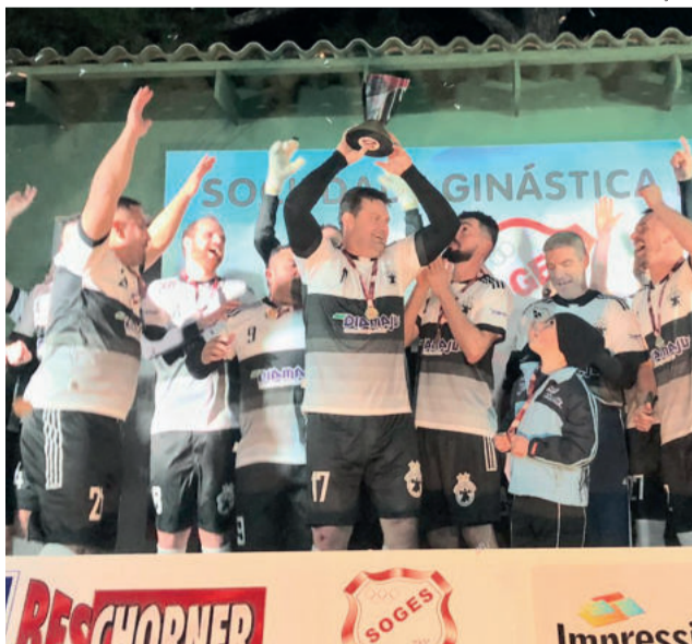
Mancha Negra/Xtotz United ficou com o título na Série Ouro