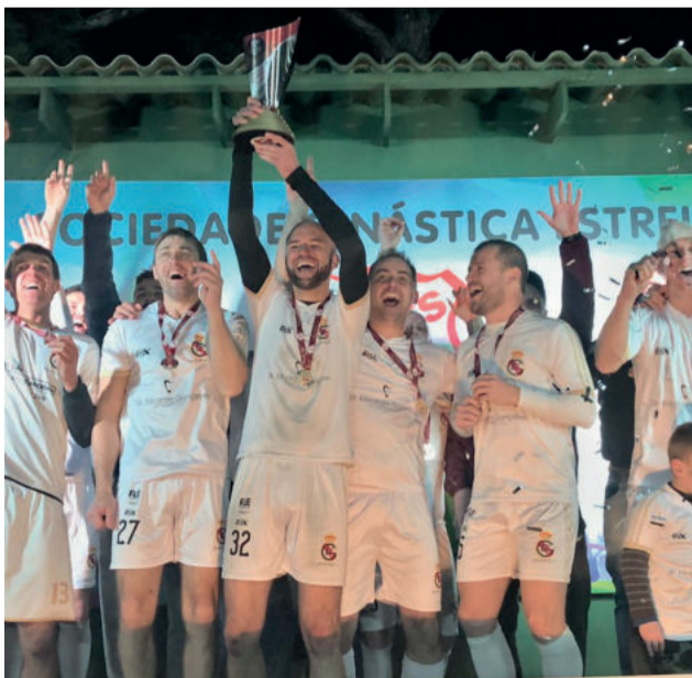
Galácticos ficou campeão na Série Prata