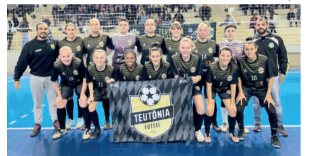
Elenco estreia na competição diante da Malgi Futsal de Pelotas