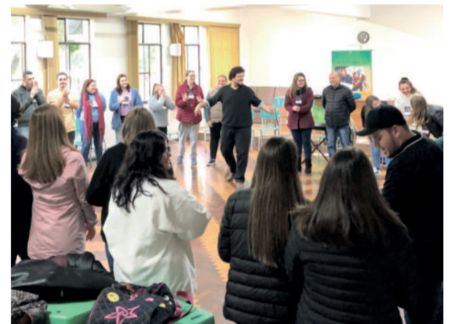
Oficina de corais integrou programação

A programação do Festival segue durante toda essa semana. Todos os dias contam com as aulas de música, oficinas e ensaios. Hoje (20/7) à noite, a partir das 19h30, tem show com Trio Nelson Faria, Guto Wirtti e Márcio Bahia e apresentação cursos do Festival no auditório do CT.