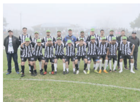
Pela Aslivata, após protesto, ECAS passa a ser o campeão da Taça da Amizade

O Juventude já se manifestou para nossa reportagem. Disse que constituiu advogado para recorrer da decisão. Alega que não foi intimado para julgamento,