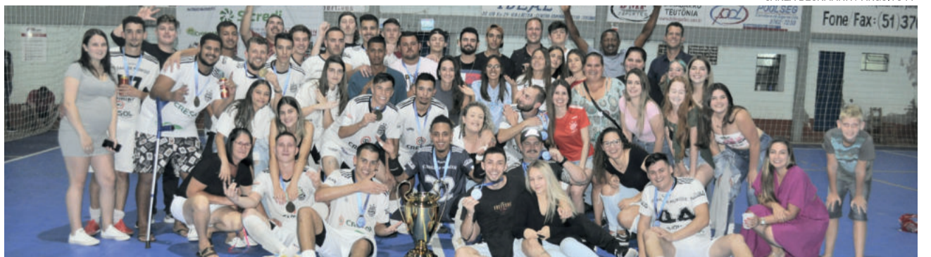
Baile de Munique é o atual campeão

A Cooperativa Sicredi está com apoio mais forte na competição e, juntos, farão algumas ações sociais. Quem levar um quilo de alimento não perecível não precisará pagar a entrada de R$ 5,00. Os alimentos serão destinados para instituição de caridade do município.