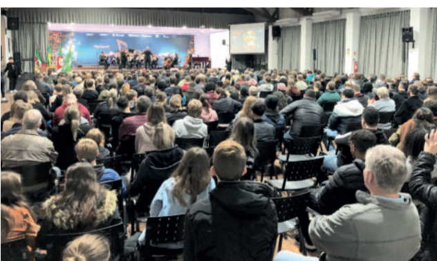
Palco do auditório do CT recebe apresentações até sexta-feira (22/7)

À meia-noite, na virada para o dia 17, data do aniversário, teve bolo com os parabéns.