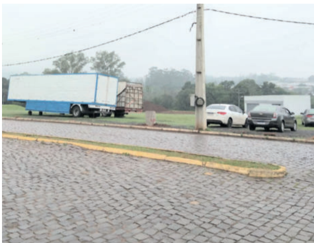
Espaço de shows do Centro Administrativo começará a receber as estruturas do Festival de Balonismo em breve