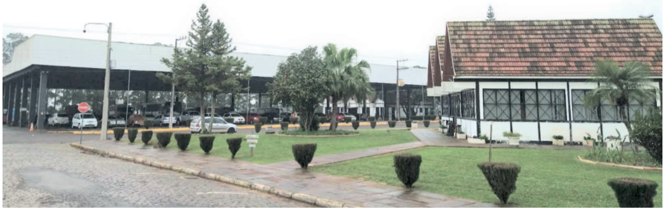
Centro Administrativo recebe boa parte dos eventos programados

O evento aguarda aprovação da Lei de Incentivo à Cultura (LIC), que está em análise junto à Secretaria de Cultura do Rio Grande do Sul. “O público esperado varia com as condições climáticas, mas aguardamos em torno de 30 mil pessoas nos 10 dias de evento”, considera. A programação terá entrada gratuita todos os dias.