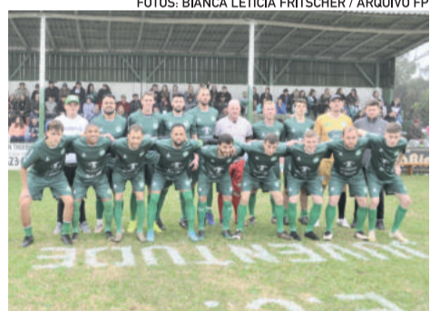
Dentro de campo, Juventude venceu e promete recorrer da decisão

que não teve oportunidade de se defender ou apresentar contraprovas. O clube de Westfália questiona o embasamento para a tomada de decisão e alega que não existe um regulamento específico da Taça da Amizade de 2022. “Até campeonato de canastra de Westfália tem regulamento. Como a Taça da Amizade não tem? Usar regulamento antigo não pare-