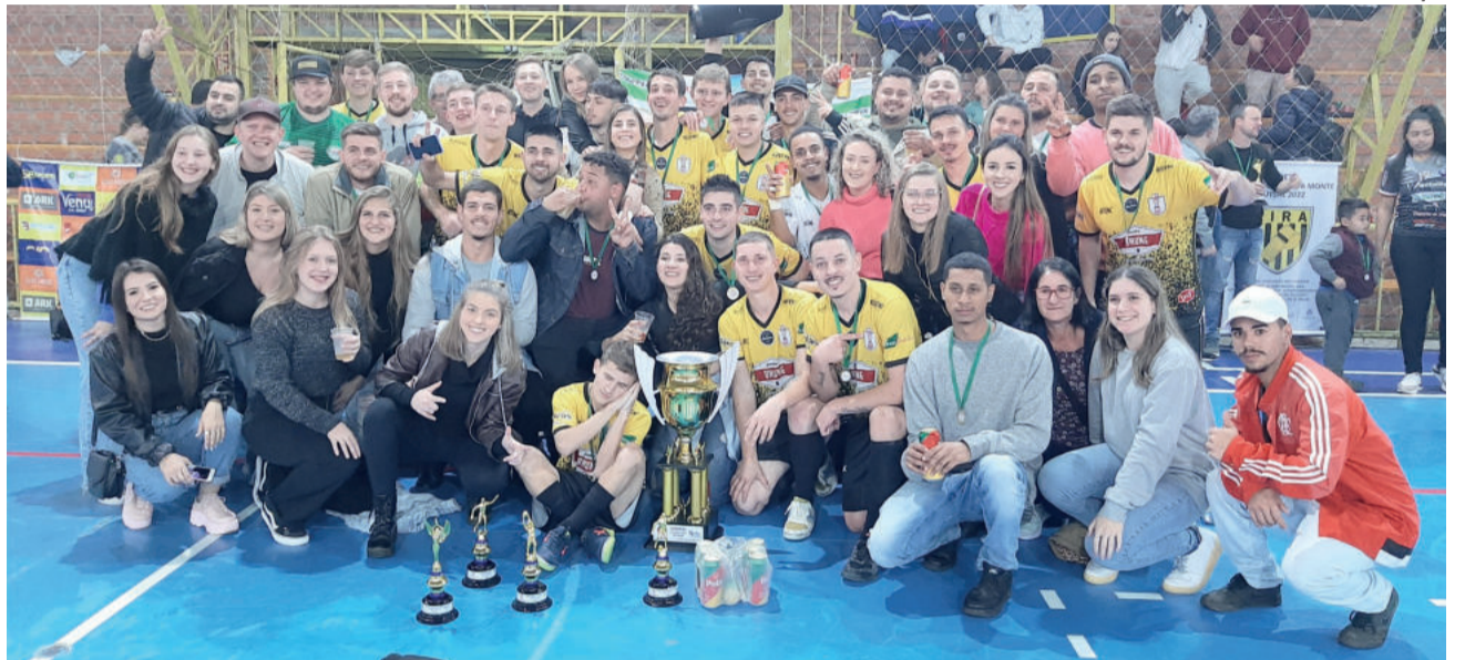
Comemoração foi grande por parte de jogadores e torcida