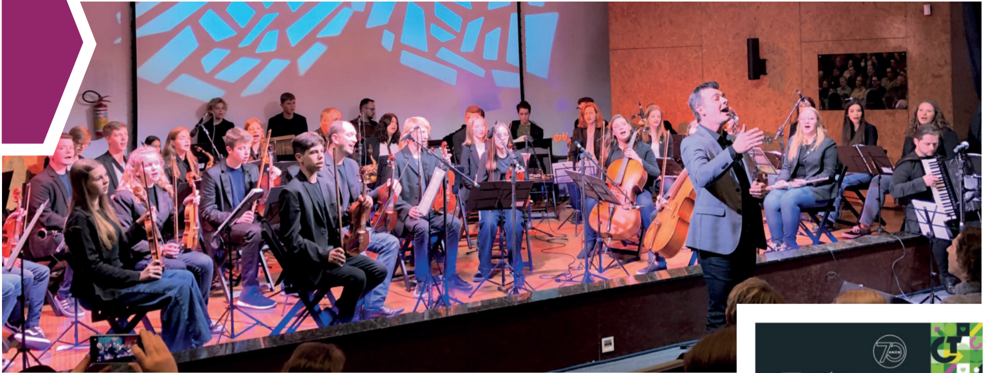
Conjunto Instrumental do CT abriu evento no domingo (17/7)