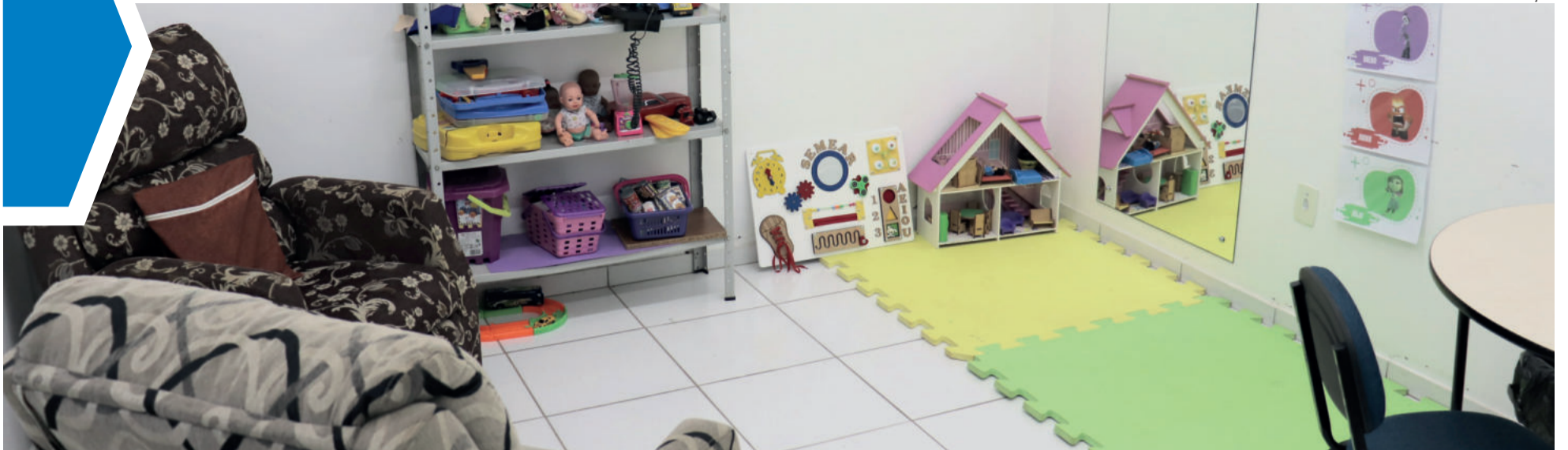
Semear atende em espaço cedido junto ao Cemef