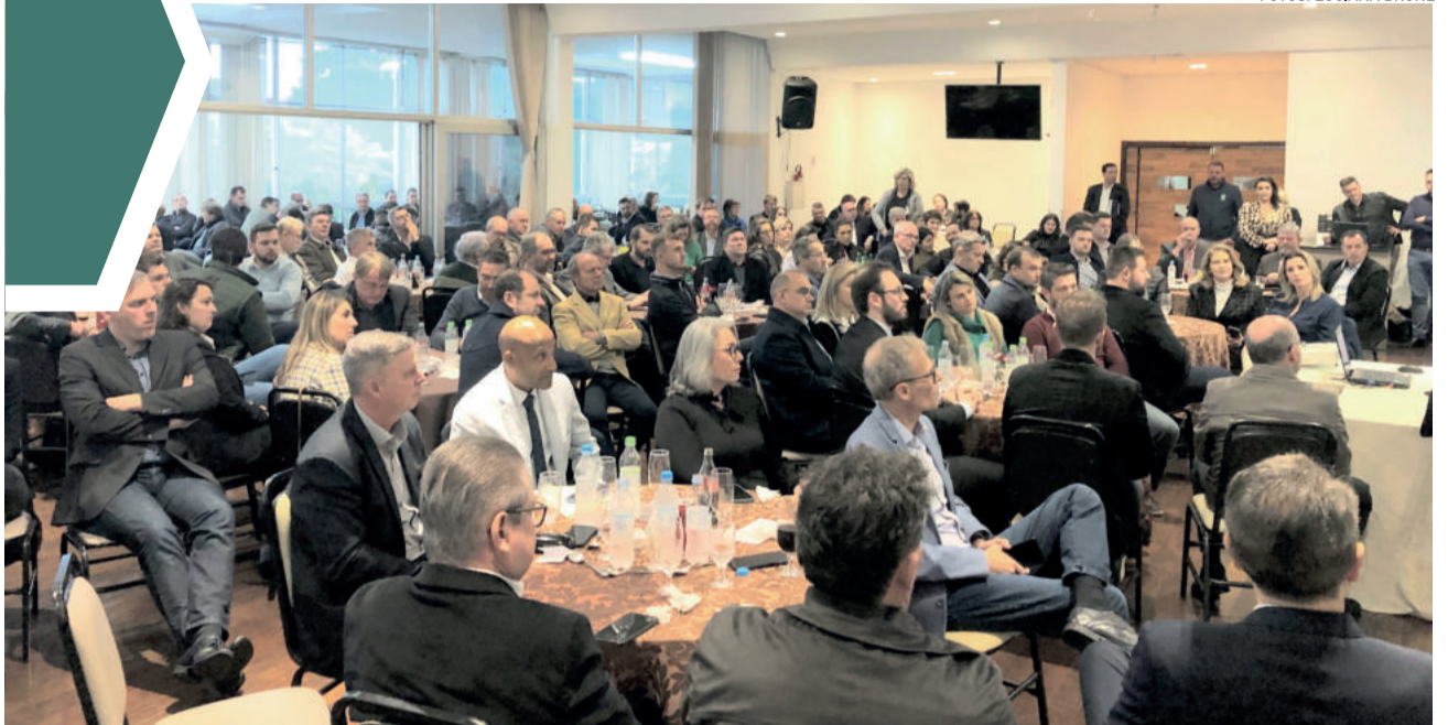
Público prestigiou palestra do governador