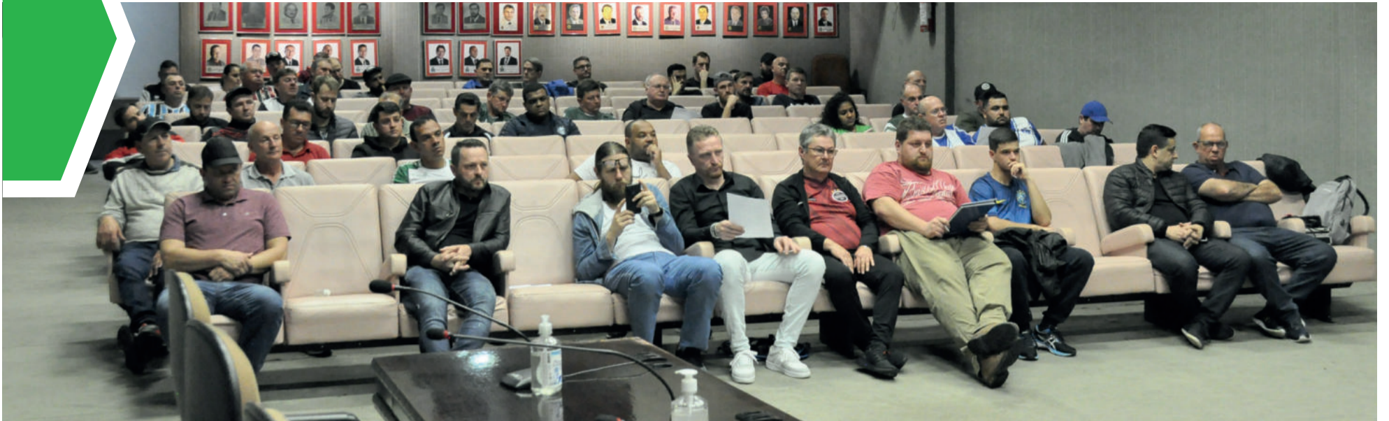
Reunião técnica aconteceu nessa quinta-feira (7/7), em Lajeado