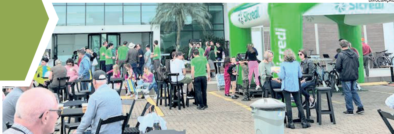
Ações do Dia C no Pátio da Sicredi Ouro Branco, de Teutônia