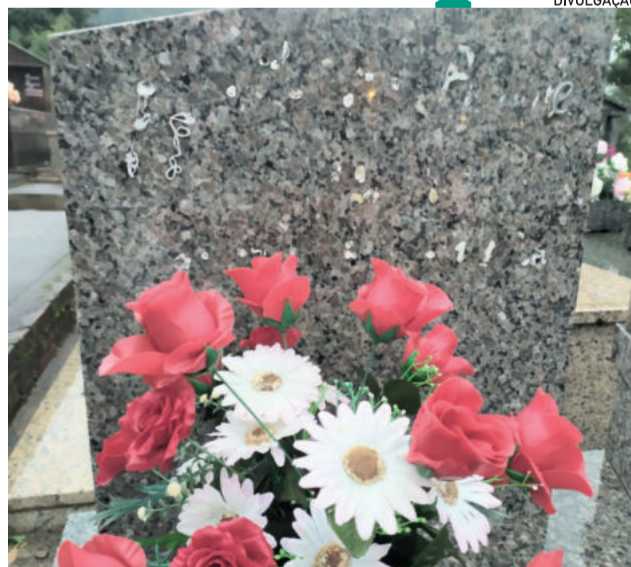
Foram retirados objetos em metal, bronze e prata

A comunidade tomou conhecimento da situação no fim da tarde de quinta-feira (7/7). Famílias se depararam com a ausência de crucifixos e adereços de túmulos.