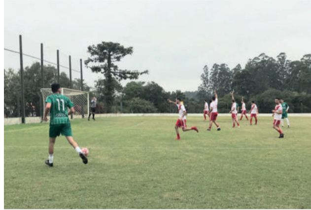
Jogo entre Atlético e Esperança é o único que pode terminar em pênaltis