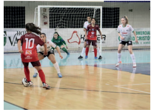
Jogo foi disputado no fim da tarde de sábado