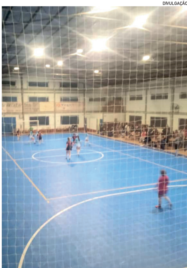
Competição se encaminha para a quarta rodada nesta sexta