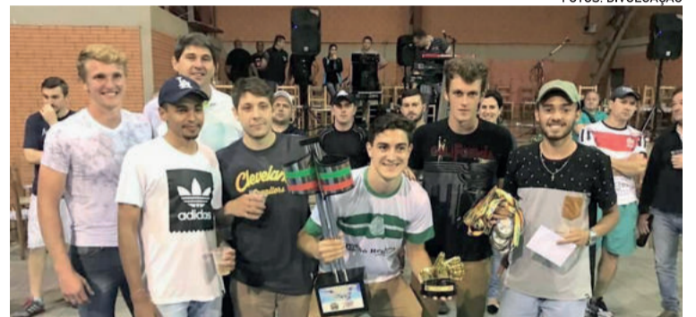
Campeão do Abertão de Paverama em 2017