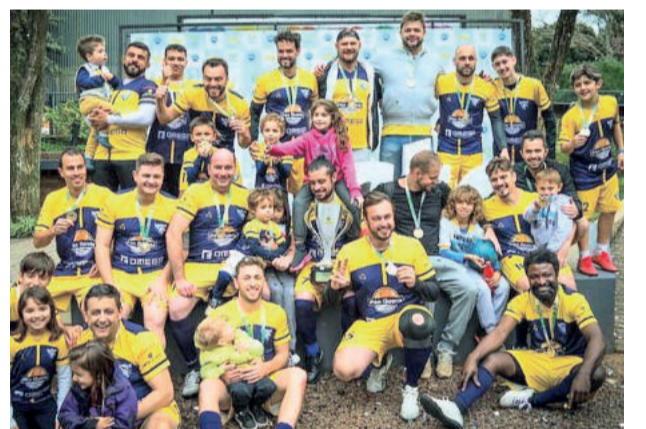
Nacional é campeão da 3ª Divisão