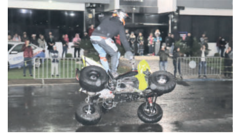
As manobras radicais deram o tom do segundo fim de semana de evento

Previsto para acontecer também no domingo à tarde, os aviões e balões não puderam subir ao céu devido às condições climáticas. Por outro lado, a chuva, o vento e o frio não impediram que os carros, motos, karts, quadriciclos e caminhões voltassem à pista para uma última exibição.