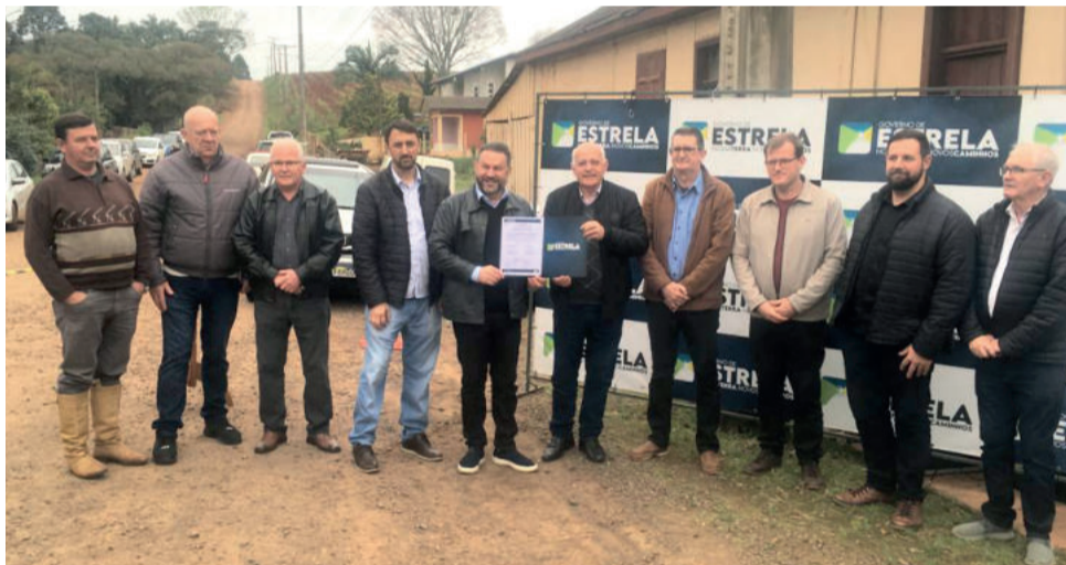
Municípios assinaram ordem de início da obra de asfaltamento da estrada de Linha Wink