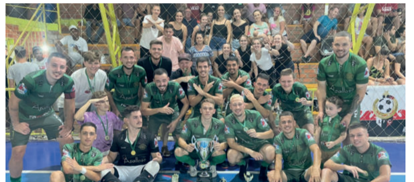
Campeão da Taça Coopeva – categoria Chumbo – em 2021