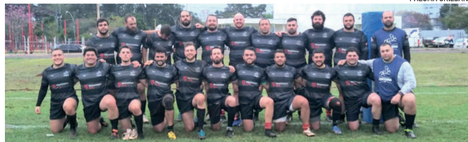
Equipe buscou o resultado de 43 a 5 contra o URSM