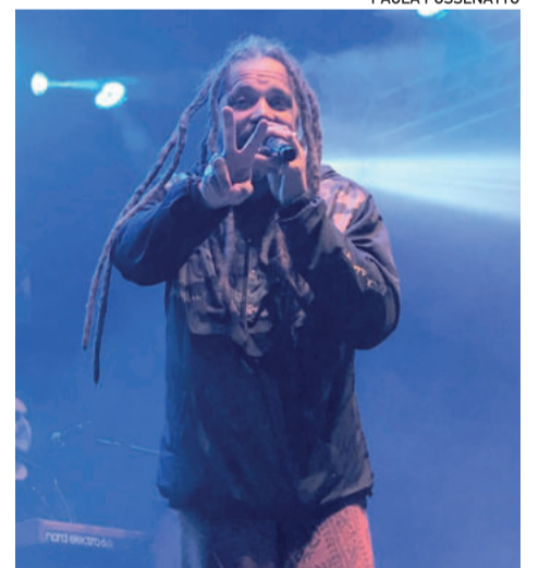
Banda Maskavo foi a atração principal do sábado