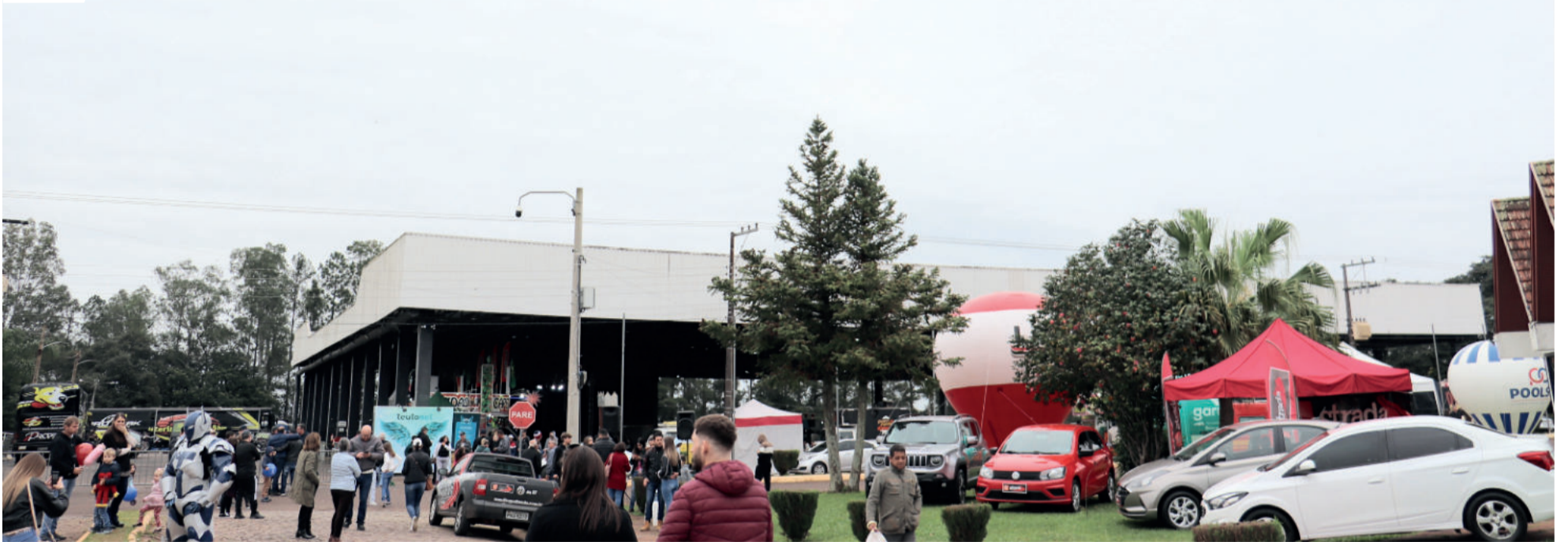
Cerca de 30 mil pessoas passaram pelo Centro Administrativo nos dias de evento