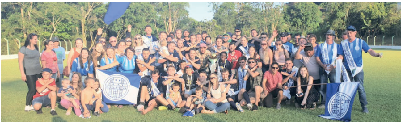
Sport Clube Alto Taquari é o atual campeão da Série B

O lançamento de toda esta competição será amanhã à noite, a partir das 20h, no salão social do Clube dos Quinze, no Bairro Montanha, em Lajeado. Organização e patrocinadores recepcionarão as equipes, a imprensa e demais simpatizantes do “futebol da nossa gente, da nossa terra, das nossas comunidades”.