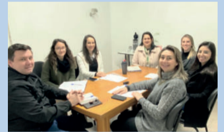
Encontro ocorreu na sexta-feira (5/8)