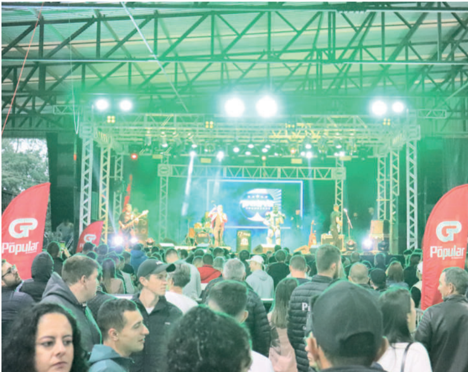
Show da Família, no domingo, fechou programação cultural

lheiros, o Show da Família é um espetáculo feito para a comunidade. "É a oportunidade de devolver pessoalmente um pouco de todo o carinho que a Rádio Popular recebe. Além disso, unir a tradição do Show da Família com o ineditismo do Festival de Balonismo, reforça ainda mais o compromisso da Popular com o desenvolvimento de Teutônia e o desejo que os eventos prosperem em nossa cidade", descreve.