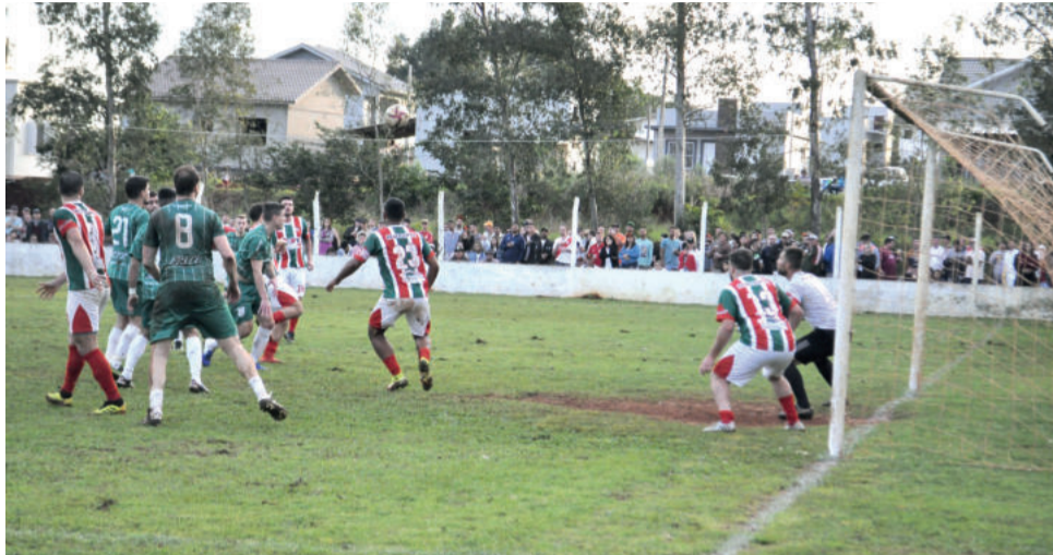
Índio (encoberto) cabeceia fora do alcance para empatar o jogo