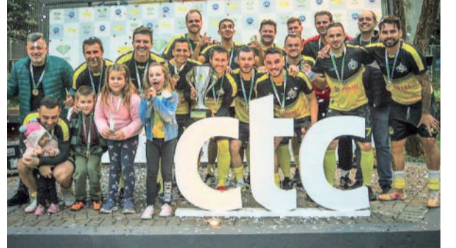
Borússia é campeão da 1ª Divisão