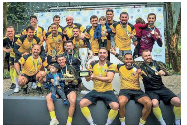
Borússia é campeão da 2ª Divisão