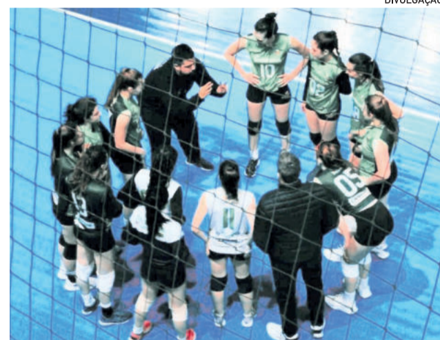
Juventus se classificou em 2º lugar no Grupo A