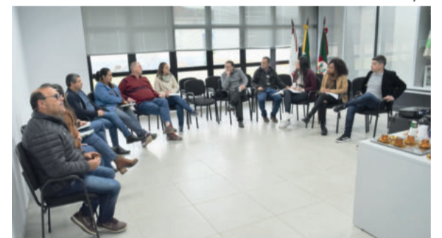
Comissão organizadora esteve reunida na quinta-feira (18/8)