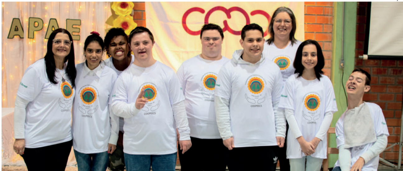
Estudantes da diretoria da COOPEECS junto com as professoras coordenadoras