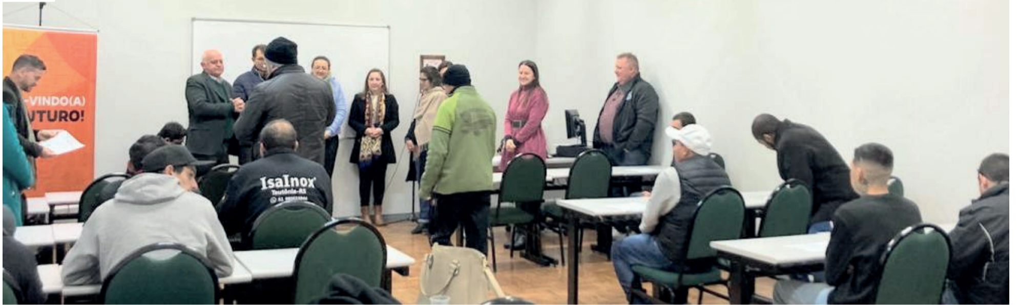
A cerimônia foi realizada no prédio do Senai, no Parque Ipê em Canabarro