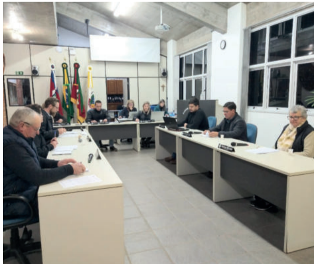
Sessão ocorreu nesta segunda-feira (22/8)

Explicou que o objetivo do curso é capacitar pessoas da comunidade com as técnicas básicas de cuida com idosos. / Salientou que capacitar as pessoas é também uma bandeira da administração municipal.