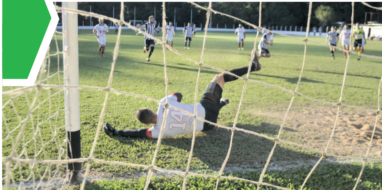
Ecas conseguiu a vitória diante do Canabarrense com gol de pênalti