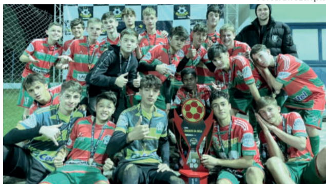
Sub-14 teve cinco jogos disputados e ficou com a taça