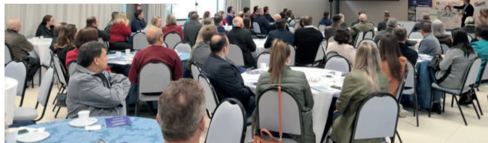
Profissionais do HOB fizeram apresentação para os convidados

Apresentou alguns tipos de atendimento e serviços pioneiros realizados no hospital nos últimos anos. Entre os novos serviços, destacou o PA Convênios. O serviço de pronto atendimento