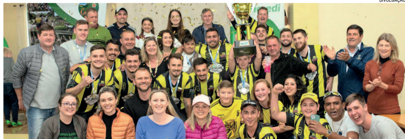
Tiger's venceu o Só Funcho por 4 a 2