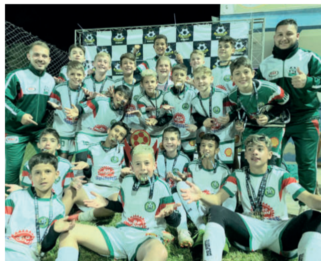
Sub-12 disputou quatro jogos e saiu com o título