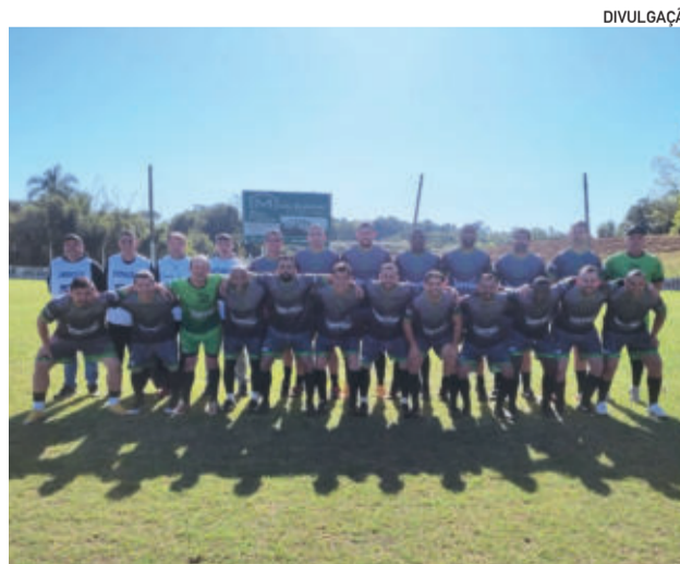
Rudibar venceu em casa e reassumiu a liderança