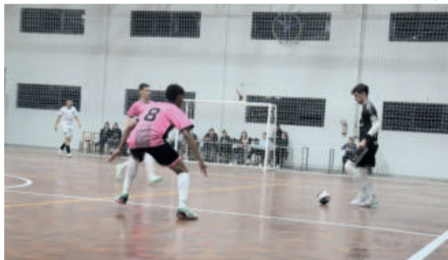
Primeira rodada teve disputada de quatro jogos