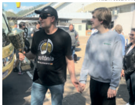
Familiares e amigos receberam os músicos nessa terça-feira (13/9)