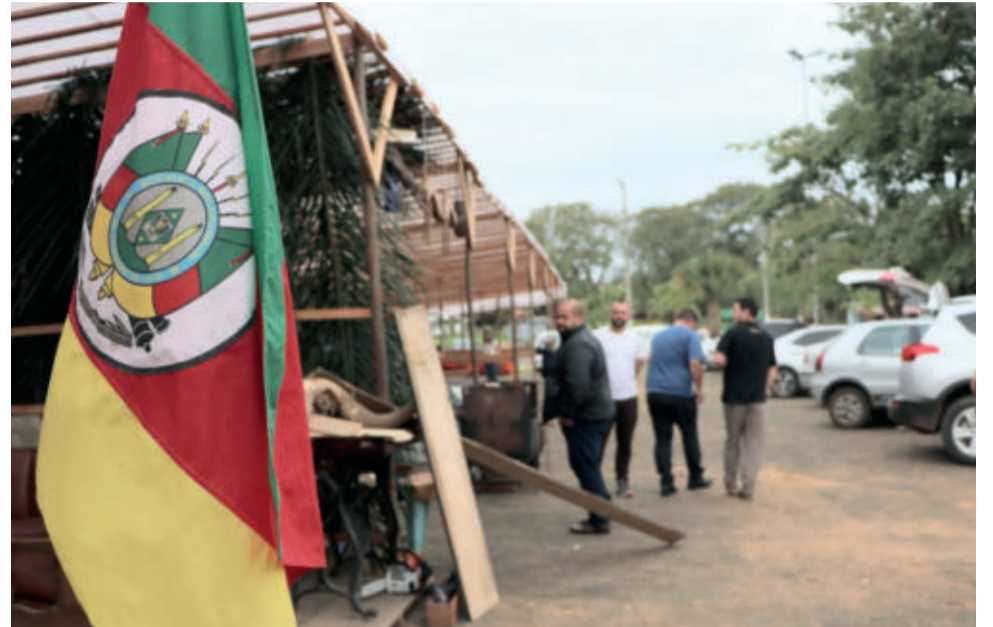
Diversas programações celebram a Semana Farroupilha

Domingo - 25/9 8h: café da manhã na Comunidade Mãe de Deus 9h: Cavalgada e solenidade 12h: Almoço a R$ 25 no Ginásio Municipal