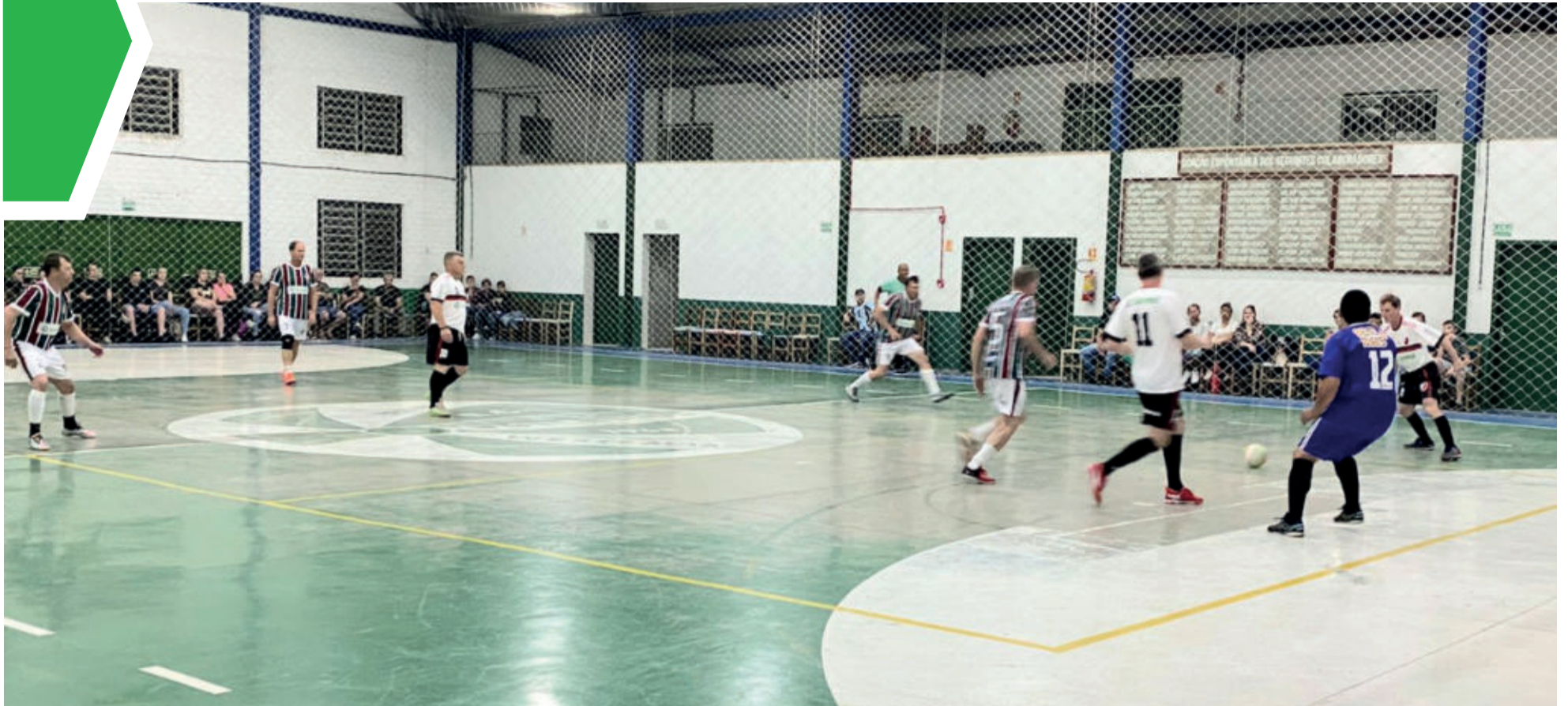
Categorias Veteranos e Força Livre jogam nesta quinta-feira