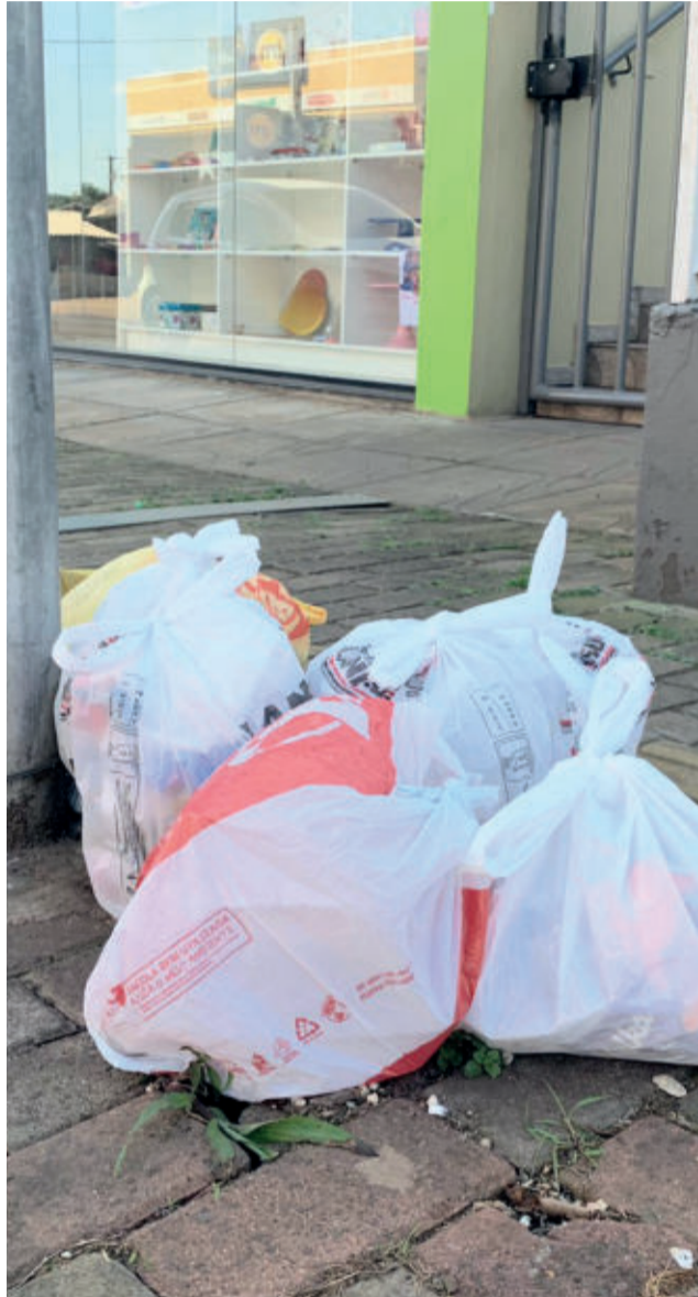
Lixo deve ser colocado em horários diferentes para evitar acúmulos

- Pneus, latas de tinta, embalagens de óleo lubrificante devem ser devolvidos aos pontos de venda, que encaminham ao destino correto.