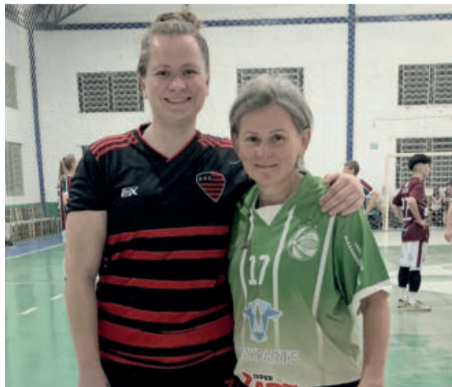
Filha e mãe