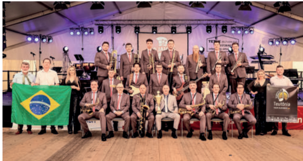
Orquestra recebeu o troféu nesse domingo (11/9)

grantes de outras cidades. Já nos apresentamos em tantos lugares dentro de nossas terras. Essa conquista, mais uma internacional, reafirma nossa responsabilidade e grandeza. Somos um retrato de Teutônia, da região, do estado e do país. É muita felicidade”, acentua.