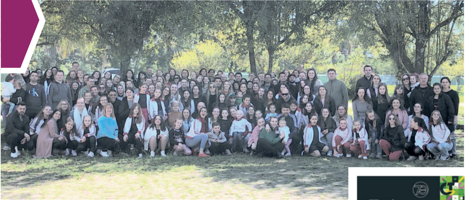
Família Movimentu's participantes do Festival