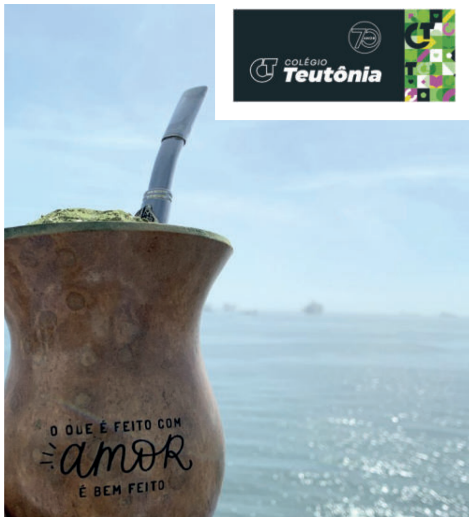
Mesmo fora do país, a gaúcha leva a tradição de seu estado

E na questão de alimentação, Vanessa diz que sentiu falta do tradicional arroz com feijão. “Lá no navio temos comidas maravilhosas, bem temperadas. Na minha posição também podemos comer em restaurantes de hóspedes. Salada não é a mesma coisa que daqui, que podemos colher da horta e comer”, explica.