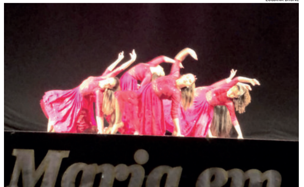
Coreografia "Amor Infinito" foi apresentada todas as noites