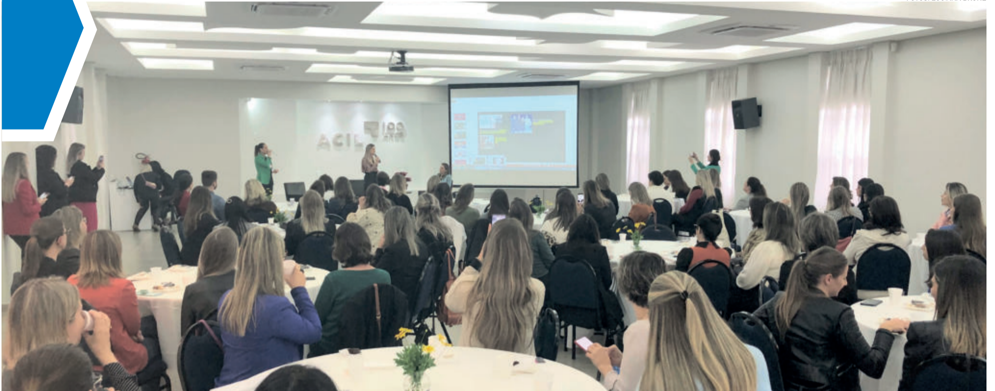
Evento ocorreu no salão da Acil