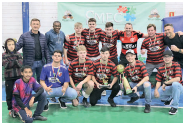
Flamengo ficou com a taça na categoria Juvenil