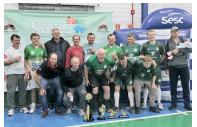
Juventude sagrou-se campeão na categoria Veterano