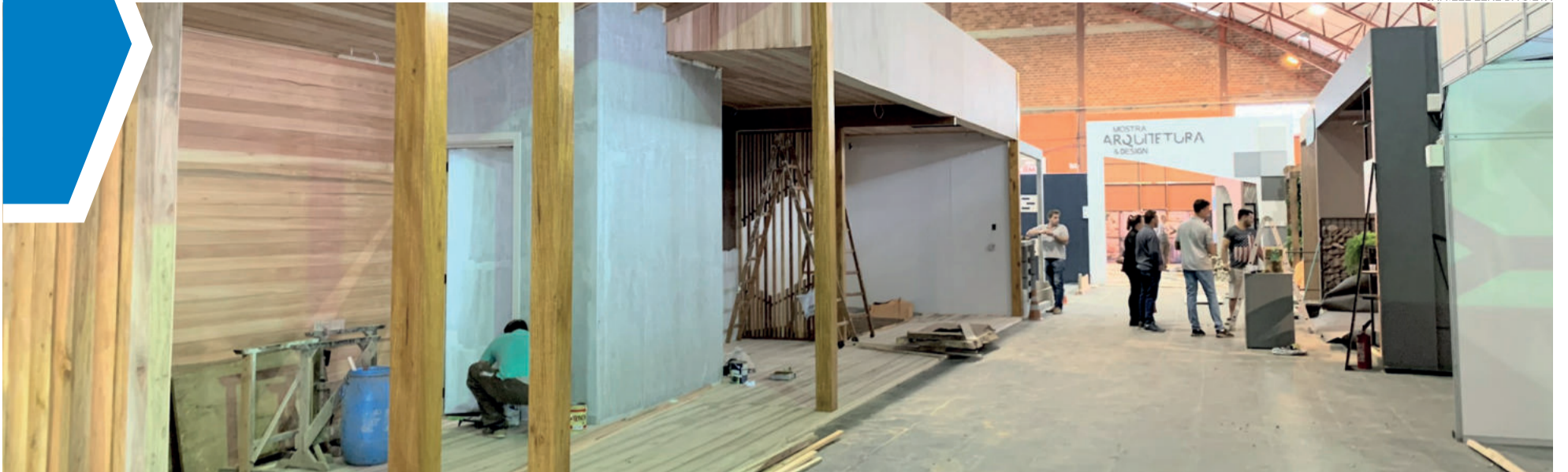
Múltiplas equipes trabalham dentro e fora dos pavilhões