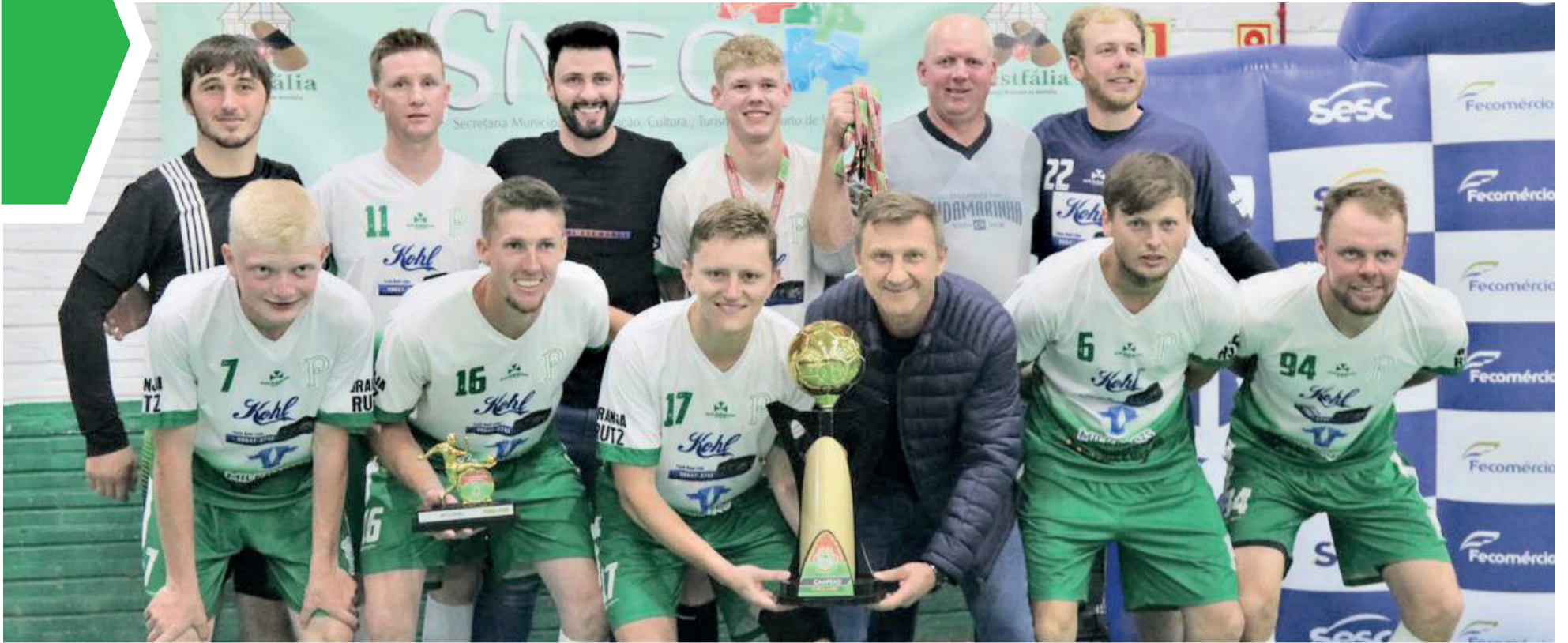
Palmeiras levantou o título de tetracampeão