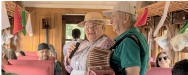
Heda foi uma das atrações do evento, circulando em todos os vagões