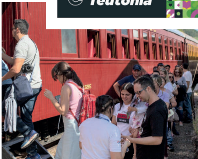
1ª temporada de passeios do Trem da Imigração recebeu 2,4 mil passageiros