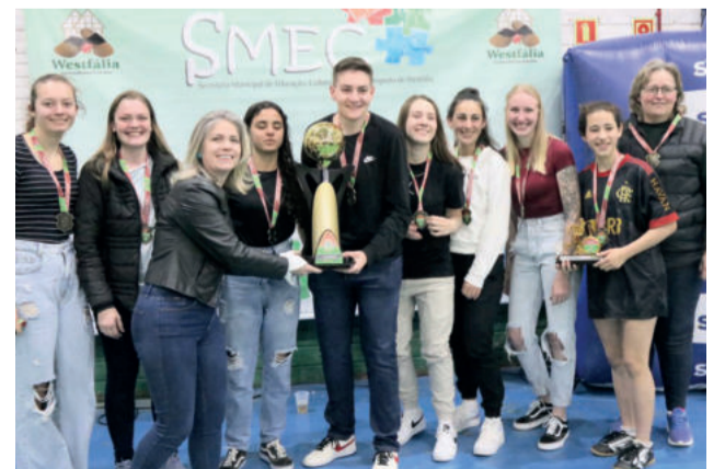
Flamengo ficou com o título no Feminino