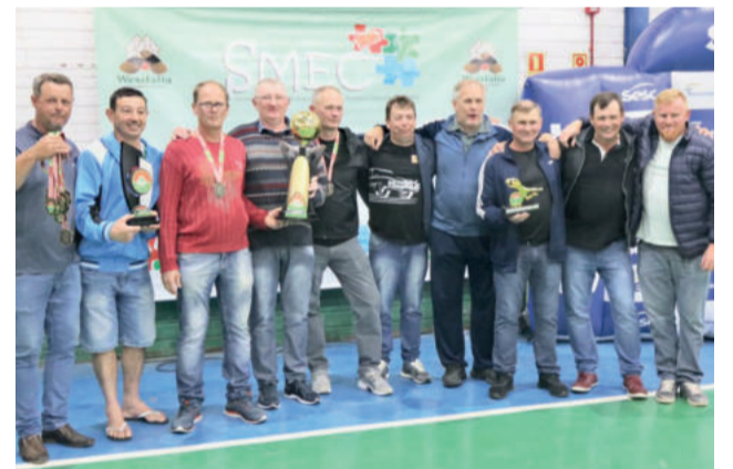
Fluminense levou o título no Máster