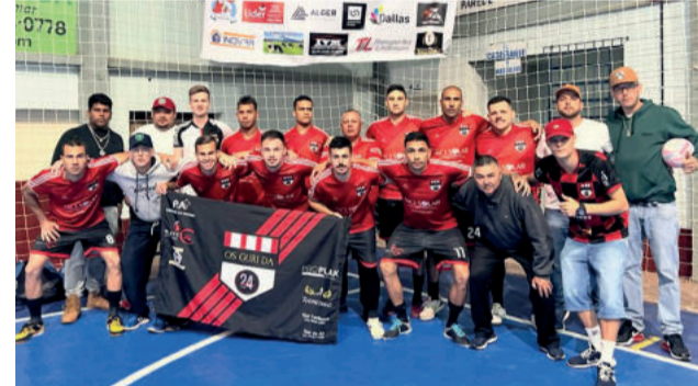
Os Guri da 24