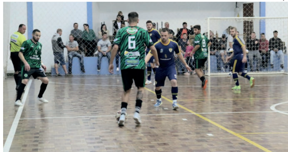
Sporting venceu o BB Contabilidade e está na final do Força Livre

O primeiro jogo da final será disputado no dia 18 de novembro, a partir das 20h, no Ginásio Municipal.