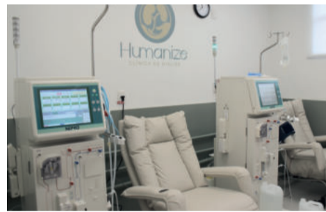
Centro possui 15 macas e uma sala de emergência

Porém, agora o problema é outro: o terceiro rim transplantado parou de funcionar. Para fazer outro transplan-