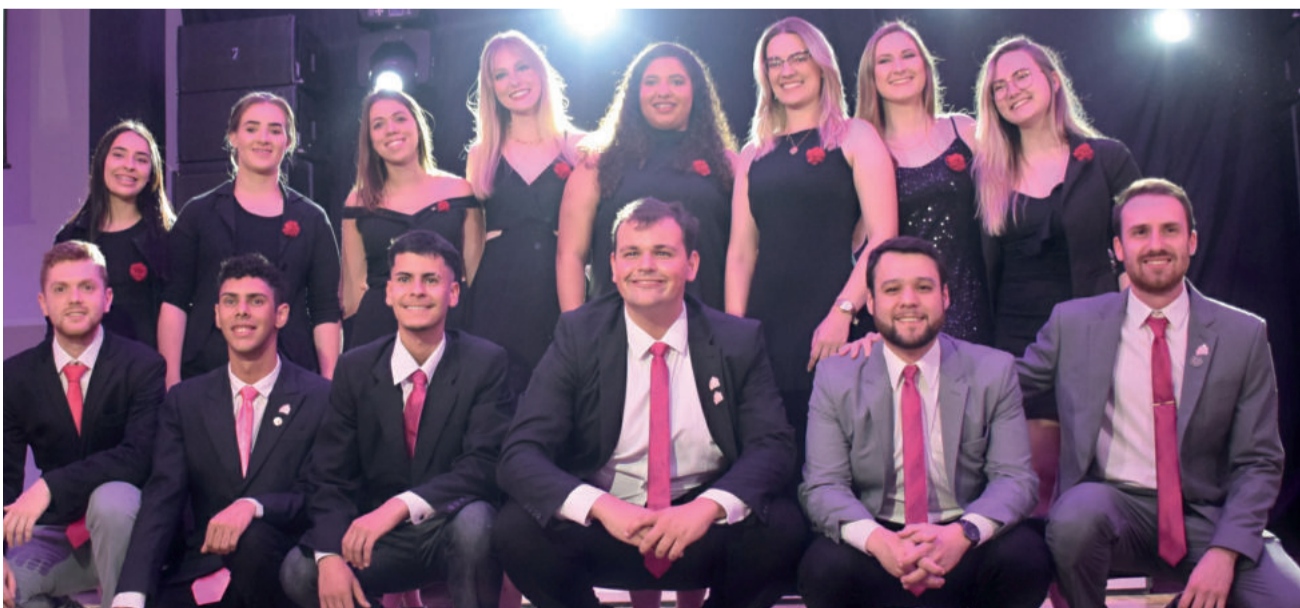
Apenas cinco voluntários atuais do clube haviam participado das edições anteriores

Uma das premiações e surpresas da noite para as jovens foi o curso técnico em Administração concedido pelo Colégio Teutônia e o curso de inglês ofertado pela Supply Idiomas. “Não queremos oferecer só uma festa, mas sim dar continuidade, pensar em um propósito que realmente possa fazer a diferença na vida destas meninas”, ressalta a presidente.