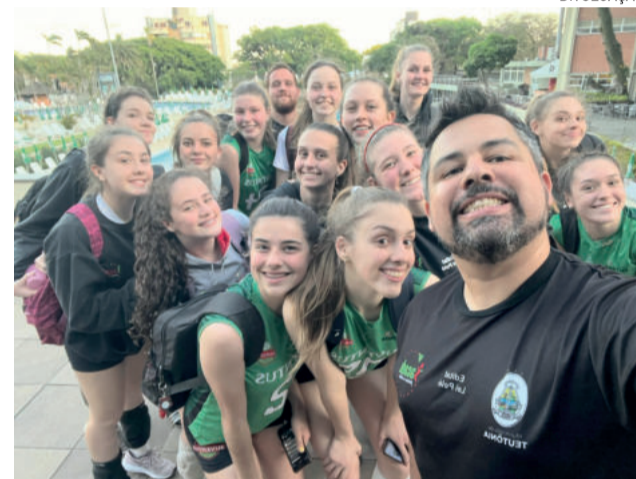
Categoria pode disputar as finais da Série Ouro