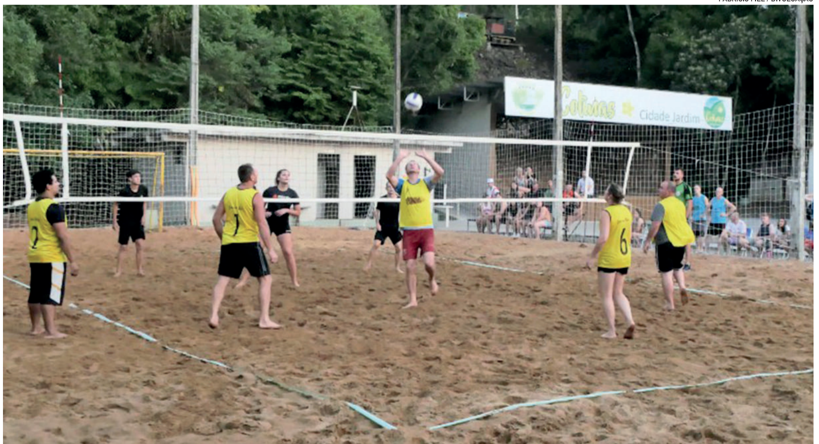
Abertura do campeonato aconteceu no domingo (29/1)

Os prêmios são vale-compras, medalhas e troféus. Os ganhadores também serão agraciados com um troféu destaque para as categorias masculina e feminina.