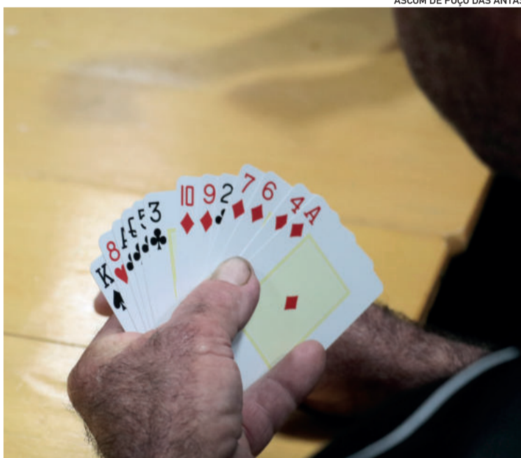
Público interessado deve procurar a Secretaria da Assistência Social do Município

Mais informações sobre datas, locais e horários serão concedidas conforme a adesão dos participantes.