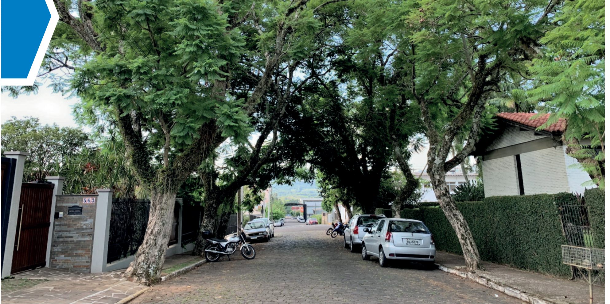
Túneis verdes estão cada vez menos frequentes nas ruas centrais do município