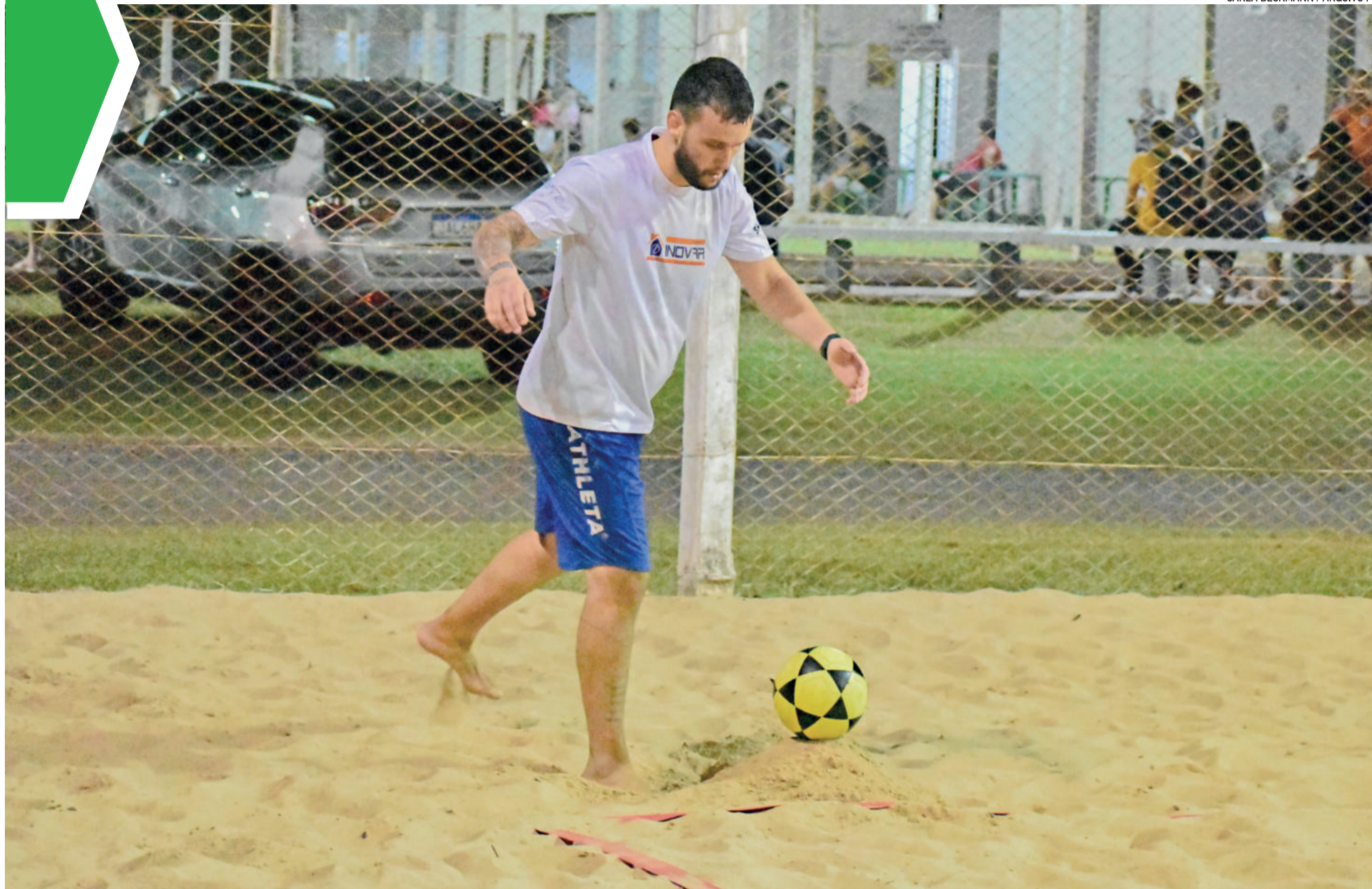
Poio é dupla de Colossi, que enfrentarão Eduardo/João/Pedro no primeiro jogo da noite