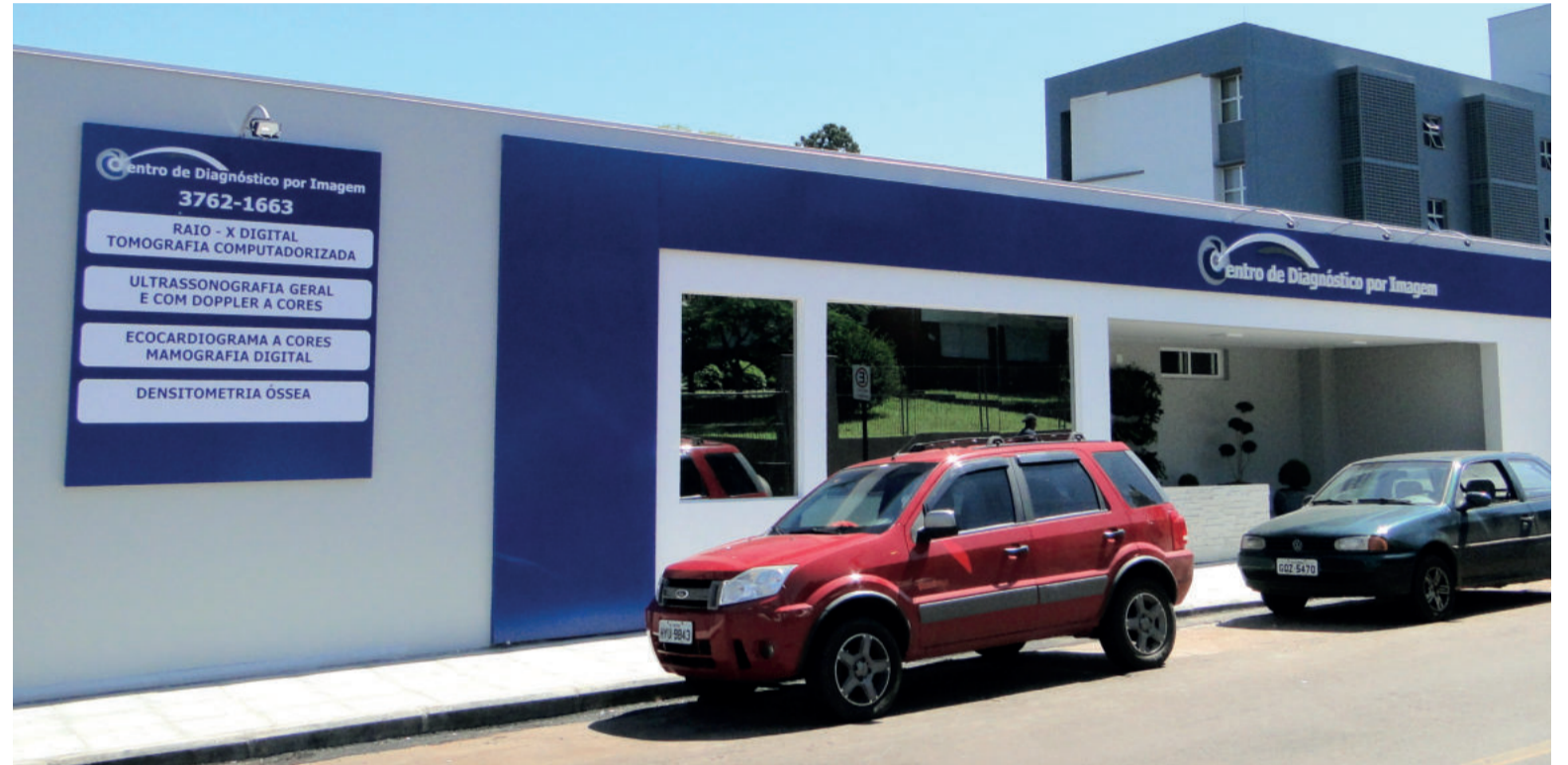
Até o momento, cerca de 250 exames estão em atraso pelo SUS

O diretor-executivo enfatiza que o hospital possui vários pedidos de emendas parla-