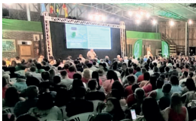
Fazenda Vilanova foi uma das cidades que já recebeu a assembleia