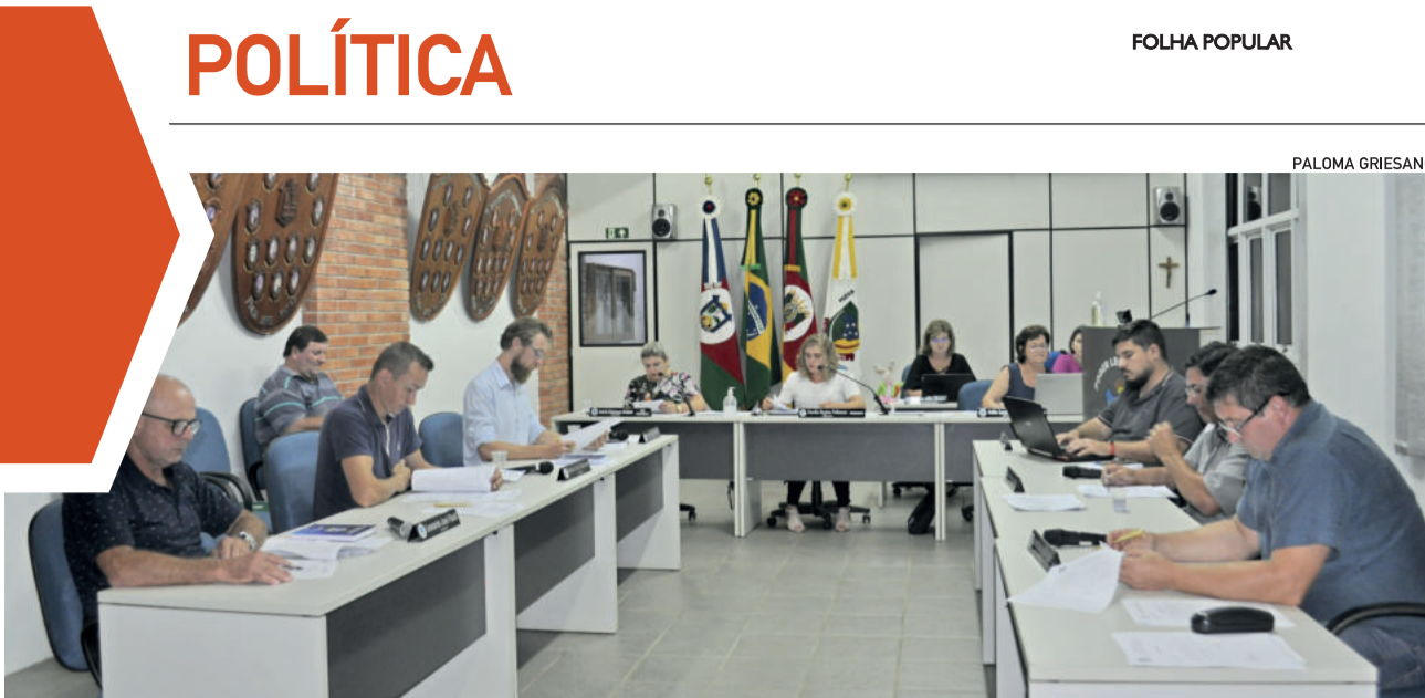
Vereadores se reuniram na primeira sessão ordinária de 2023

Maquiavel ensinou: "Os prudentes sabem tirar proveito dos atos a que a necessidade os constrangiu". Pena que a soberba é muito maior que a prudência. Essa anda em falta.