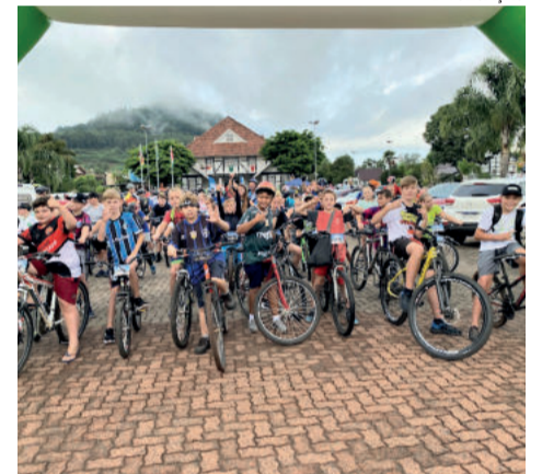
Passeio Ciclístico teve participação de muitas crianças