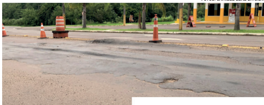
Trecho em frente à PRE é o mais crítico

Ele cita que a manutenção do quebra-molas no local dependerá de conversa com o pelotão. “Se ela é efetiva e trouxe mudança de comportamento, será privilegiada a segurança, mesmo que isso traga custos adicionais”, pontua.