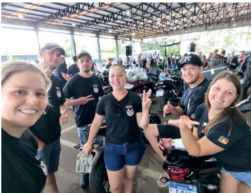
Grupo esteve presente na 4ª Teutônia Moto Fest