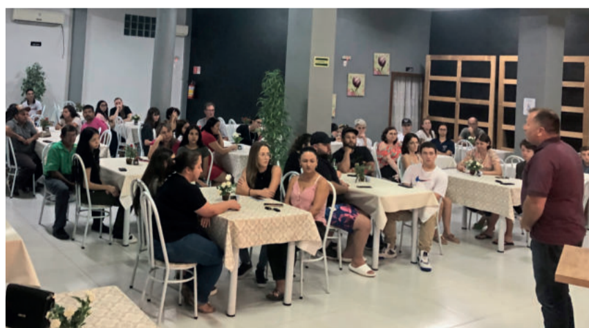
Prefeito conversou com estudantes durante a aula inaugural