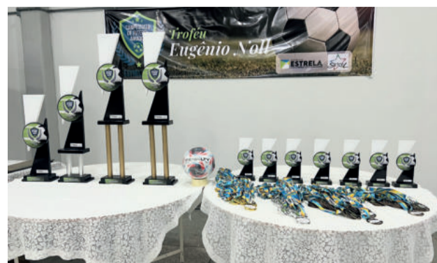
Premiação do Municipal de Estrela - Troféu Eugênio Noll