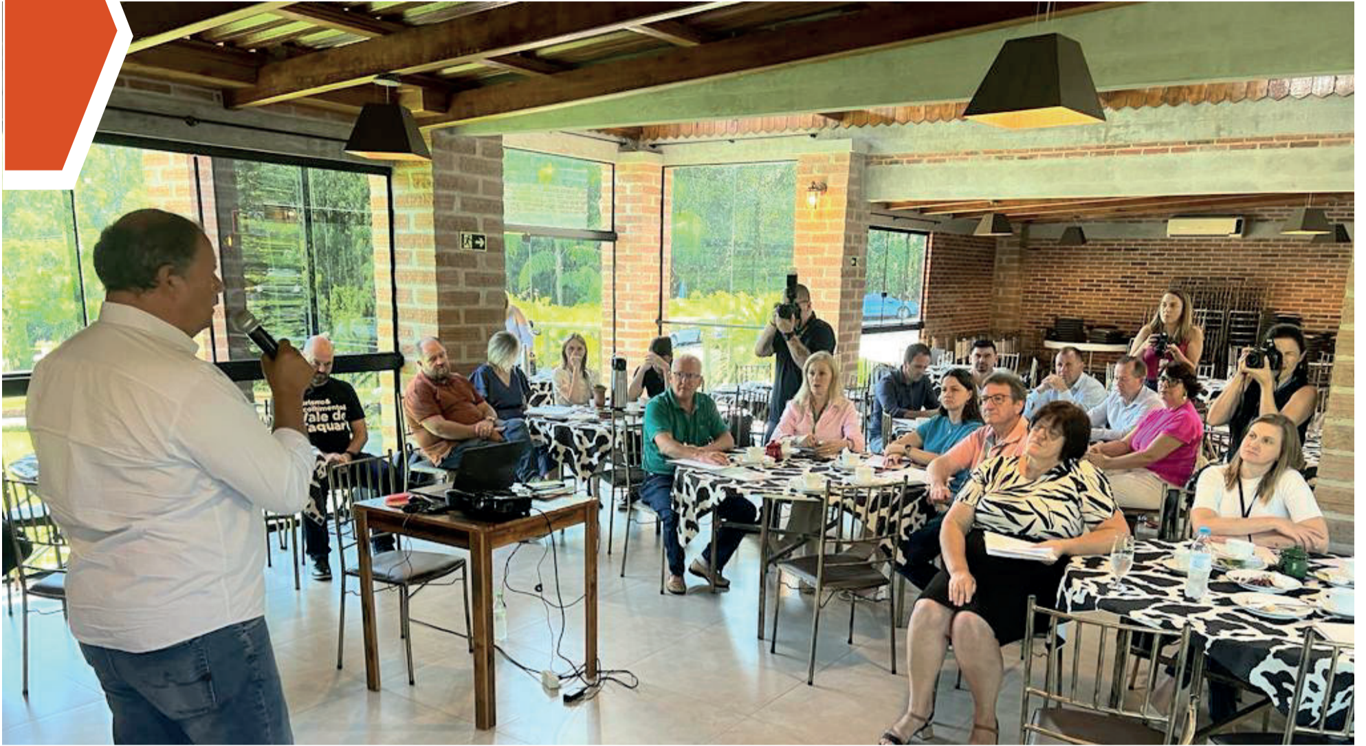
Alceu Moreira participou da reunião do G7 nesta segunda-feira