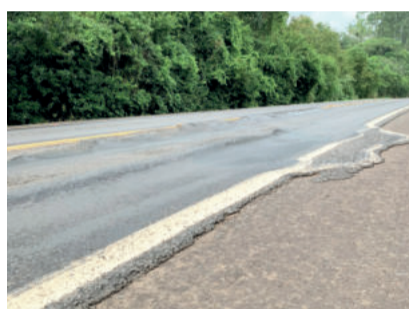
Pista próxima à entrada de Linha Geraldo também exige atenção