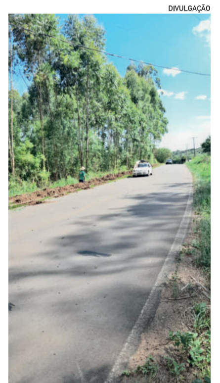
Uma das intervenções ocorreu entre Morro Bonito e Boa Esperança

A Prefeitura admite que a falta de água ocorria no horário de pico, e que os canos não