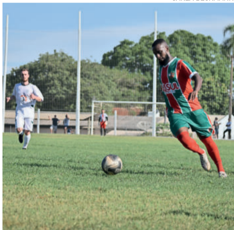
Aspirantes não teve bola na rede