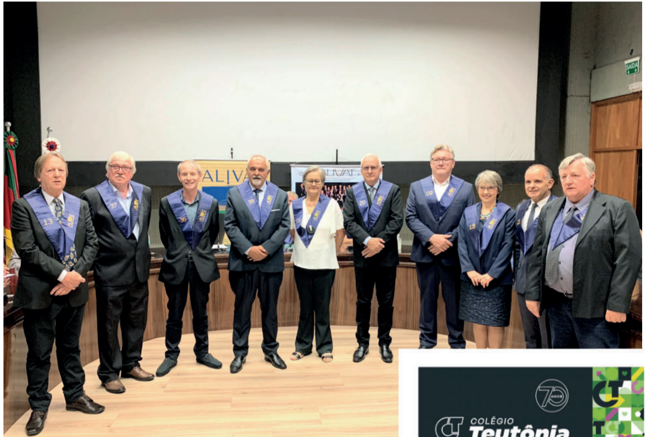
Parte da diretoria eleita da Alivat para o biênio 2023-2024