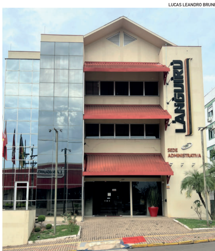
LUCAS LEANDRO BRUNE

A Unicred Premium está realizando a terceira edição do programa de conexão com startups Connection Unicred. O objetivo é resolver desafios internos da cooperativa para o desenvolvimento de soluções inovadoras e estabelecer parcerias e oportunidades de crescimento e negócios para startups dentro do setor de crédito. As inscrições podem ser feitas até o dia 17.