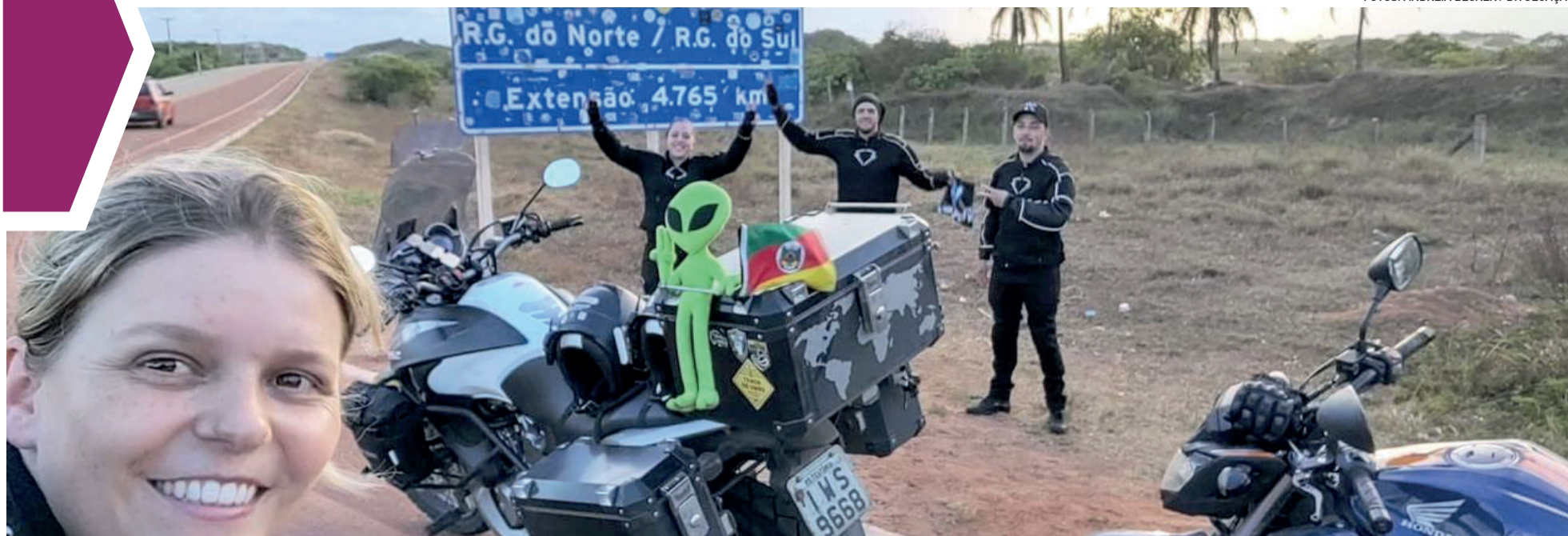
Motoqueiros já percorreram mais de 10 estados juntos