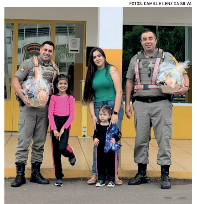
Soldados foram agraciados com ninhos de Páscoa