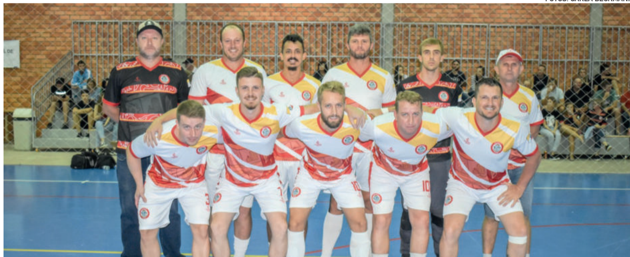
Seleção de Imigrante