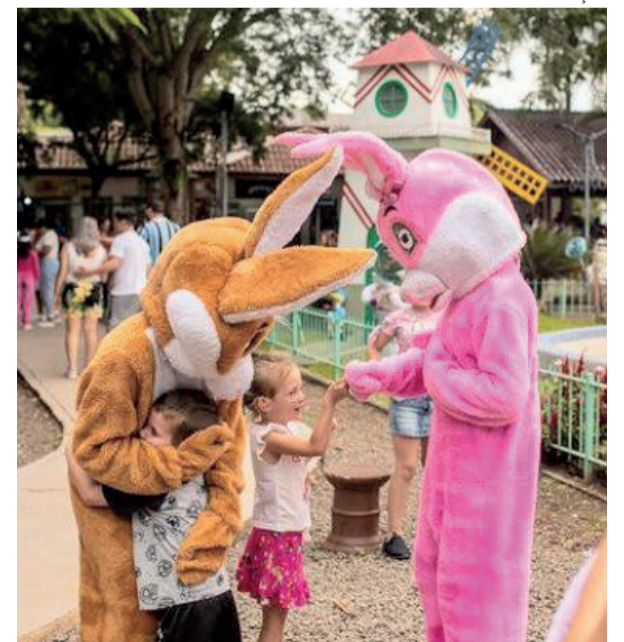
Atividades propostas encantaram as ruas do município e fizeram a alegria das crianças