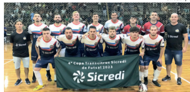
Seleção de Paverama é vice-líder, com 12 pontos