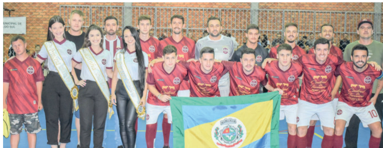
Seleção de Boa Vista do Sul