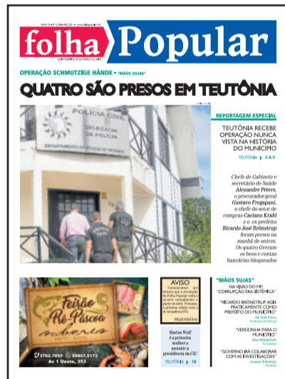
Folha Popular de 29 de março de 2018 destacou tema na capa

Apesar do ditado “a Justiça tarda, mas não falha”, a demora na tramitação fez parte da comunidade teutoniense esquecer do assunto ou desacreditar e relevar os fatos levantados à época. Poucos lembraram da data há duas semanas. E por enquanto o tema ainda pende de continuidade. Os réus (ou acusados) e demais arrolados no processo seguem sem uma definição e precisam “tocar suas vidas” com o processo inconcluso. A comunidade aguarda respostas sobre os fatos, sobre as provas coletadas e sobre os julgamentos.