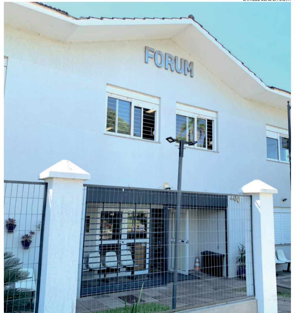
Juiz aguarda retorno do processo para se inteirar do tema

23 de março de 2023 – Processo é encaminhado ao juiz da 1ª Vara de Arroio do Meio.