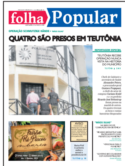
Folha Popular de 29 de março de 2018 destacou tema na capa

Apesar do ditado “a Justiça tarda, mas não falha”, a demora na tramitação fez parte da comunidade teutoniense esquecer do assunto ou desacreditar e relevar os fatos levantados à época. Poucos lembraram da data há duas semanas. E por enquanto o tema ainda pende de continuidade. Os réus (ou acusados) e demais arrolados no processo seguem sem uma definição e precisam “tocar suas vidas” com o processo inconcluso. A comunidade aguarda respostas sobre os fatos, sobre as provas coletadas e sobre os julgamentos.