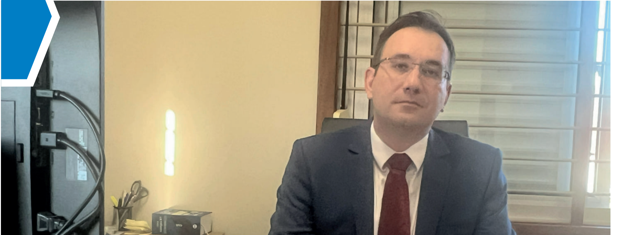
Juiz Luís Gustavo Negri Garcia assumiu a 1ª Vara da Comarca de Teutônia dia 17 de janeiro de 2023