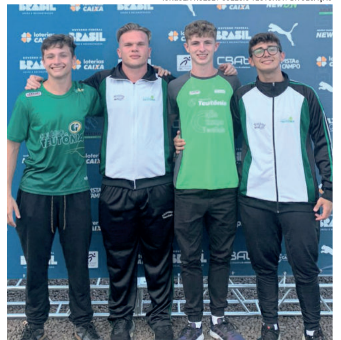
Quarteto competiu em Cascavel, no Paraná