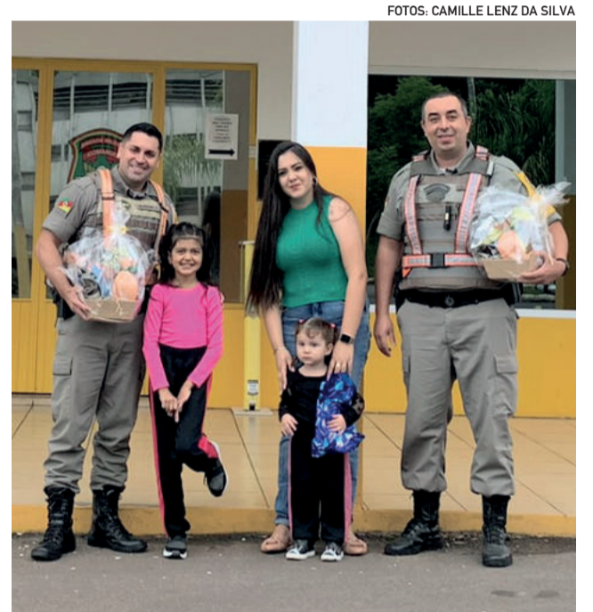
Soldados foram agraciados com ninhos de Páscoa