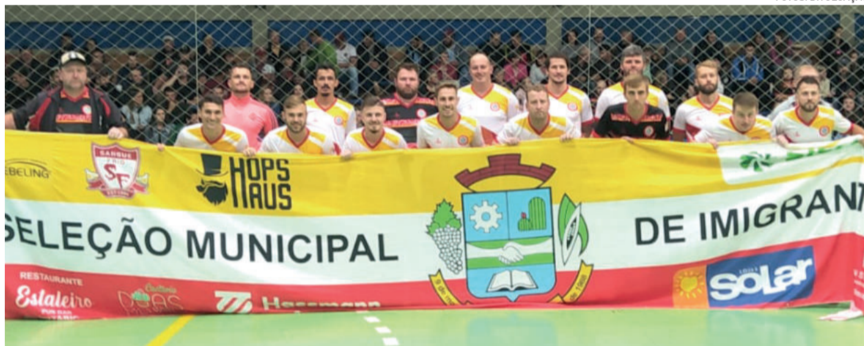
Seleção de Imigrante