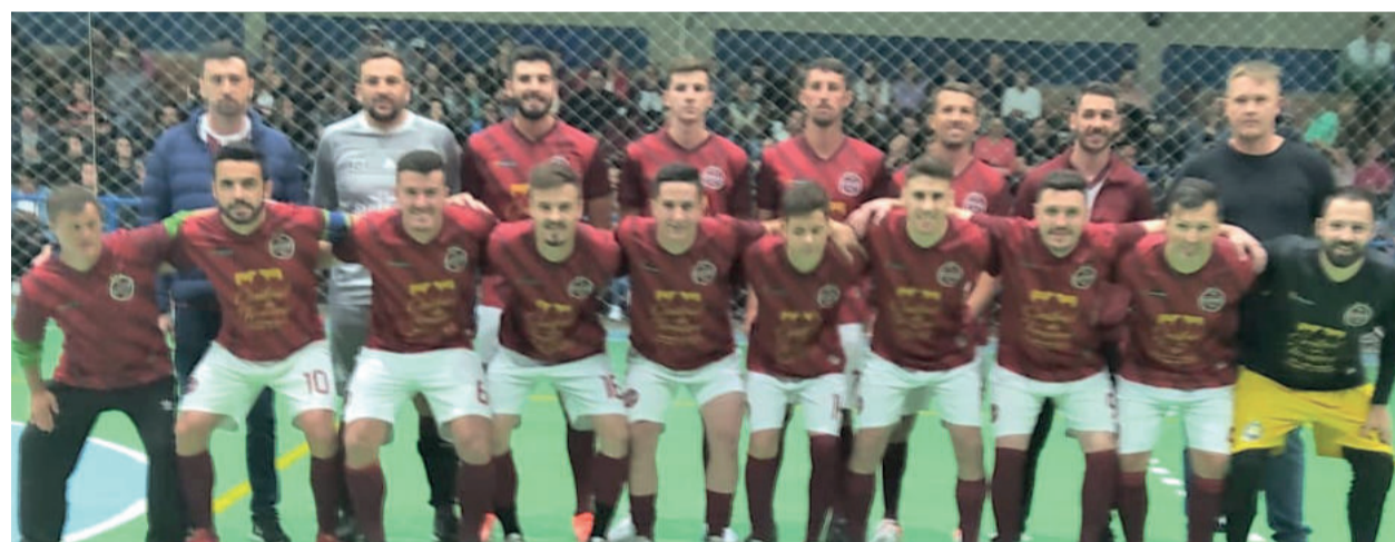
Seleção de Boa Vista do Sul