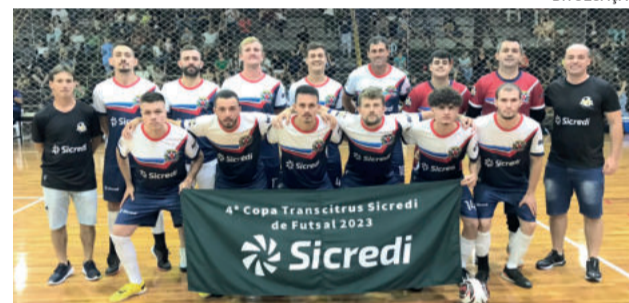
Seleção de Paverama é vice-líder, com 12 pontos