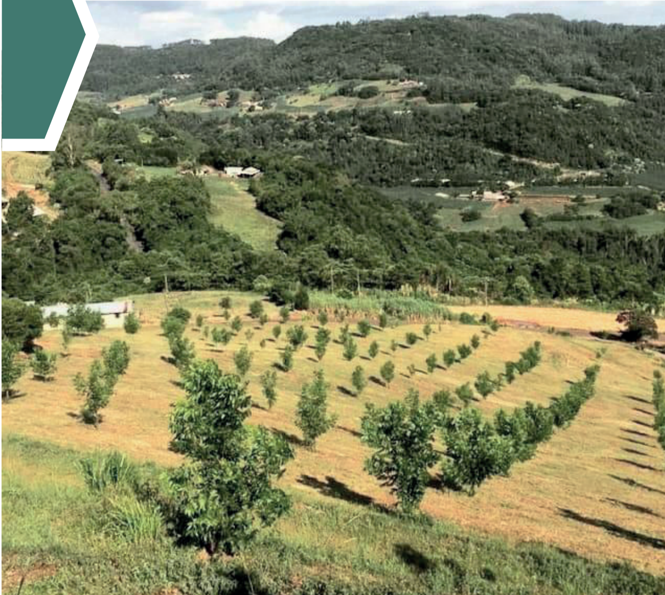
Mudas de nogueiras plantadas recebem o nome daqueles que auxiliaram no plantio