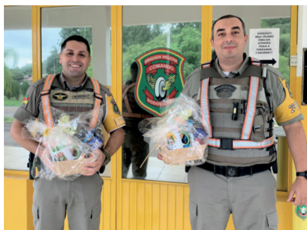
Policiais destacaram a importância do reconhecimento na profissão

“A criança com menos de um ano ainda está em desenvolvimento, é muito fraca, e se houver uma freada, ela pode quebrar o pescoço. Por isso, o equipamento deve ser colocado de costas. Então, caso houver uma redução brusca de velocidade, a criança seria ‘empurrada’ para dentro do bebê conforto, e não no sentido contrário”, orientou.