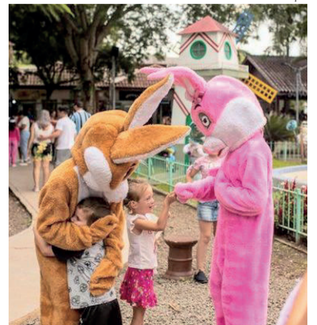
Atividades propostas encantaram as ruas do município e fizeram a alegria das crianças