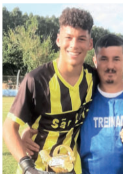
Nayeri, do São Luís