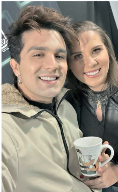
A tão sonhada foto no camarim do ídolo se tornou realidade