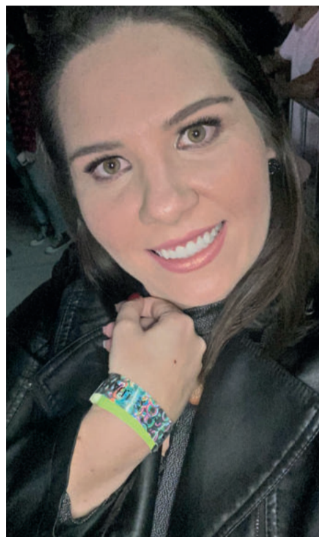
Morgana com a pulseira que esperou por 12 anos

Muito choro se seguiu enquanto conversava com a equipe. “Eu só conseguia agradecer por estarem me