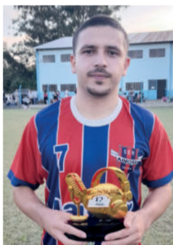
Yure, do Aimoré