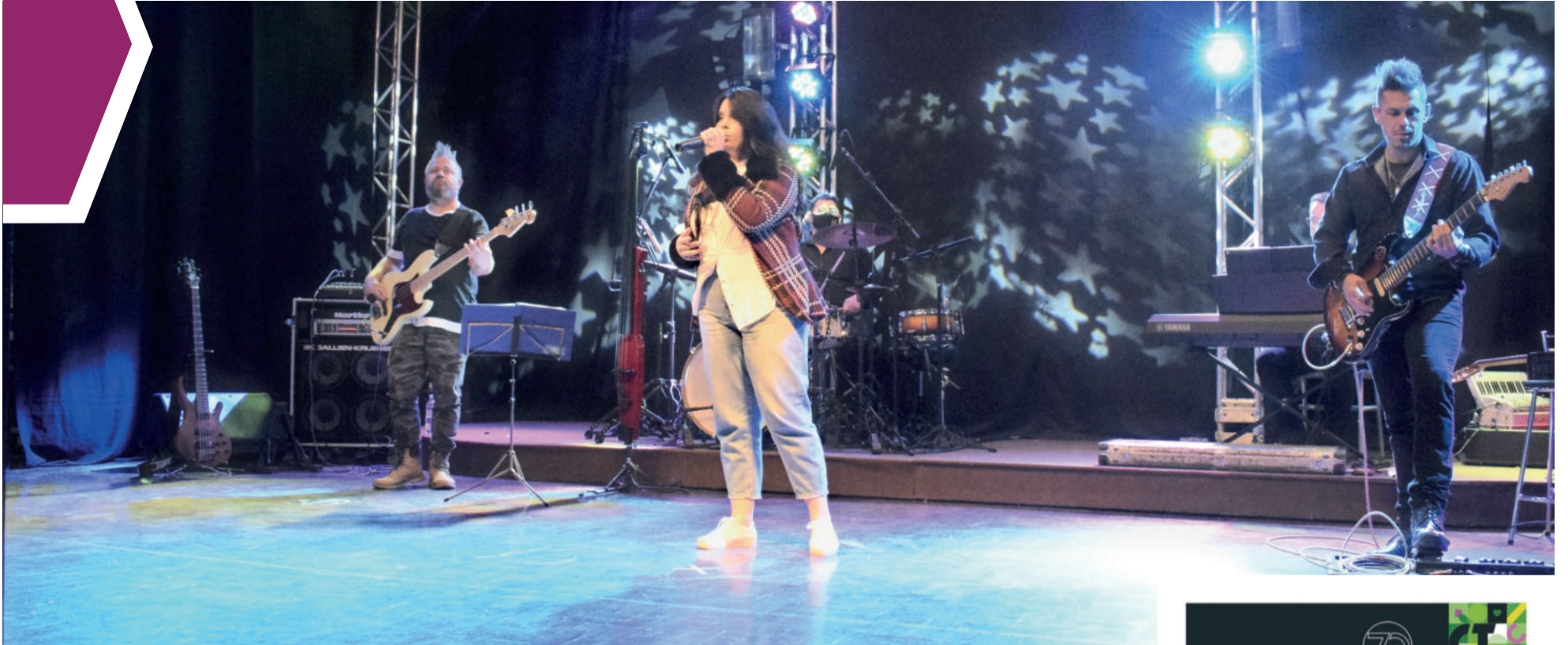
Antes do dia do evento, serão realizados encontros com a banda do Festival e o maestro para preparação dos artistas