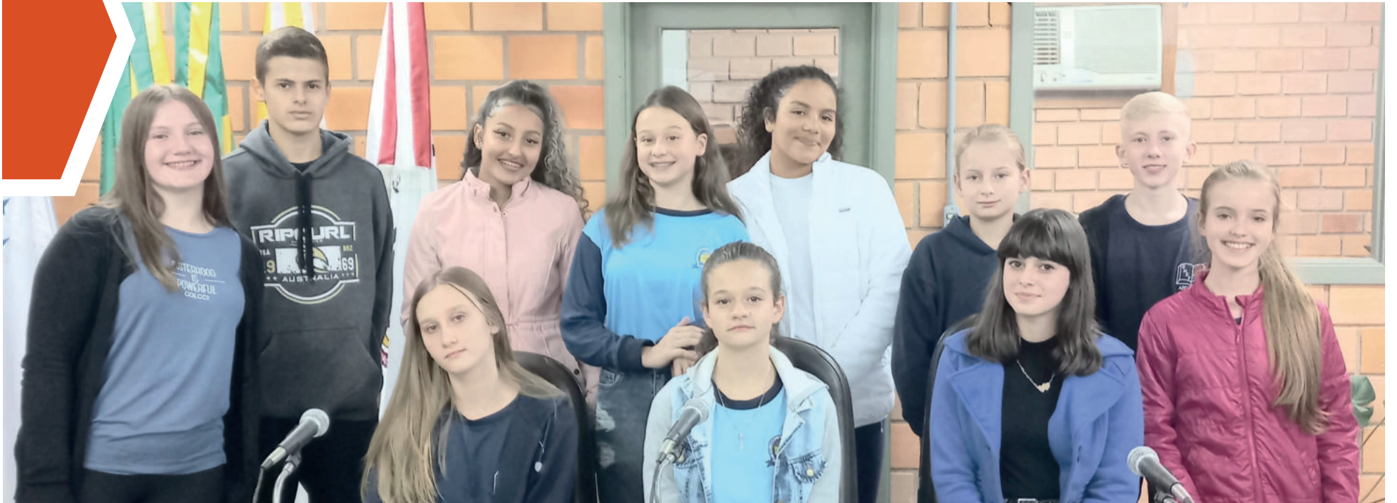
Vereadores mirins de Imigrante