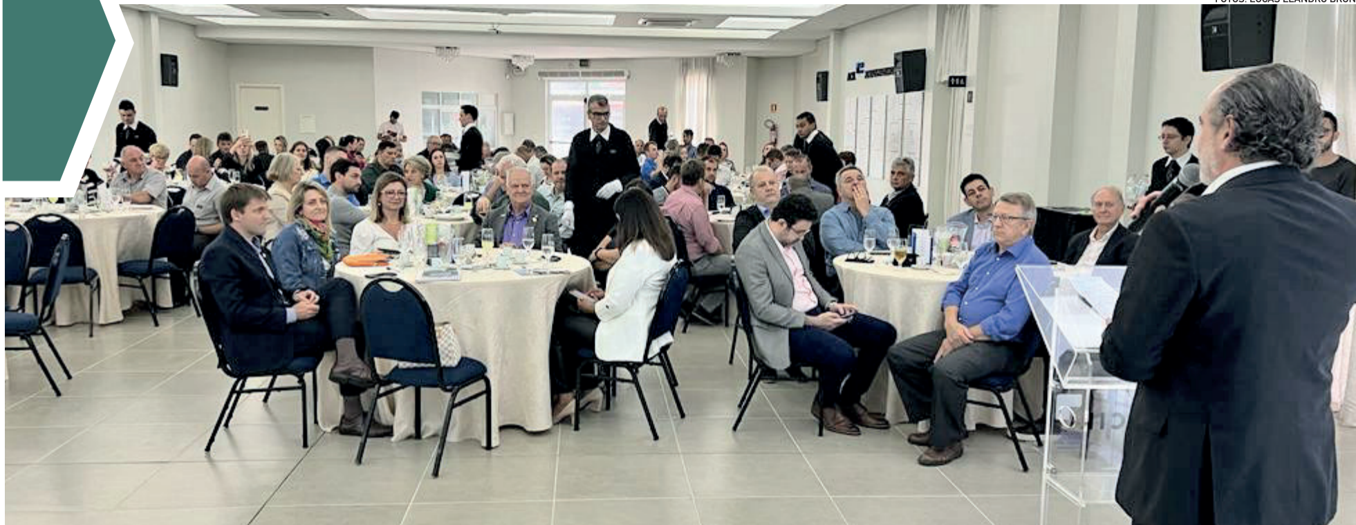
Reunião-almoço celebrou o mês do Associativismo