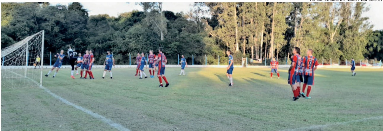
Geraldense e Aimoré empataram em 2 a 2

No segundo jogo da tarde, as redes não balançaram. Atlântico de Costão e Arroio do Ouro ficaram no 0 a 0.