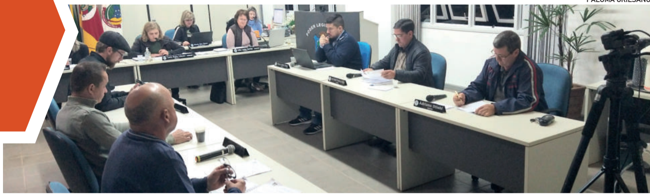
Sessão fechou o mês de maio

É hora de ajudar a Cooperativa Languiru. Até porque, o tomo pode ser grande!