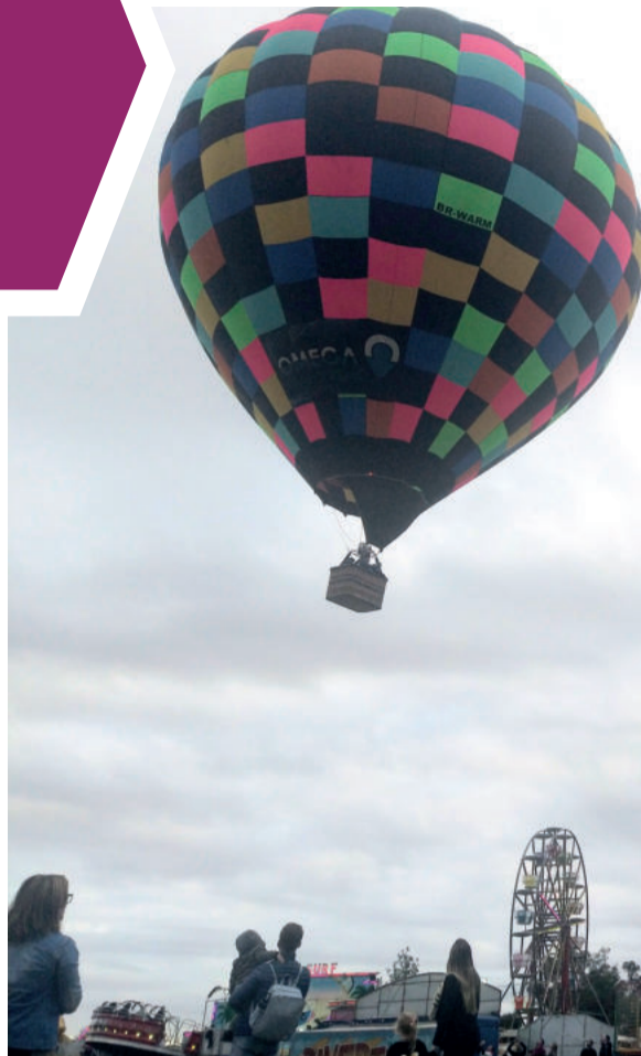
No domingo os balões sobrevoaram por Teutônia

O movimento iniciou-se. Foi dado o primeiro passo essencial a uma grande jornada.