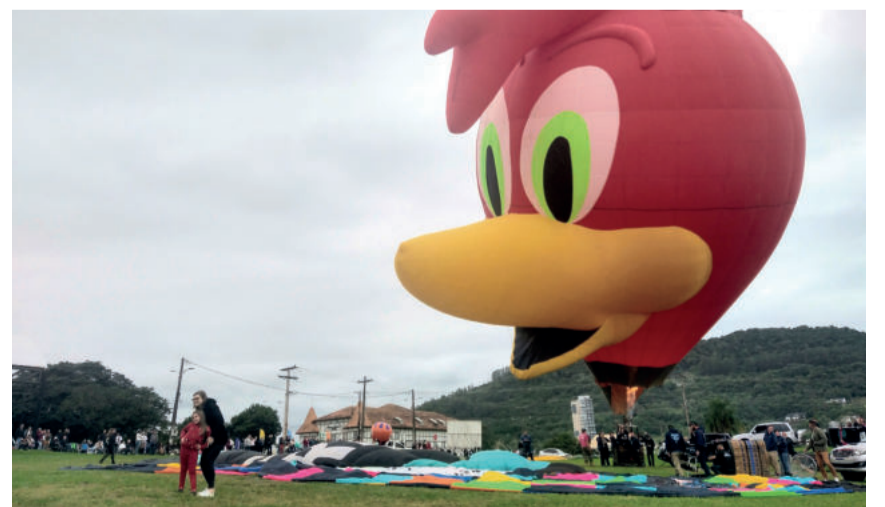
Balão em formato de pica-pau foi um dos atrativos do festival

às manobras radicais, Martins confirma que novamente haverá balões para passeios. "Para semana que vem teremos avião, caminhões, carros, shows infantis e o show nacional com os Travessos. Esperamos a população para prestigiar esse evento que fizemos pensando em todos", convida.