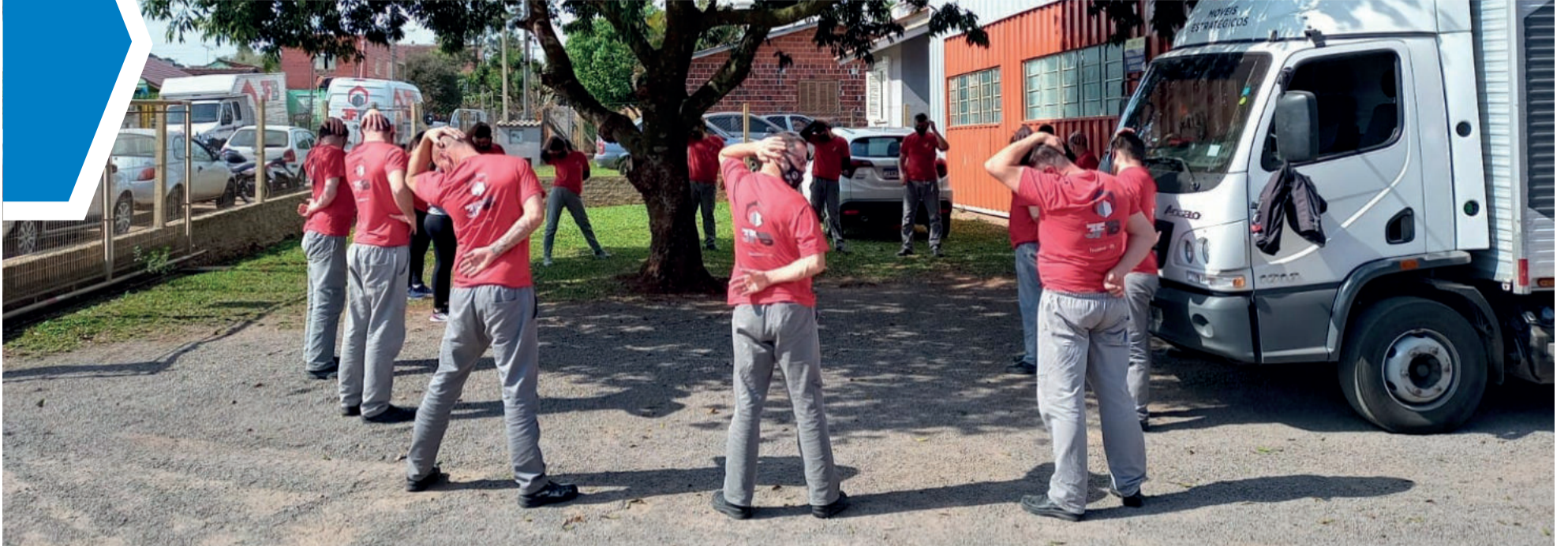
Atividades buscam contemplar o indivíduo de forma integral