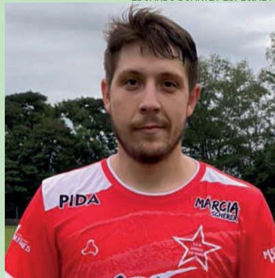
Cabelo, Arroio do Ouro