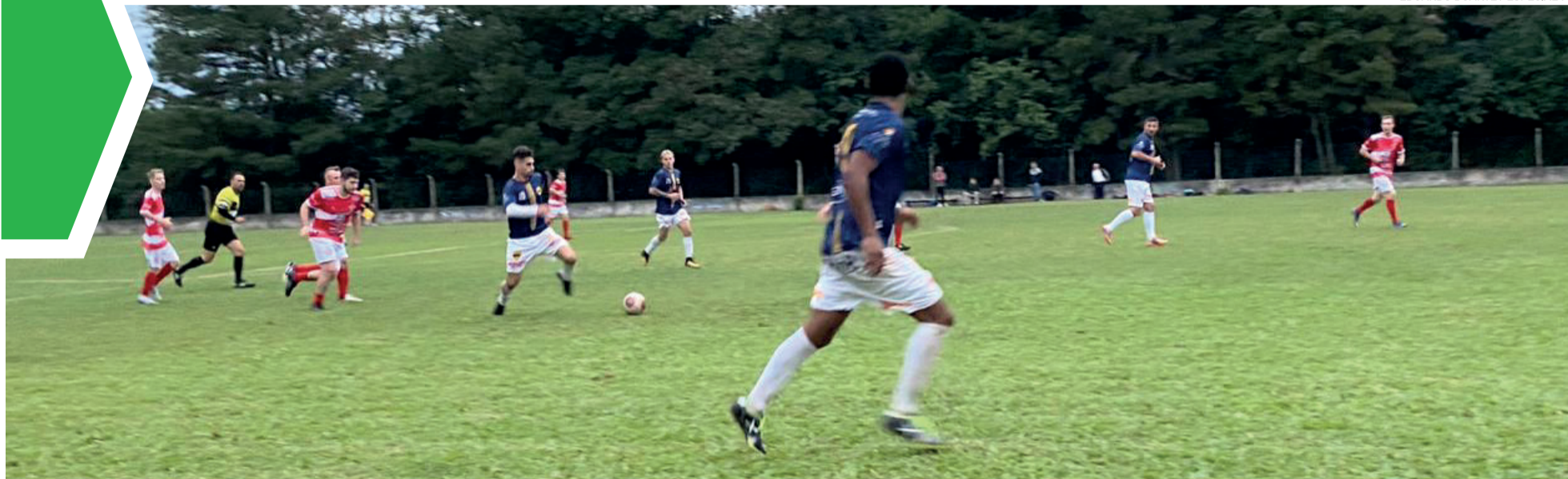
União e Arroio do Ouro fizeram o segundo jogo da tarde no Bairro Boa União. Time visitante (Arroio do Ouro) levou a melhor por 1 a 0