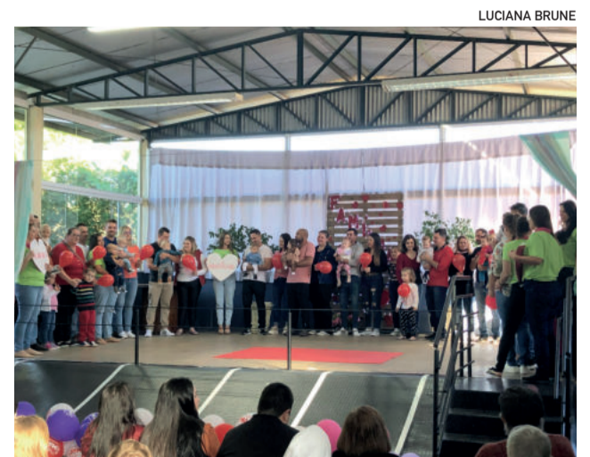
Apresentações homenagearam as famílias

Mais de mil pastéis foram comprados. Teve também venda de outros lanches, uma forma de angariar recursos para as atividades realizadas na escola. Pescaria e tudo premiado foram atrativos que também estiveram à disposição das crianças e proporcionaram diversão.