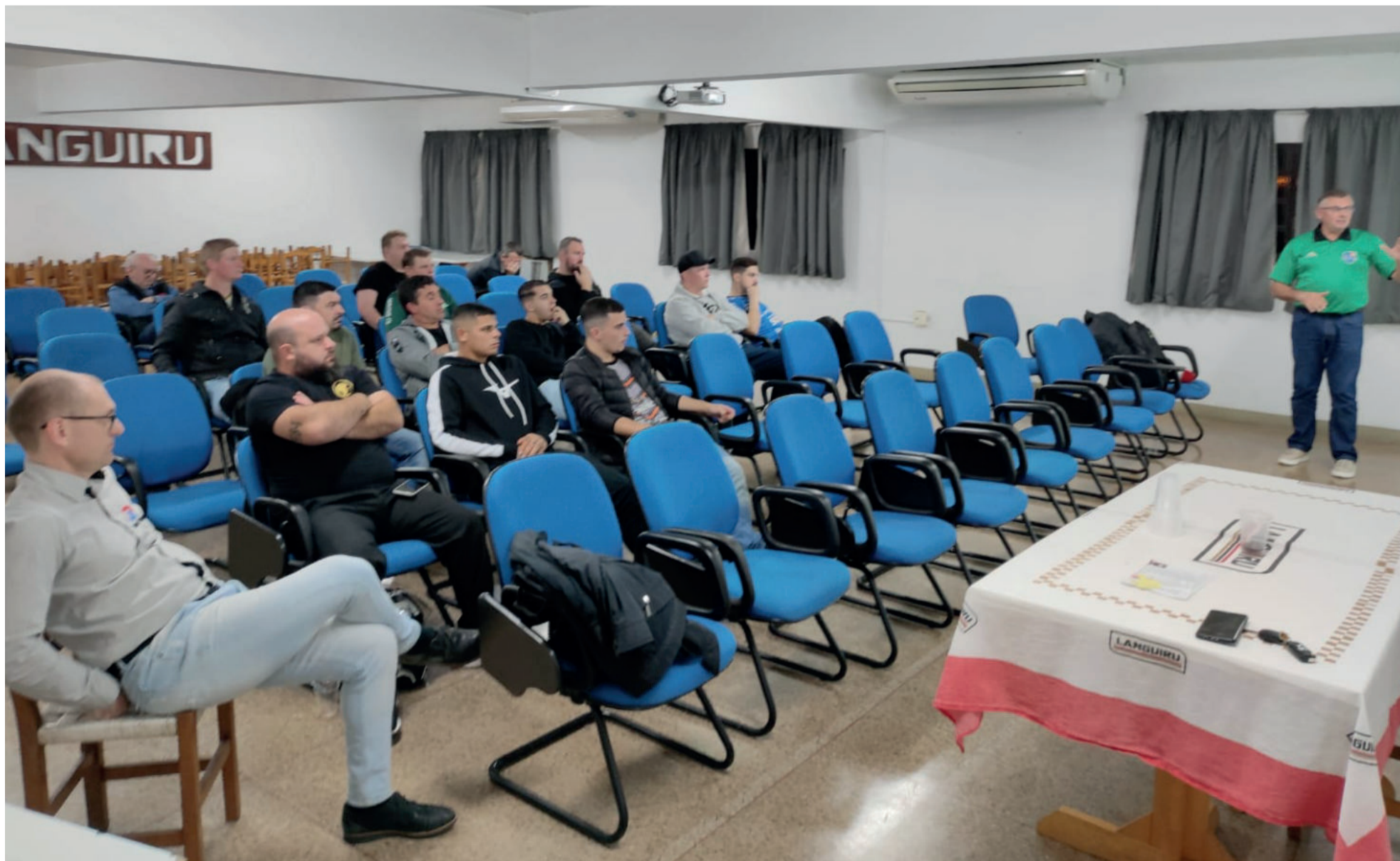
Reunião técnica contou com interessados e organização apresentou a proposta da competição