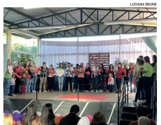
Apresentações homenagearam as famílias

Mais de mil pastéis foram comprados. Teve também venda de outros lanches, uma forma de angariar recursos para as atividades realizadas na escola. Pescaria e tudo premiado foram atrativos que também estiveram à disposição das crianças e proporcionaram diversão.