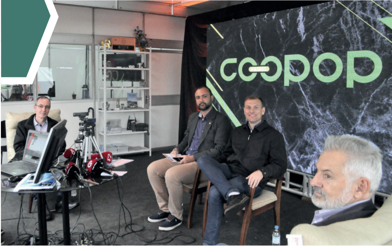
Painel Coopop foi lançado em maio do ano passado durante a Festa de Maio