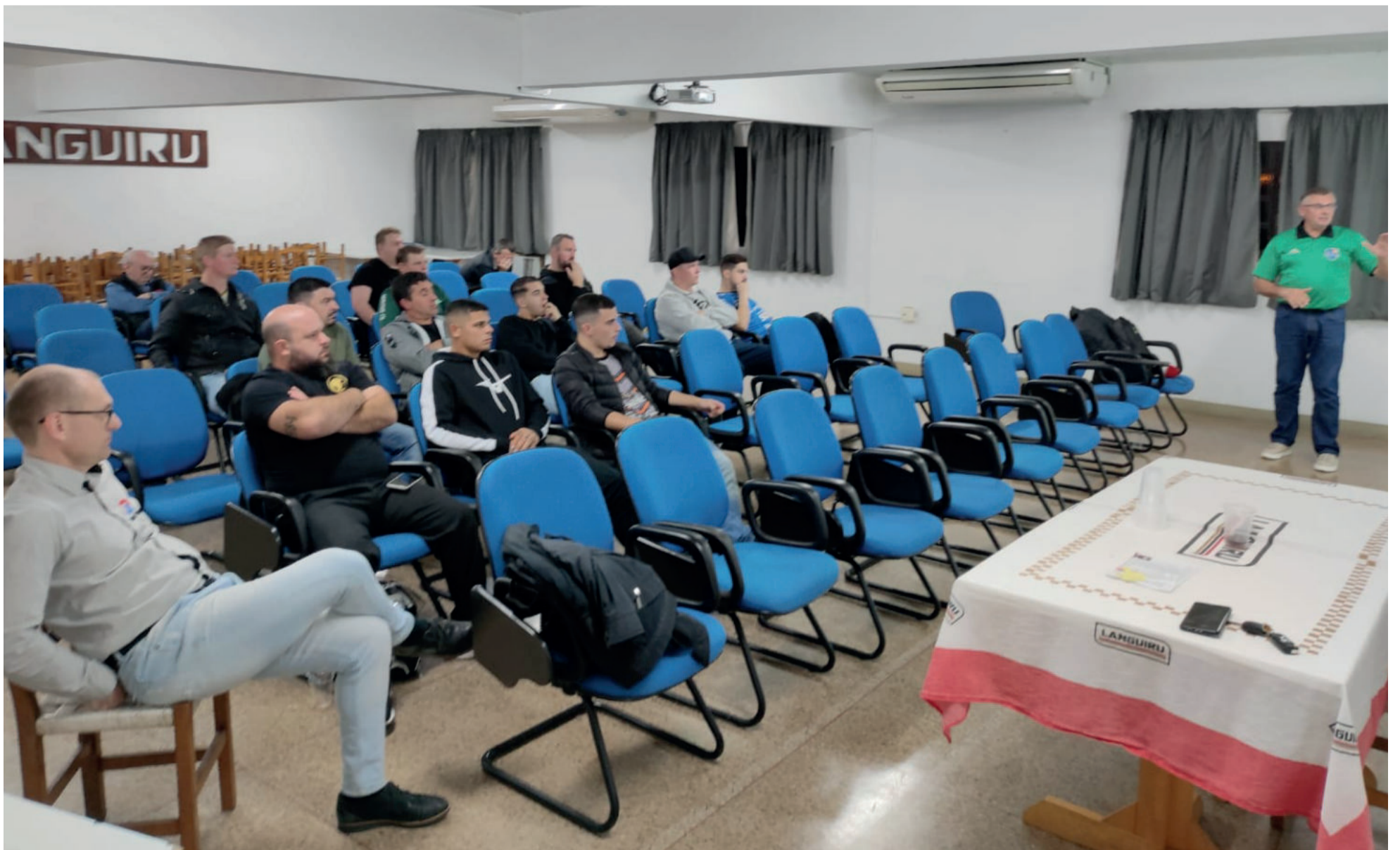
Reunião técnica contou com interessados e organização apresentou a proposta da competição