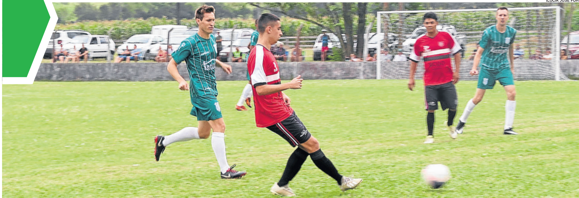
Campeonato Municipal de Teutônia para por tempo indeterminado, conforme decisão da ACAT a partir de decreto do Município