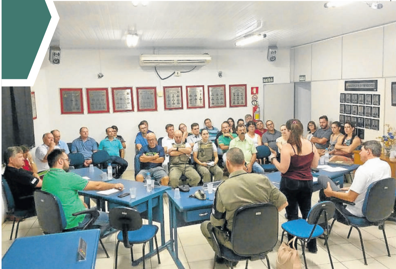
Consepro de Paverama prepara ações para captar recursos para implantar os projetos