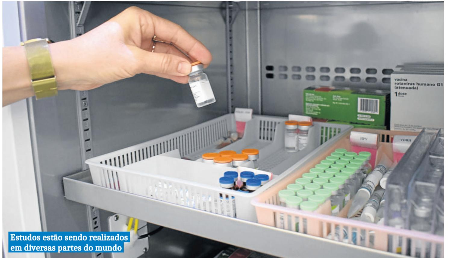
Estudos estão sendo realizados em diversas partes do mundo

Ainda não existe vacina ou tratamento aprovado para a Covid-19. Contudo, o fato de já existirem outras variações do vírus Corona no passado colabora para que as pesquisas já tivessem certo avanço. A seguir, constam alguns dos estudos realizados para o combate ao Coronavírus, ressaltando que muitos outros estão sendo realizados no mundo.