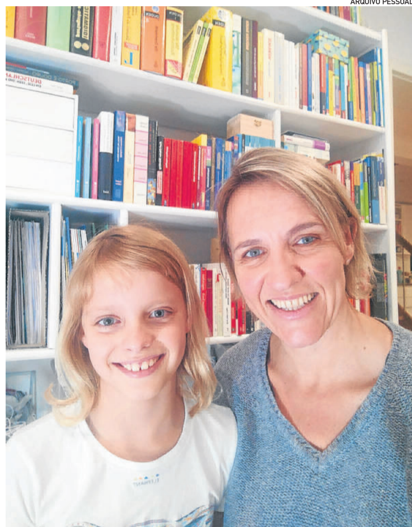
A teutoniense reside em Biberach an der Riss, na Alemanha