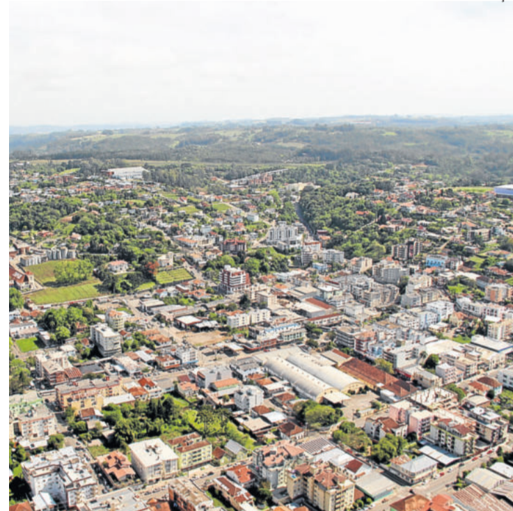
Objetivo das medidas é reduzir a circulação de pessoas