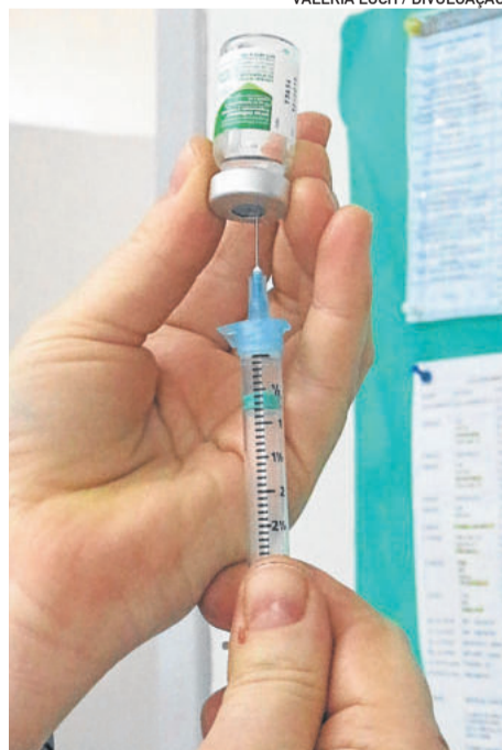
Meta é vacinar 13 mil pessoas em Garibaldi