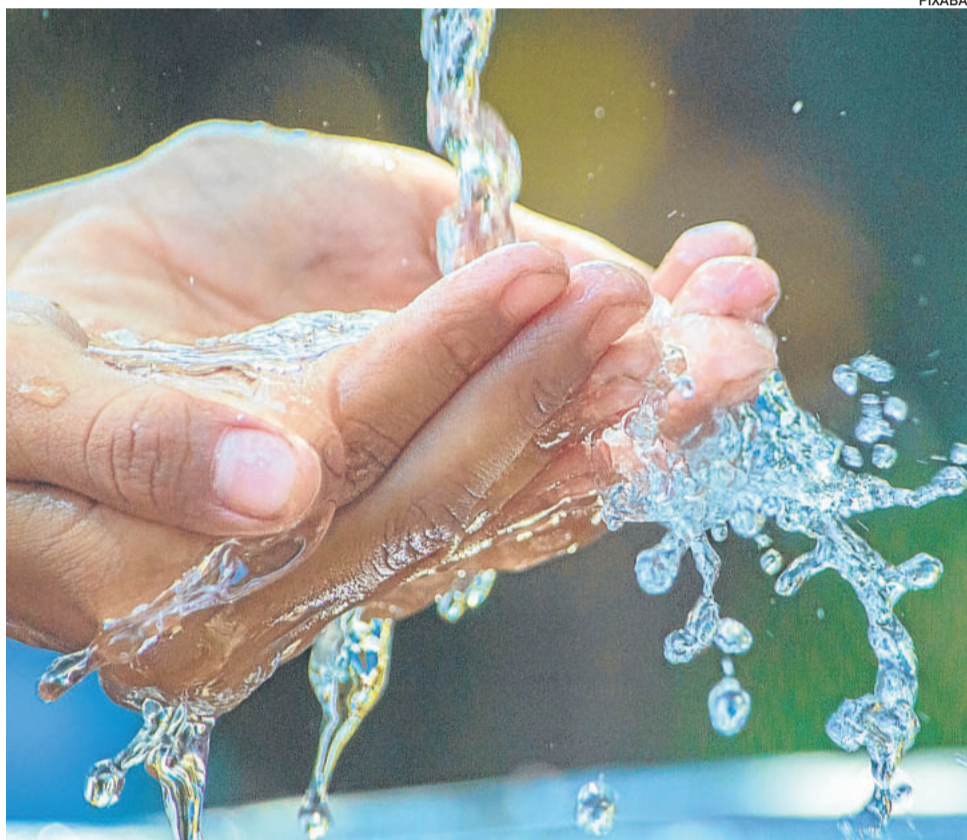
A lavagem pode ser feita com sabão comum, sabonete e inclusive detergentes

Algumas pessoas acharam, inicialmente, exagerada a medida de suspender e cancelar aulas. A médica explica que este foi um momento crucial para reduzir ou até evitar a propagação do vírus. “Foi uma medida não apenas para evitar que as crianças adoeçam, mas principalmente que elas não se tornem difusoras da transmissão. Sabe-se que na média as crianças sentem menos os sintomas e reagem melhor, e parecem não ser tão afetadas, no entanto, nas escolas elas brincam juntas, compartilham materiais, se abraçam, trocam brinquedos e objetos, e assim ocorre uma fácil disseminação. Mesmo não apresentando sintomas elas podem acabar contaminando as pessoas da casa e aí a preocupação maior são os avós, que estão no grupo de risco. Sabe-se que é difícil controlar as crianças menores, pois elas acabam brincando, pegando coisas do chão, é difícil limitar estas atitudes naturais da criança. Por isso a medida foi necessária”, reforça.