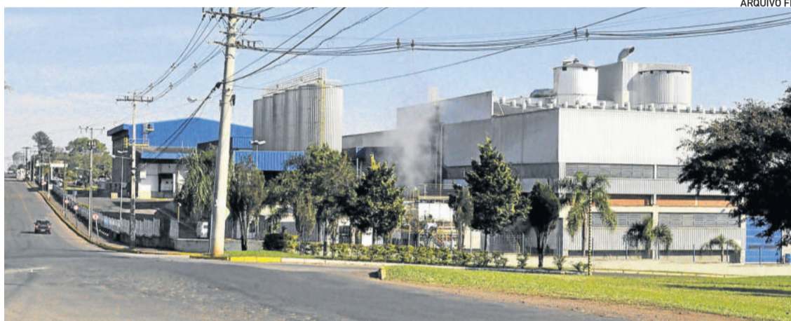
Com sede na França, e conhecendo a realidade europeia, Lactalis aplicou diversos protocolos

Da mesma forma, farmácias também mantêm atendimento. A Farmácia Languiru anunciou que, durante este período de combate ao coronavírus, manterá a farmácia junto ao Hospital Ouro Branco com atendimento 24h.