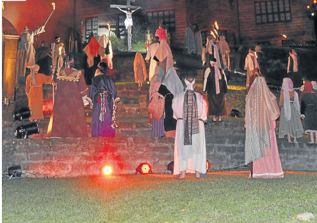
Espectáculo realizado em 2019

Tenho toda a certeza que essa pandemia veio para demonstrar o que já sabemos: as coisas simples da vida são as que nos salvam, nos mantêm saudáveis de corpo e mente e garantirão a nossa longevidade.