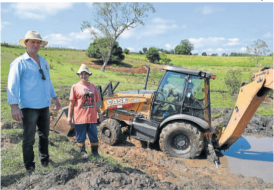
Através do programa de incentivo já foram abertas 15 valas para armazenamento de água