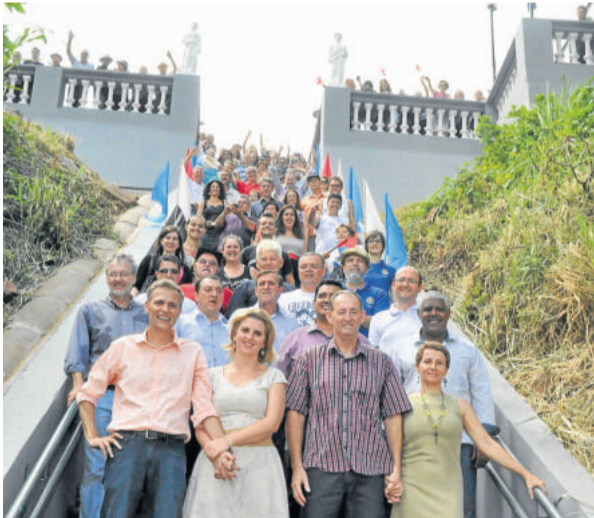
Comunidade reconstituiu foto feita em 1924, quando foi inaugurada a escadaria