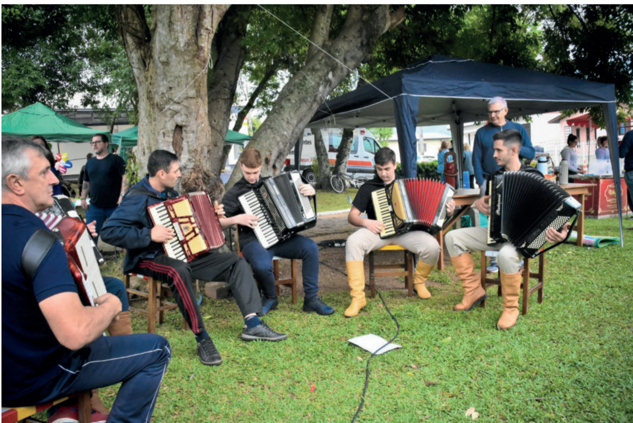
Vários artistas se apresentaram ao longo do domingo

Ns segunda-feira (22/5) houve programação voltada às escolas, com cinema 3D e brinquedos.