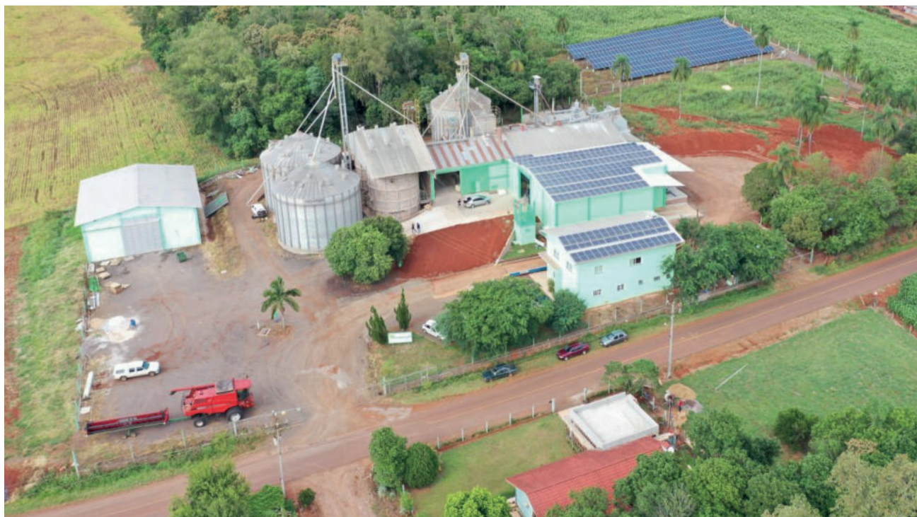
Fábrica de Rações da Cooperagri opera na capacidade máxima