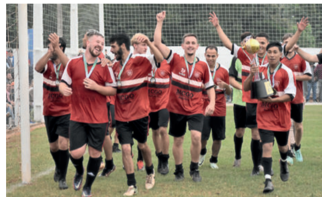
União da Germano fez a volta olímpica com a taça