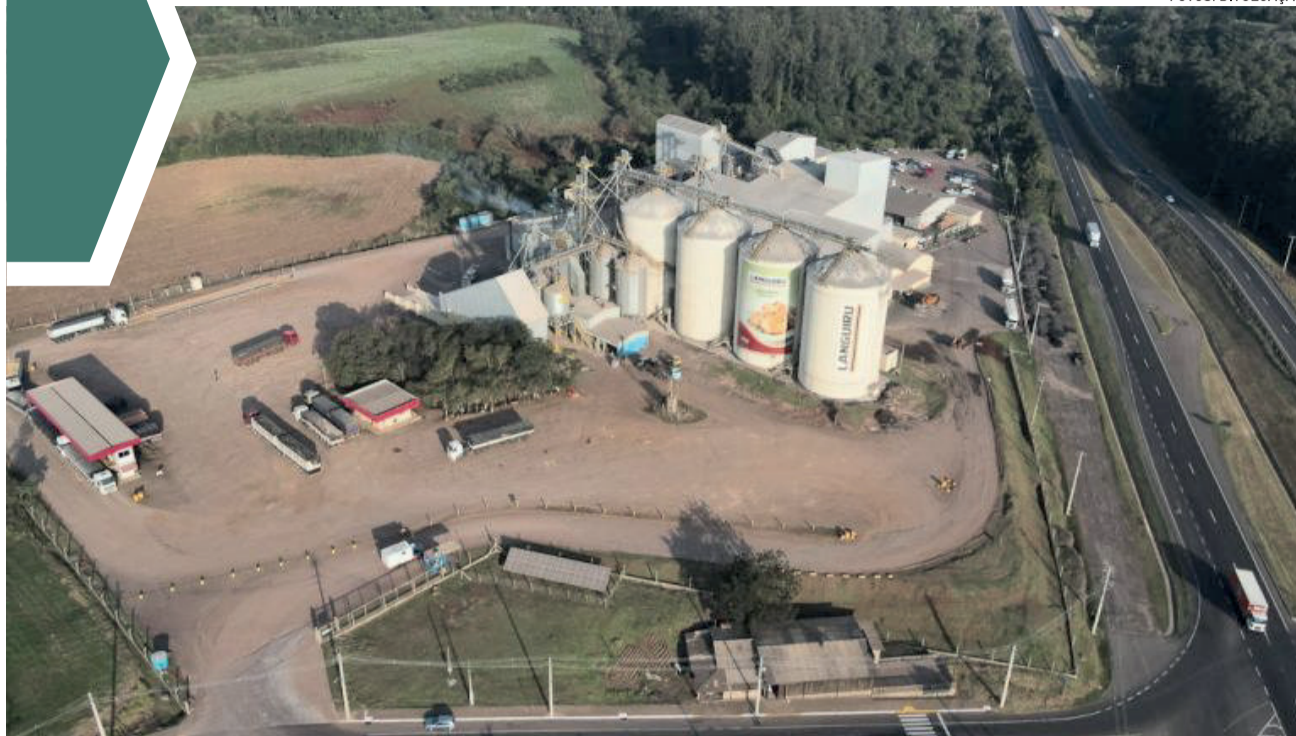
Fábrica de Rações da Languiru suprirá demanda de produção da Cooperagri