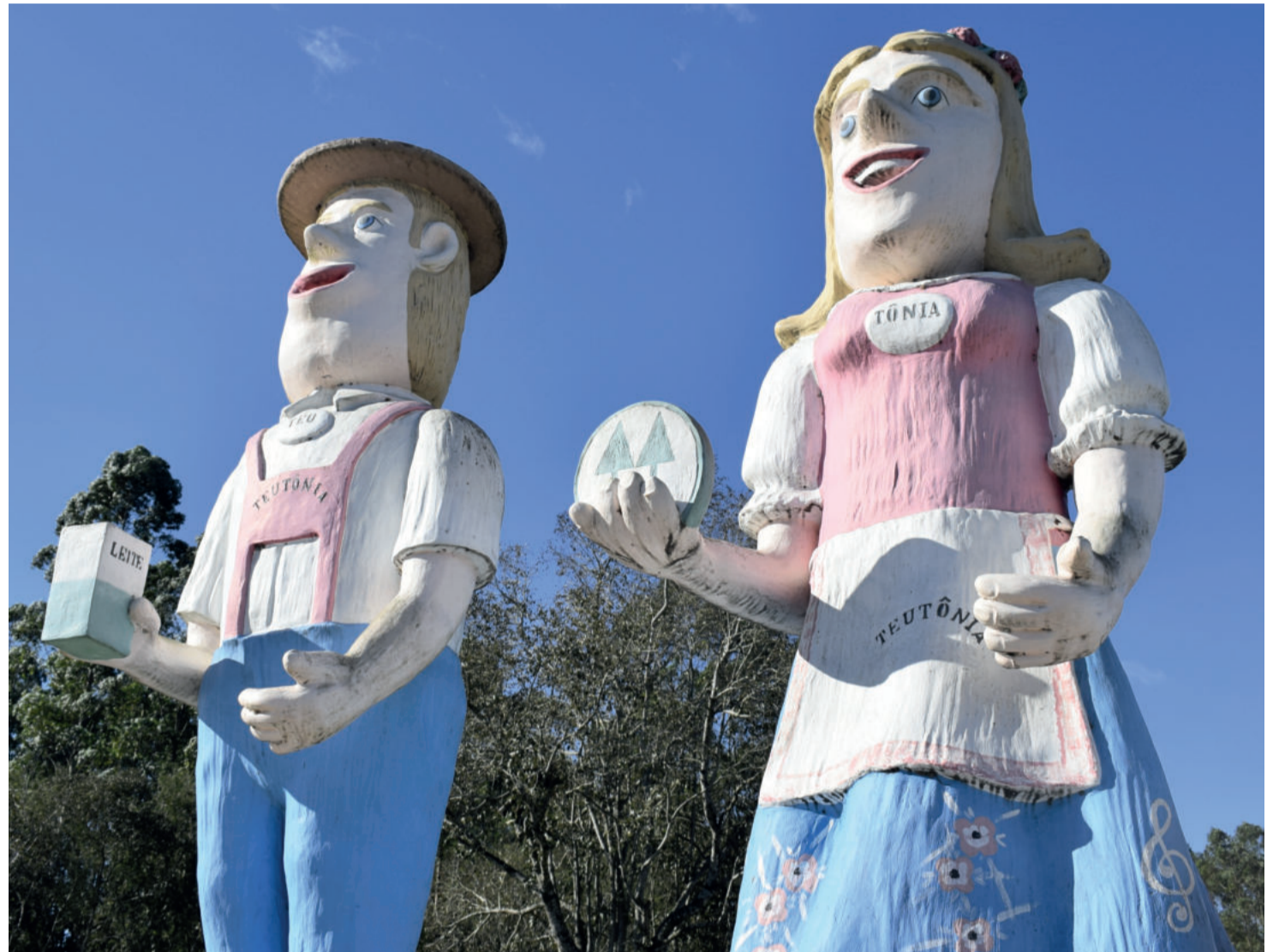
O cooperativismo evidenciado já na entrada de Teutônia com os bonecos Teu e Tônia