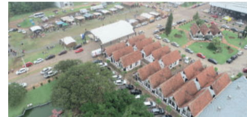
Teutônia chega aos 42 anos colhendo frutos de sementes plantadas em sua emancipação

tidades e cooperativas, será possível atrair novos associados e motivá-los a seguir defendendo o movimento voluntário, buscando um desenvolvimento sustentável.