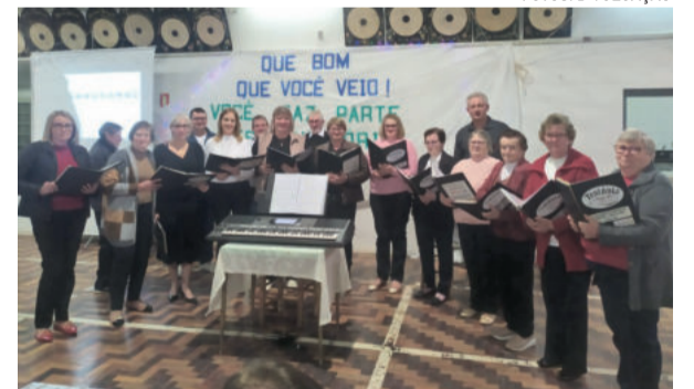
Coro Misto tem 133 anos de história