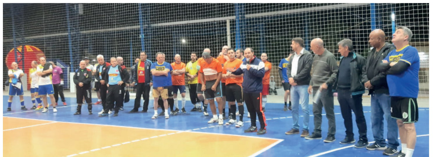
Atletas prontos para a partida inaugural