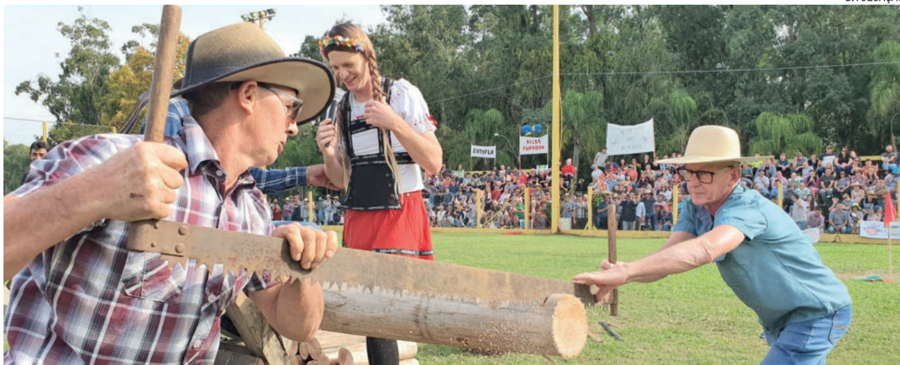
As provas inusitadas fazem referência às tarefas rurais