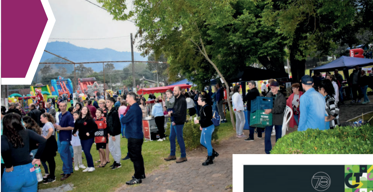
As atividades ocorreram na praça Henrique Brückner