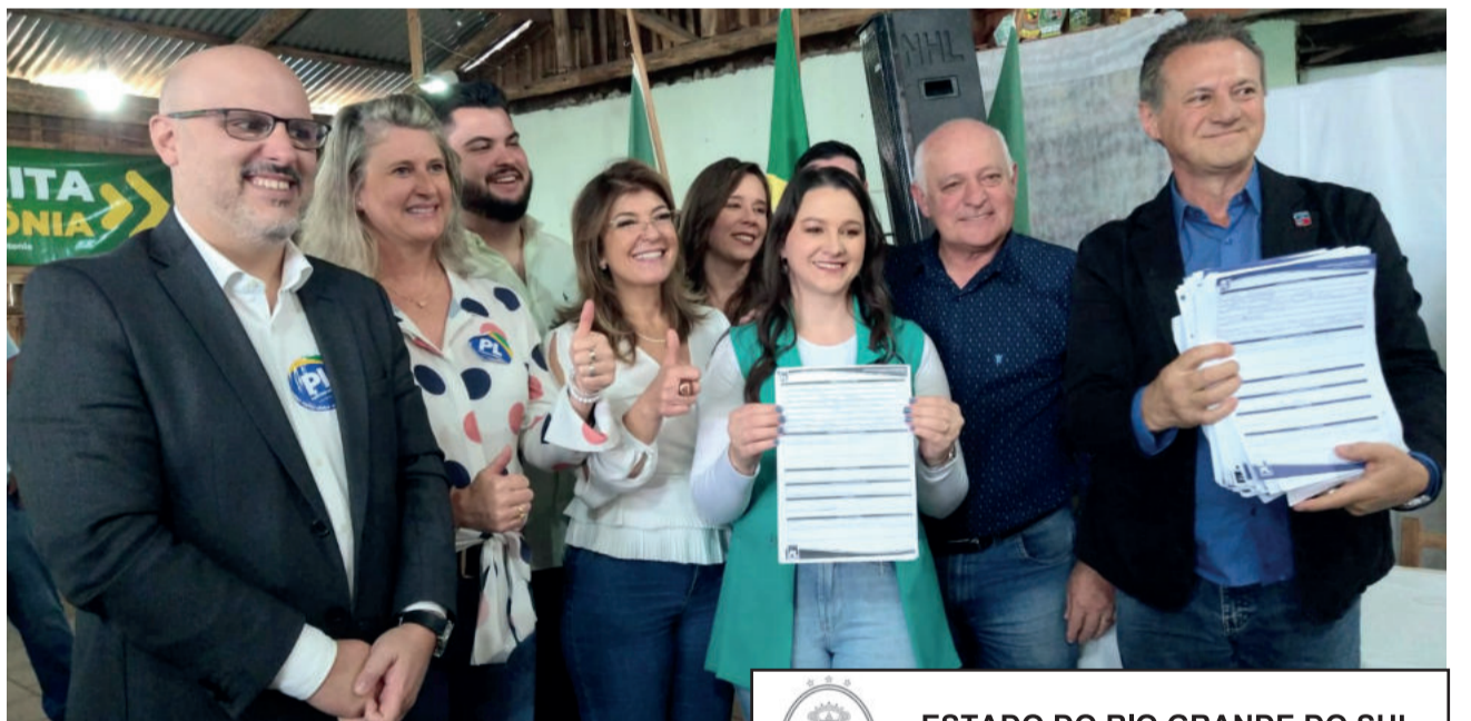
Filiação da vice-prefeita foi o principal ato realizado no evento

Ela destacou e agradeceu a acolhida do presidente estadual do PL. “Fazer um partido grande se faz com pessoas que acreditam que é possível melhorar o ambiente em que vivemos. Alguns vão botar seu nome à disposição, outros vão fazer política na comunidade, nos campos de futebol, nas entidades. A gente precisa cada vez mais que as pessoas falem de política dentro de suas casas. Isso faz ter mais conhecimento e exigir dos políticos mais resulta-