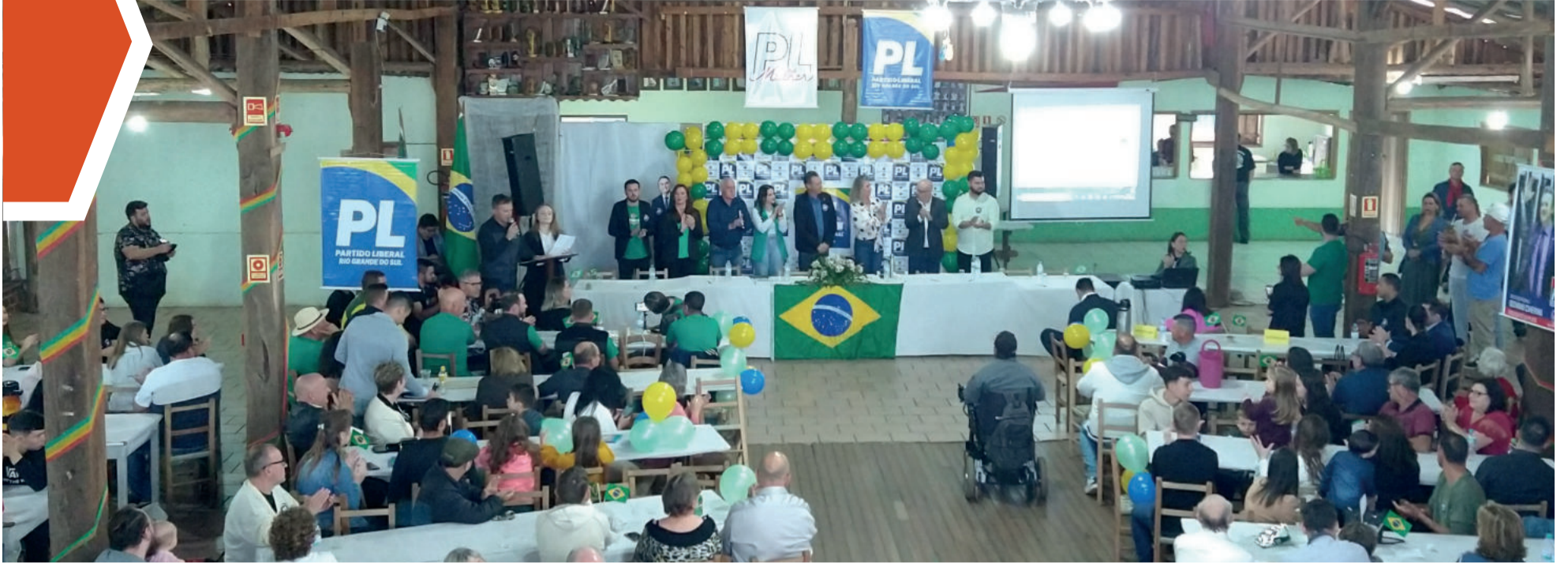
Evento foi realizado no CTG Porteira dos Pampas