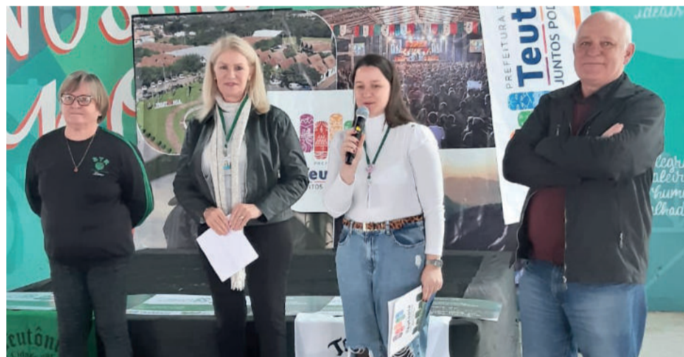
Administração anuncia Pacote Agrícola de R$ 1,1 milhão

O valor do subsídio é apurado com base no valor adicionado do exercício anterior ao da concessão, conforme relatório apresentado pelo Setor de ICMS da Administração Municipal, de acordo com o levantamento efetuado até 15 de março, do exercício da concessão.