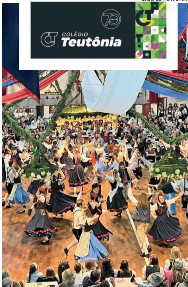
No próximo sábado (27/5) ocorre o 2º Baile Típico do 56º Festival do Chucrute

15h: 2º Café Colonial do 56º Festival do Chucrute