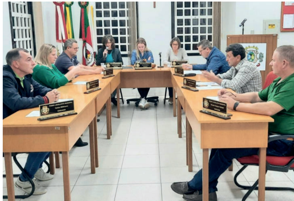
Vereadores se reuniram na última sessão do mês de maio