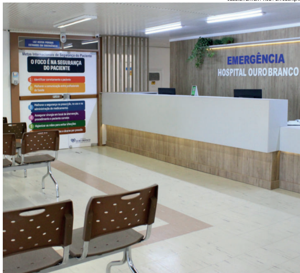
Segundo o hospital, média ideal seria de até 85 atendimentos/dia