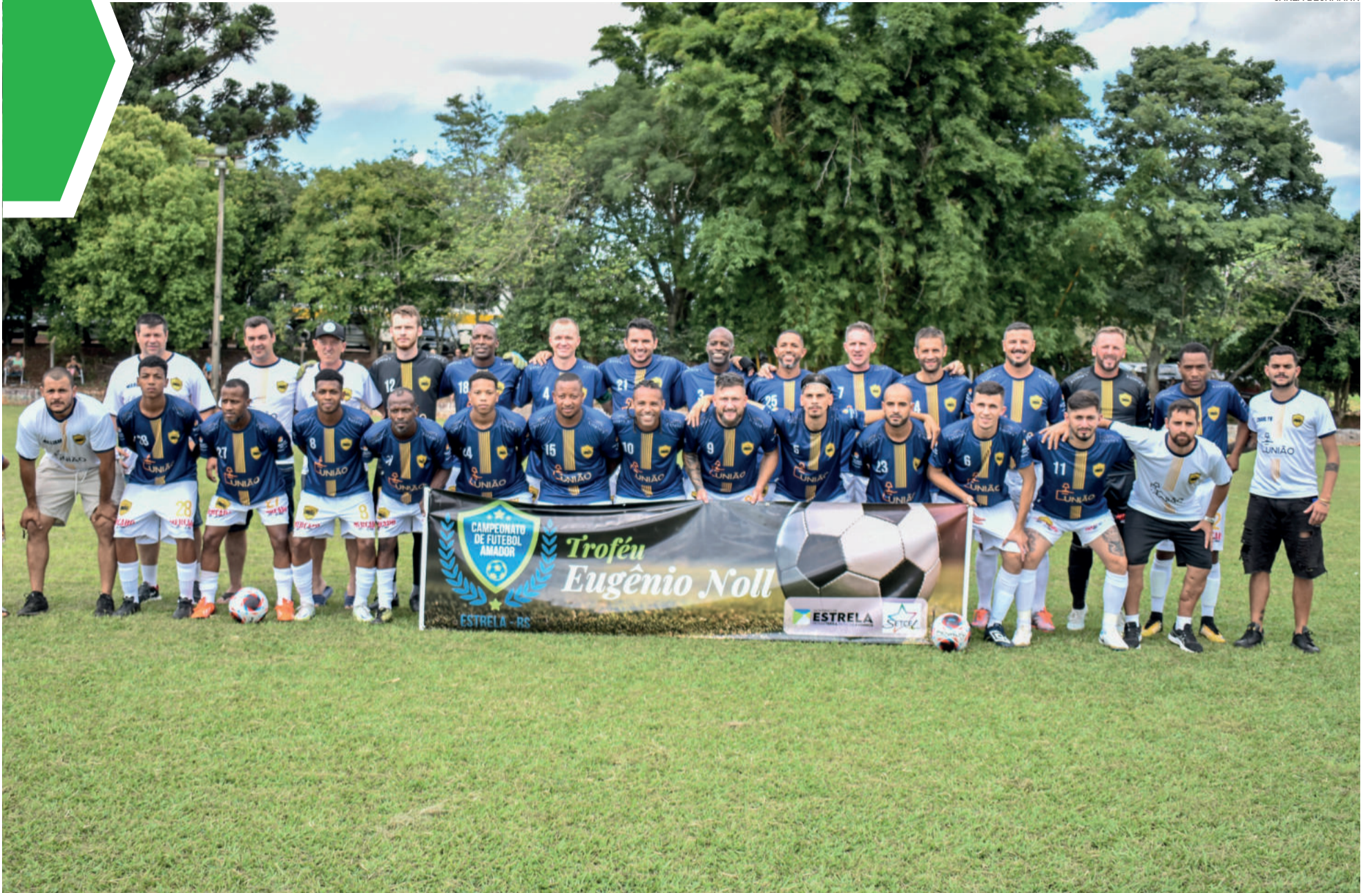
São Luís voltou a vencer e bateu o Aimoré fora de casa