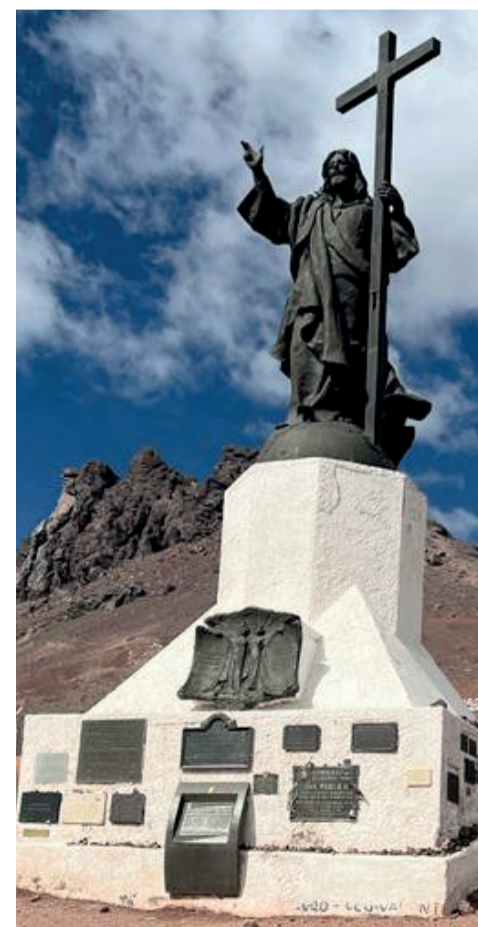
Cristo Redentor de Los Andes