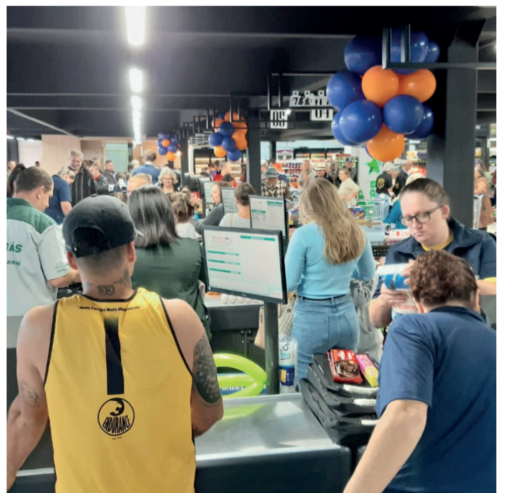
Supermercado possui diversas caixas à disposição dos clientes

32 municípios da região com mais de 60 lojas representadas. Os horários de atendimento serão de segunda a sábado das 8h30 até as 20h. E aos domingos, das 8h30 até às 11h30, e a tarde das 16h até as 19h.