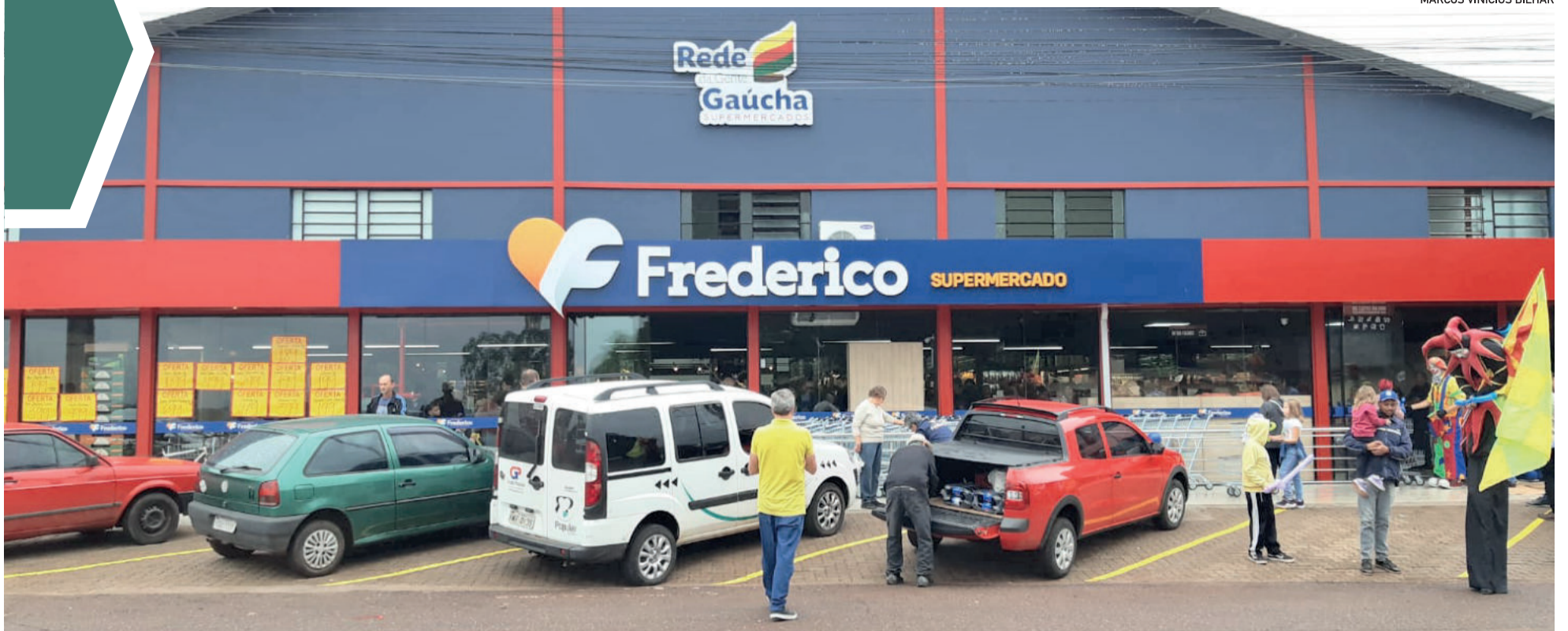
Supermercado inaugurou na quarta-feira (3/5)