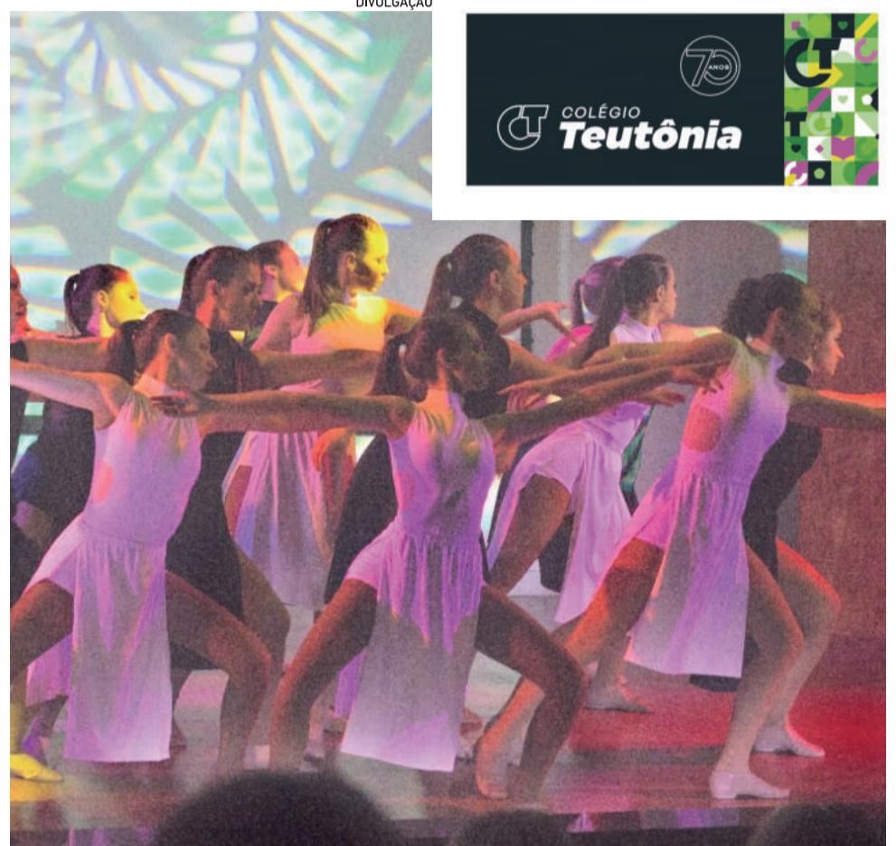
Coreografia apresentada no Espectáculo dos 25 anos do Grupo

O Festival de Dança de Joinville é um dos mais tradicionais do Brasil e é conhecido no mundo todo, não só pelas apresentações de companhias renomadas, mas também pela quali-