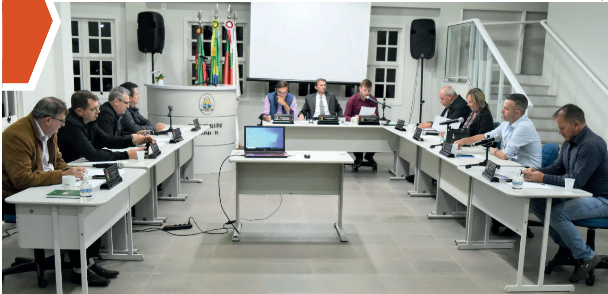
Primeira sessão do mês ocorreu na terça-feira (2/5)

TEUTÔNIA ▶ FINANCIAMENTO DE R$ 15 MILHÕES