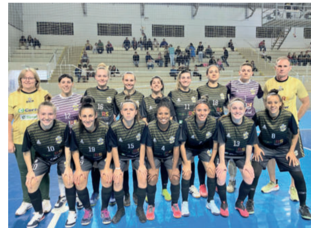
Elenco feminino da Teutônia Futsal

Acompanhe o Terceiro Tempo / Confraria Brune nesta segunda-feira (8/5) das 19h às 21h