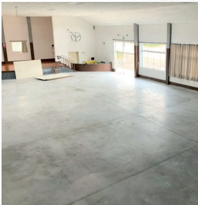
Piso foi polido em ambos os andares