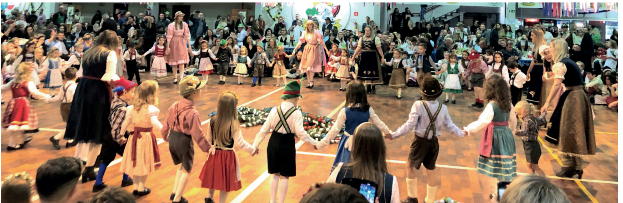
Crianças também se apresentam nos Bailes do Chucrute