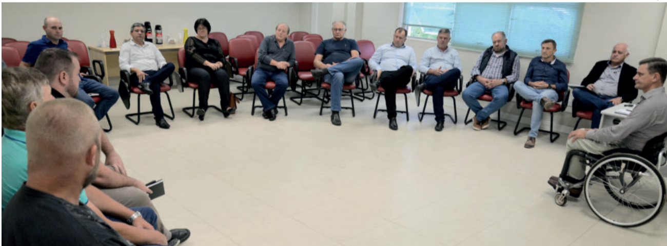
Prefeitos do G7 estiveram reunidos com conselho administrativo da Languiru