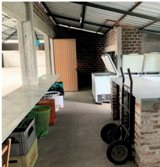
No pavilhão, copa foi ampliada