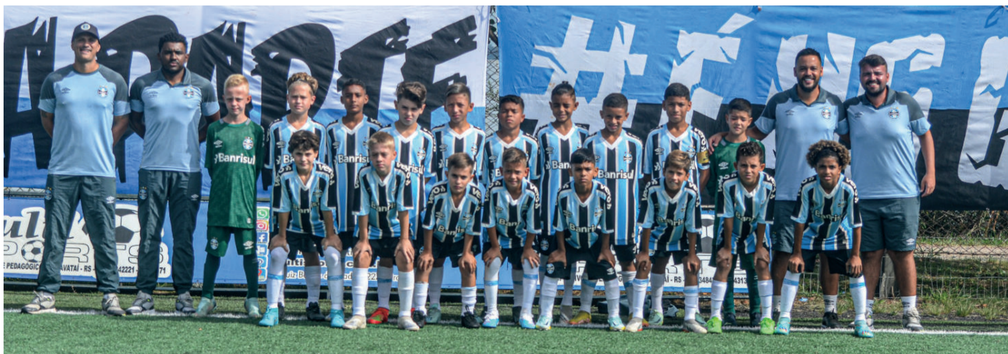
Elenco Sub-10 (2013) da base do Grêmio

Sintonize na 96.9 e também no Youtube e Facebook