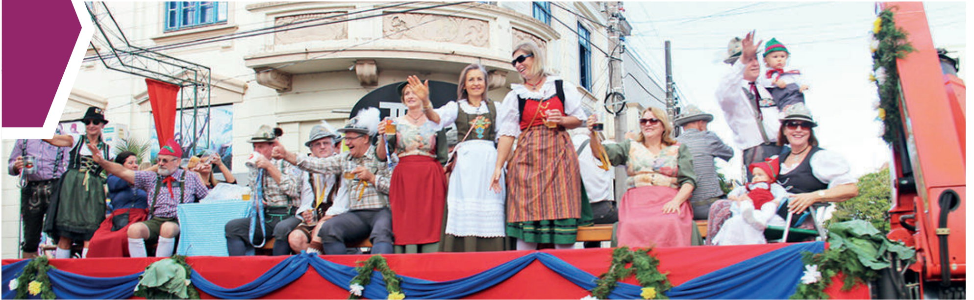
Momento tradicional é aguardado por dançarinos e comunidade