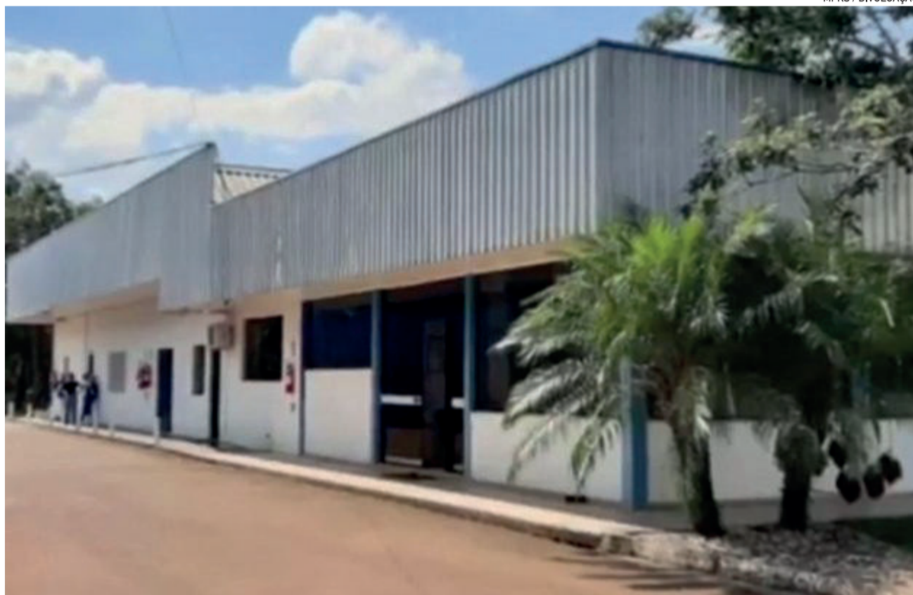
A Latvida pertence à Indústria de Alimentos Estrela