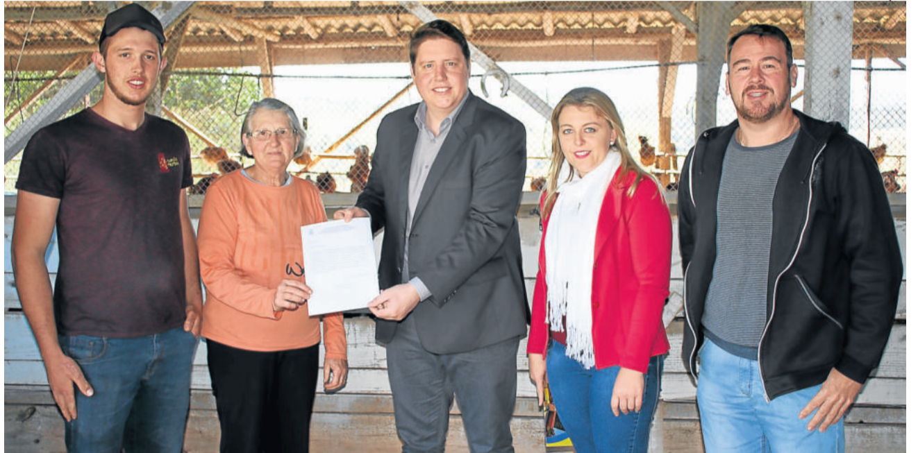
Granja Ovos Coloniais Kocoricó recebeu o selo do Susaf no mês de setembro