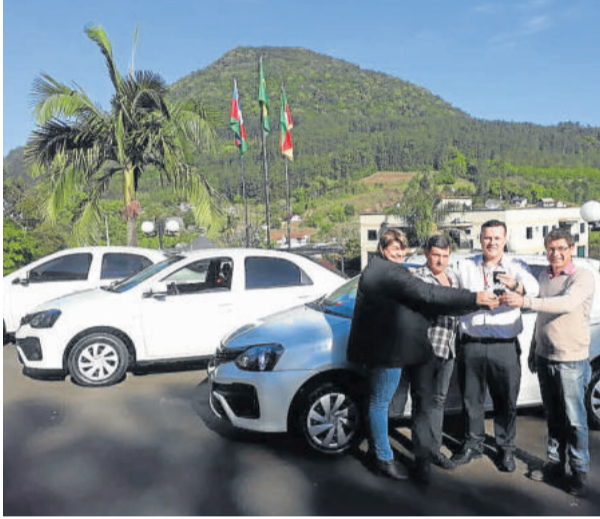
Três novos veículos foram entregues ao Município