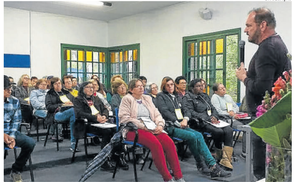
Cerca de 60 pessoas da comunidade participaram da Conferência de Assistência Social