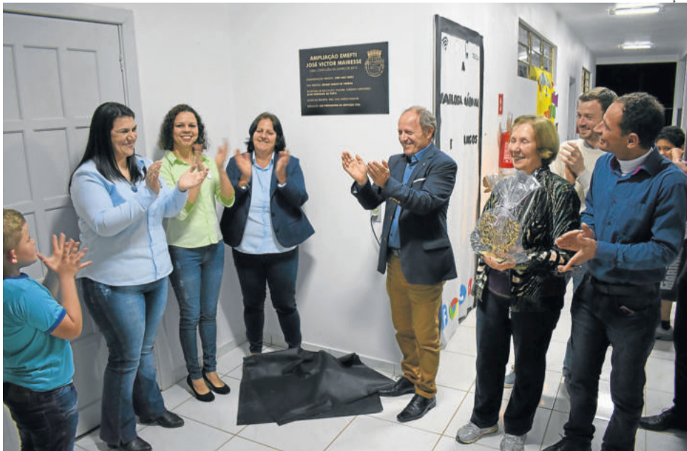
Cerimônia de inauguração aconteceu na terça-feira (24/09)