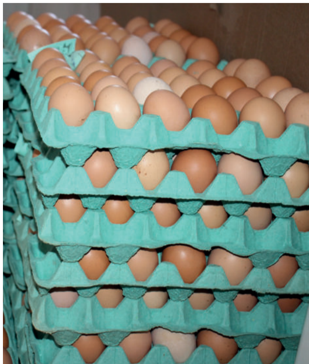
A granja está em atividades desde 2014 e possui uma produção diária de 2.800 ovos coloniais

Desde o início de 2017, atendendo a solicitação das agroindústrias, a Secretaria de Agricultura também iniciou os trâmites para a adesão ao Susaf. Houve duas auditorias da Secretaria Estadual de