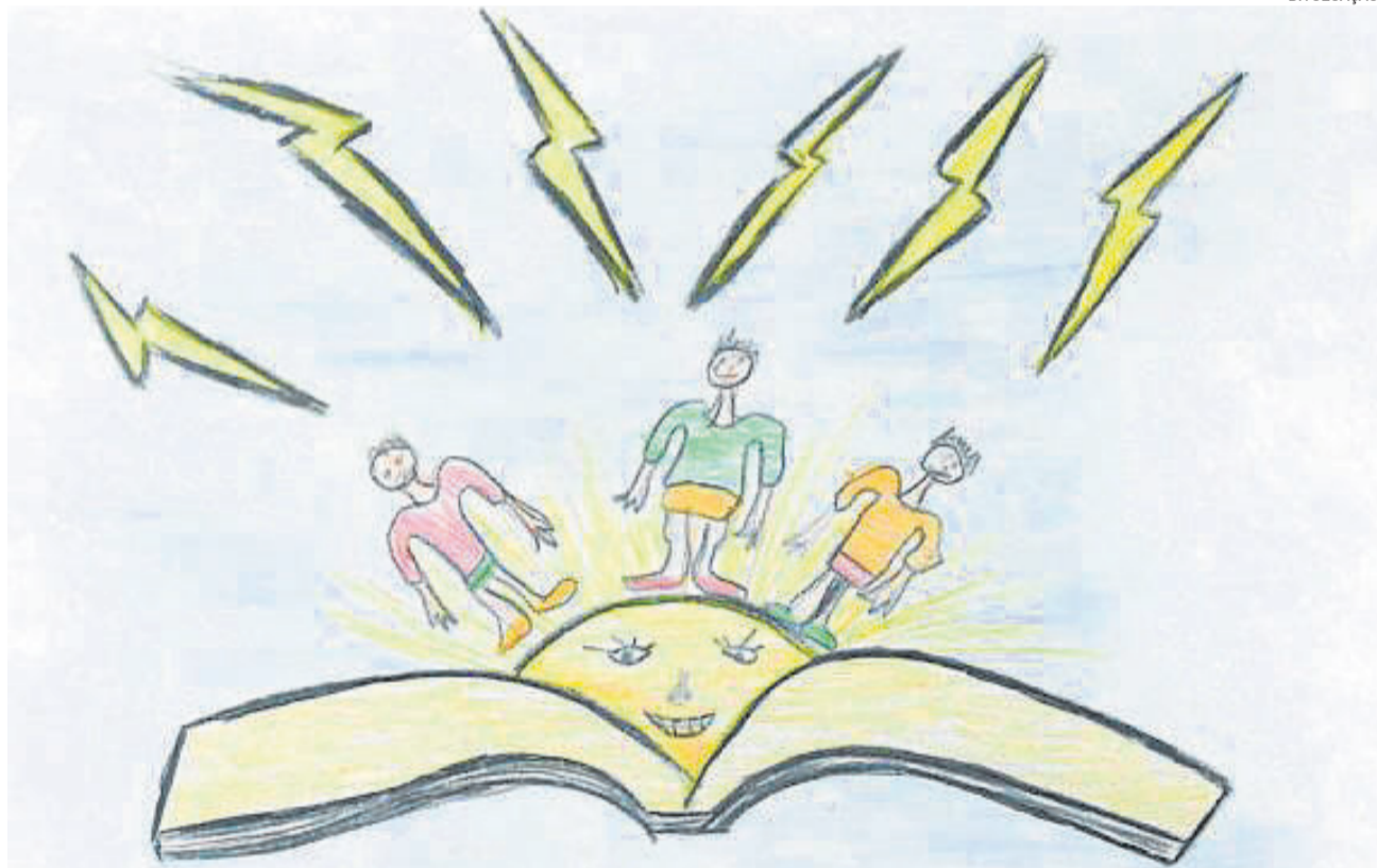
Logo vencedora do concurso para divulgar a Feira