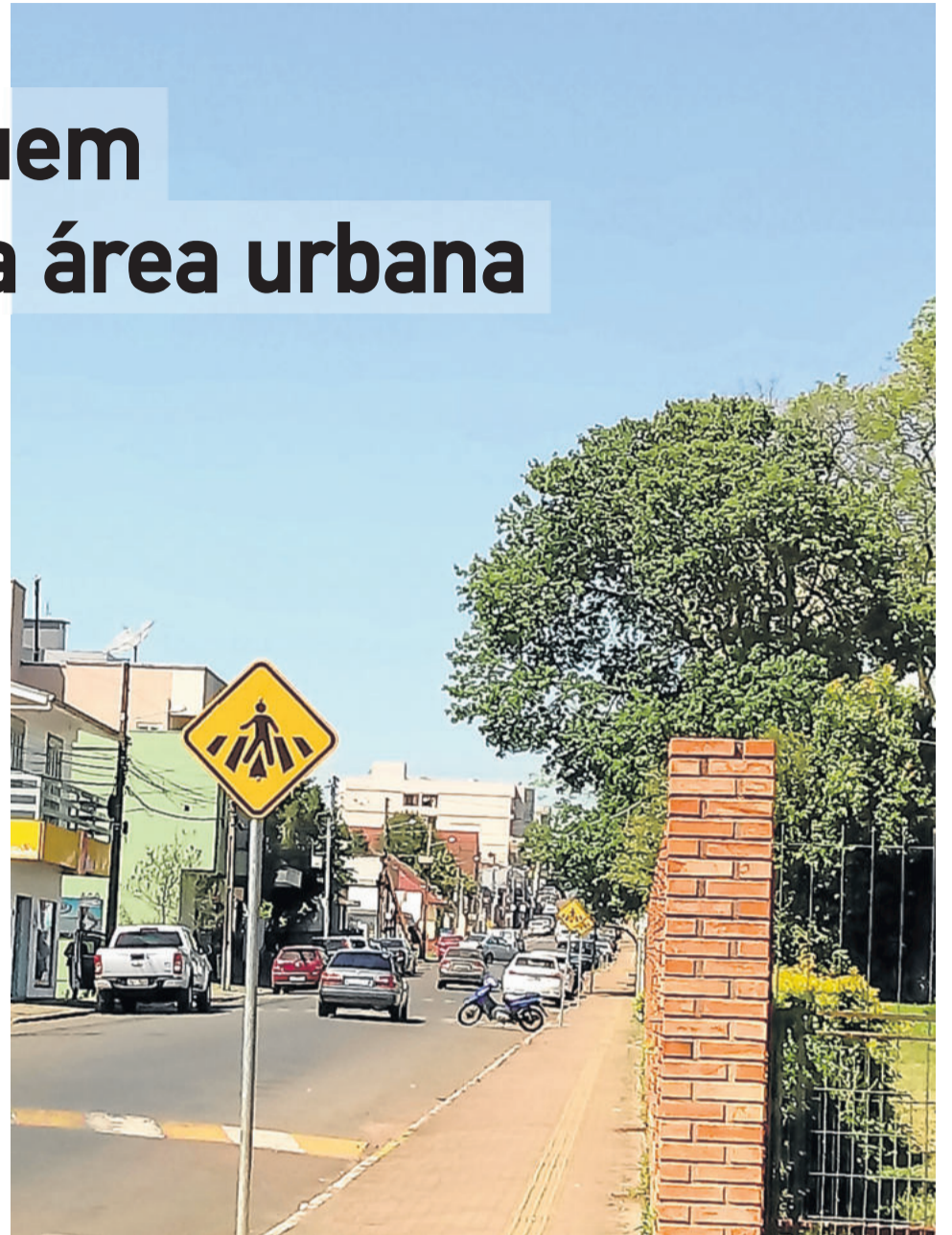
Ações de conscientizações e melhorias na infraestrutura contribuíram para a redução de acidentes

Para que isso seja possível, é preciso criar uma lei municipal para criar o cargo e realizar um concurso público. Diferente da implantação de uma