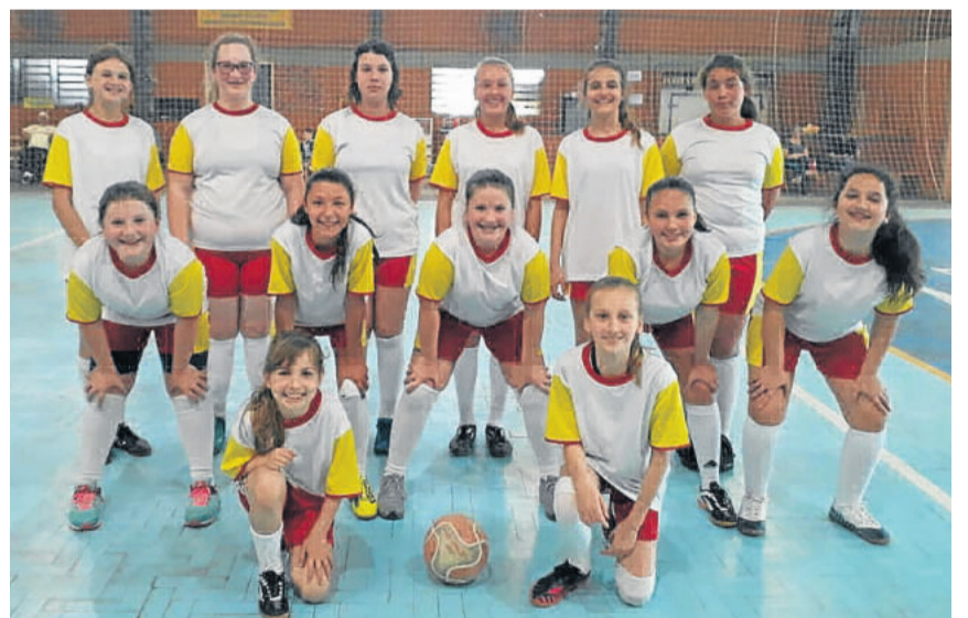
Meninas também praticam futsal no projeto