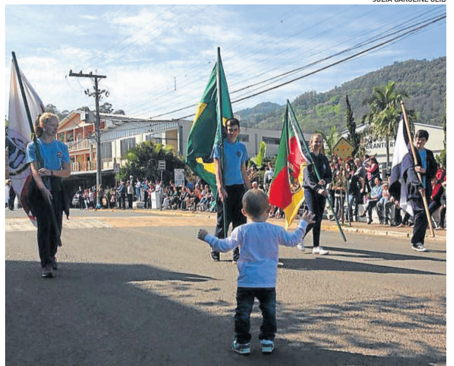
Desfile representa respeito e patriotismo