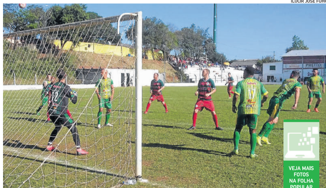
Santo André (de calção vermelho) fez 2x0 e está nas quartas de final