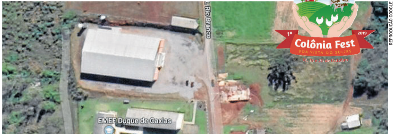
Ginásio Municipal sediará o evento

O domingo (20/10) também começa às 10 horas, com a abertura da exposição. Durante o meio-dia, banda e coral típico italiano. Também seguirá o Campeonato Municipal de Canastra e Bisca. A tarde terá shows com Rota Luminosa, Os Atuais, Rock and Beer, Barbarella e DJ Gabriel Souza.