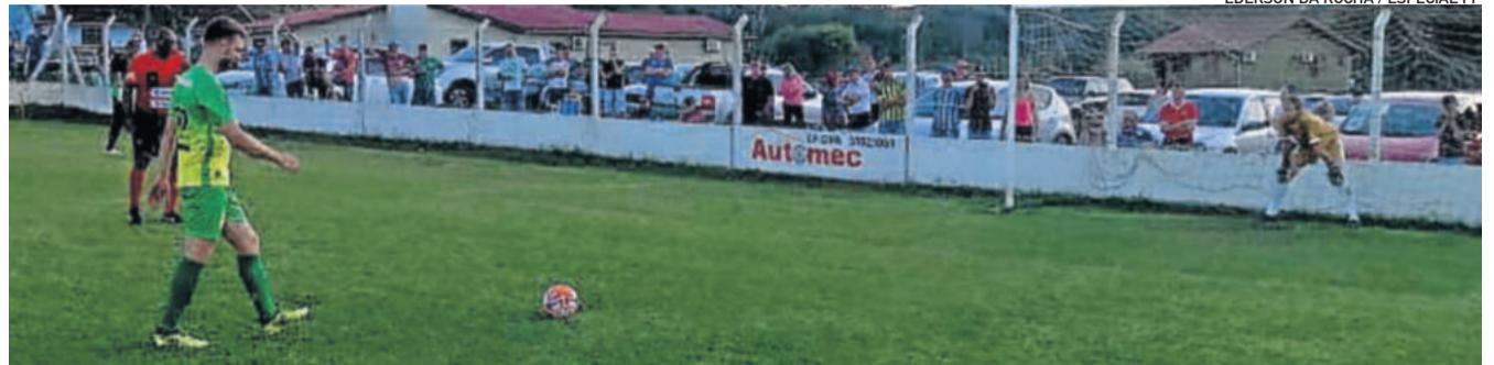
Cobrança do último pênalti deu início à comemoração do Canarinho