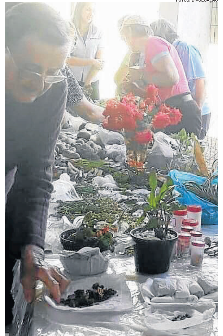
Troca de mudas foi realizada durante o evento