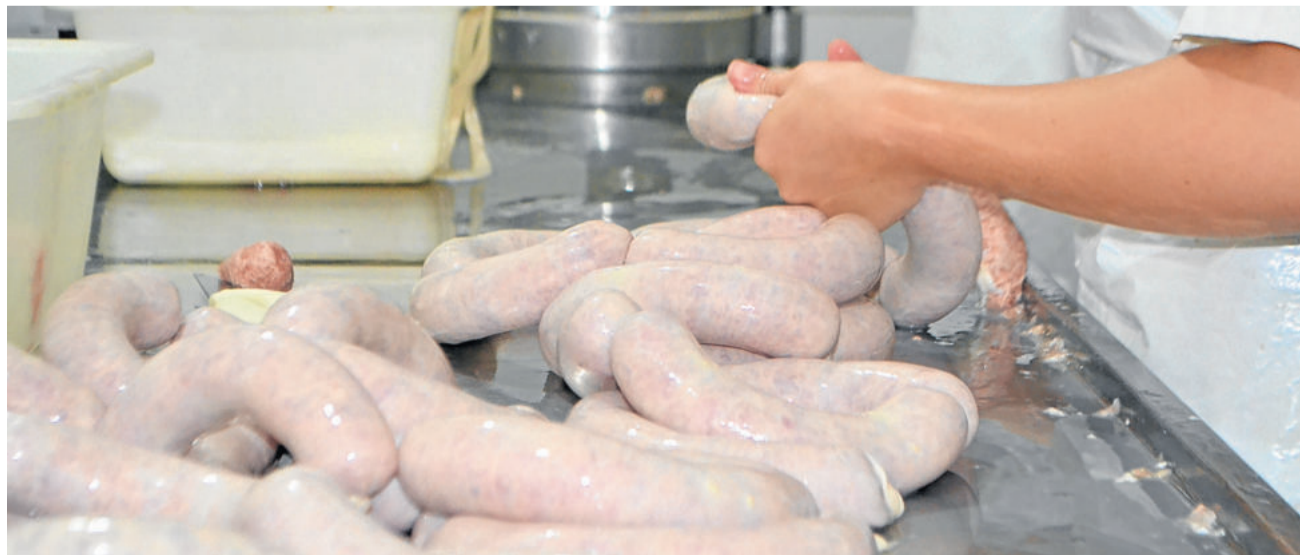
A Kolonie Haus comercializa os seus produtos em mercados de Teutônia, Venâncio Aires, Serra Gaúcha e demais municípios do Vale do Taquari

No ano passado ainda, houve reajuste no valor repassado, via incentivo, para a construção, reforma e ampliação de agroindústrias. A nova legislação municipal prevê, para construção e ampliação, o auxílio financeiro de R$ 40,00 por metro quadrado; e, para reforma, R$ 20,00 por metro quadrado reformado.