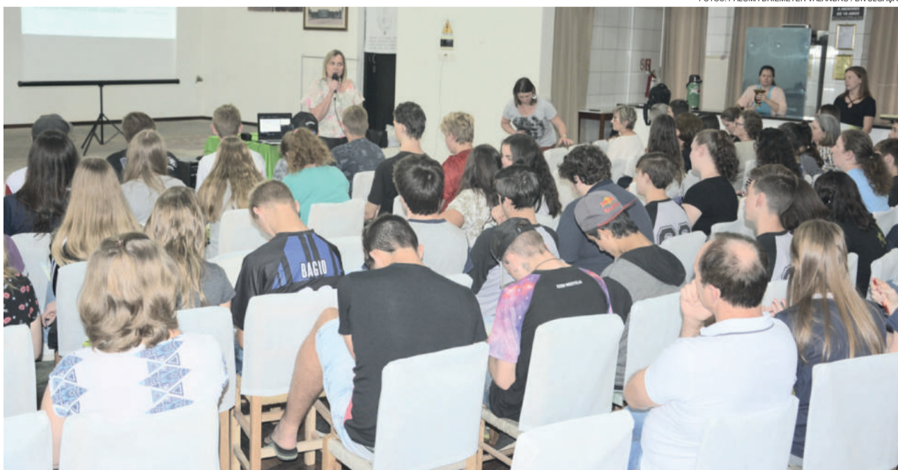
Bom público prestigiou a VII Conferência Municipal dos Direitos da Criança e do Adolescente

O Departamento Municipal de Assistência Social e o Centro de Referência de Assistência Social informam que no dia 22 de novembro (quinta-feira) haverá reunião de assessoria aos grupos de idosos. O encontro será no CRAS, a partir das 13h30min.