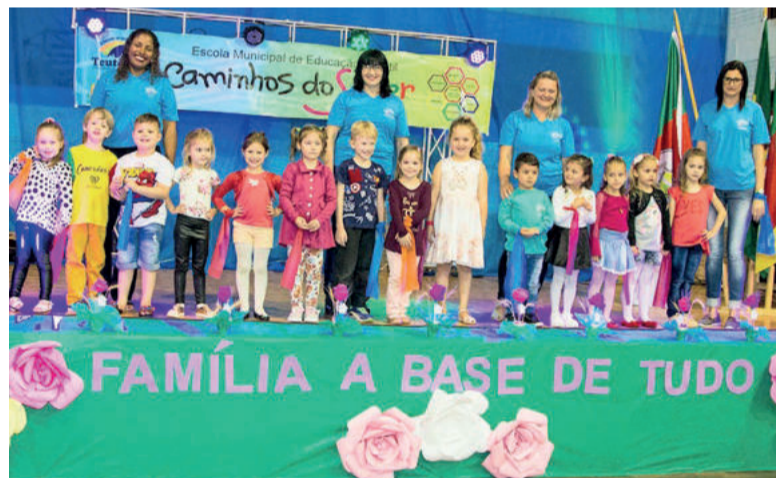
Alunos fizeram apresentações especiais