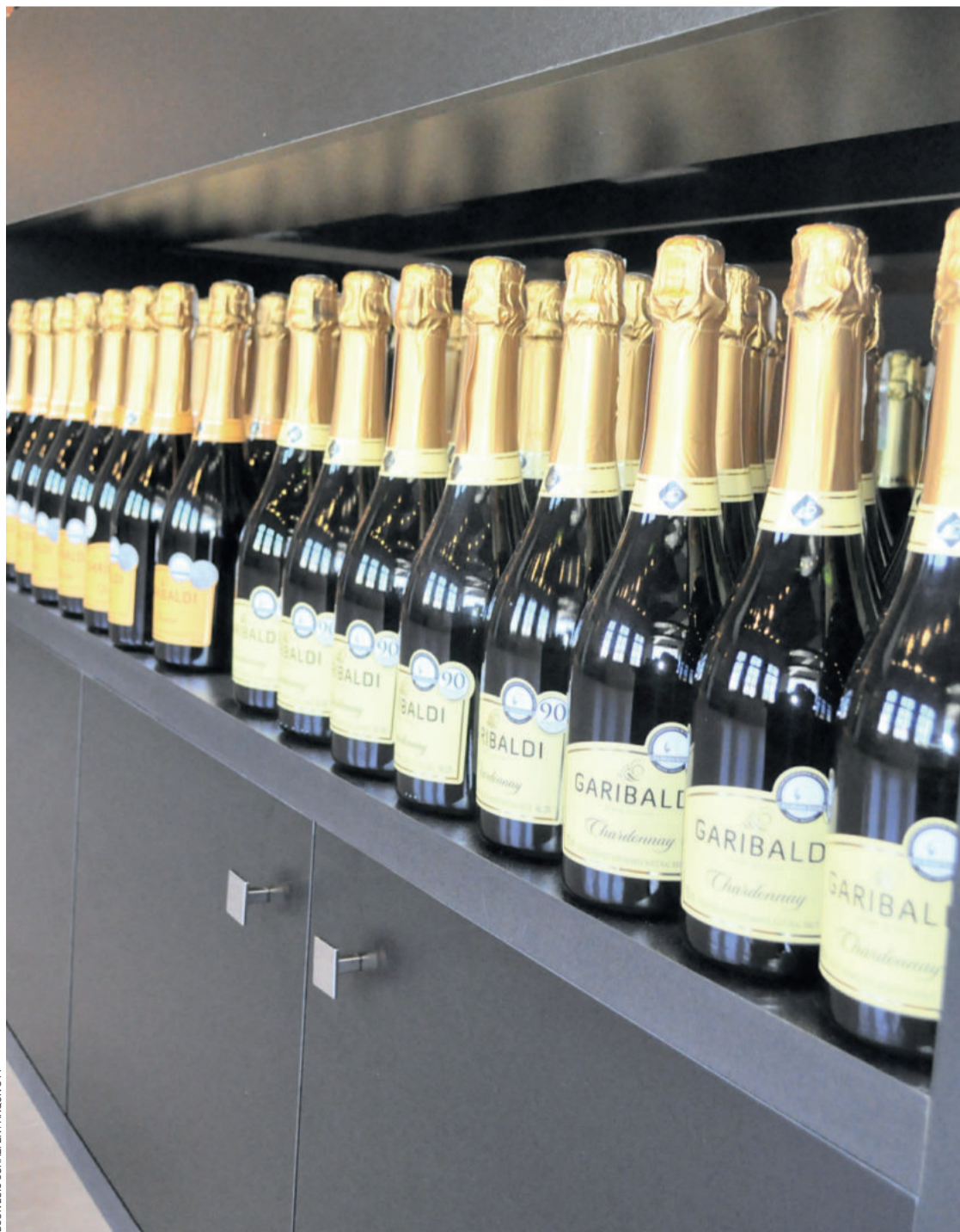
Rota do Espumante é uma das opções de turismo em Garibaldi

O assunto mais comentado do momento também foi falado em Garibaldi. As eleições do domingo (28/10) continuam repercutindo, principalmente a nível federal. Conforme Cettolin, algumas ideias do presidente eleito, Jair Bolsonaro (PSL), são positivas na sua avaliação. “Gostamos quando ele fala menos Brasília e mais Brasil, repassar os recursos diretamente para