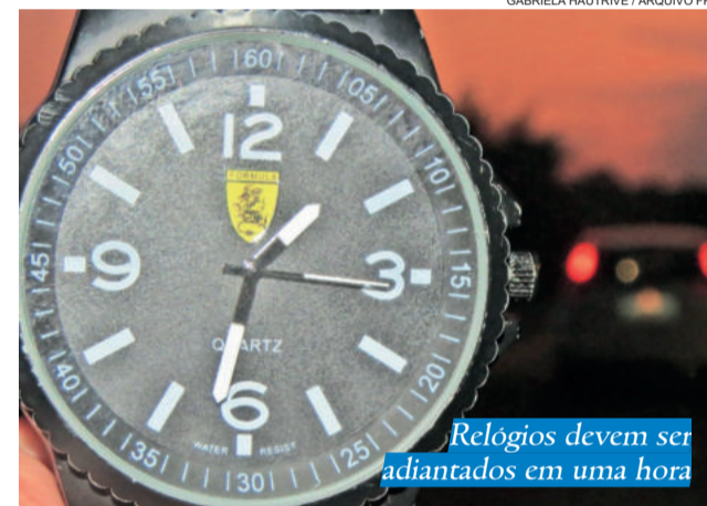
Relógios devem ser adiantados em uma hora