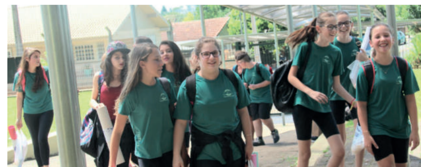
Pais ou responsáveis devem ficar atentos à documentação necessária para as matrículas e rematrículas dos estudantes

A Secretaria de Educação, obedecendo lei federal, prioriza o atendimento das crianças os estabelecimentos mais próximos de sua residência. Informações e contatos das escolas do município podem ser obtidos no site da prefeitura, no endereço eletrônico www.estrela.rs.gov.br ou pelo telefone 3981.1053.