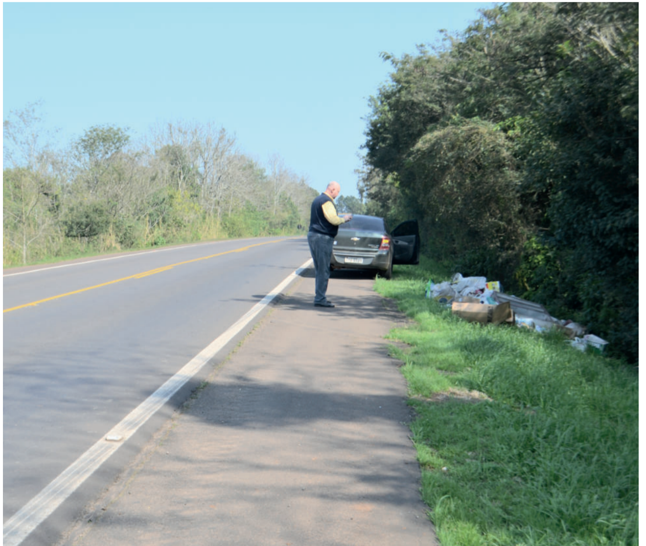
Objetivo da ação é conscientizar sobre o descarte incorreto do lixo