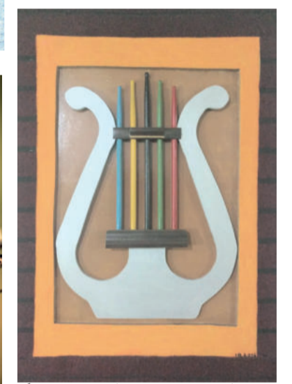
Arte em relevo com recicláveis