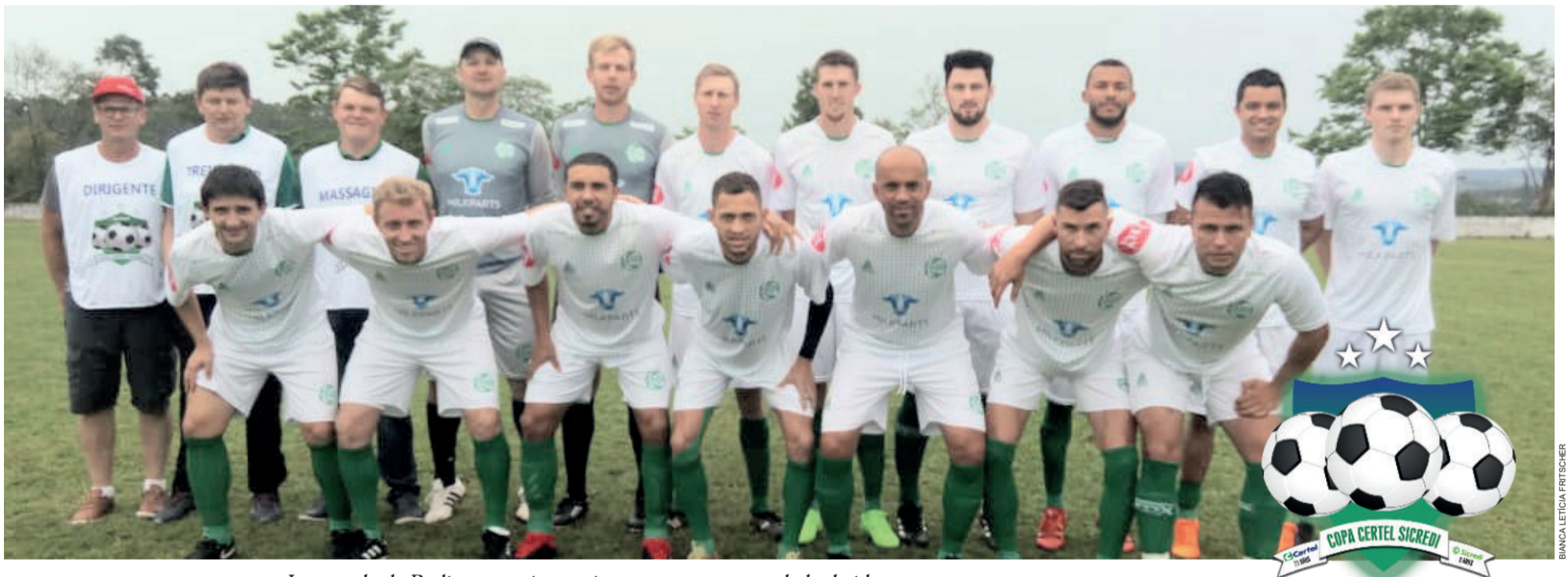
Juventude da Berlim é a única equipe que venceu na rodada de ida