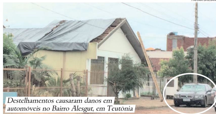
Destelhamentos causaram danos em automóveis no Bairro Alesgut, em Teutônia

Segundo a Polícia Rodoviária Estadual (PRE) de Teutônia, ocorrência de quedas de árvore foram registradas no km 47 da RSC-453, Rota do Sol. De