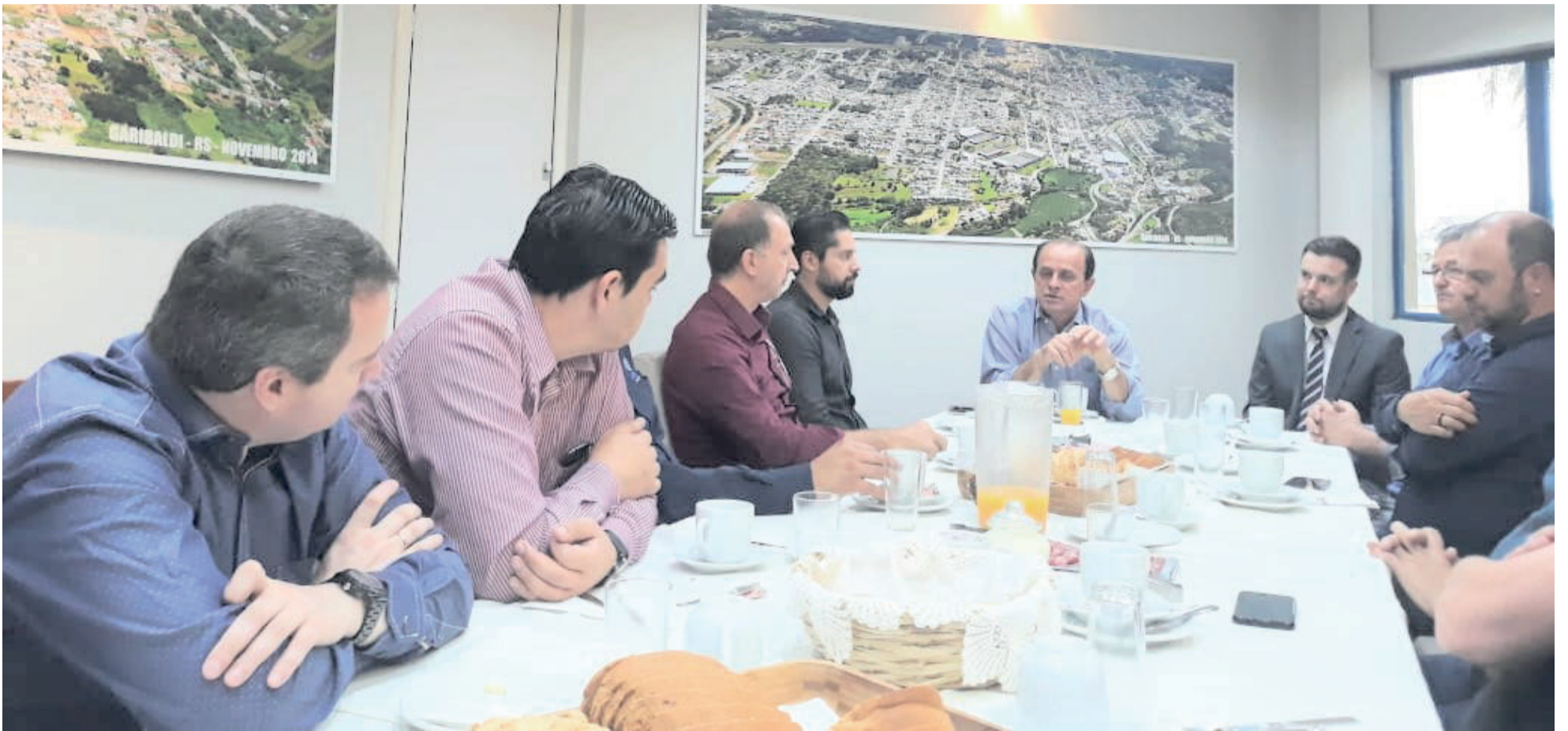
Prefeito Antonio Cettolin e representantes da imprensa regional