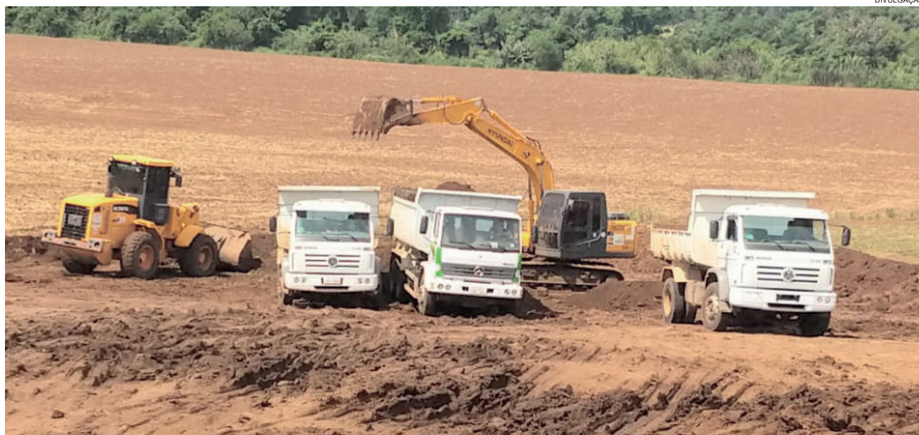
Maquinário da prefeitura faz terraplanagem em propriedade do interior