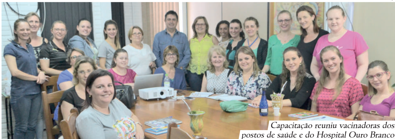
Capacitação reuniu vacinadoras dos postos de saúde e do Hospital Ouro Branco