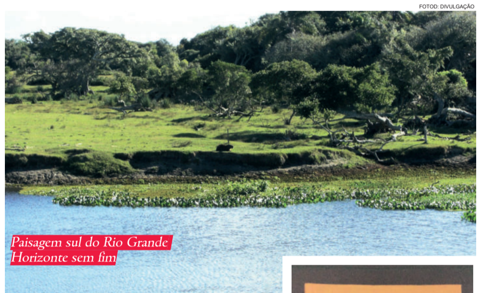
Paisagem sul do Rio Grande Horizonte sem fim