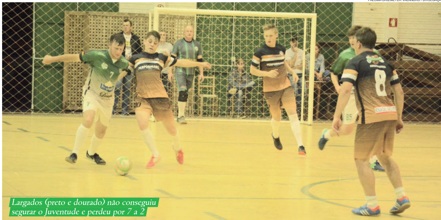
Largados (preto e dourado) não conseguiu segurar o Juventude e perdeu por 7 a 2

Amãhã (02/11), não haverá rodada em razão do Feriado de Finados. A grande final está marcada para o dia 30 de novembro (sexta-feira), tendo por local o Flamengo Futebol Clube, no Centro do Município.