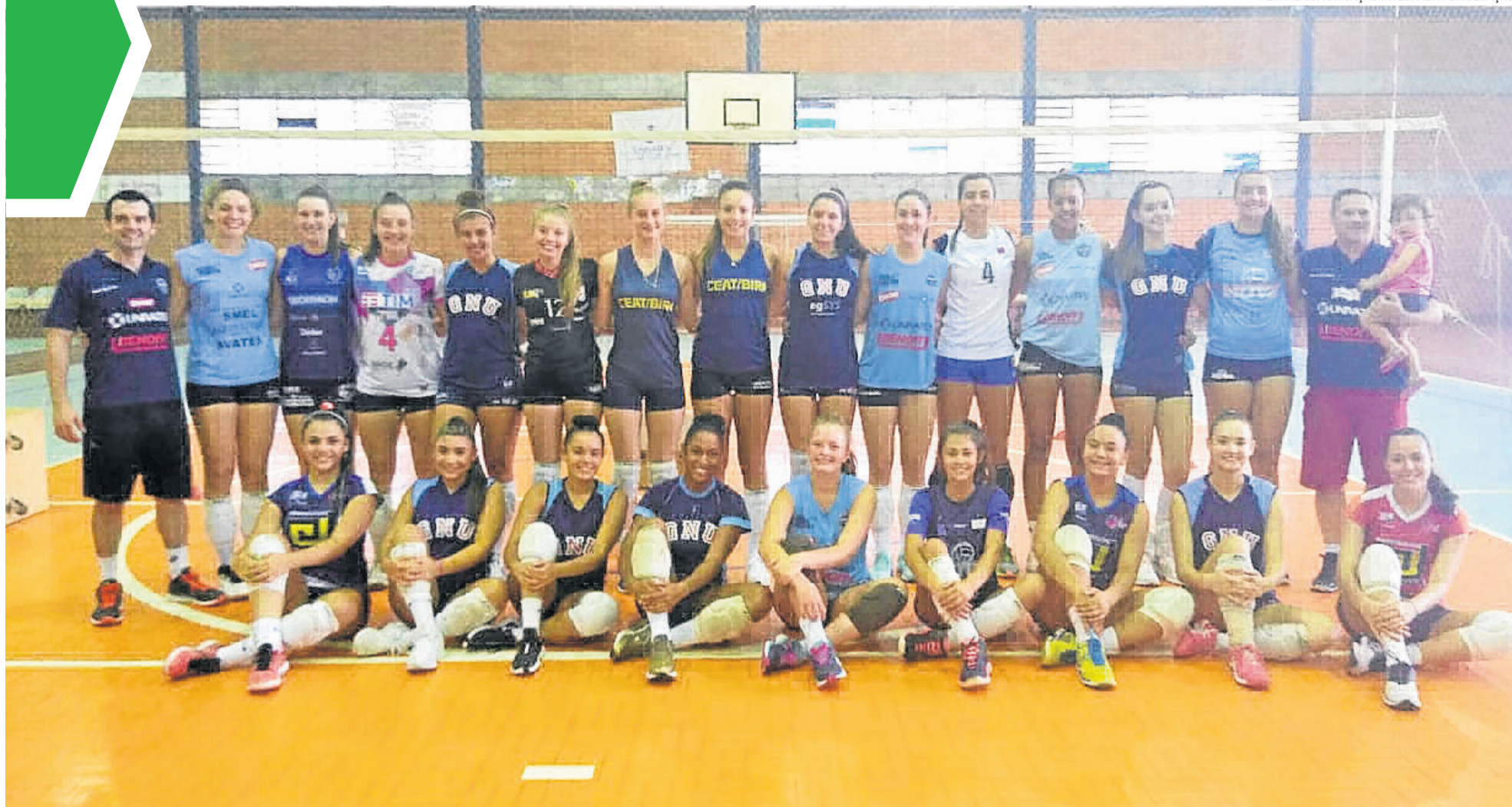
Das 22 atletas que iniciaram o treino nesta semana, comissão técnica selecionará 12 a 14