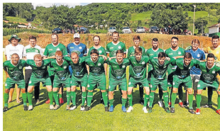
Na estreia, o vice-campeão Juventude da Berlim goleou o Aimoré