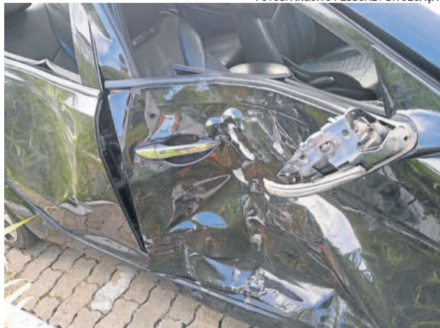
Conforme Bruna, a marca do pneu da moto ficou na porta do carro