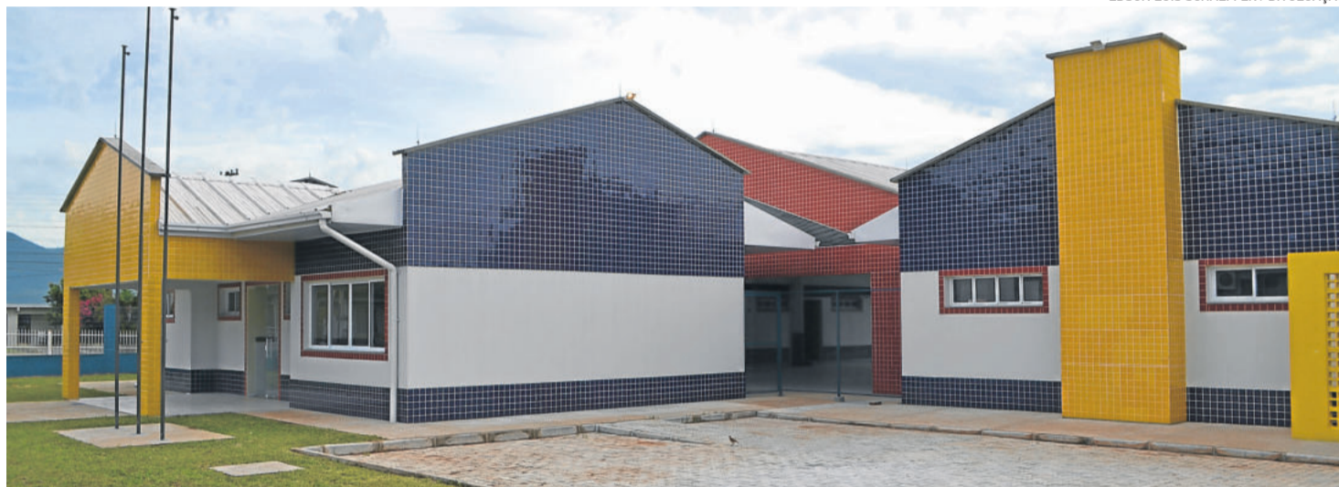
Emei Caminhos do Saber passa a atender no novo prédio a partir do dia 4 de fevereiro