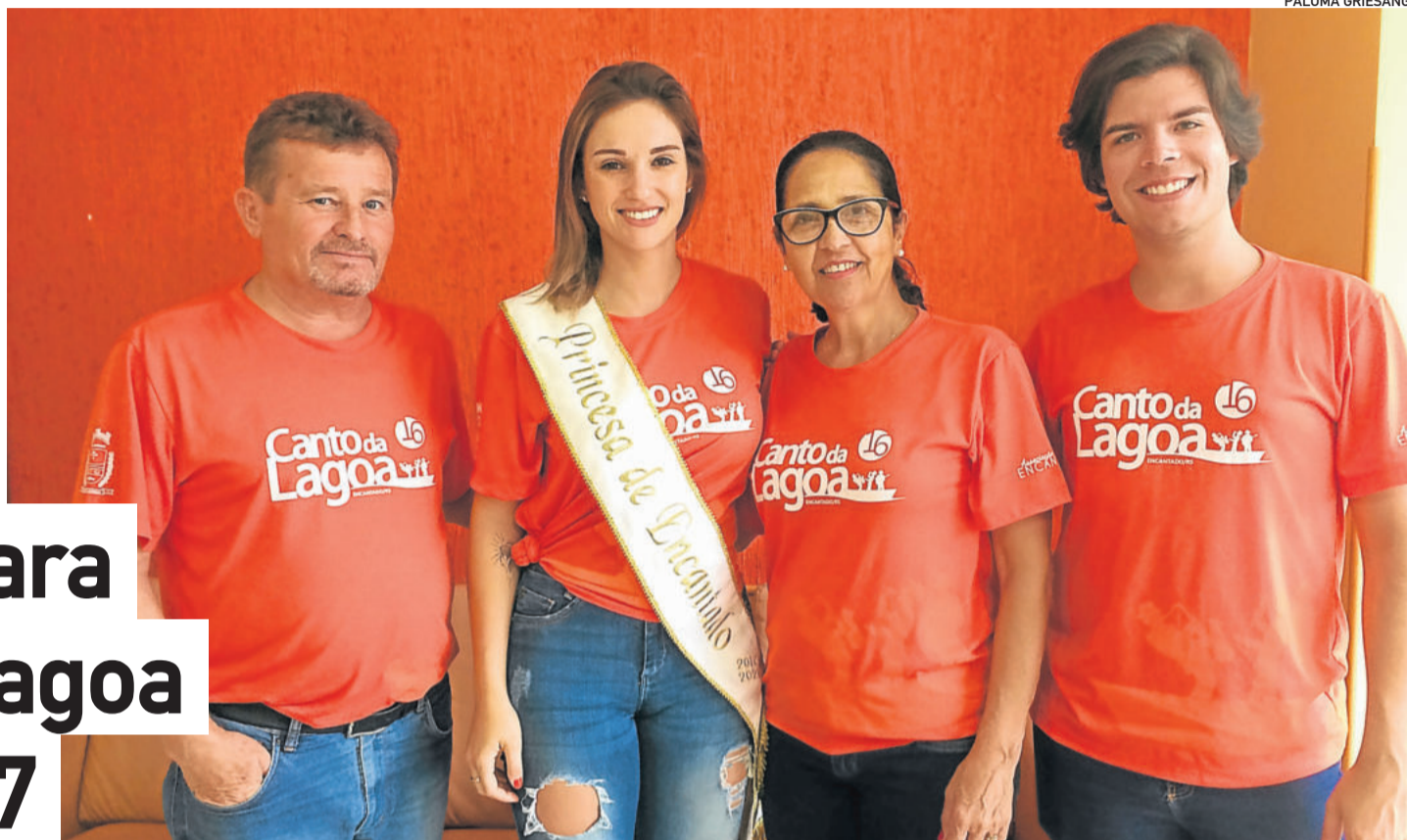
Comissão organizadora visita os municípios para divulgar o evento