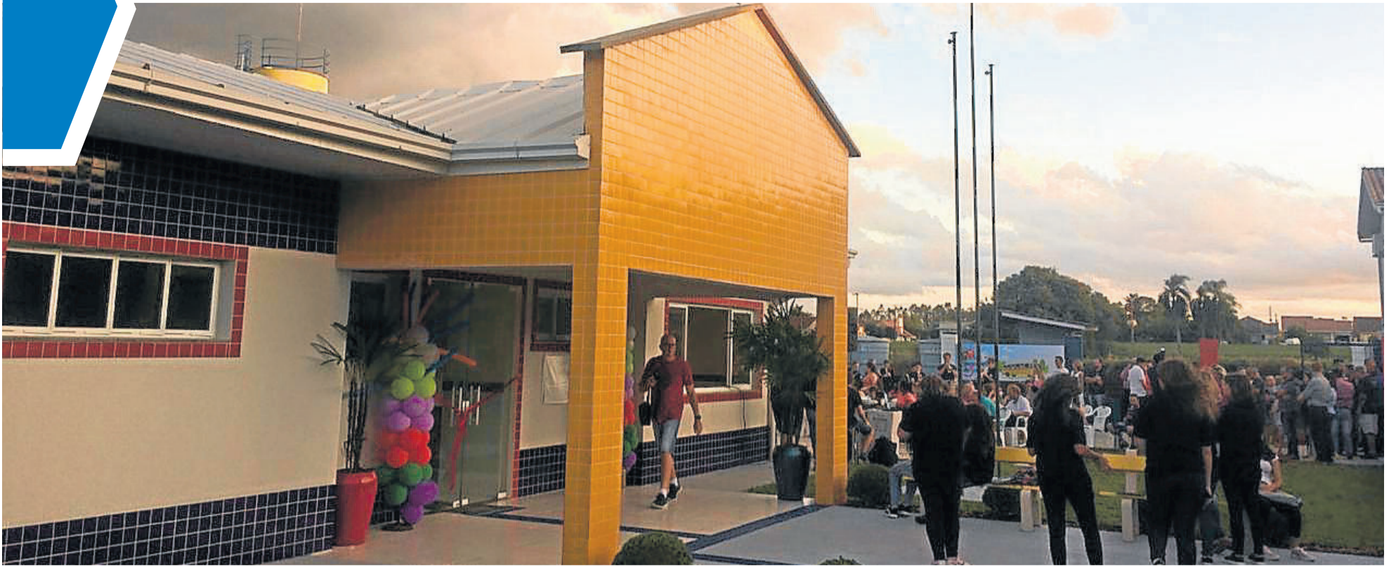
Inauguração do prédio da Emei Caminhos do Saber foi realizada no começo da noite desta sexta-feira