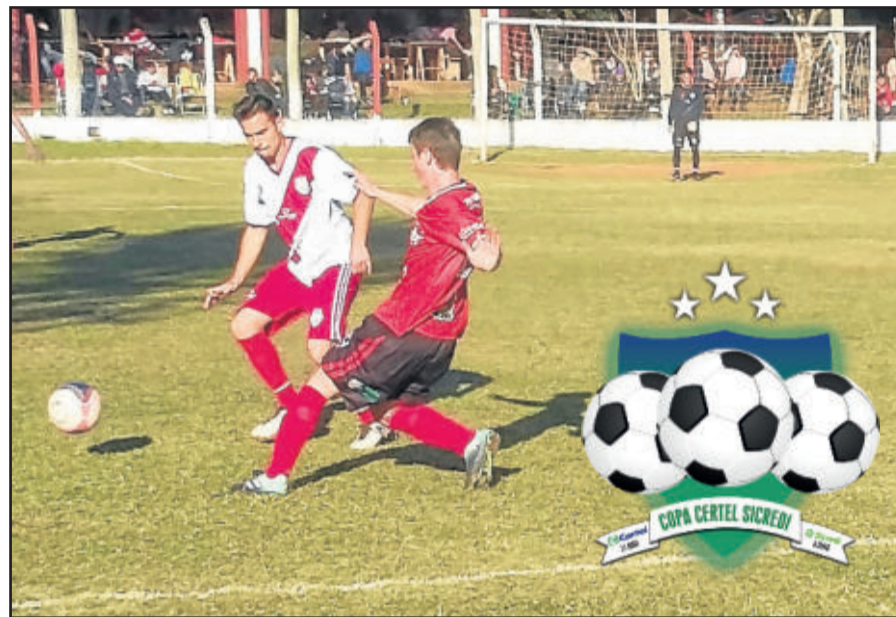
Atlético Gaúcho de Tales volta a jogar em casa neste domingo