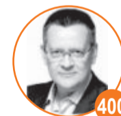
BETO ALBUQUERQUE Partido: PSB