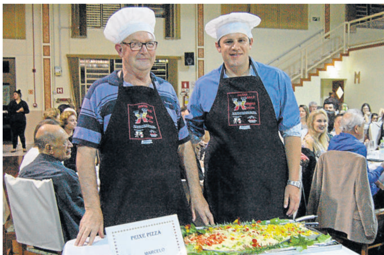
Homens preparam pratos à base de peixe