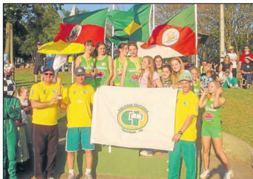
Em 2006, quando o Colégio Teutônia sediou a 42ª Onase, a equipe teutoniense ficou em 3º lugar geral

dos destaques da nova e atual geração de atletas brasileiros com grande potencial olímpico.