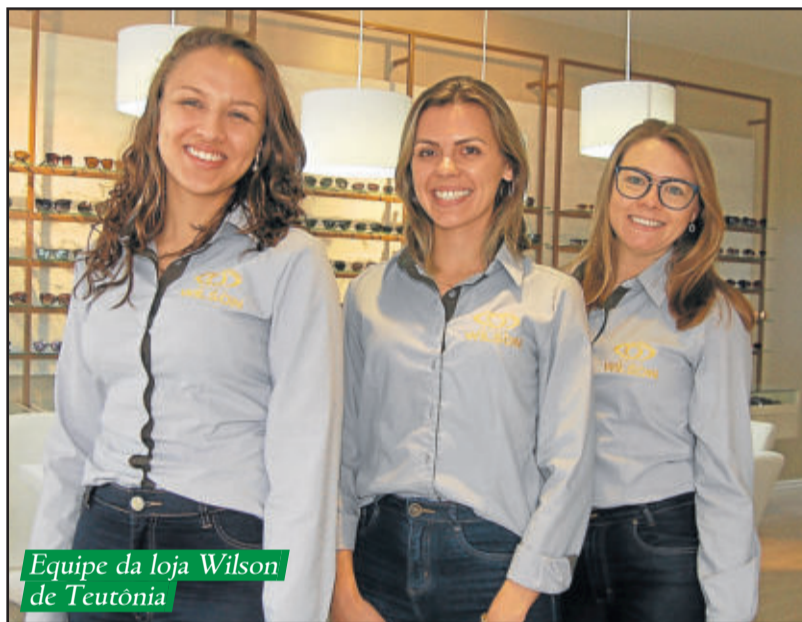
Equipe da loja Wilson de Teutônia

No próximo sábado, dia 8 de setembro, será realizada uma programação especial de reinauguração, com coquetel para recepcionar toda comunidade. Fica o convite para conhecerem o novo espaço, na rua Major Bandeira, em Languiru, próximo ao Hospital Ouro Branco.