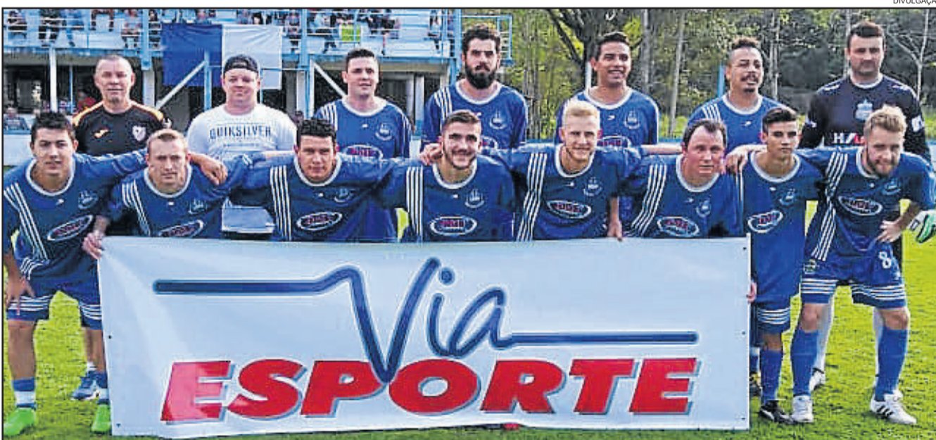
Poço das Antas

Com o adiamento da 3ª rodada do 1º turno, a 2ª Copa Via Esporte / Rema Troféus projeta para a tarde deste domingo (02/09) a disputa dos jogos da 1ª rodada do 2º turno, cujos enfrentamentos valem a liderança, pois são a inversão do mando de campo da rodada anterior.