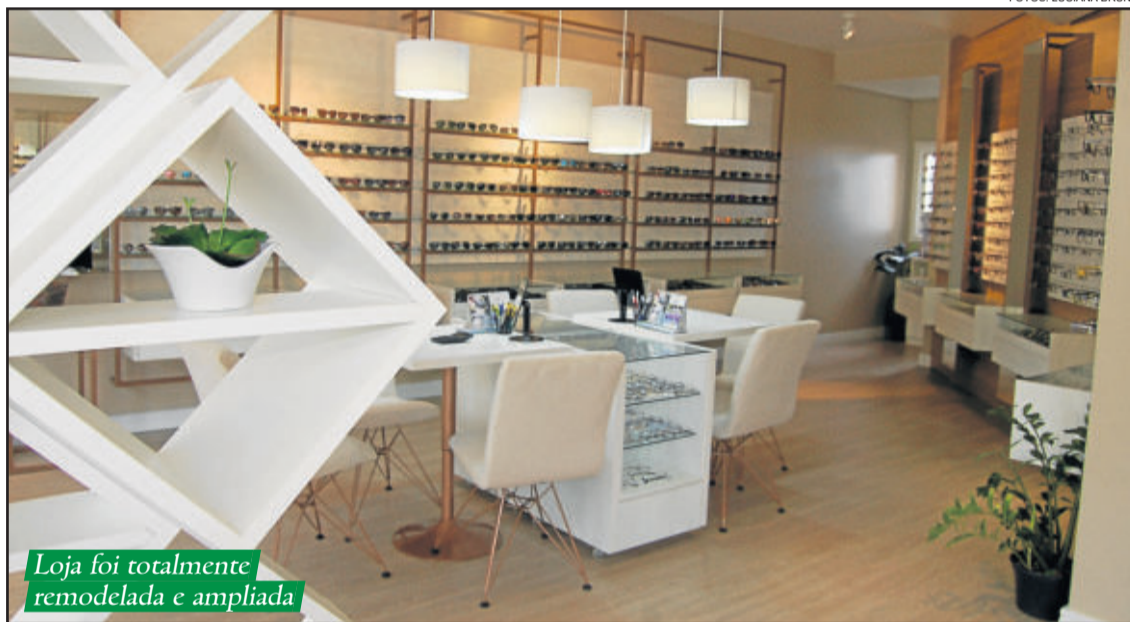
Loja foi totalmente remodelada e ampliada