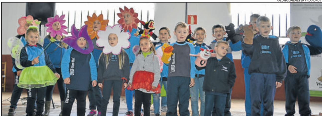
Estudantes da EMEF Olavo Bilac apresentaram a música 'Filhote de filhote'

Mais informações podem ser obtidas na Secretaria da Agricultura ou pelo telefone (51) 3762-4553.