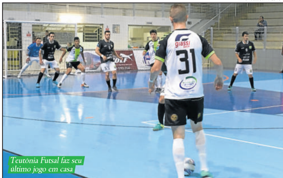
Teutônia Futsal faz seu último jogo em casa