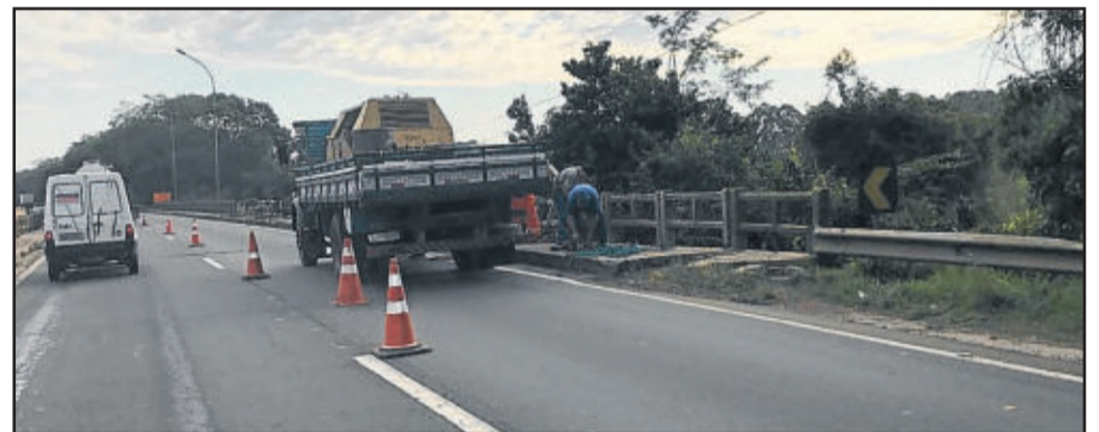
Obras já haviam sido canceladas no ano passado

Já em 6 de maio deste ano, uma mulher de 37 anos, de Arroio do Meio, perdeu o controle de seu veículo Hyundai Tucson e bateu na cabeceira da ponte. Neste caso, houve apenas danos materiais.