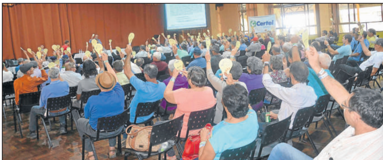
Propostas foram aprovadas por maioria dos presentes