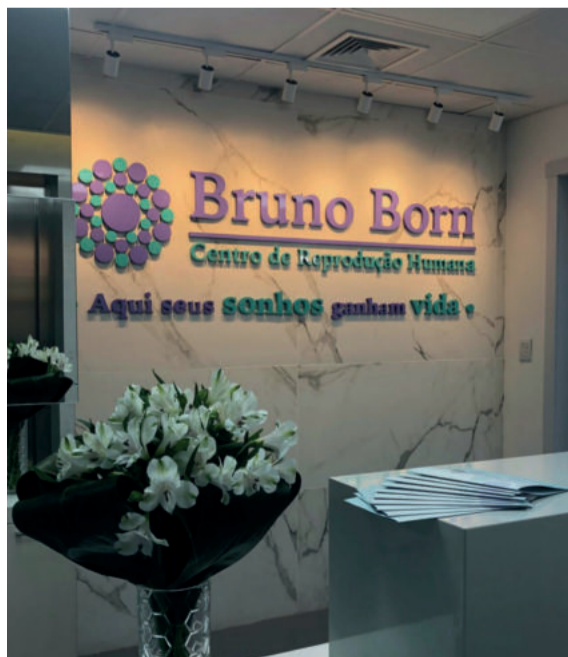
Centro de Reprodução Humana foi uma das conquistas do ano