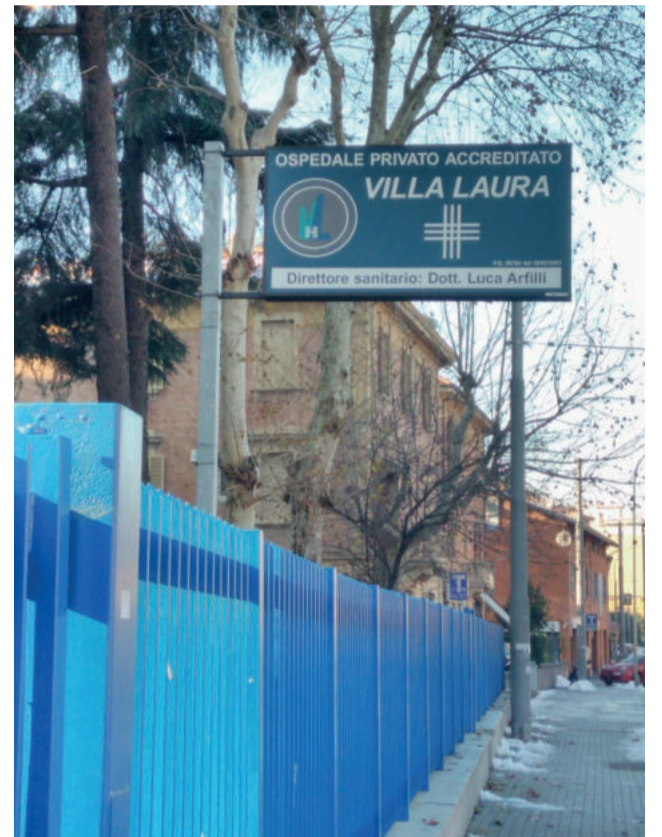
Clínica de renomado profissional está localizada em Bologna