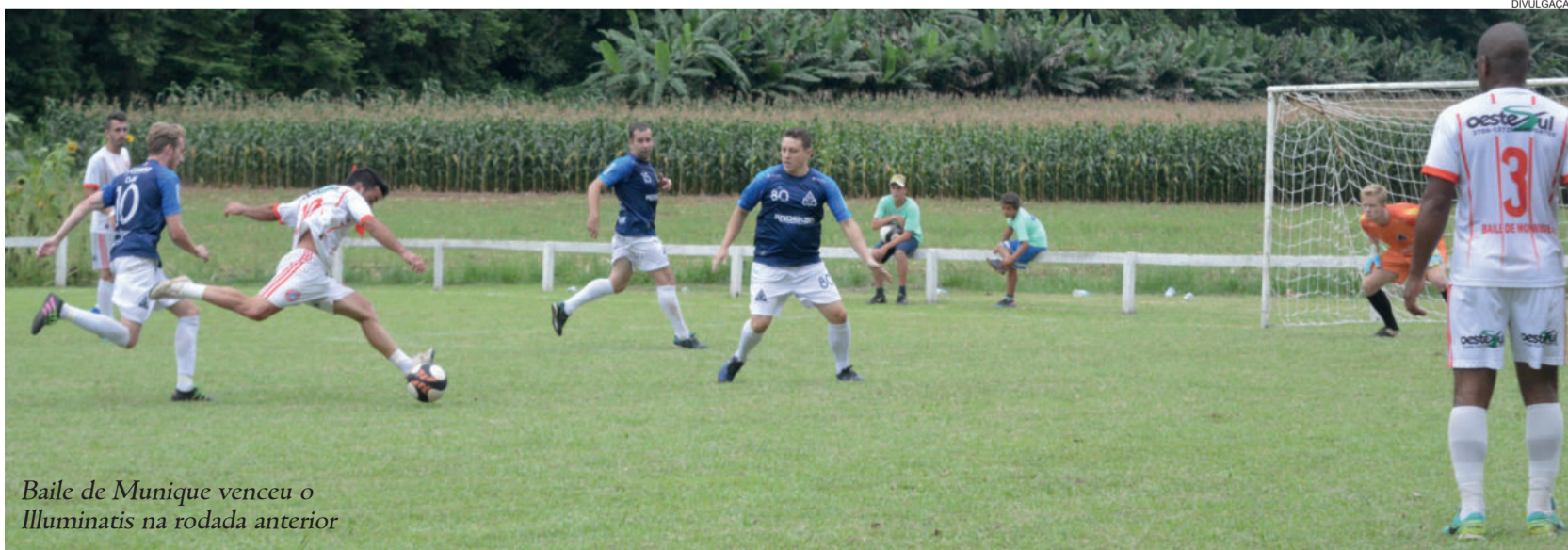
Baile de Munique venceu o Illuminatis na rodada anterior