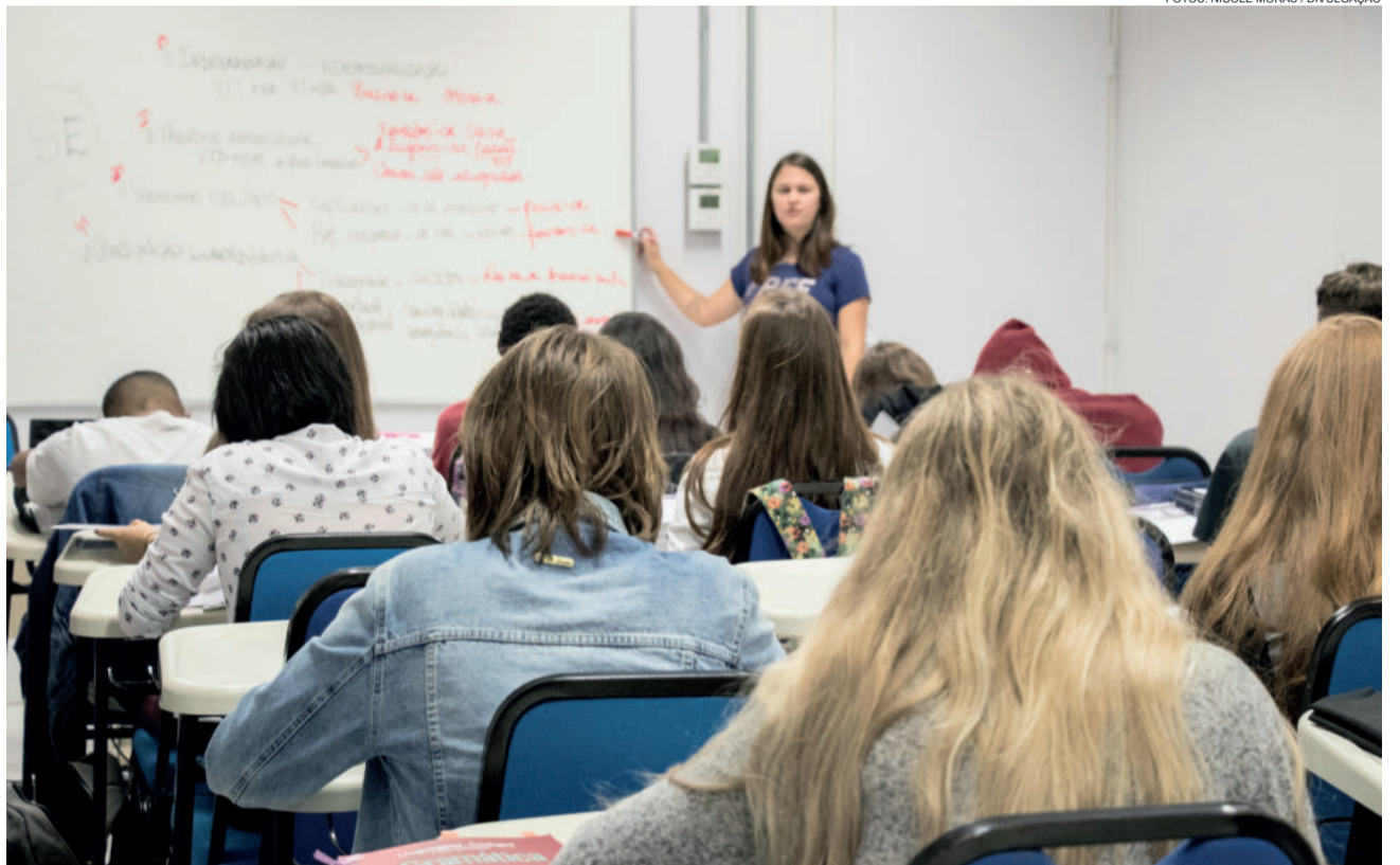
Durante o curso serão abordados os conteúdos mais cobrados nas provas do Enem nos últimos anos

Mais informações pelo e-mail vestvates@univates.br , neste link ou pela página do Facebook do Vestvates.