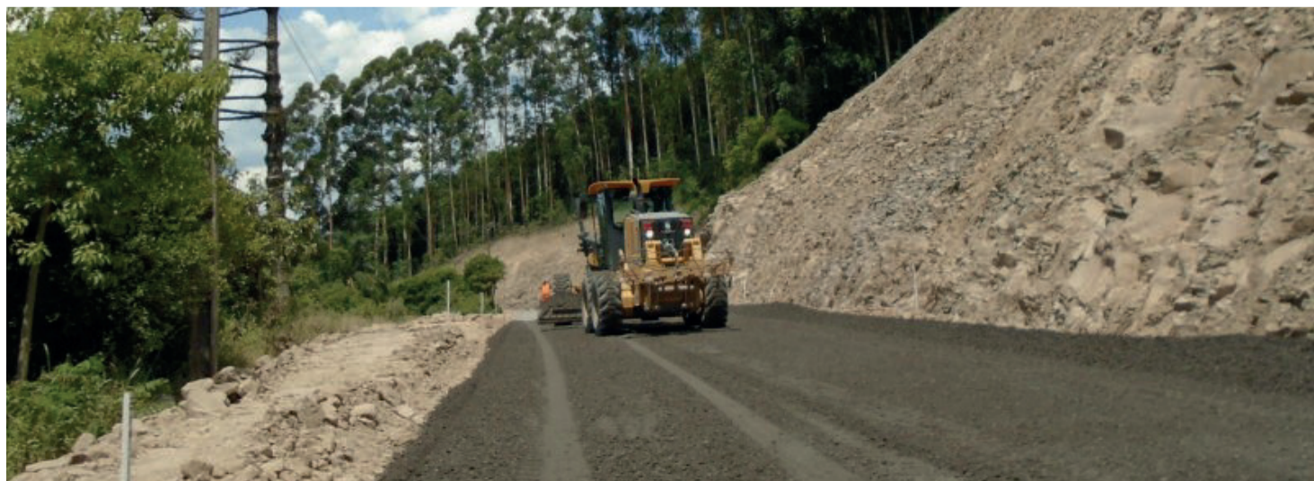
Obras de pavimentação beneficiarão comunidade