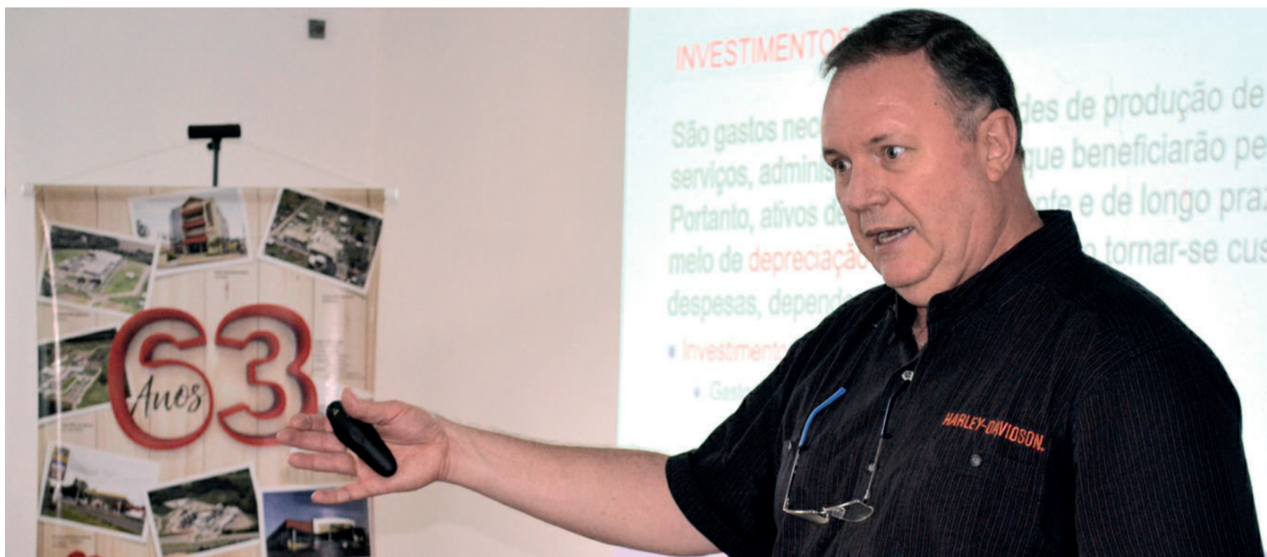
Schulz explicou as diferenças entre investimentos, custos, despesas e sobras