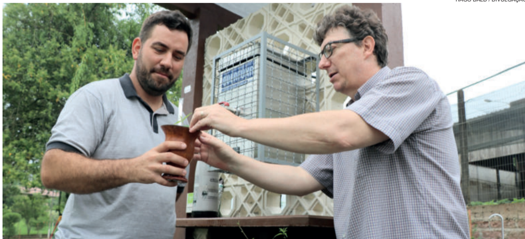
Chás para o chimarrão podem ser colhidos na horta suspensa

Reinaugurada na última sexta-feira do ano (28/12), junto à Praça Recanto Livre de Marques de Souza, uma horta suspensa em que podem ser colhidos chás de poejo, erva-cidreira, menta e hortelã, ficará sob responsabilidade da Emater/RS-Ascar local, que será encarregada de substituir, regar, cuidar e orientar o uso das plantas.