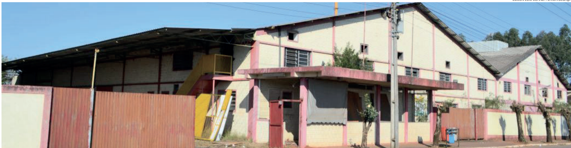
Fábrica está fechada desde 2011, com massa falida declarada