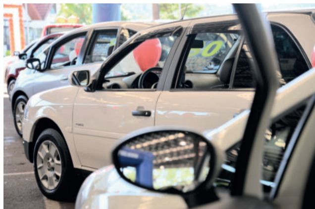
Variedade em marcas, modelos e ofertas num só lugar