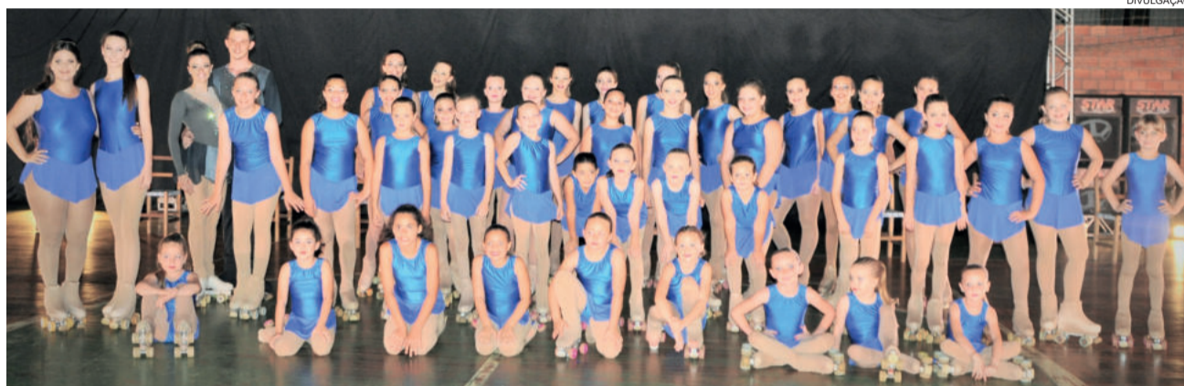
Patinadores no Show de patinação de 2017

quiridos com as patinadoras no valor de R$ 10,00 para pessoas acima de dez anos de idade, e R$ 5,00 para crianças de 04 a 10 anos de idade, sendo que menores de 3 anos não pagam ingresso.