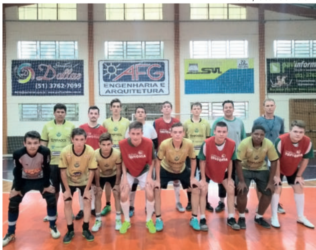
Equipes da categoria Sub-20 jogaram no Colégio Teutônia e voltam a se enfrentar em novembro no ginásio da Associação da Água