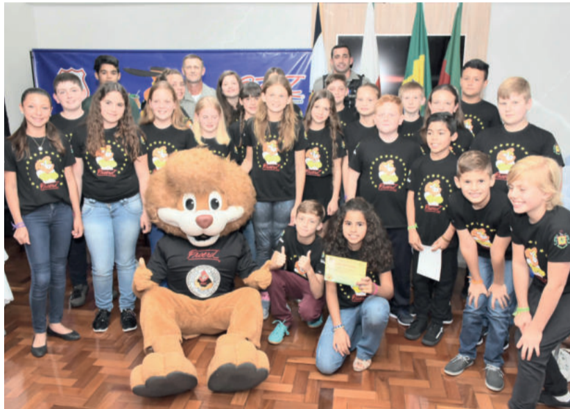
Alunos formados no Proerd em 2018 em Imigrante