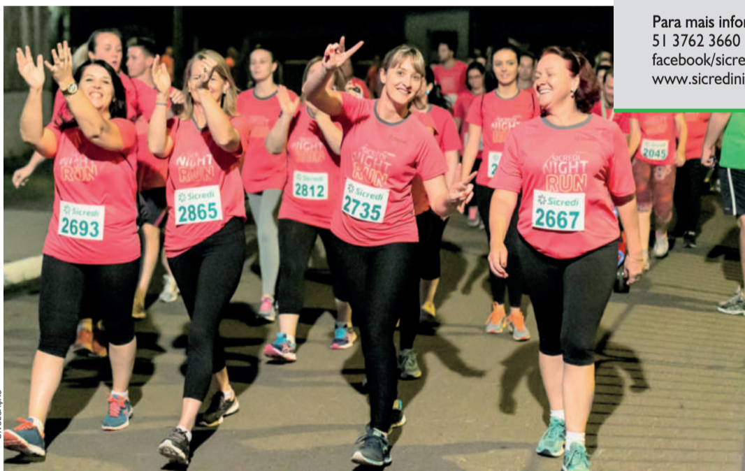
Sicredi Night Run se consagra como a maior corrida do Vale do Taquari

Para mais informações 51 3762 3660 facebook/sicrediuoubrancors www.sicredinightrun.com.br