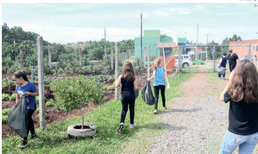
Alunos foram convidados a participarem da Ação Consciência Limpa