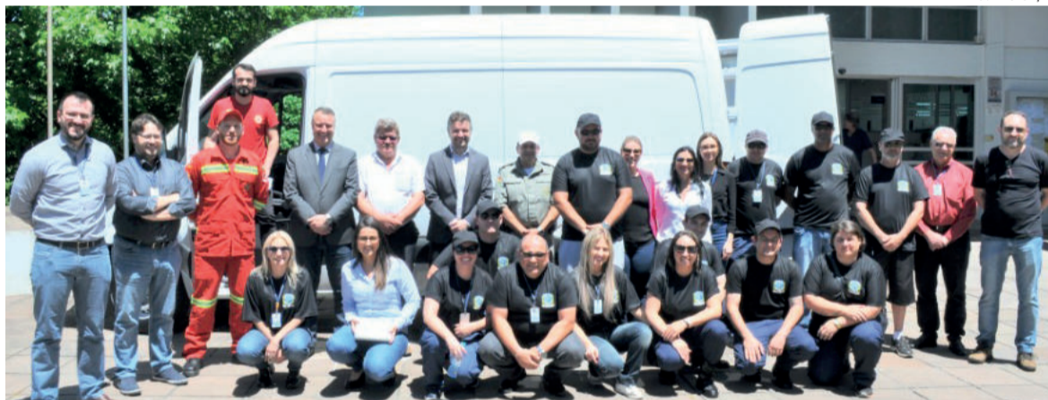
Veículo furgão Mercedes Bens zero quilômetros foi entregue na quinta-feira (08/11)