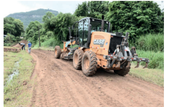
Trabalho na Linha Michels