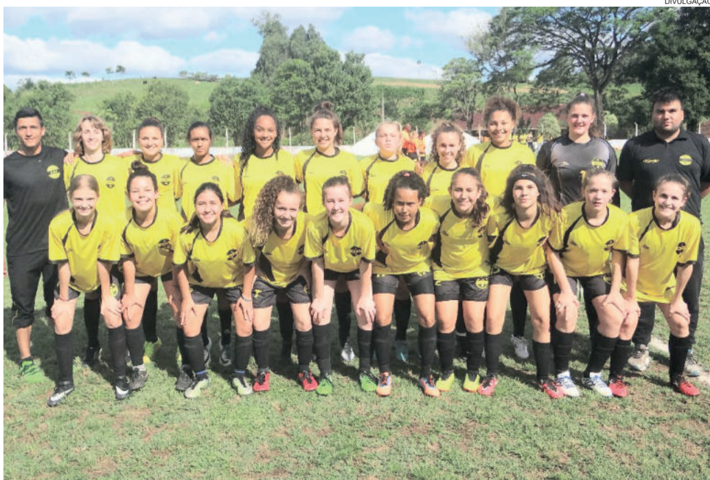
Equipe Sub-15 da AEF disputa a final contra o Inter em jogo único