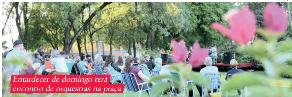
Entardecer de domingo terá encontro de orquestras na praça

Brückner, próxima ao Ginásio Municipal de Imigrante.