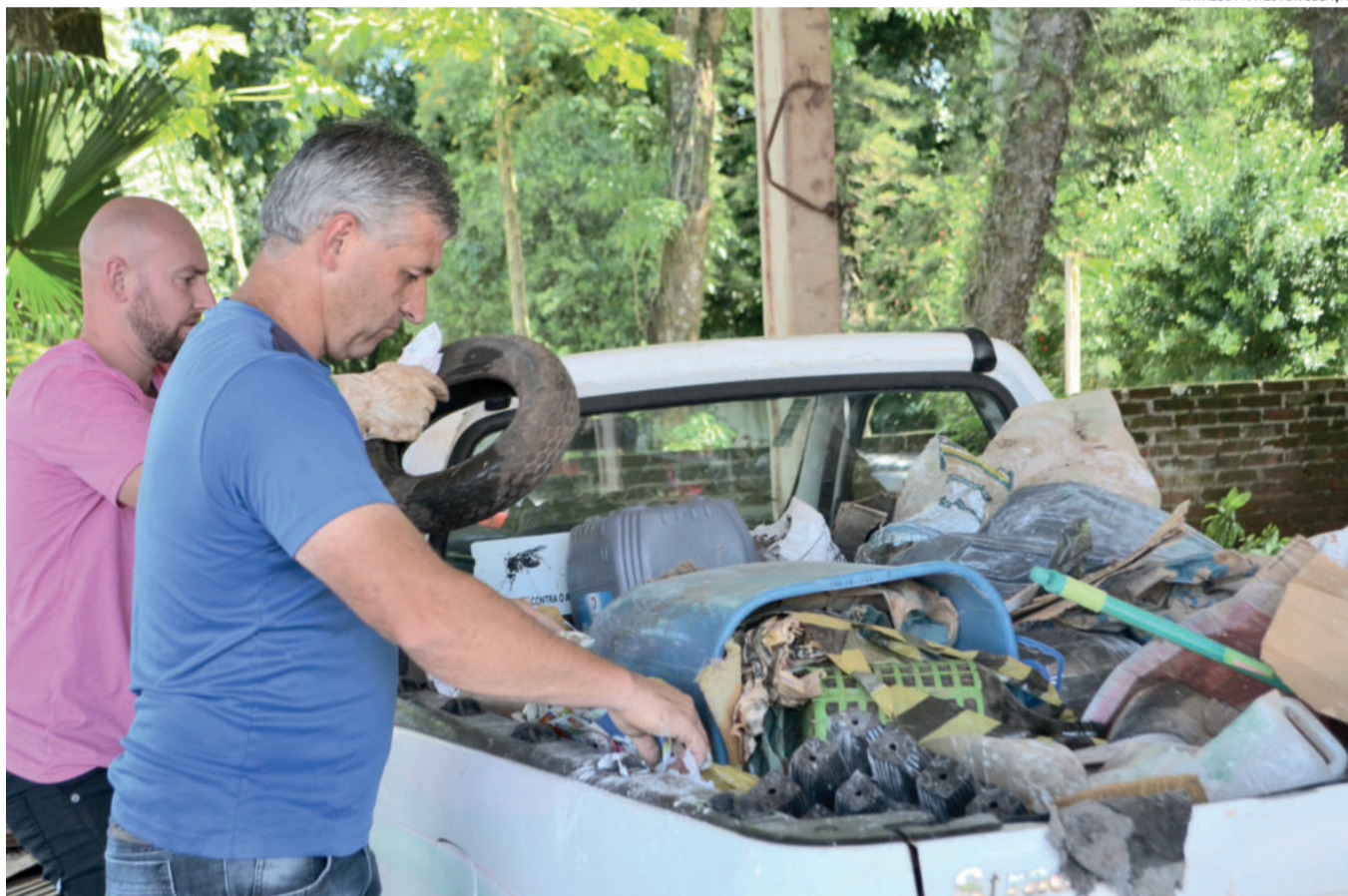
Lixo recolhido teve sua destinação correta

Na visão do secretário, a Ação Consciência Limpa vai gerar bons frutos. “Acreditamos que conseguimos despertar nos alunos e, também, na comunidade, que o lixo é responsabilidade de todos. Sabemos que os alunos vão ser os principais disseminadores desta proposta. Se cada um fizer a sua parte teremos uma cidade cada vez mais limpa, além de eliminarmos os criadouros de mosquitos e escorpiões”, frisa. A ação será realizada anualmente, passando a integrar o calendário oficial de eventos.