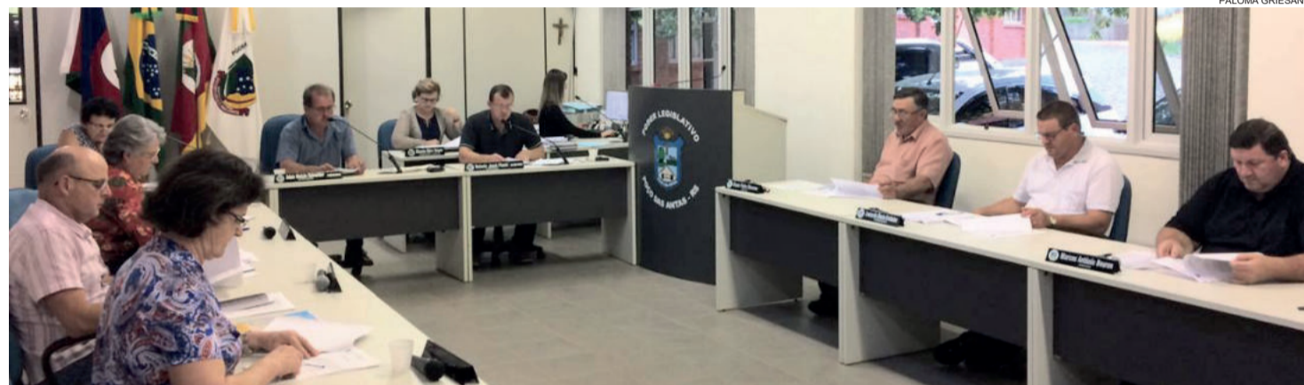
Vereadores se reuniram na segunda-feira (05/11)

pavimentada com paralelepípedo, além de ficar em, uma subida de morro e é muito fechada. Ela salienta que cabe à equipe técnica da Administração Municipal analisar qual a melhoria mais adequada. A indicação foi aprovada por unanimidade, com abstenção da autora.