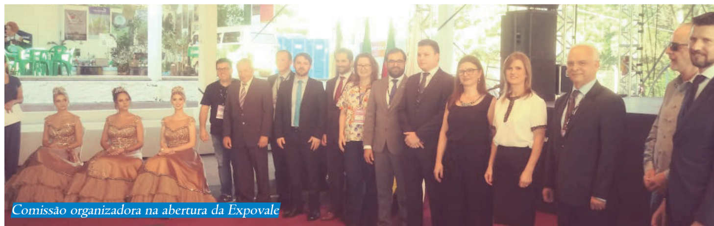
Comissão organizadora na abertura da Expovale

Confira a programação completa na aba Programação do site expovale.org.br