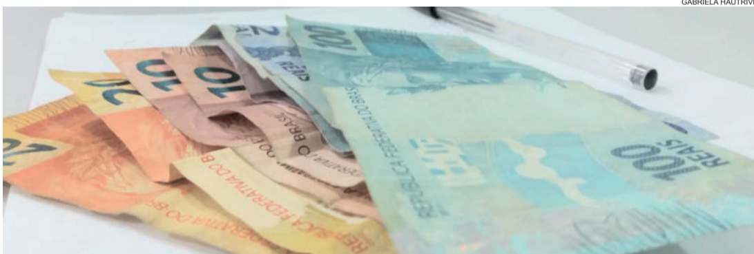
Municípios que tiveram crescimento no IPM vão contar com um valor a mais para trabalhar em 2019