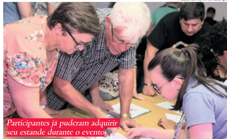
Participantes já puderam adquirir seu estande durante o evento