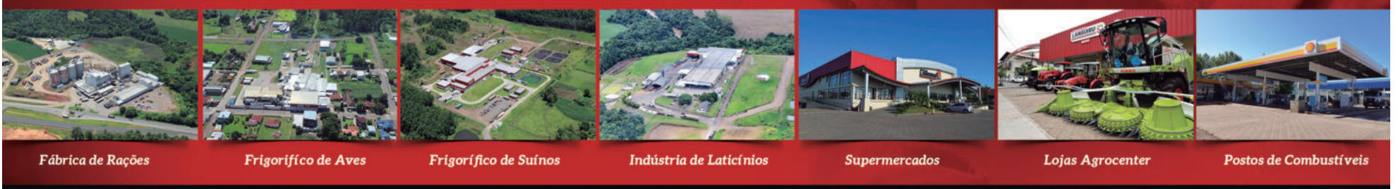
Fábrica de Rações