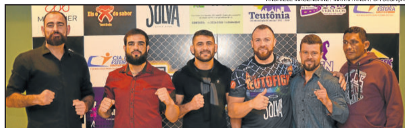
Competidores estiveram presentes

Com a participação de alguns competidores, patrocinadores e parceiros, Mão de Pedra anunciou o card completo, que contará com 15 lutas no 3º TeutoFight.