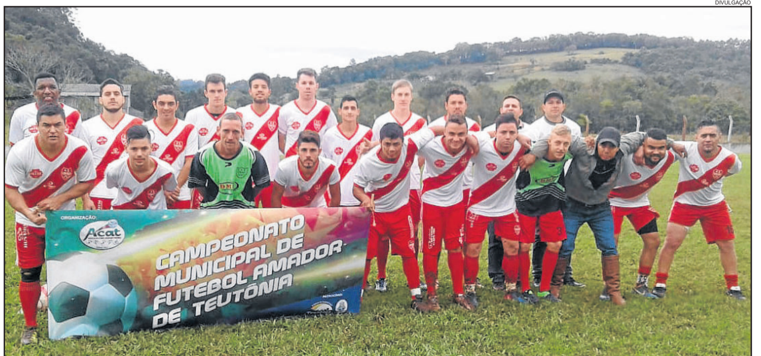
União de Linha Germano venceu o primeiro jogo da final da 2ª Divisão