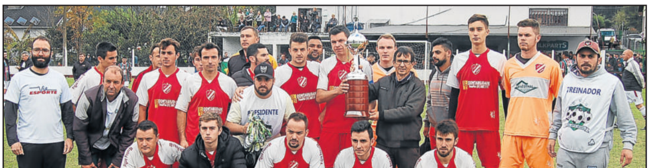
Juventude de Brochier, vice-campeão dos Aspirantes