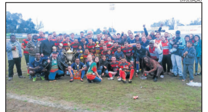
União Santo André e Penharol confraternizaram após a decisão do Amador de Lajeado