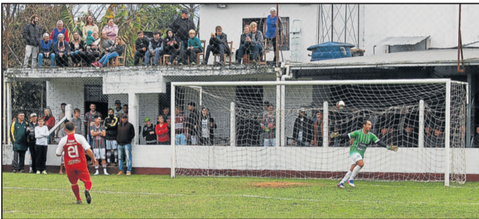
Juventude desperdiçou pênalti e deu início à festa do 11 Amigos