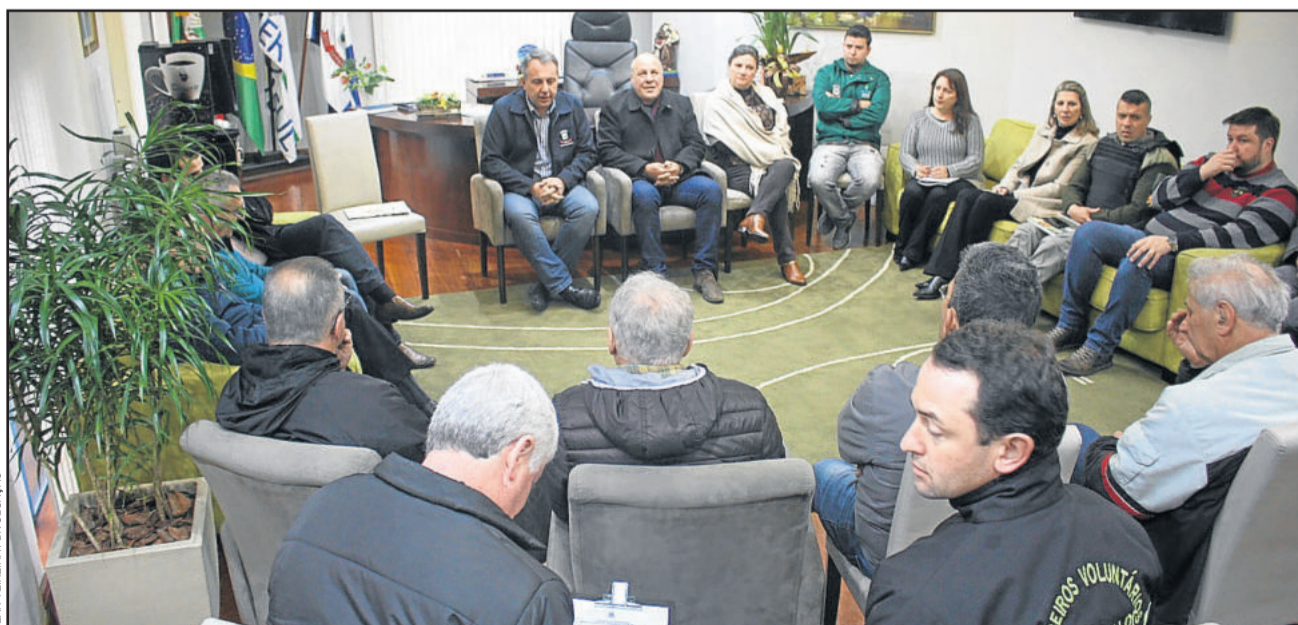
Também foram discutidas ações para situações de emergência