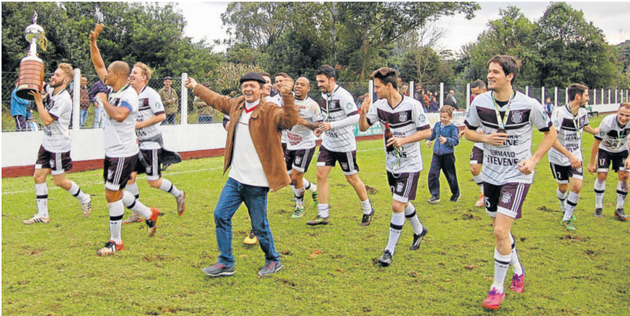
ECAS deu a volta olímpica em Westfália pela quarta vez

O União Santo André confirmou, na tarde deste domingo (08/07), o título do Campeonato Municipal de Lajeado. Jogando na Arena Alvi Azul, voltou a golear o Penharol, desta vez pelo placar de 4 a 0, para ficar com título na categoria Titulares.