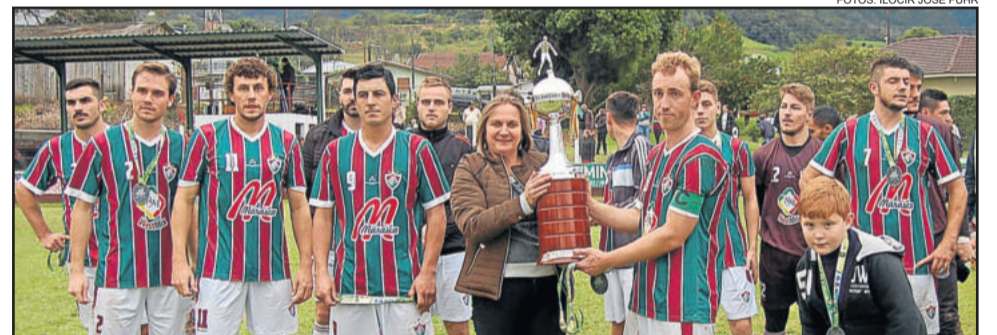
Fluminense, vice-campeão dos Titulares