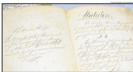
Primeiro livro de atas conta a fundação do coral, em 1877

A Sociedade de Cantores Aliança é considerada um dos mais antigos coros do