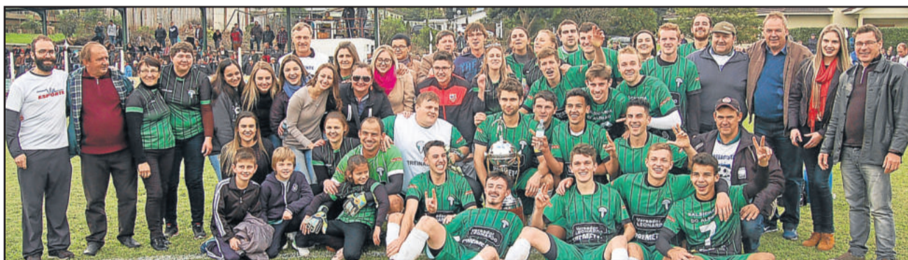
11 Amigos conquistou o título nos Aspirantes