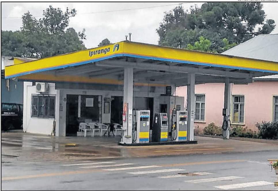
A mudança no edital abrange apenas o único Posto de Colinas, localizado a 180 metros da prefeitura