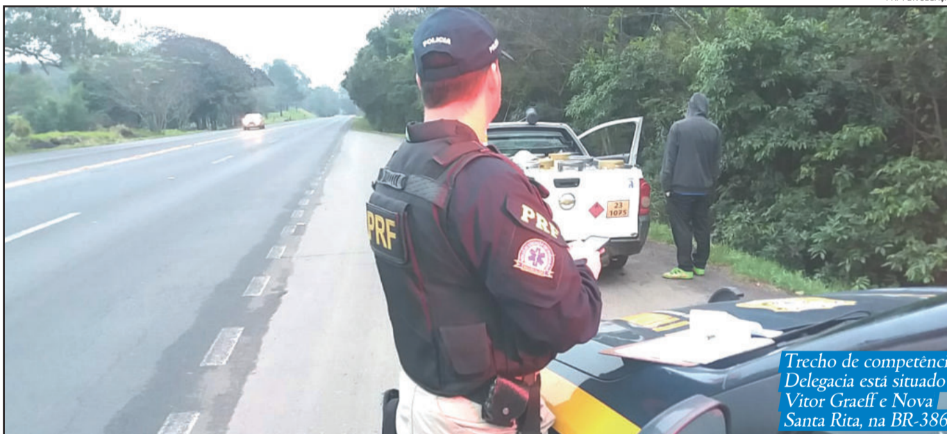
Trecho de competência da 4ª Delegacia está situado entre Vitor Graeff e Nova Santa Rita, na BR-386

Entre 1º de janeiro e 30 de junho deste ano, 69 pessoas foram detidas e 13 veículos foram recuperados. As apreensões de drogas e cigarros foram superiores ao mesmo período do ano passado: Maconha 6.216 kg no 1º semestre de 2018 e 775 kg no 1º semestre de 2017. Cigarros foram 477 mil maços no 1º semestre de 2018 e 5 mil maços no 1º semestre de 2017. Também ocorreu a apreensão de 25 kg de cocaína, 50 kg de crack e 10 unidades de ecstasy, além de bebidas e eletrônicos.