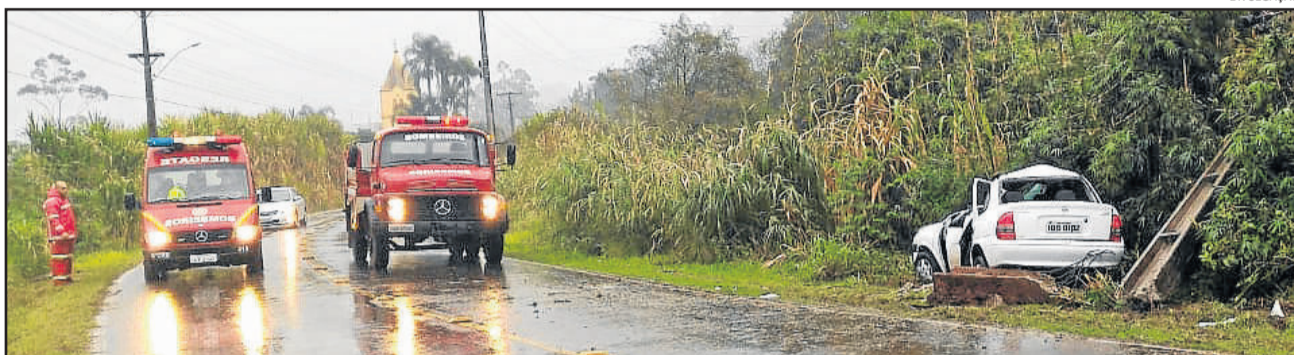
Acidente fatal ocorreu na localidade de Seca Baixa

Em função da queda do poste, parte do Município de Imigrante ficou sem energia elétrica e internet durante a manhã.