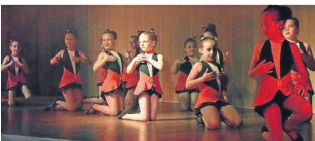
Meninas acima de dois anos estiveram se apresentado