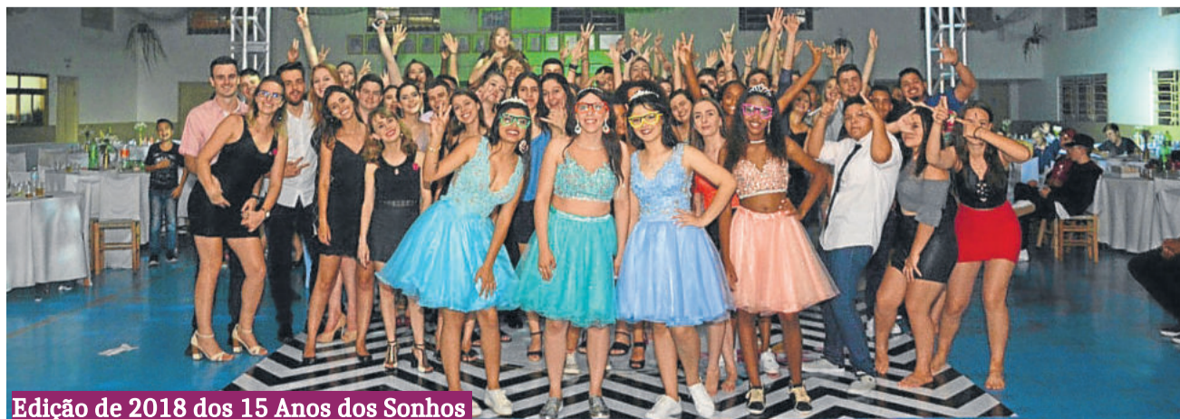
Edição de 2018 dos 15 Anos dos Sonhos

A vice-presidente ressalta que com as edições anteriores, erros foram corrigidos e acertos foram mantidos. “Em relação aos patrocinadores, há uma preocupação de dar um feedback melhor. Nesta edição, mais de 40 empresas já são parceiras, e nove delas são patrocinadores diamante (colaboraram com mais de R$ 1.000,00 em dinheiro, materiais ou serviços). Elas são a Supply idiomas e traduções, a Rirole Noivas, o Master Som DJ Dan, a Clínica Reinheimer Odontologia Especializada, Sú Hauschild Coreografias, Cristal Jóias e Ótica, Gui Reis Fotografia, William Perin fotografia e Iólany Haberkamp Personal Stylist.