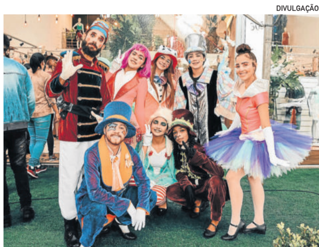
Personagens lúdicos para encantar as crianças