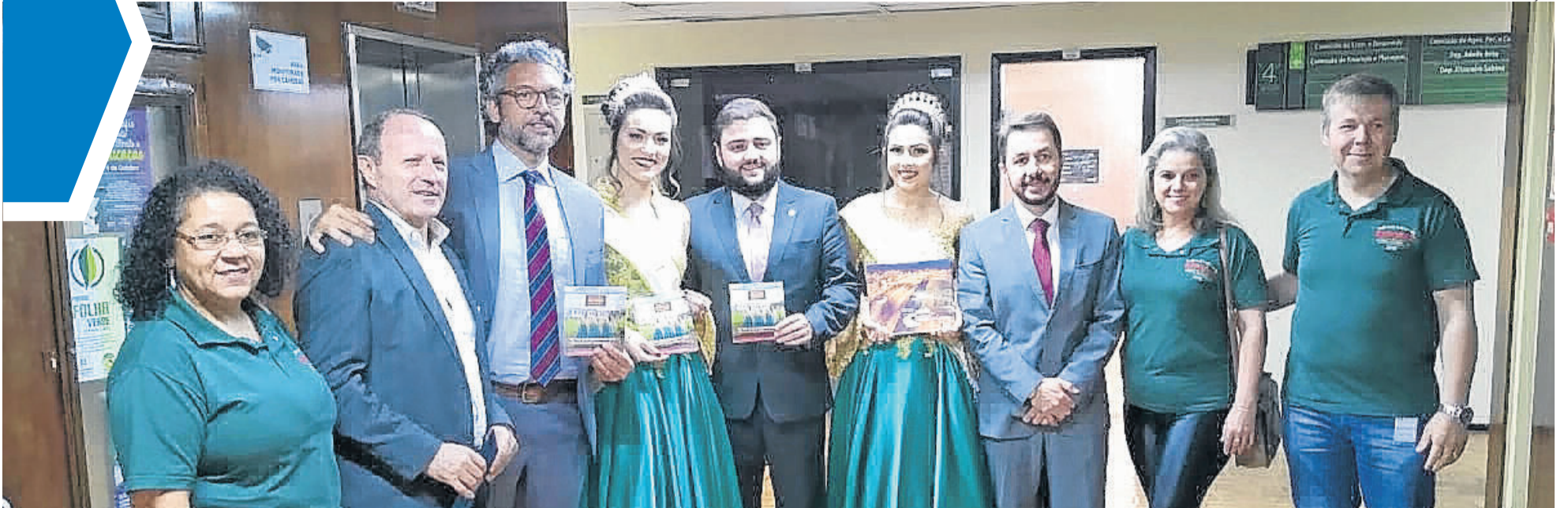
Comissão Organizadora e a corte do município de Fazenda Vilanova estiveram na Assembleia Legislativa para divulgar a feira