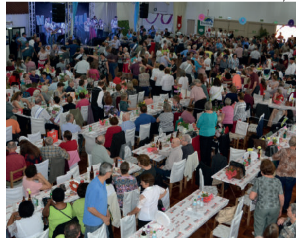
Encontro Municipal do Idoso de Teutônia mostra a participação das pessoas acima de 60 em eventos

“SE VOCÊ VIU OUTRAS PESSOAS TAMBÉM PODEM VER