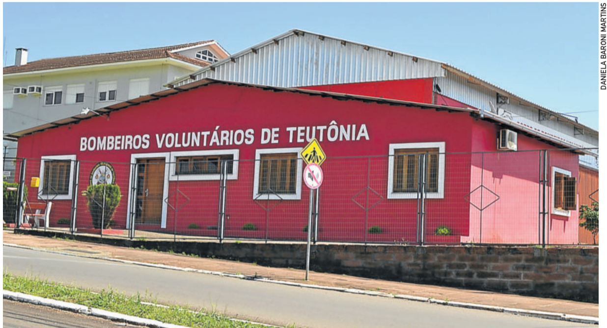
Recursos permitirão investimentos em veículo e equipamentos da corporação

De acordo com o comandante, o recurso é muito importante para a corporação. Ele destaca que os recursos recebidos das prefeituras e da comunidade cobrem apenas parte dos gastos da corporação. Com o valor recebido da EGR será possível realizar ainda mais investimentos em viaturas e equipamentos.