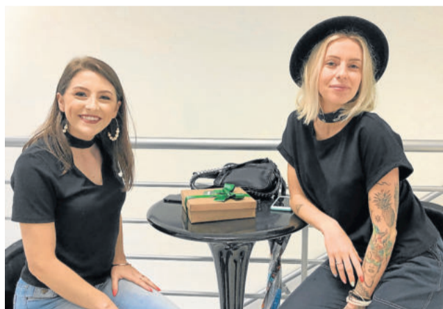
Cientes curtiram espaço do mezanino