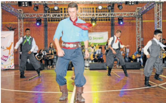
Diversas apresentações farão parte da Noite Cultural