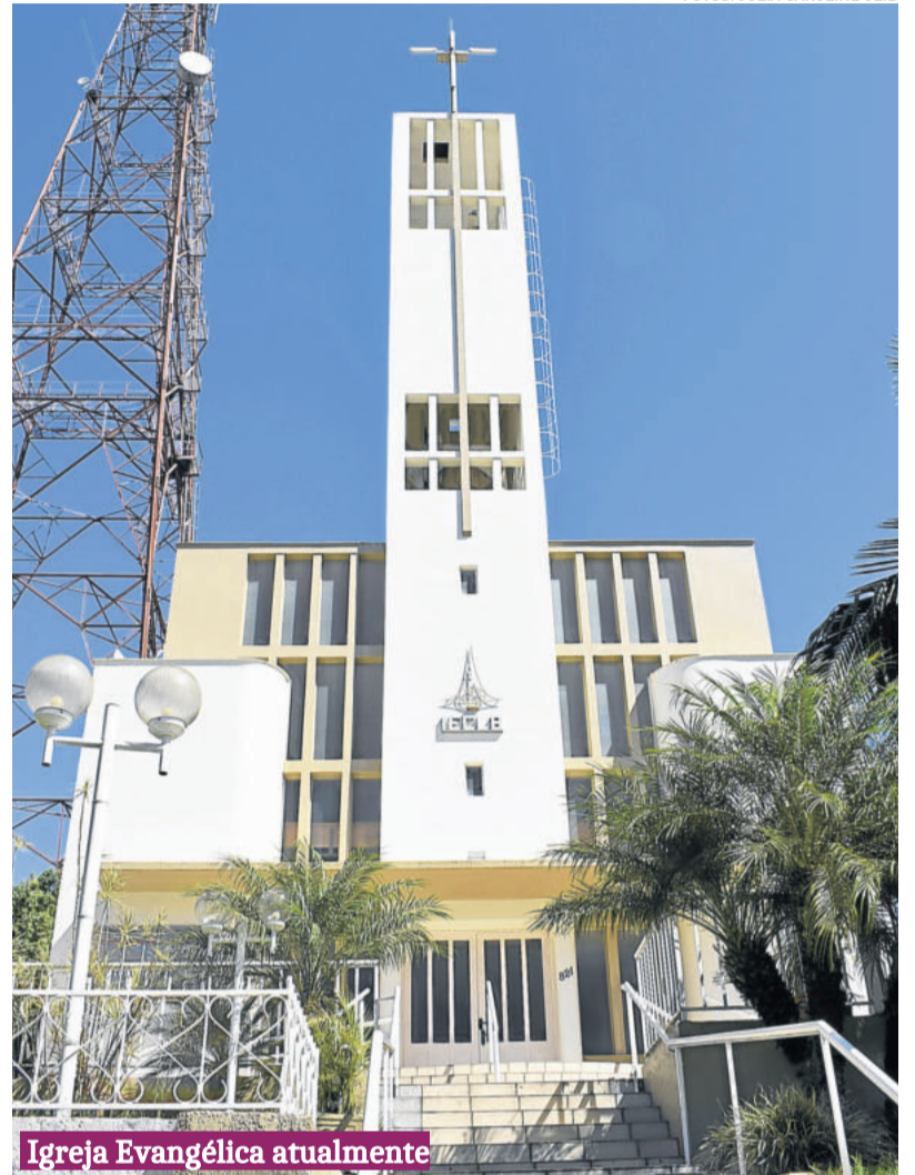
Igreja Evangélica atualmente