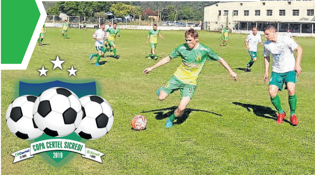
Canarinho (verde) joga primeira partida fora de casa nas quartas de final