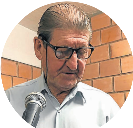
NELSON EGON SCHEFFLER