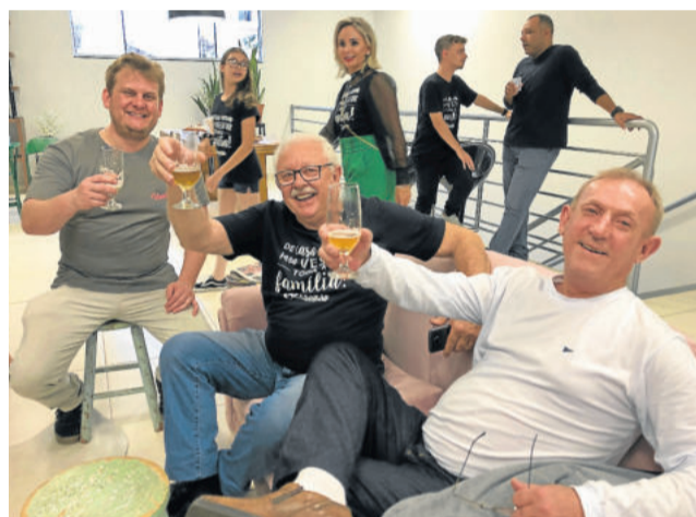
Primeiros fornecedores da Casarão seguem parceiros