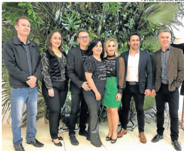
Parcerias marcaram presença no novo espaço