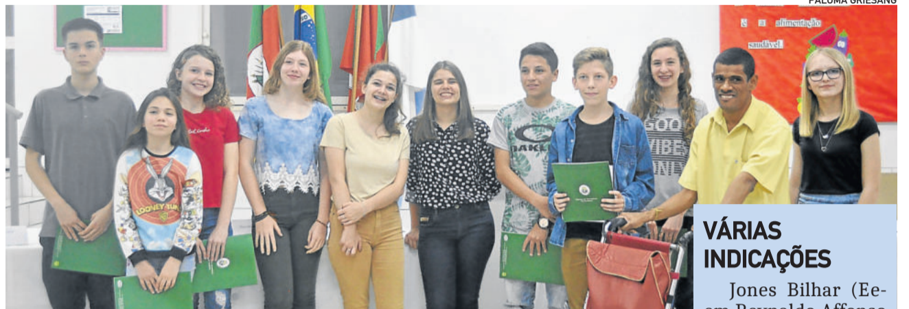
Vereadores Mirins de Teutônia