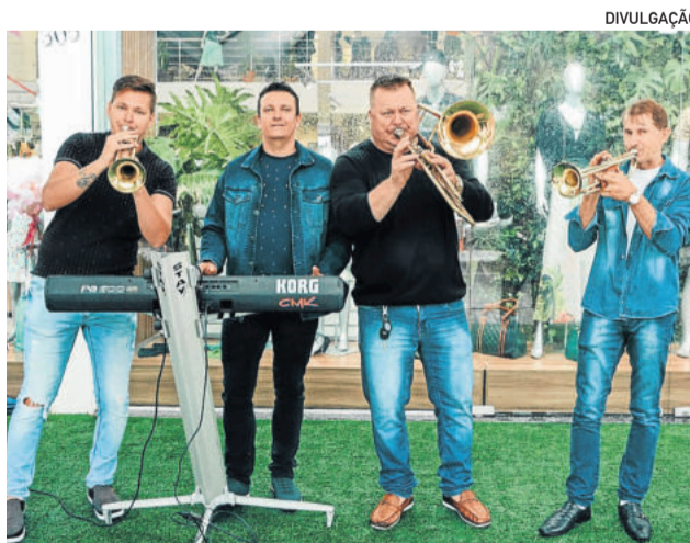
Na inauguração, teve banda alemã