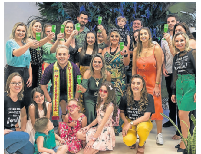
Modelos clientes que desfilaram a nova coleção