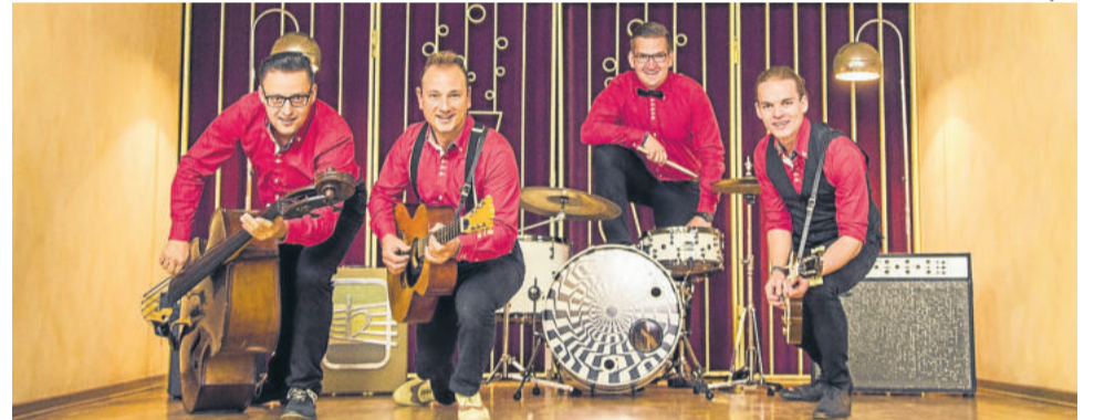
Die Eis Boys trazem rock em alemão e nas versões originais