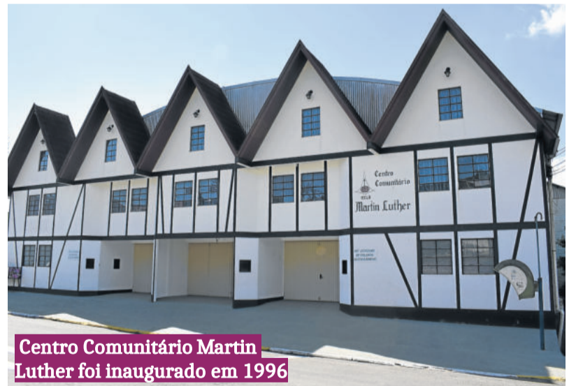
Centro Comunitário Martin Luther foi inaugurado em 1996