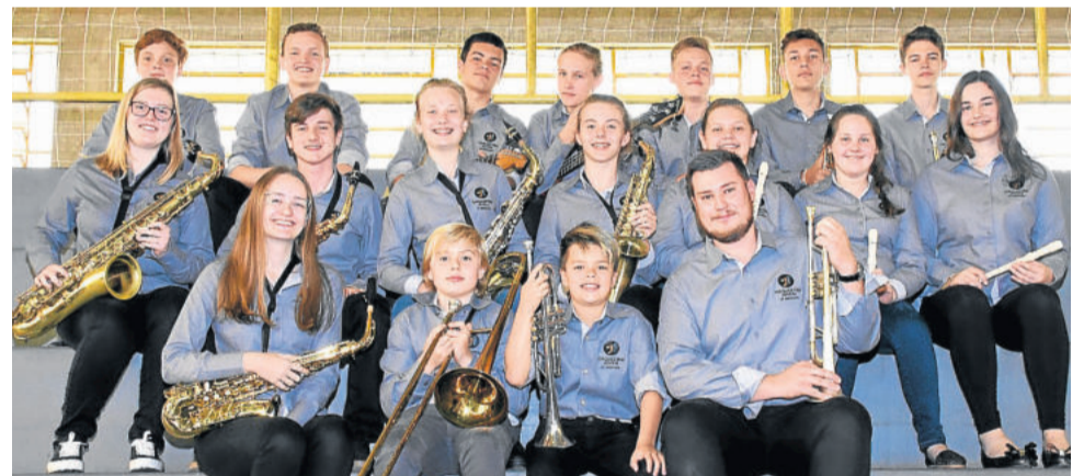
Orquestra Jovem de Imigrante