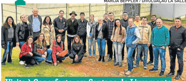
Visita à Coperforte, em Santana do Livramento

Compartilharam conhecimentos no Seminário Internacional de Desenvolvimento Cooperativista, na Prefeitura de Santana do Livramento, visitaram a Cooperativa Regional dos Assentados da Fronteira Oeste Ltda. (Coperforte), em Santana do Livramento, especializada na produção leiteira e fornecedora para a Latvida de Estrela, e a Vinícola Bodega Cerro Chapéu Carrau, uma das vinícolas pioneiras do Uruguai, com mais de 260 anos de história.