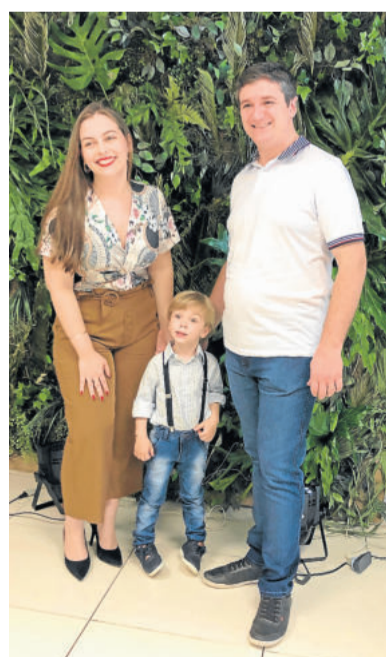
Família na passarela