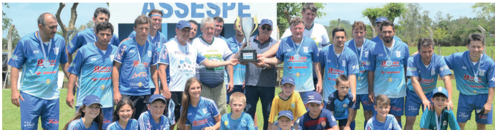
ASSESPE vice-campeã regional de Veteranos pelo segundo ano seguido