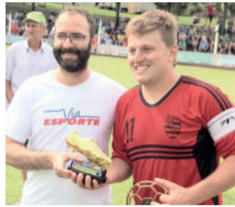
Marquinhos foi craque da final e artilheiro