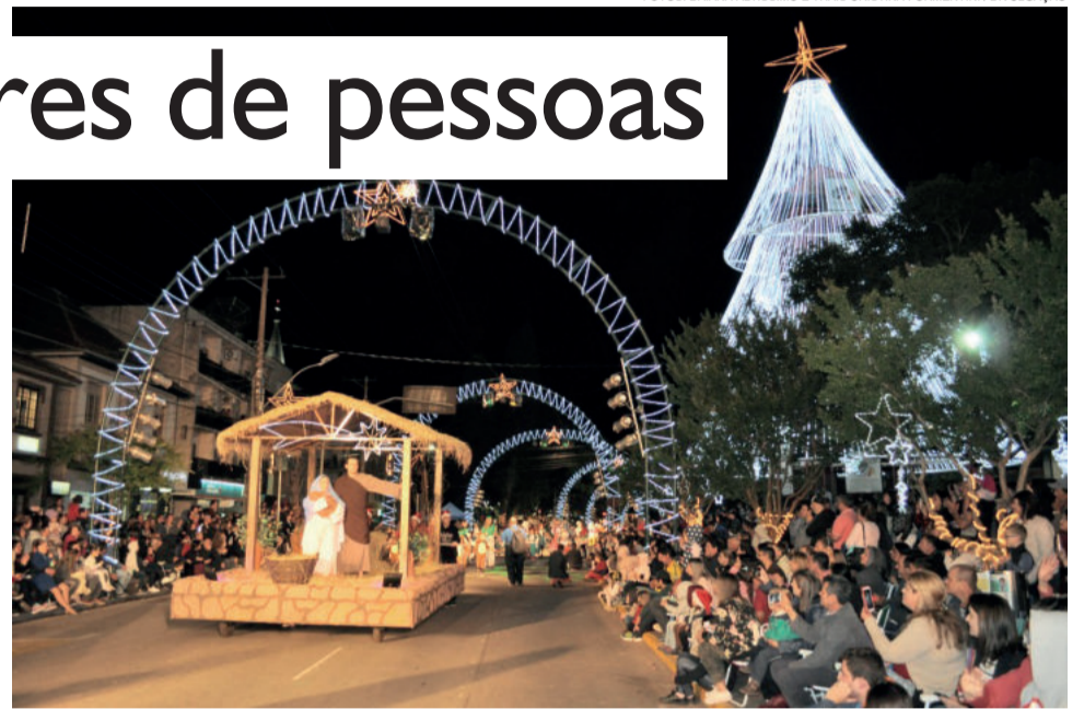
Mais de 700 voluntários participaram do desfile

O desfile iniciou na Rua Coberta e seguiu pela Rua Buarque de Macedo, encerrando nas proximidades da prefeitura. Além disso, muitas pessoas ficaram nas calçadas para prestigiar de perto o espetáculo. Ao término do desfile, que contou com a chegada do Papai Noel e show de fogos, muita neve começou a cair em Carlos Barbosa e continuou por mais de 30 minutos, encantando o público, que pôde registrar o momento.