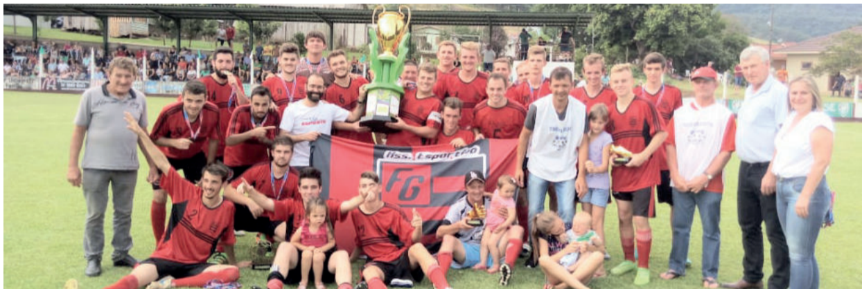
Flamengo foi campeão invicto da competição