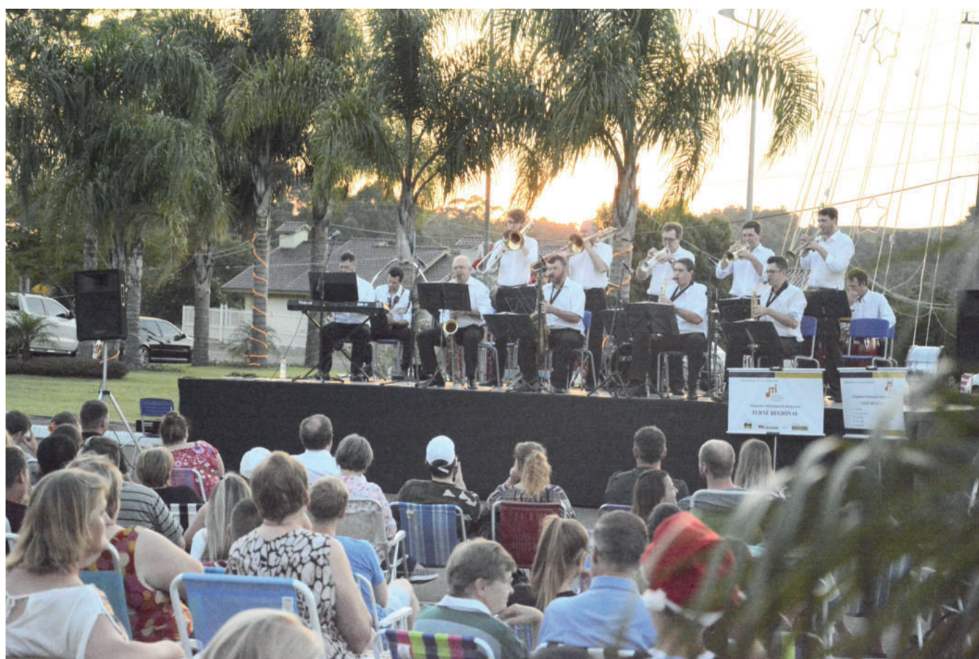
Orquestra Municipal de Imigrante foi atração do primeiro Acordes ao Entardecer