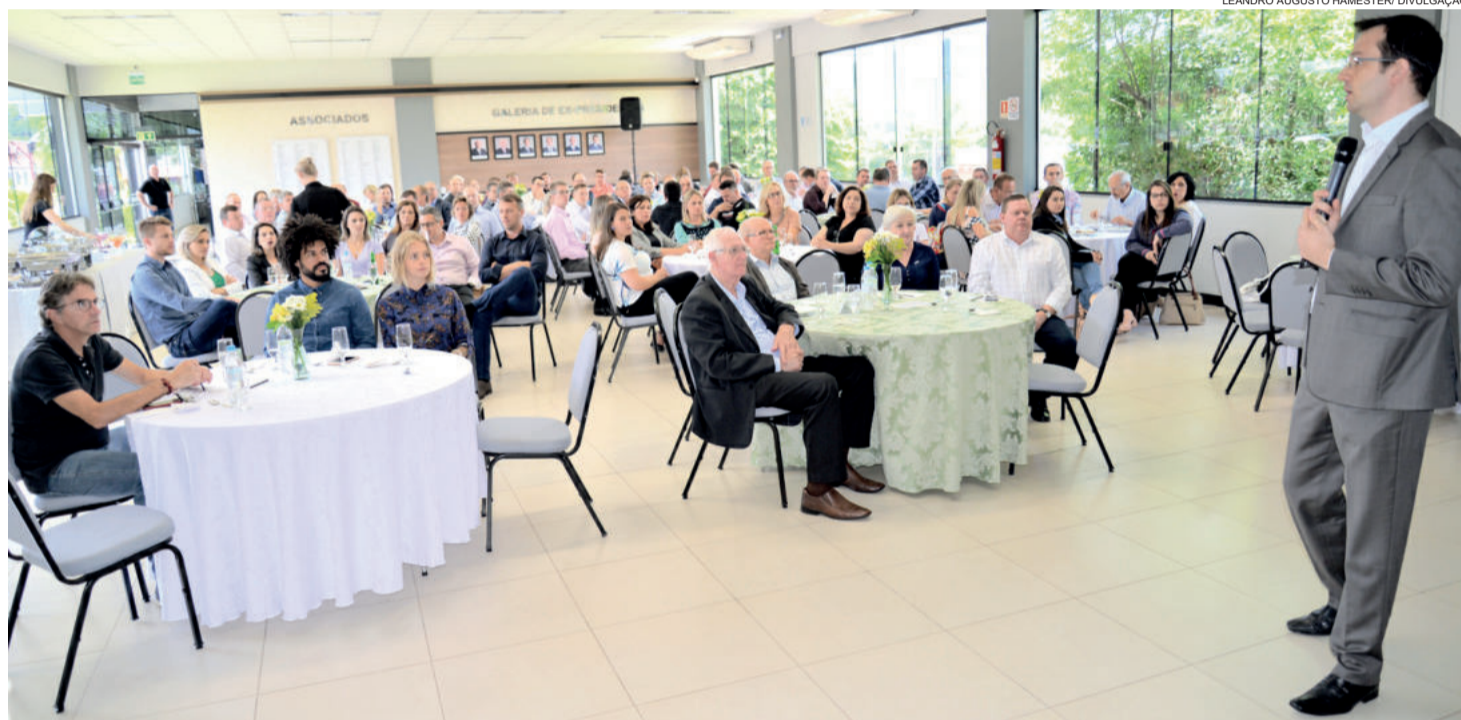
Última edição do Almoço Empresarial da CIC Teutônia em 2018 reuniu grande público no Auditório 03 da entidade

Segundo o economista, o Brasil vai crescer em 2019 mais que em 2018. “Não crescemos muito este ano, algo em torno de 1,3%,”