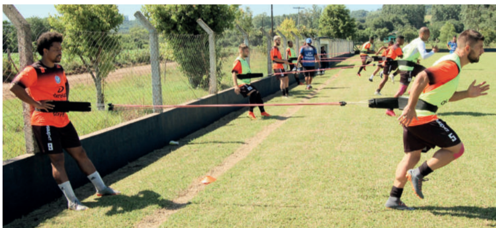
Atletas fizeram tração com borracha em uma das atividades nesta segunda