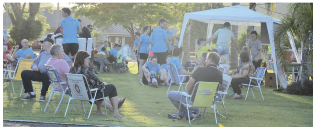
Fim de tarde foi uma oportunidade para reunir a família e os amigos em frente à Prefeitura