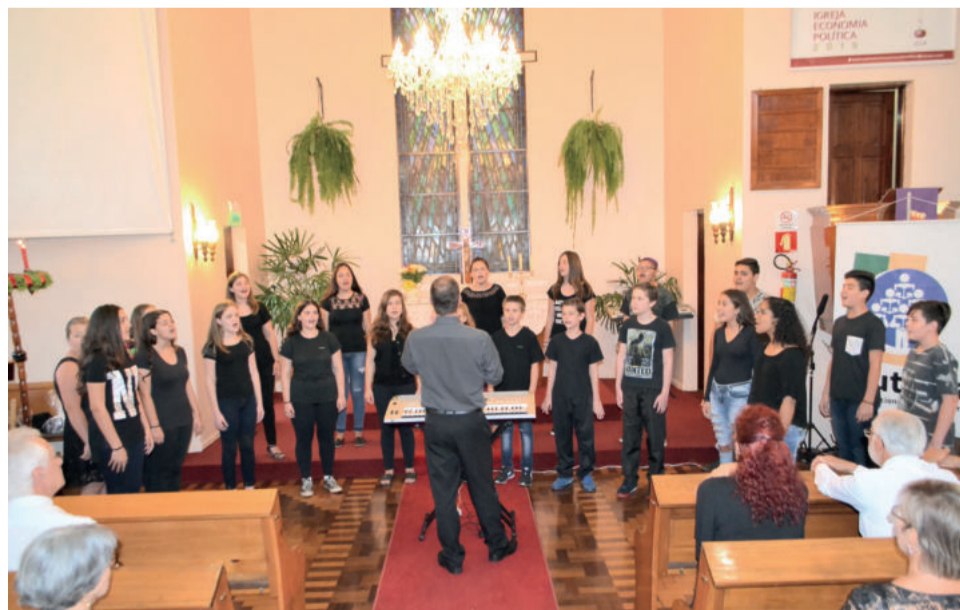
Coral Jovem Municipal de Teutônia