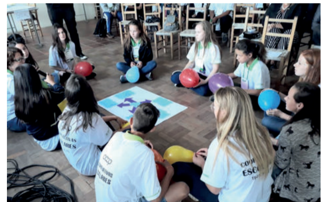
Alunos realizaram dinâmicas de acordo com as temáticas do cooperativismo

A iniciativa visa a criação de associações de estudantes. Estas têm finalidade educativa, nas quais alunos são incentivados a desenvolver atividades econômicas, sociais e culturais em benefício dos jovens associados. Também trabalham a formação de futuros líderes, gestores, empreendedores e cidadãos. Através destas organizações os estudantes vivenciam princípios do cooperativismo, participam do desenvolvimento de projetos, oficinas e trabalham disciplinas como gestão, educação financeira, cooperativismo e outras. A adesão das escolas é voluntária e as cooperativas devem ser formadas somente por alunos. Estes serão o suporte pedagógico para a implantação e desenvolvimento do programa e um professor-orientador.