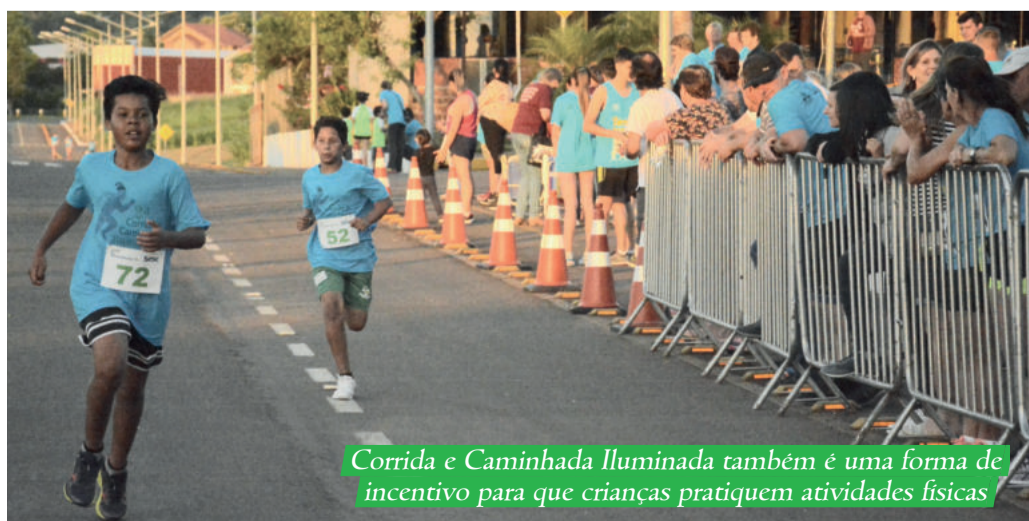
Corrida e Caminhada Iluminada também é uma forma de incentivo para que crianças pratiquem atividades físicas

A 2ª Corrida e Caminhada Iluminada foi uma realização da Prefeitura Municipal de Westfália, por meio da Secretaria de Educação, Cultura, Turismo e Desporto (SMEC), e do SESC de Farroupilha. A programação ainda contou com o apoio da Sicredi Ouro Branco.