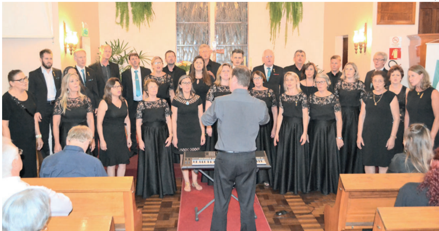
Corais municipais de Teutônia e Imigrante se apresentaram em conjunto no final do evento

Após, foi a vez do Coro Municipal de Esteio fazer a sua apresentação. Criado em 2007 e constituído por cantores amadores, o coral tem como regente o maestro Renato