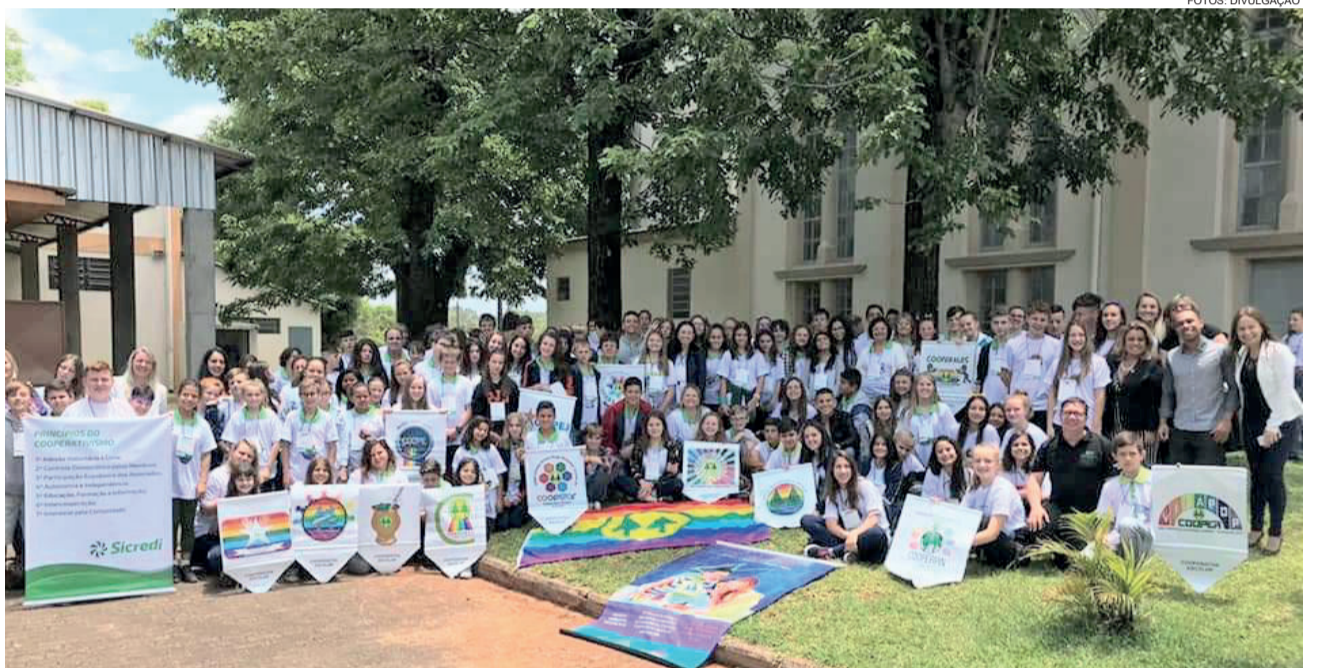
Ao todo mais de 170 pessoas participaram da integração

Em Estrela, a cooperação entre a Sicedi Ouro Branco e o governo local, através da Secretaria da Educação, movimentou atualmente oito cooperativas, cinco remanescentes da temporada passada e outras três novas. Participaram em 2017 e seguem este ano as unidades das Escolas de Ensino Fundamental (Emefs) Pedro Jorge Schmidt, Cônego Sereno Hugo Wolkmer e Arnaldo José Diel; e as privadas dos colégios Martin Luther e