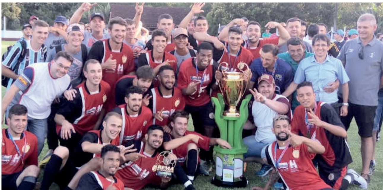
Recreativo é o segundo campeão da Copa Via Esporte / Rema Troféus