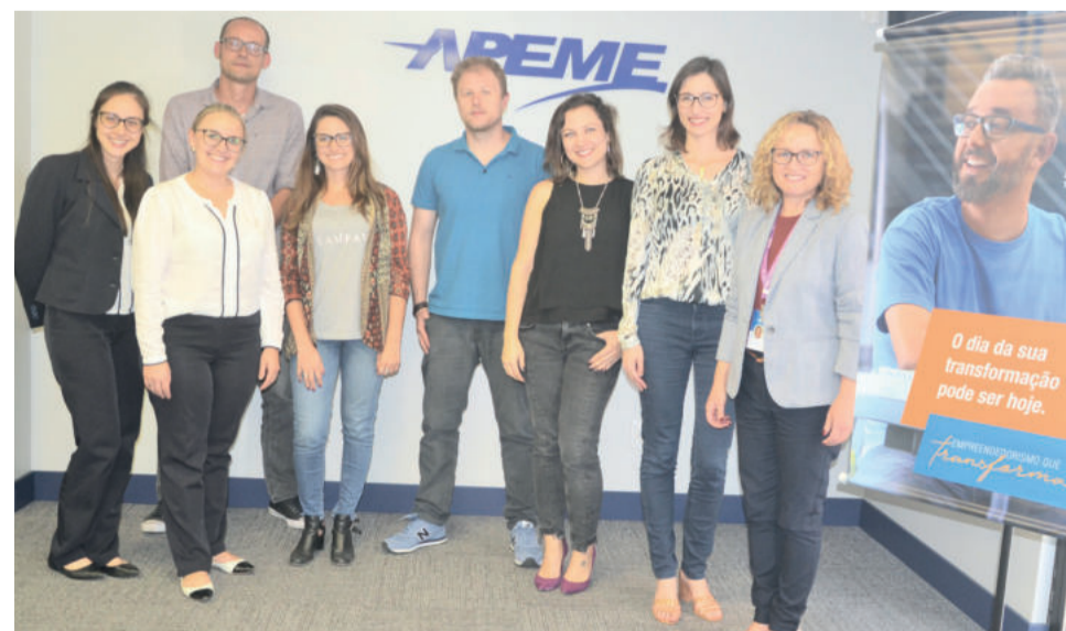
O projeto Economia Criativa reuniu diversos profissionais

turais, patrimônio e arte, música, artes cênicas, editorial, audiovisual, P&D, biotecnologia e TIC.