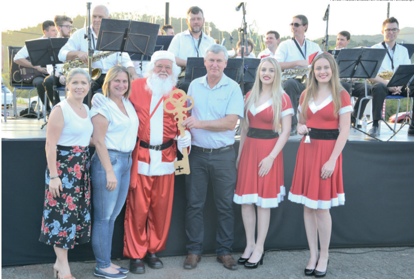
Autoridades e soberanas entregaram, ao Papai Noel, a chave da cidade

Paralelo, haverá mateada com a erva-mate Gaúcha da Serra, ornamentação natalina para fotos e presença do Papai Noel. Solicita-se, novamente, que a comunidade traga cadeiras para uma melhor acomodação.