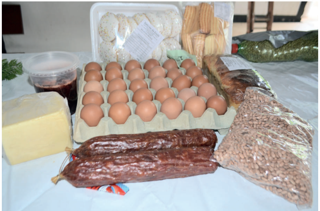
Com o Susaf, agroindústrias teutonienses poderão comercializar seus produtos de origem animal para todo o Estado

Segundo o SIM de Teutônia, de início quatro agroindústrias poderão ser indicadas, sendo uma de produtos cárneos, um entreposto de mel e duas granjas de ovos (sendo uma de ovos coloniais). O número pode aumentar nos próximos meses, pois alguns empreendimentos estão se regularizando.