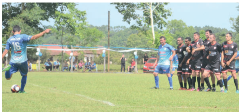
ASSESPE (azul) tentou, mas não conseguiu vencer a partida