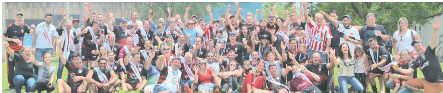
Estudantes comemorou o título regional de Veteranos em 2018