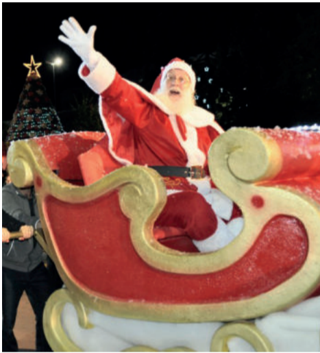
Ao final do desfile teve a chegada do papai noel

O Natal no Caminho das Estrelas contempla grandes eventos que atraem multidões para o Parque da Estação, em Carlos Barbosa. Dentre eles a Parada de Natal, um espetáculo coberto de alegorias, personagens, bailarinos e efeitos especiais, ao som de canções