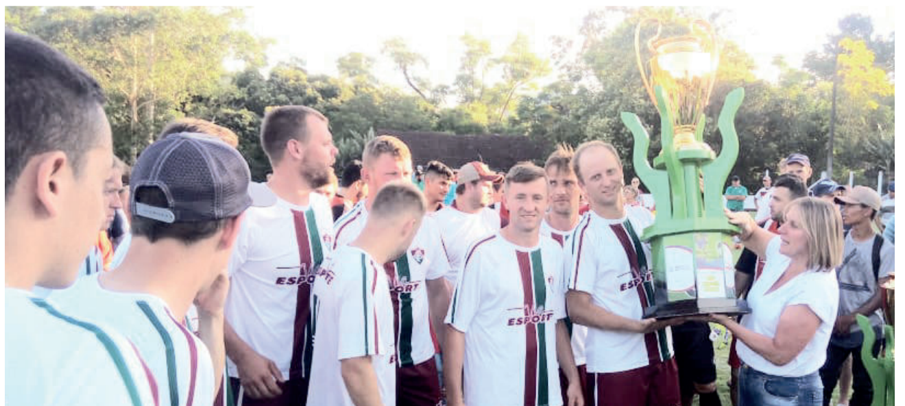
Fluminense deixou o título escapar nas cobranças de pênalti