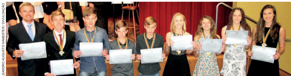
Representantes da equipe teutoniense foram homenageados pela Federação de Atletismo do Estado do Rio Grande do Sul

A próxima edição do Troféu Faergs ocorre em dezembro de 2019, em Ivoti. A Equipe de Atletismo Teutônia/Colégio Teutônia/Languiru/Sicredi/Elegê abre a temporada em março de 2019, com o Troféu IENH, em Novo Hamburgo.