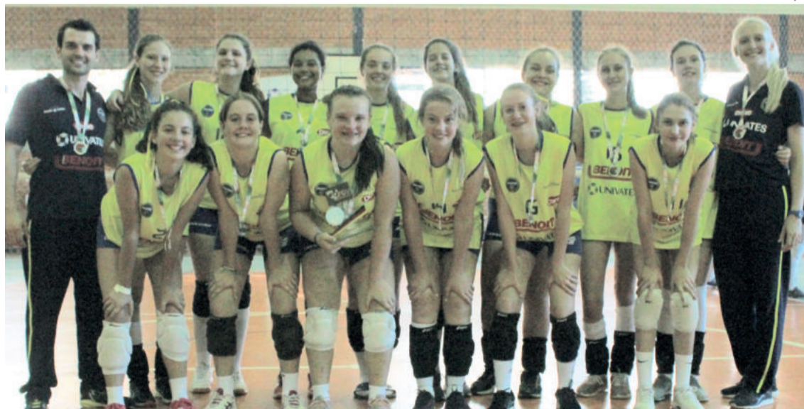
Mirim da Languiru/CML/Avates conquistou o vice-campeonato