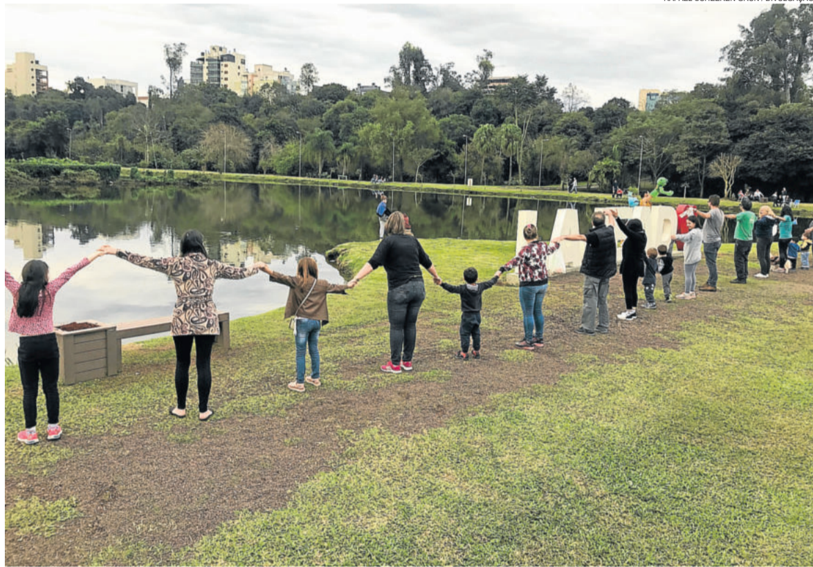
Abraço ao redor do lago simbolizou o zelo pelo meio ambiente