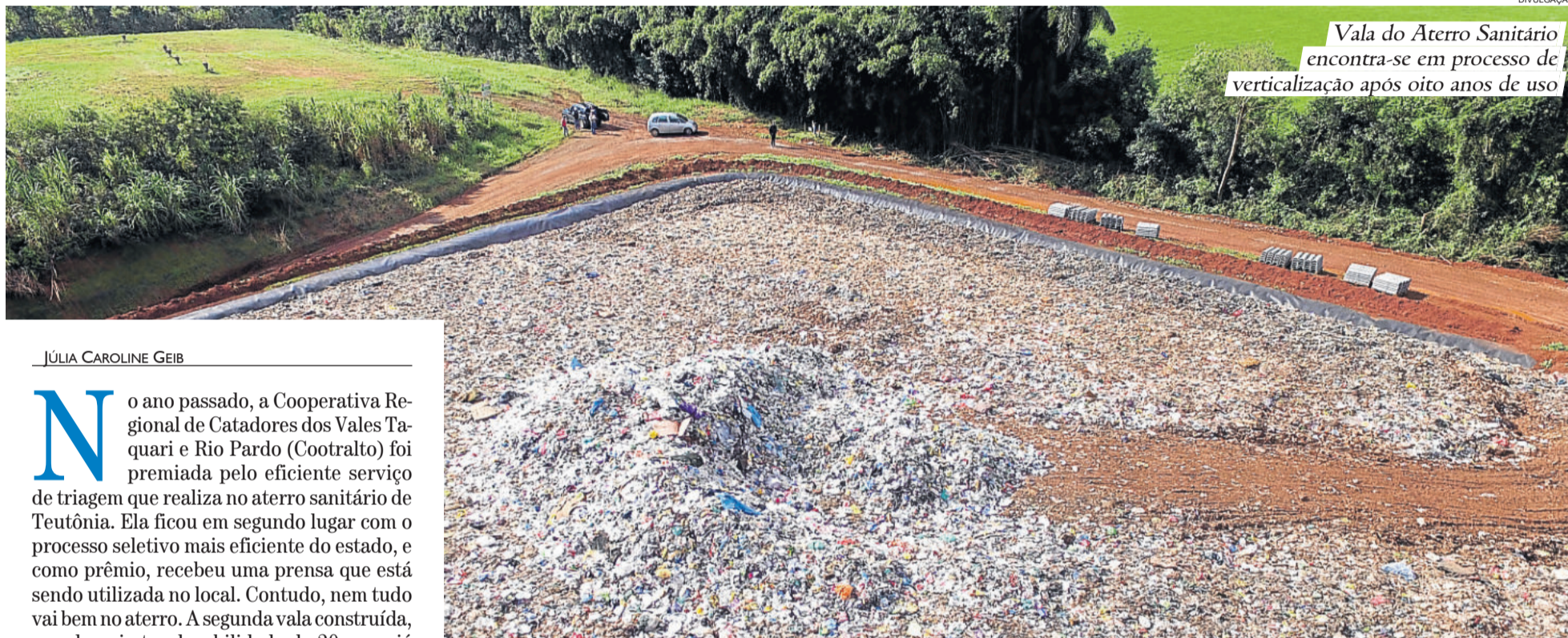
Vala do Aterro Sanitário encontra-se em processo de verticalização após oito anos de uso