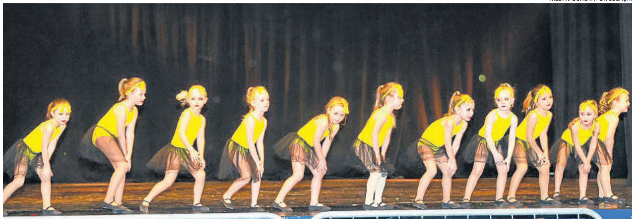
Uma das coreografias da Corpo Livre Unidade Teutônia