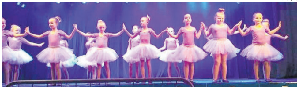
Pequenas bailarinas da Ritmos e Fitness no palco do festival