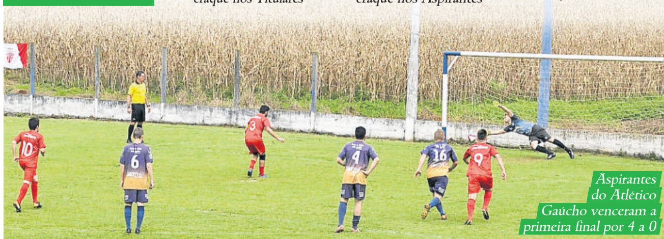
Aspirantes do Atlético Gaúcho venceram a primeira final por 4 a 0