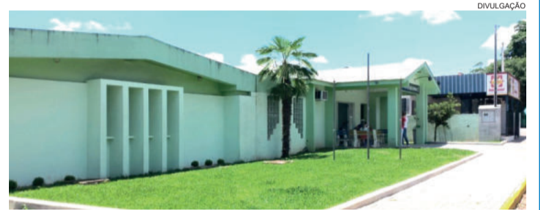
O atendimento quinzenal passará a ser diário

As solicitações de agendamento devem ser feitas presencialmente de segunda a sexta-feira, das 7h30 às 19h, sem fechar ao meio-dia. Já as consultas com o pediatra seguirão normalmente nas segundas-feiras, com horários agendados e algumas fichas para emergências do dia. O atendimento por demanda não sofrerá nenhuma alteração.