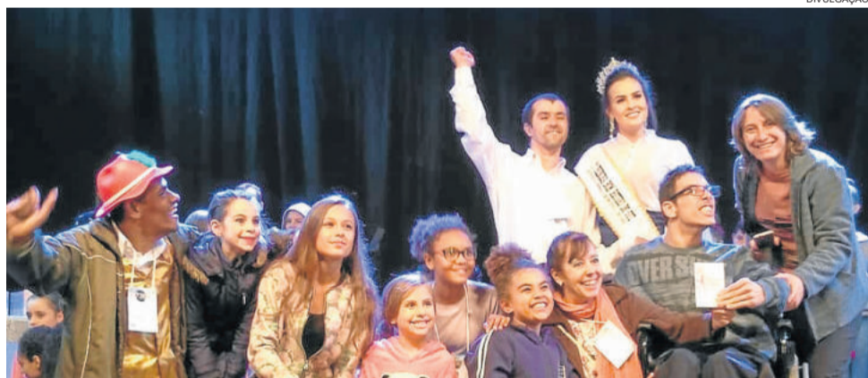
Grupo Dança e Ritmos do Cemef recebendo a premiação