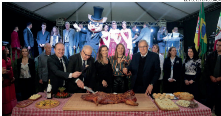
Em vez de brinde, abertura contou com Leitão à Encantado

Vinhos, espumantes, cerveja artesanal, sucos, refrigerantes, chás e água somam mais de 40 tipos de bebidas diferentes para