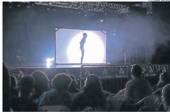
Grupo Corpo Livre inovou com parte de dança em sombra

superação das limitações, com a participações de dois alunos com necessidades especiais.