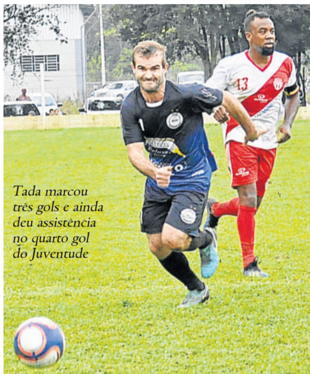
Tada marcou três gols e ainda deu assistência no quarto gol do Juventude