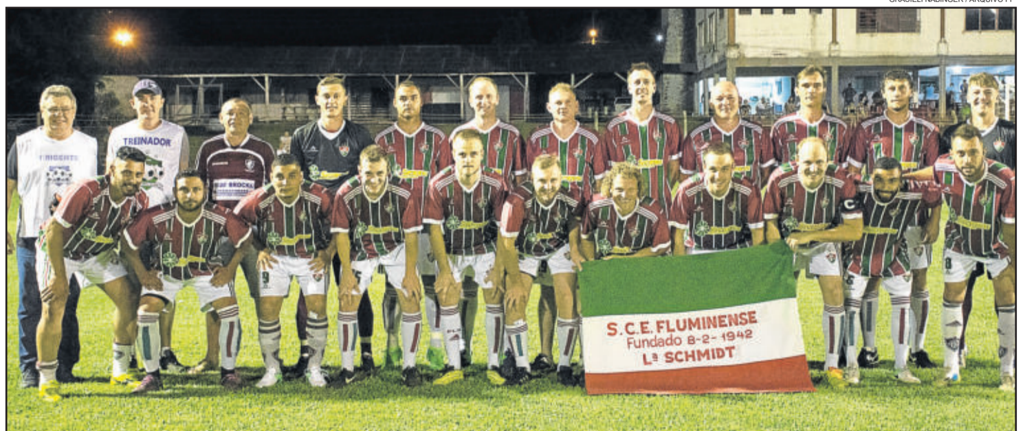
Fluminense de Westfália é o atual campeão

HS consórcios Uma empresa do Grupo Herval