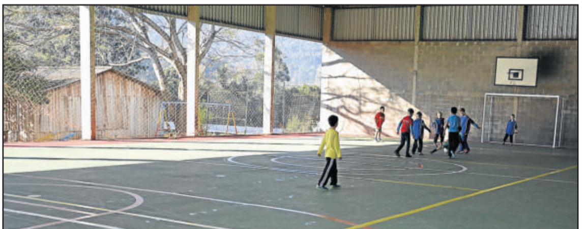
Quadra esportiva ainda recebeu nova pintura