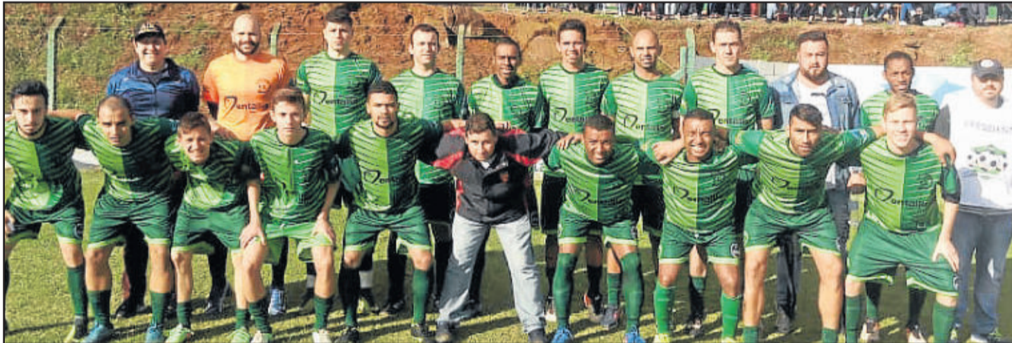
Rudibar de Bom Retiro do Sul