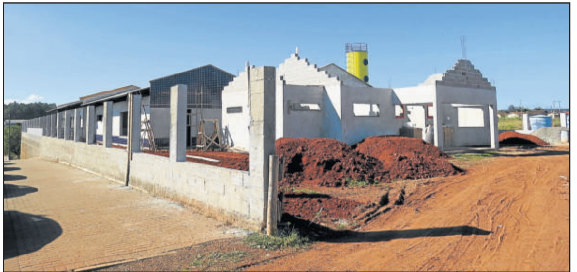
Obras dão sinal de avanço, mas pausa nos repasses pode afetar cronograma