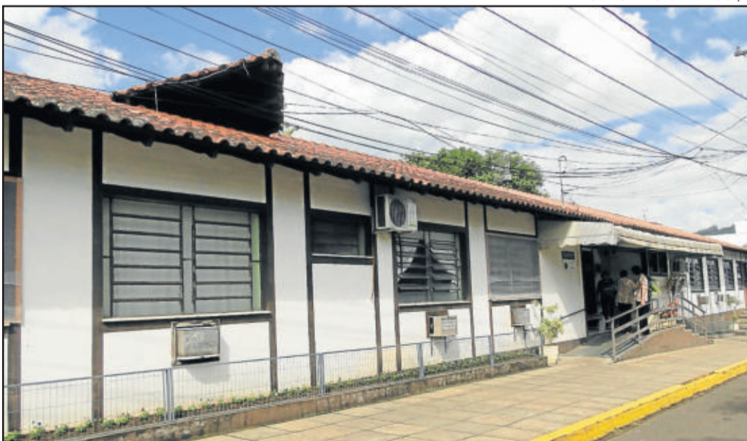
Atualização é feita durante a visita da agente Comunitária de Saúde não sendo necessário o deslocamento até a secretaria