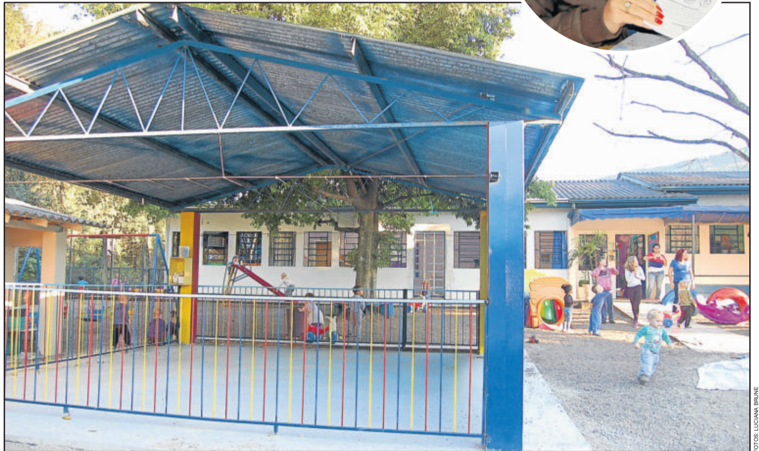
Espaço finalizado com parceria da Sicredi