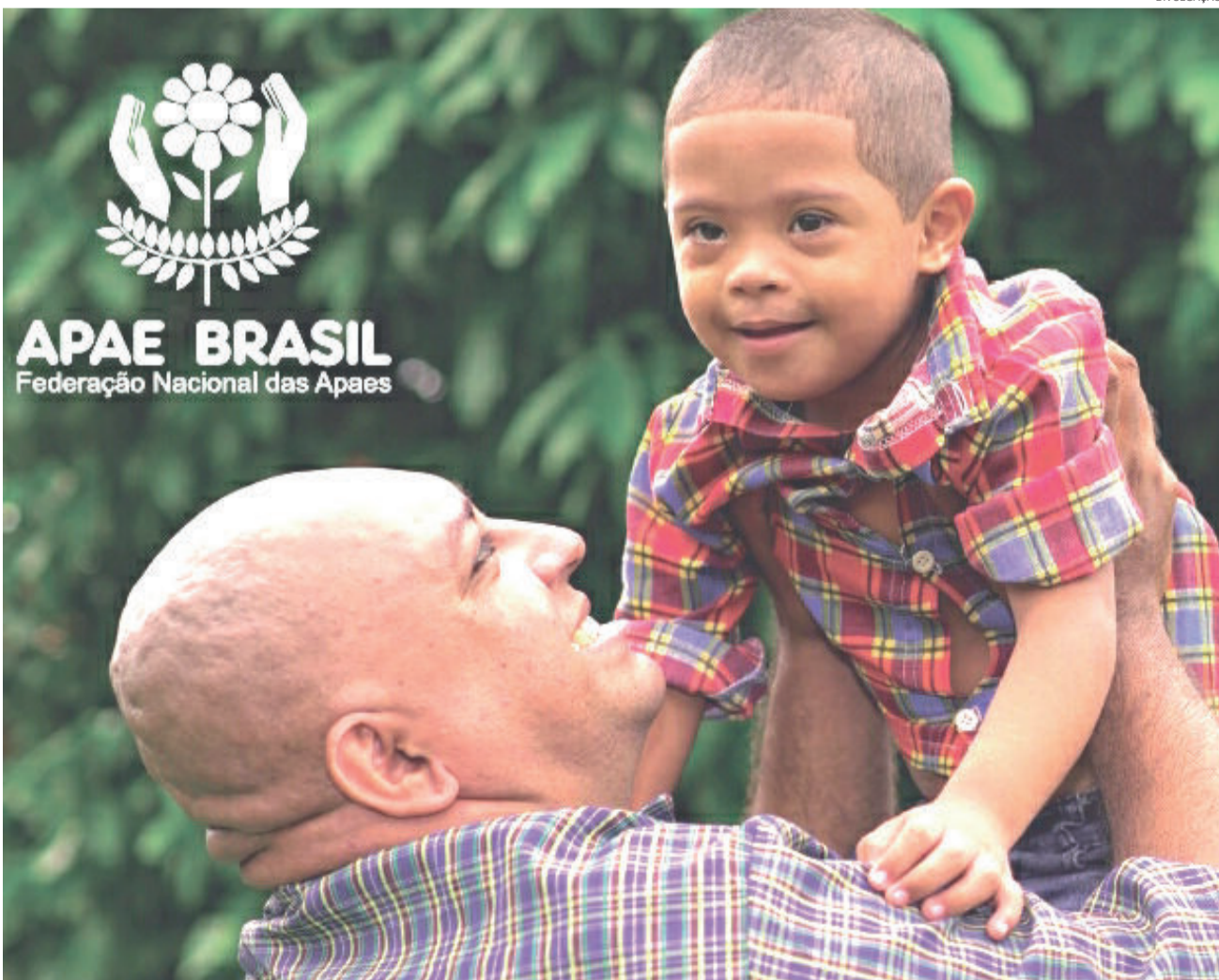
Tema deste ano enfatiza a família