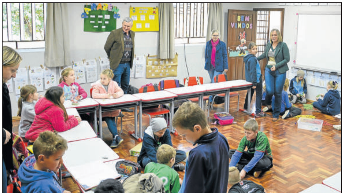
Alunos voltaram a frequentar o espaço no dia 30 de julho