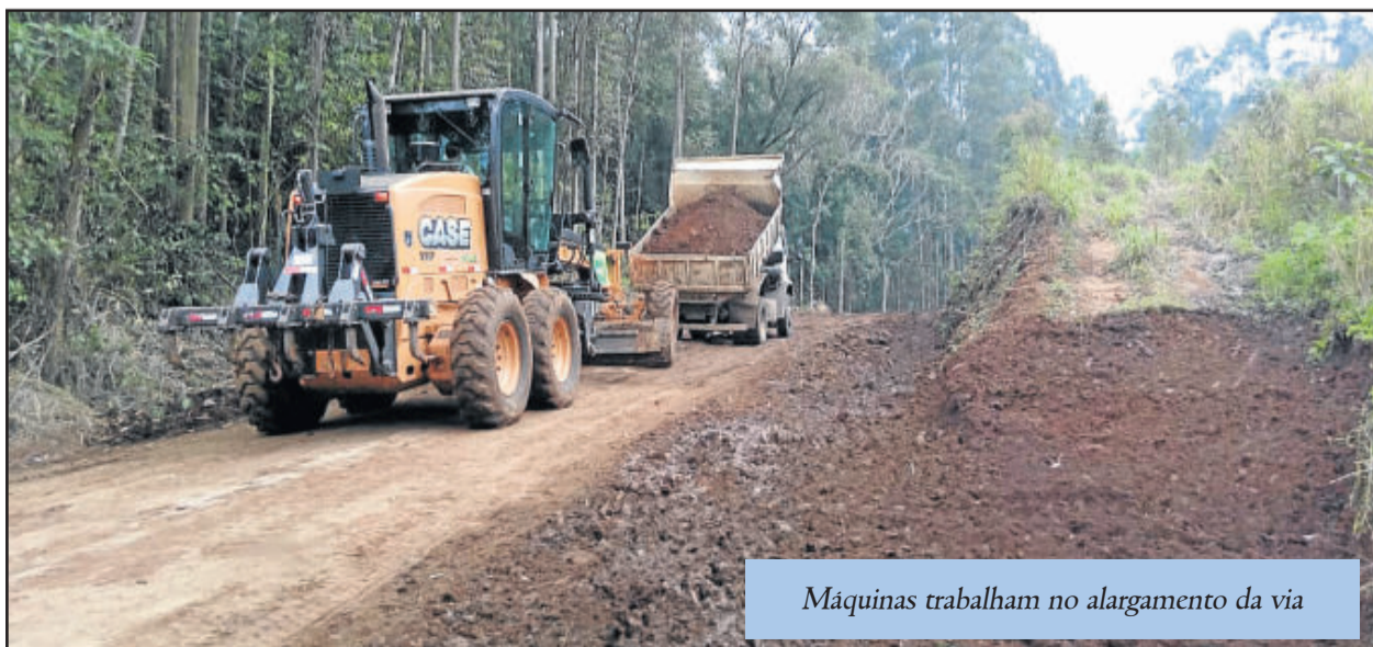
Máquinas trabalham no alargamento da via