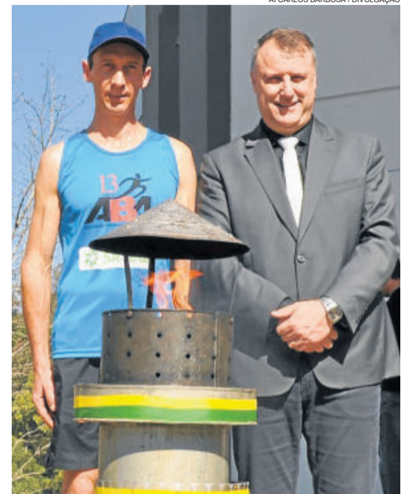
O evento é organizado pela Administração Municipal, através da Secretaria da Educação em parceria com a Liga de Defesa Nacional

A cerimônia acontecerá na Rua Coberta a partir das 13h30min, oportunidade em que os estudantes da EMEI Aurora e jovens do Centro Educativo Crescer farão apresentações artísticas. Na sequência, o Fogo Simbólico será guiado pela Associação de Bombeiros Voluntários de Carlos Barbosa até a sua sede, onde permanecerá até dia 02 de setembro. No dia seguinte, o fogo será conduzido às escolas que participaram das horas cívicas, com hasteamento e arriamento da bandeira. O evento é organizado pela Administração Municipal, através da Secretaria da Educação em parceria com a Liga de Defesa Nacional.