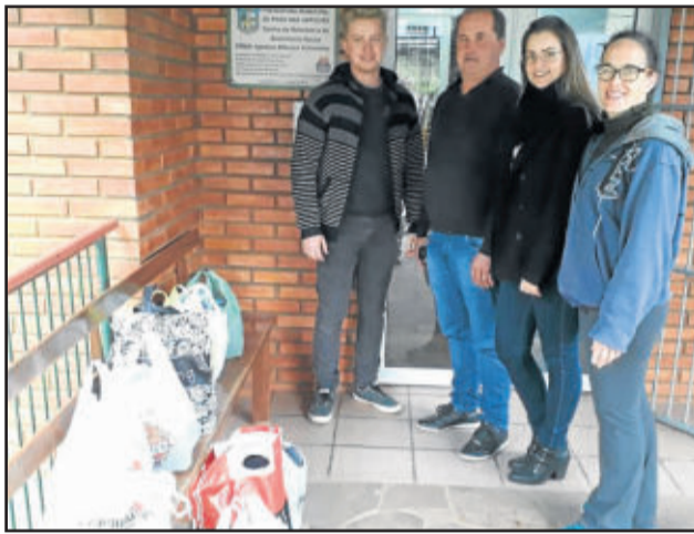
Agasalhos foram repassados ao CRAS

A palestra contou com 110 participantes, arrecadando 100 kg de alimentos e 40 agasalhos. Os alimentos foram repassados ao HOB. Os agasalhos foram entregues ao CRAS e ficarão à disposição dos munícipes.