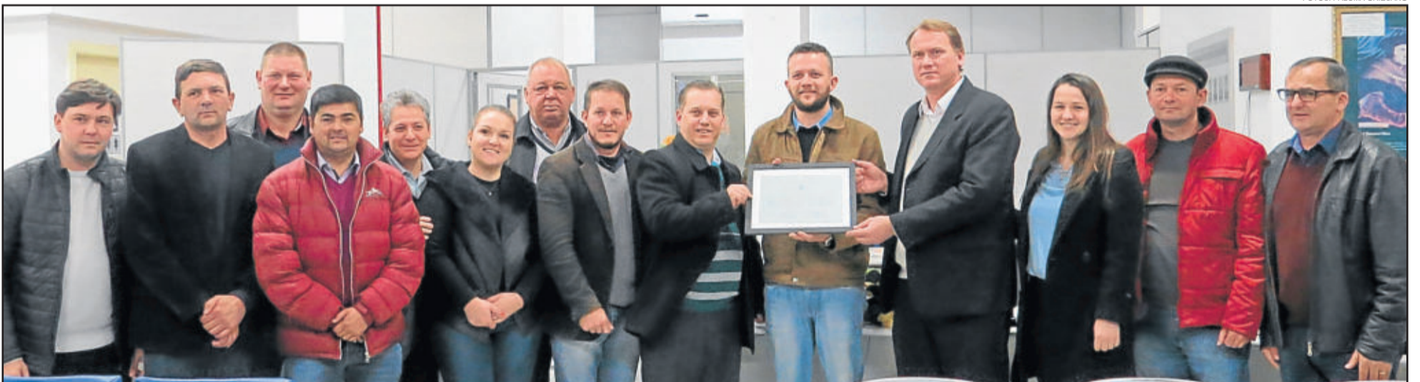
Certificado de reconhecimento foi entregue aos pastores da IECLB