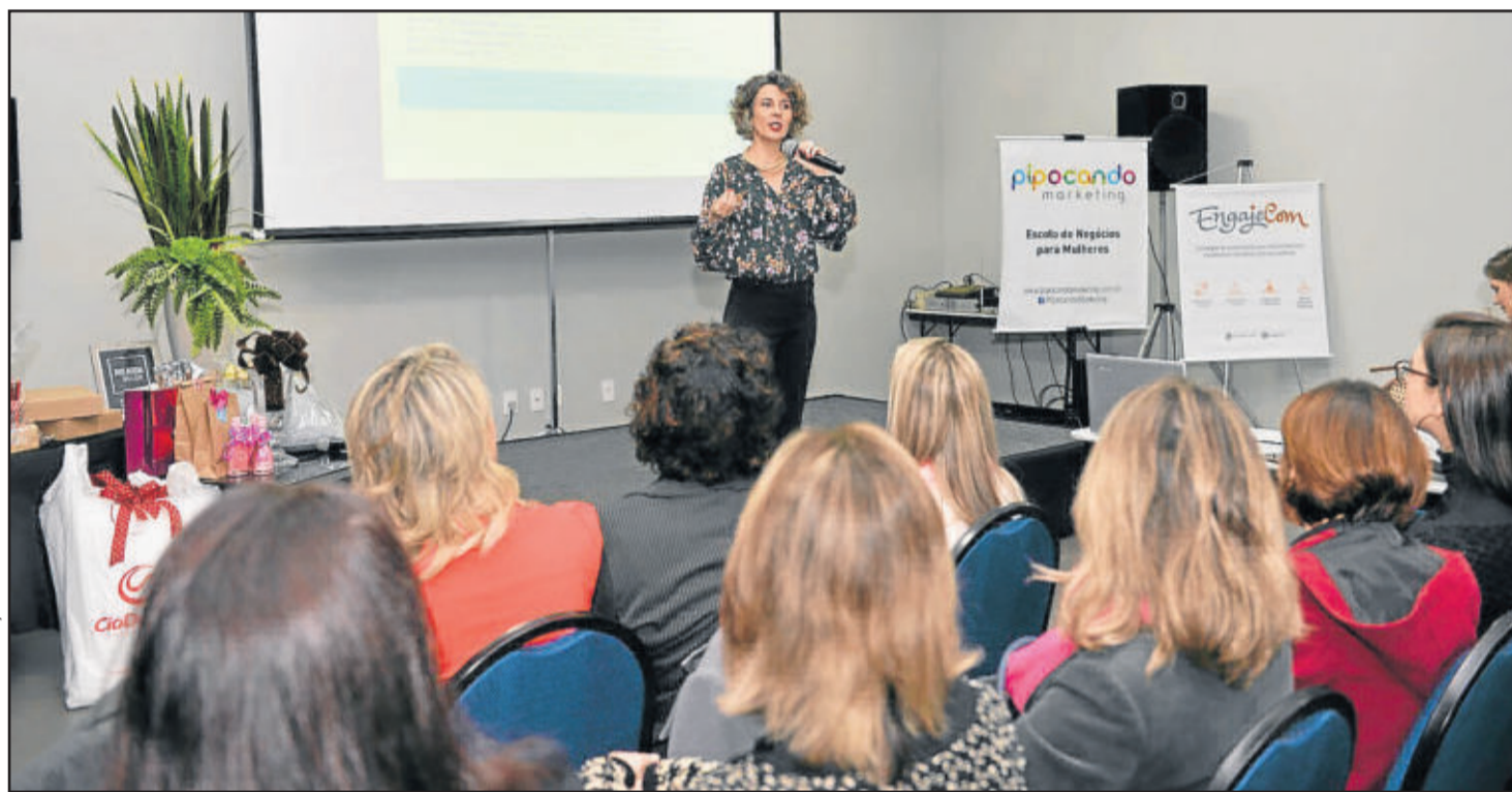
Última edição da Maratona de Palestras ocorreu em maio, em Lajeado

Os ingressos são vendidos a R$ 60,00, sendo que ele dará acesso às palestras, à Mostra de Produtos de empresas locais e de Lajeado e ao coquetel. Do valor do bilhete, R$ 5,00 serão encaminhados ao Coletivo Tônias, de Teutônia. Os tickets são vendidos na Rádio Popular e no Casarão Verde.