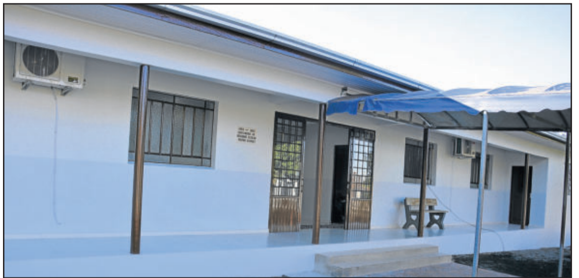
Espaço foi totalmente reformado para receber crianças e jovens

O prédio do Bloco B da EMEF Vila Schmidt representa, com pavimento térreo e subsolo, uma estrutura de 731,52m². As melhorias efetuadas no local foram: troca do telhado por telhas termoacústicas, proporcionando melhor conforto térmico; reparos e correções em revestimentos na alvenaria; pintura de toda a estrutura; troca do forro; ajustes na instalação elétrica, sendo toda ela refeita; colocação de pisos cerâmicos, azulejos e restauração do piso de madeira existente; e melhorias na acessibilidade, com execução de rampas e guarda-corpo entre o prédio e a quadra coberta.