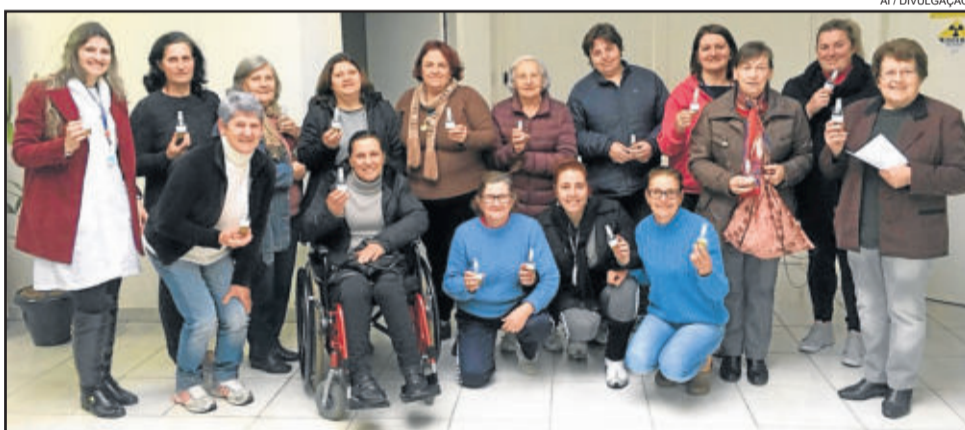
Grupo de Arco Verde confeccionou o spray