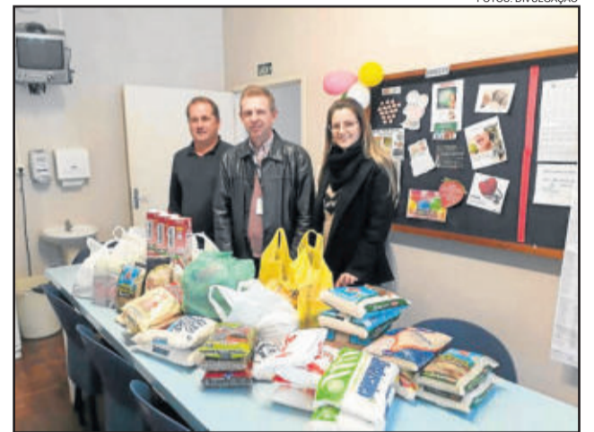
Alimentos foram entregues ao HOB