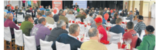
Evento de 2017 reuniu aproximadamente 200 produtores, entre associados, filhos, genros, sogros, avós e pais de associados residentes na propriedade rural