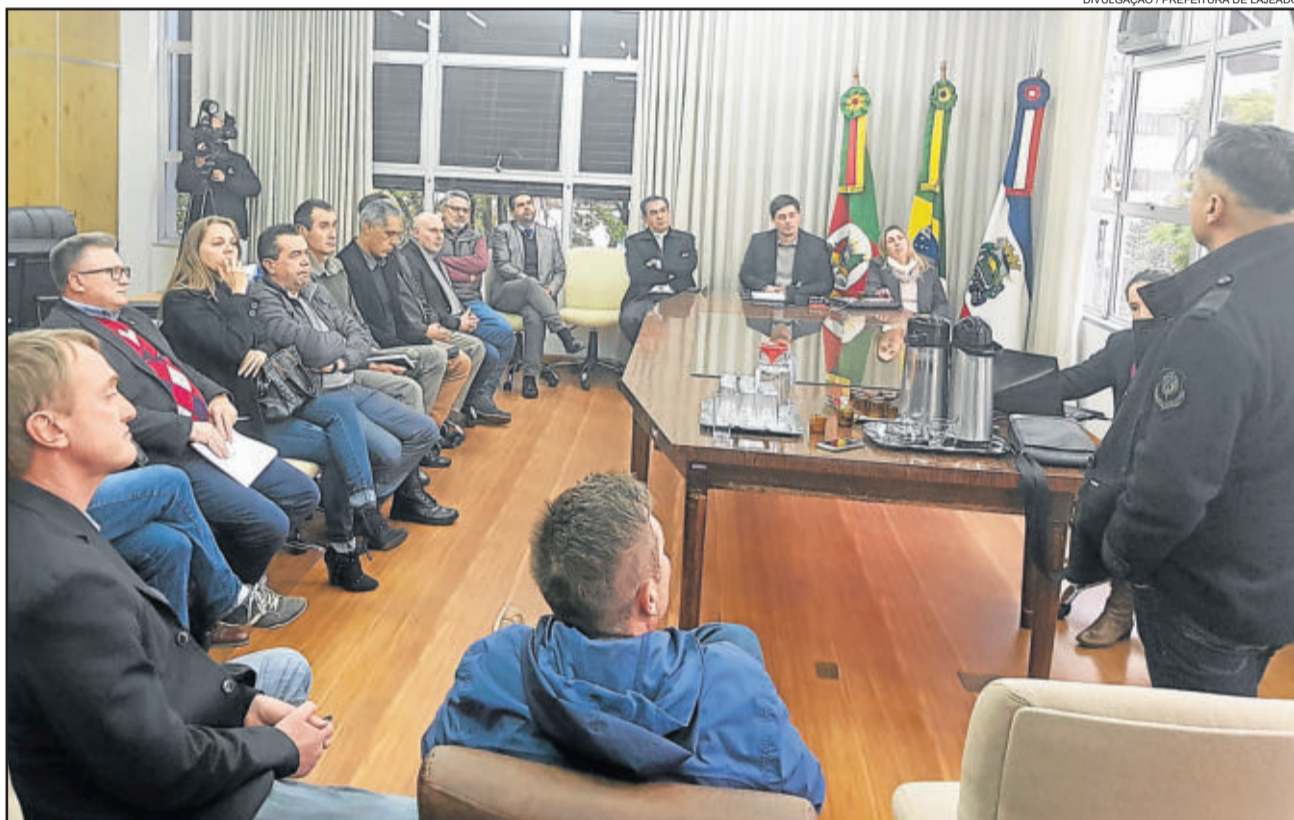
Lideranças conheceram o projeto do Centro Integrado

E m encontro reunindo representantes da Secretaria Estadual de Segurança, entidades e órgãos de segurança pública e instituições da Justiça, na quinta-feira (09/08), a Prefeitura de Lajeado, por meio da Secretaria Municipal da Segurança Pública (SESP), apresentou o projeto final do futuro Centro Integrado de Comando e Controle Regional. O novo prédio ficará instalado junto ao 22º Batalhão de Polícia Militar (BPM), em Lajeado, e servirá de central operacional para municípios da região.