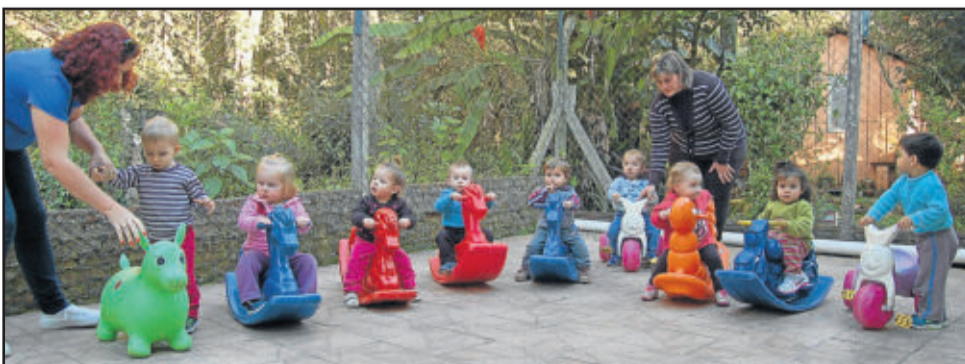
Crianças usufruindo do espaço externo

Através de um questionário, que não requeria identificação das famílias, foram encaminhadas questões para avaliação dos pais. 86% responderam às perguntas sobre o trabalho da direção da escola e também de cada uma das turmas de estudantes. A escola atende 30 crianças, de 1 a 3 anos, distribuídas em duas turmas.