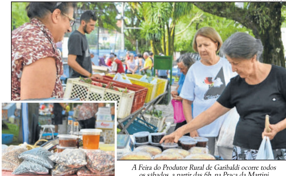
A Feira do Produtor Rural de Garibaldi ocorre todos os sábados, a partir das 6h, na Praça da Martini

A valorização dos trabalhadores rurais é uma das metas da prefeitura de Garibaldi, por meio das ações da Secretaria de Agricultura e Pecuária. Uma das atividades realizadas para isso é a Feira do Produtor Rural, que acontece semanalmente há mais de 30 anos. Atualmente, cerca de dez produtores comercializam seus produtos na Praça da Martini e Rossi, nas manhãs de sábado.