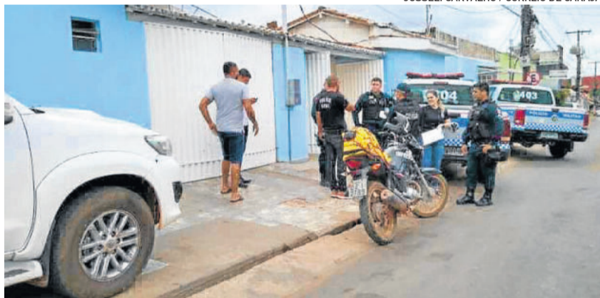
Assassinato ocorreu em um hotel na cidade de Marabá, no Pará