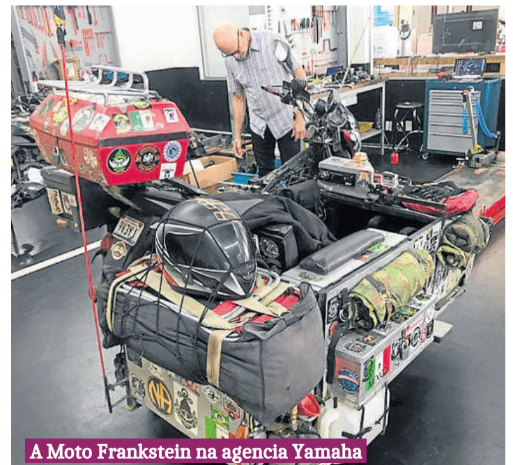
A Moto Frankstein na agencia Yamaha