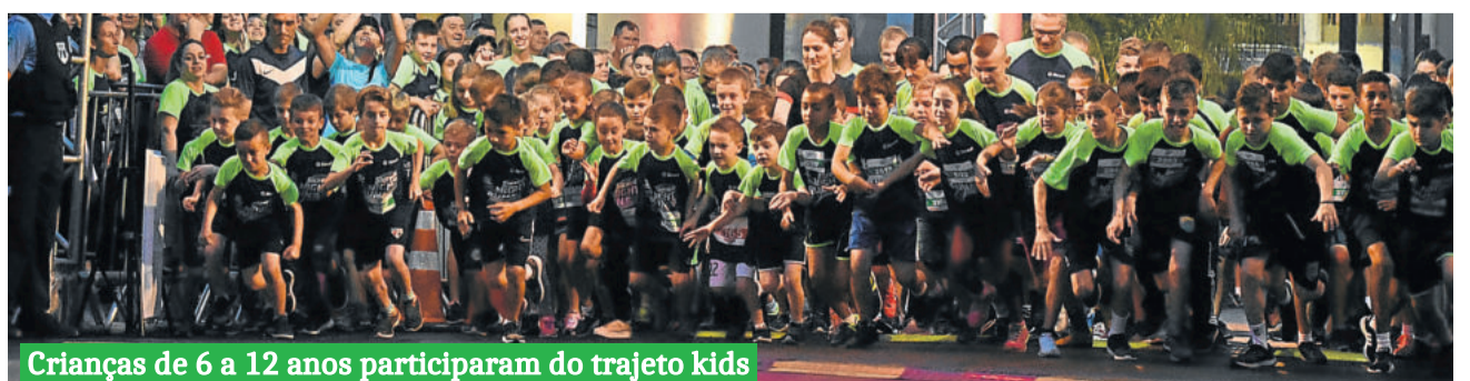
Crianças de 6 a 12 anos participaram do trajeto kids