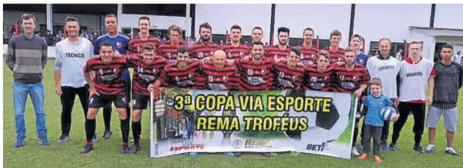
Flamengo retorna às competições e está na final da Via Esporte