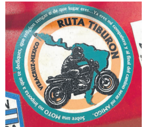
Lema do motoclub