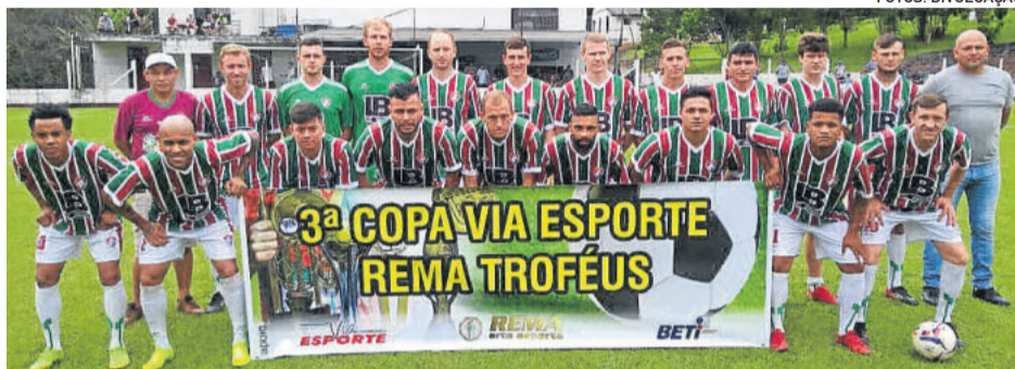
Fluminense chega à terceira final da Copa Via Esporte