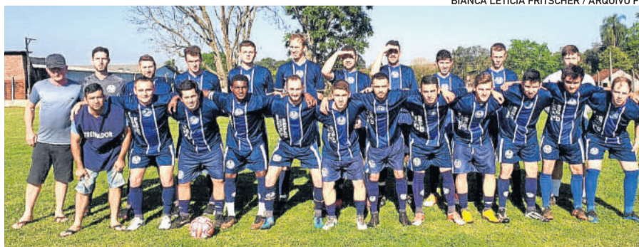
Alto Taquari está classificado para a final da Série Ouro da Copinha Certel Sicredi