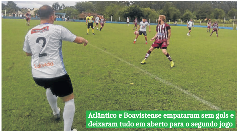
Atlântico e Boavistense empataram sem gols e deixaram tudo em aberto para o segundo jogo

O placar em branco adiou tudo para o segundo jogo da semifinal entre Atlântico e Boavistense, que neste domingo (10/11) se enfrentaram em Costão – Estrela, na primeira partida desta fase da Série A da 22ª Copa Certel Sicredi 2019. O escore de 0 a 0 mantém o Boavistense com a vantagem do empate para o jogo de volta, enquanto que o Atlântico terá que vencer para levar a vaga; não há possibilidade de haver disputa da vaga nos pênaltis.