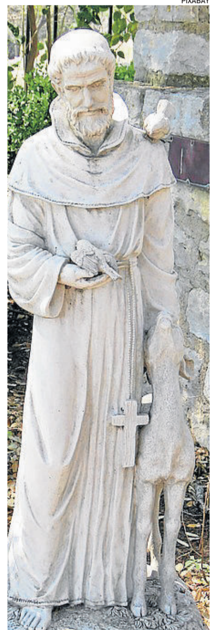
Estátua de São Francisco de Assis