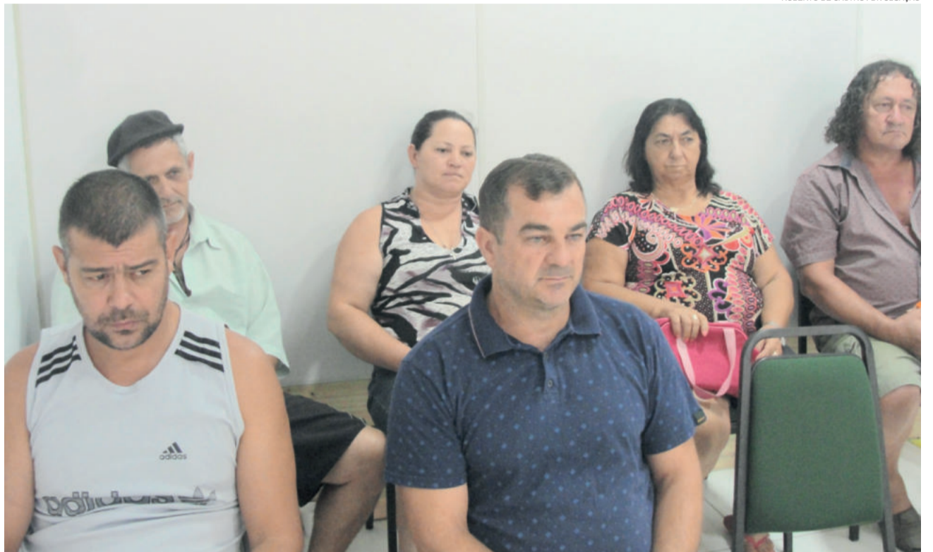
Moradores da Rua Alvorada estiveram na Câmara de Vereadores cobrando soluções de melhorias na rede elétrica administrada pela RGE Sul