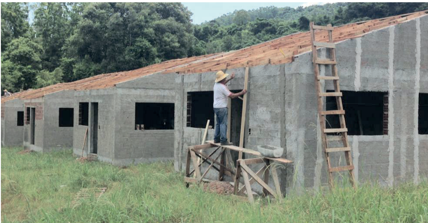
50 casas serão construídas no loteamento 10 de Abril