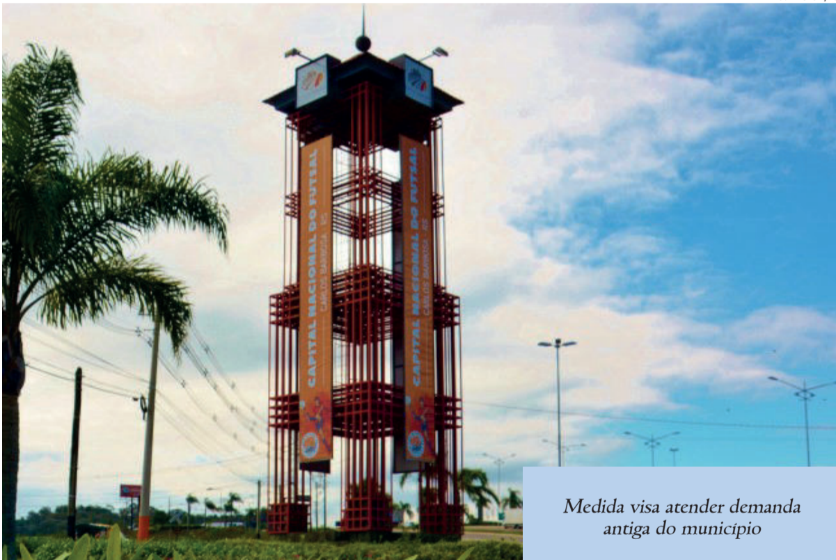
Medida visa atender demanda antiga do município