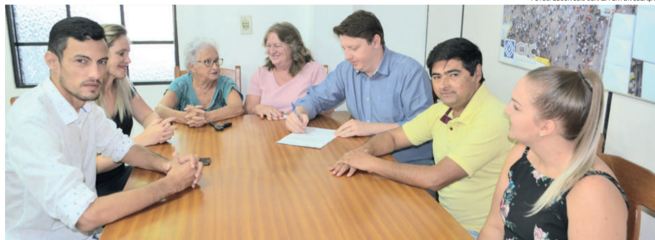
Medida foi anunciada pelo Executivo esta semana

O custeio das vagas nas escolas de Educação infantil é considerado pela administração como o maior projeto social da história de Teutônia. Isto porque os pais não precisam mais pagar a mensalidade nas escolas comunitárias, trazendo alívio para o bolso das famílias. Assim, podem aplicar aquele dinheiro em outros investimentos para seus filhos. Apesar de a mensalidade ser gratuita, é fundamental que as famílias contribuam espontaneamente com as Associações de Pais, Professores e Funcionários (APPFs), tendo em vista as despesas adicionais dos educandários. Trata-se de um aporte legal respaldado no artigo 205 da Constituição Fede-