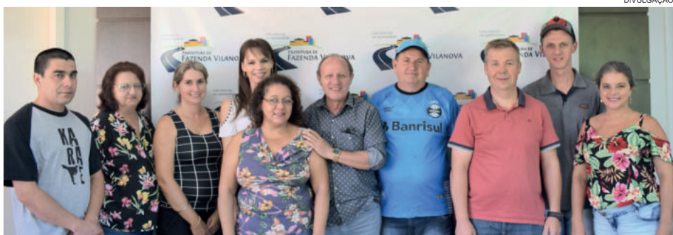
Nova diretoria da Associação Cultural Vilanovense foi eleita em chapa única no dia 07 deste mês