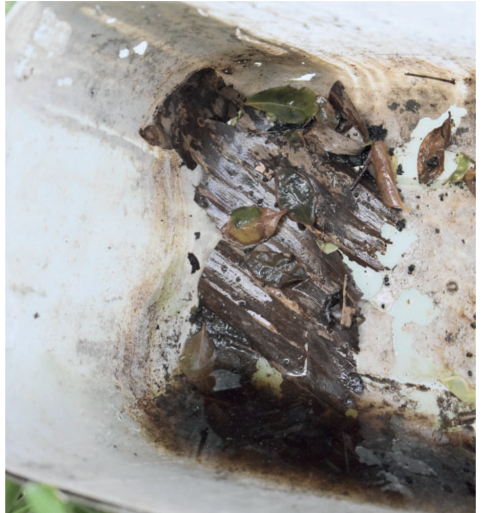
Os criadouros se formam em locais possivelmente escondidos, como em potes parados junto a entulhos do quintal

Ervál Seco, Marau, Panambi e Cândido Godói foram as quatro cidades do estado em que já foram registrados casos de dengue neste ano, um alerta, posto que nenhum foi registrado em 2017 em todo o estado. De acordo com a Secretaria da Saúde, a infestação por Aedes aegypti no Rio Grande do Sul passou de 62 municípios em 2010 para 320 atualmente. Para o desenvolvimento de ações de prevenção e controle do mosquito, a Secretaria Estadual da Saúde encaminhou R$ 4.512.567,01 em investimentos do para todos os 320 municípios com infestação de Aedes Aegypti. O valor deve ser revertido em ações de prevenção e controle do mosquito transmissor. A iniciativa faz parte da estratégia de fortalecimento das áreas de saúde no período de veraneio, integrando a Operação Verão para Todos do governo do Estado.