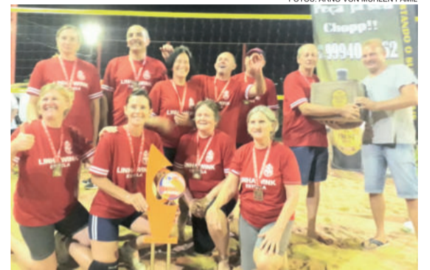
Time da Linha Wink ficou com o título