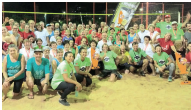
Nove equipes disputaram 20 partidas de beach câmbio

A edição 2019 do Festival de Verão Smel/Off Aventura tem seus primeiros campeões. Foi realizada na noite desta quinta-feira (07/02) a modalidade beach câmbio do evento promovido pela Secretaria de Esportes e Lazer. Nove equipes disputaram ao todo 20 partidas e o título, acabou ficando com a equipe Wink, de Estrela. Na final, vitória por 15 a 8 sobre Languiru, de Teutônia. O terceiro lugar foi decidido em um clássico de equipes de Poço das Antas, com o elenco Azul levando a melhor sobre o time Vermelho. Nos casos de empate as partidas foram decididas pelos seguintes critérios: 1) Pontos (Vitória 2 pontos e Derrota 1 ponto); 2) Pontos Average (pontos feitos/-pontos sofridos); 3) Maior número de pontos feitos; 4) Menor número de pontos sofridos; 5) Sorteio.