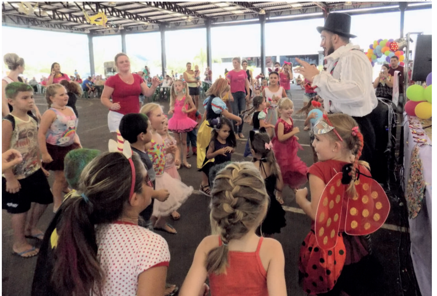
Carnaval Infantil integra edição especial do Arte na Rua

Além de muita música, com as tradicionais marchinhas de carnaval, e animação com a presença de palhaços, serão disponibilizados brinquedos infláveis, maquiagem decorativa e haverá comercialização de comidas e bebidas, no evento também terá a ervateira para os amantes do chimarrão.