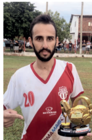
Atlético saiu atrás do marcador e precisou buscar a virada em casa