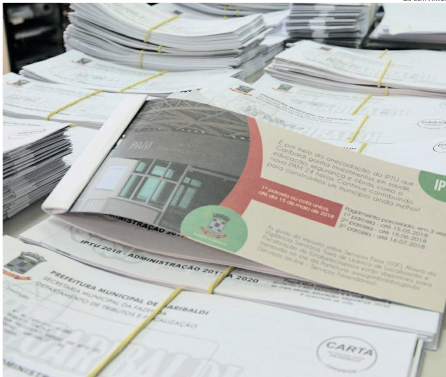
Todo início de ano, contribuintes recebem suas guias para pagamento do IPTU