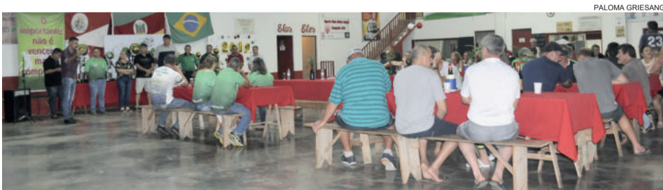
Clubes, autoridades e organização se reuniram na sede do Atlético Gaúcho, no Loteamento 8

A direção da Acat ainda agradeceu a Administração Municipal de Teutônia e a Sicredi pelo apoio para a realização do campeonato. Além de agradecer o incentivo e apoio da imprensa. Desejou ainda um bom campeonato a todas as equipes.