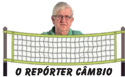
O REPÓRTER CÂMBIO