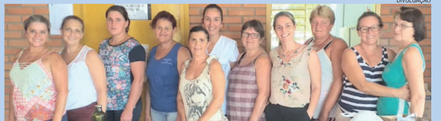
Merendeiras também aprendem novas receitas nas oficinas de alimentação que acontecem a cada 60 dias