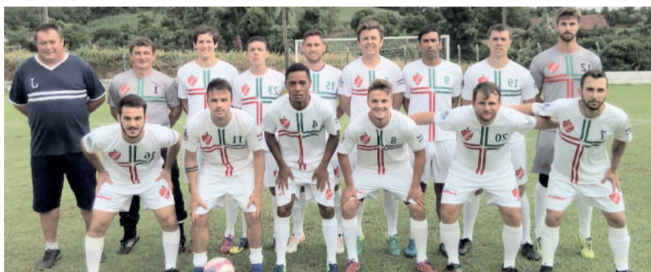
Riograndense de Daltro Filho