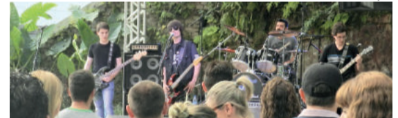
Banda Máquina Loca