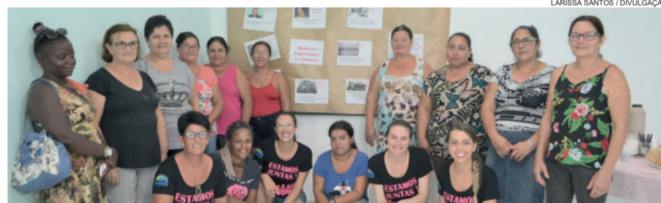
Encontro entre as mulheres usuárias dos grupos de Assistência Social e comunidade em geral, fez parte da programação do projeto Estamos Juntas.

No final do encontro, foi realizada uma roda de conversa, em que as mulheres puderam dar suas opiniões sobre determinados assuntos, expor suas experiências e vivências envolvendo machismo, relacionamentos abusivos e violência. Durante o encontro, ainda houve um coquetel para as participantes.