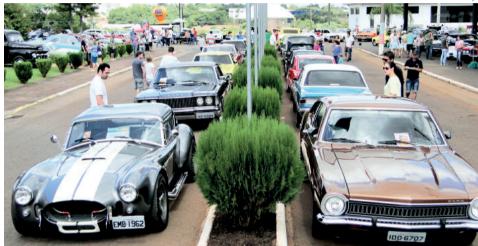
Carros antigos estarão expostos no Centro Administrativo

Quem quer apreciar os carros em exposição ainda sábado precisa chegar antes das 22h30, horário em que o Parque de Exposições é fechado. A partir desse horário acontece o Especial Retrô na La Bodeguita, também junto ao Centro Administrativo Municipal. No palco, Banda Franchicos, Banda Apple e Dj Alan Gaspar.