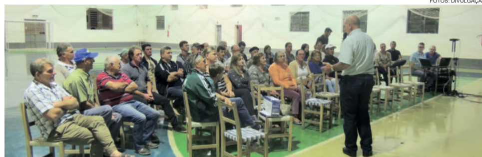
Executivo realizou atendimentos, prestou contas e apresentou planos futuros

No período da noite, foi feita a prestação de contas da administração municipal, oportu-