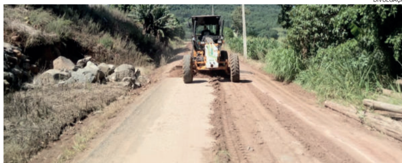
Estradas estão recebendo ensaibramento e nivelamento