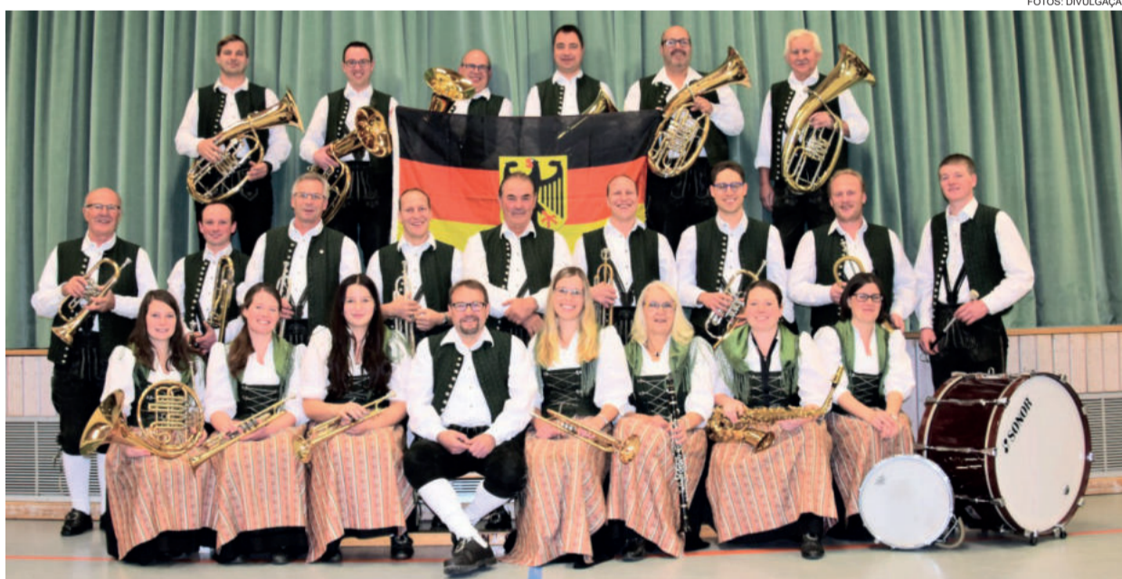
Orquestra Alemã será outra atração especial