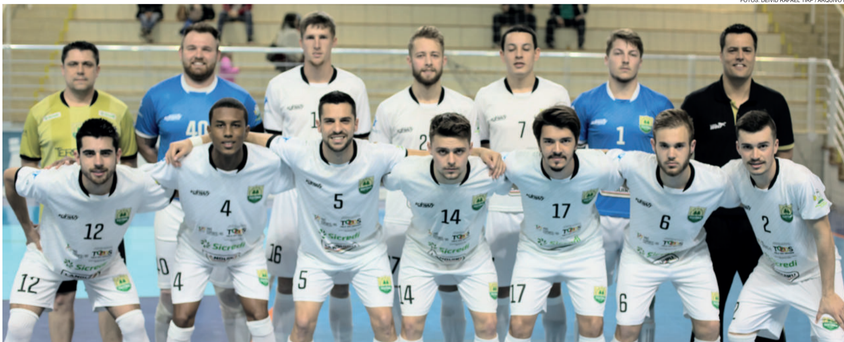
Teutônia Futsal fez seu último jogo no Gauchão Série Bronze de 2018 no dia 1º de setembro