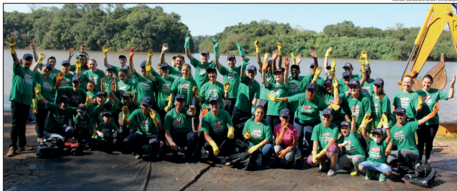
Quase 800 voluntários participaram da ação