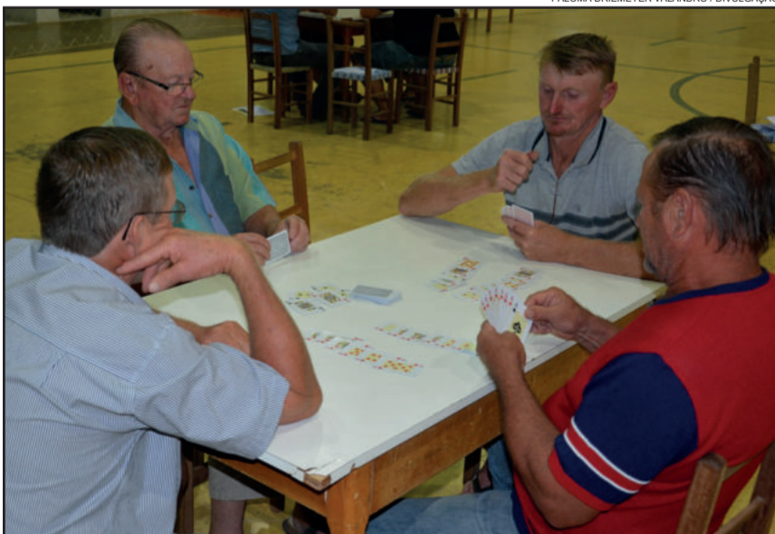
Quartas de final do 3º Campeonato Municipal de Canastra acontecerão na sede do Flamengo

Inicia na próxima sexta-feira, dia 13 de abril, a fase eliminatória do 3º Campeonato Municipal de Canastra de Westfália, promovido pela Administração Municipal, através da Secretaria de Educação, Cultura, Turismo e Desporto (SMEC). As quartas de final da competição serão sediadas no Flamengo Futebol Clube, no Centro do Município.