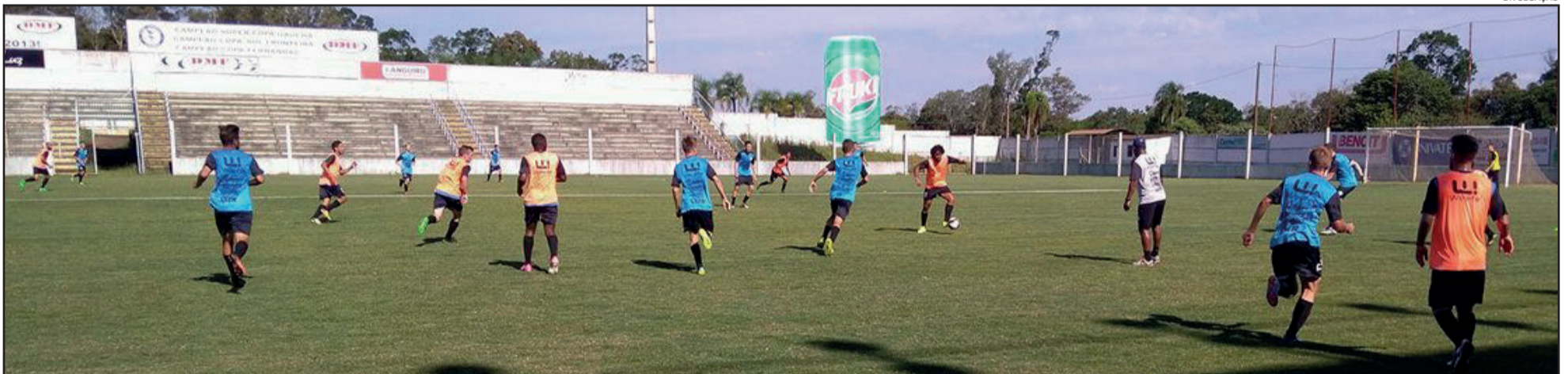
Lajeadense treina durante a semana visando o confronto direto com o Inter-SM