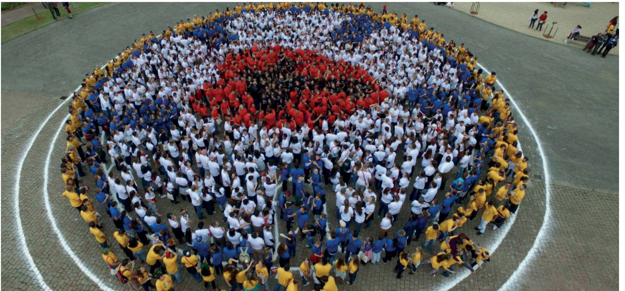
De 22 a 27 de julho, Teutônia será palco do Congresso Nacional da Juventude Evangélica (Congrenaje). TEUTÔNIA > 2