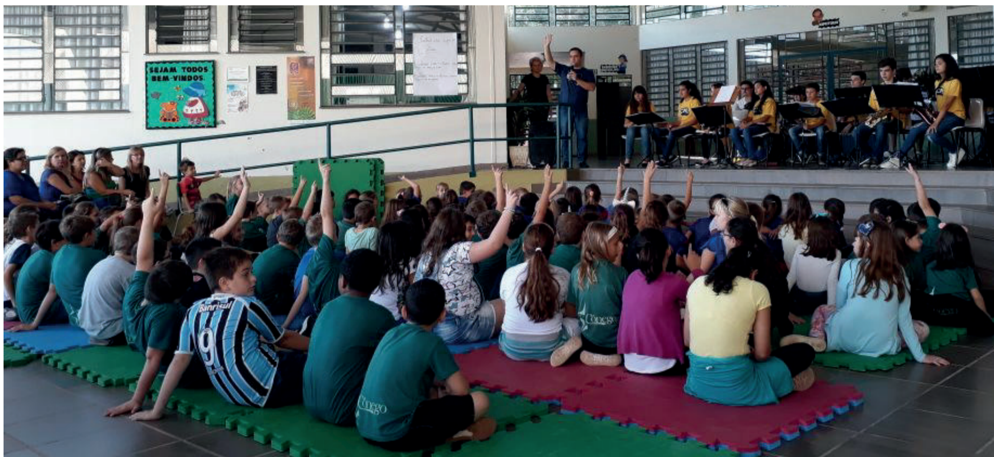
Apresentação da Orquestra do Colégio Martin Luther foi uma das atrações