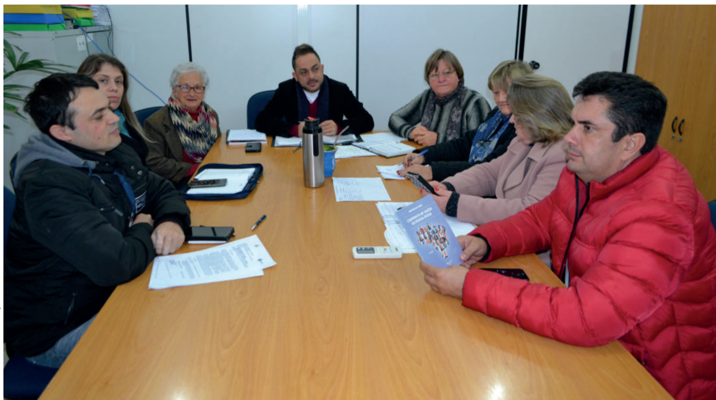
Conselho se reuniu nesta quinta-feira