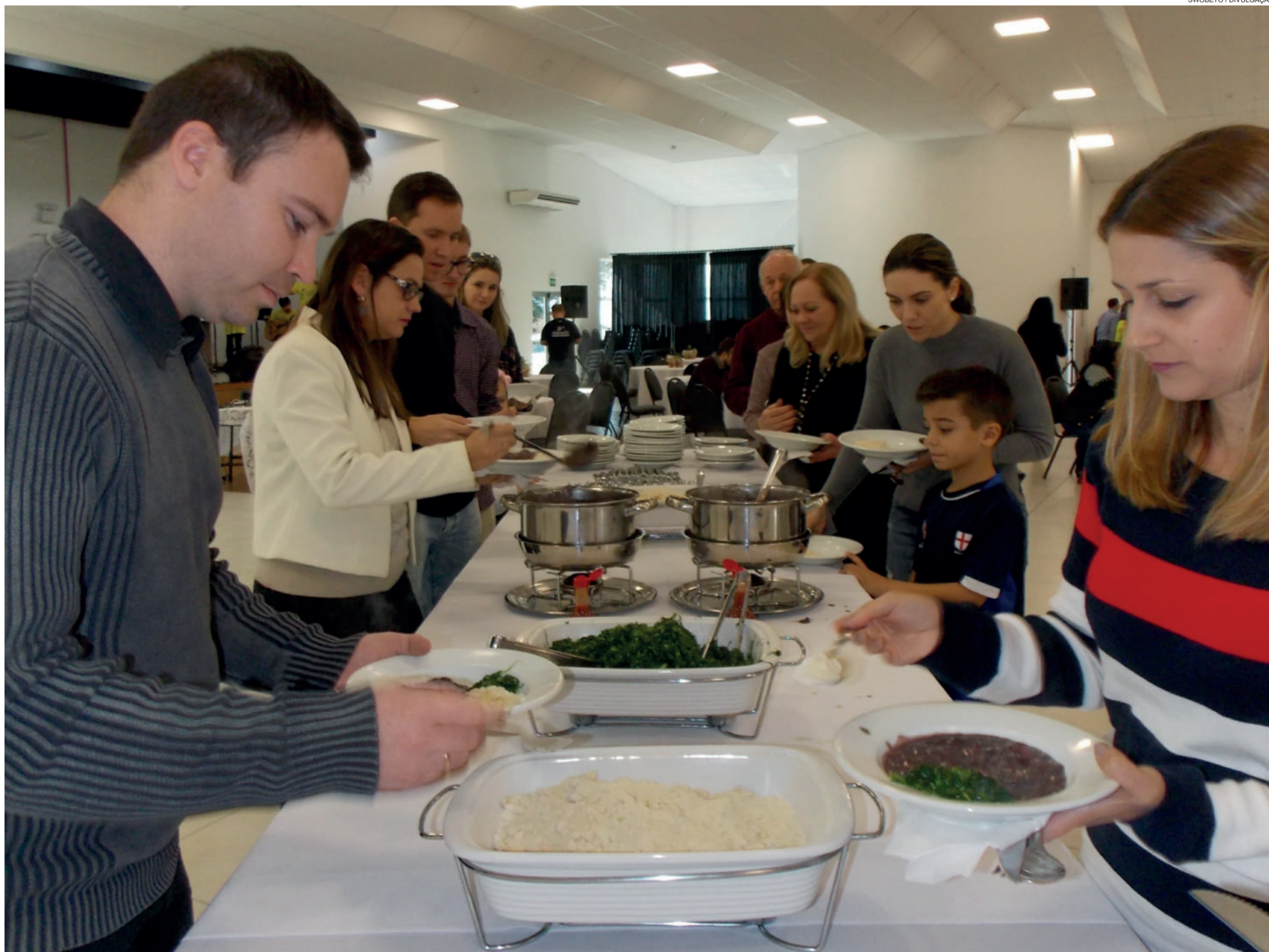
Feijoada atraiu dezenas de pessoas no sábado ao meio dia