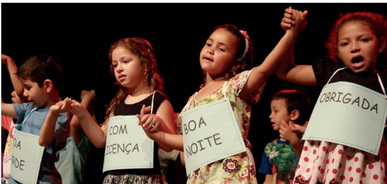
Gentileza e outras premissas de educação foram enfatizadas