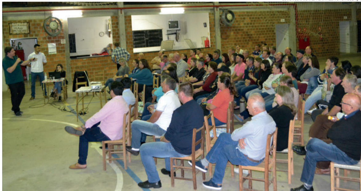
Primeira audiência ocorreu na Linha Catarina

Linha Catarina sediou o primeiro encontro na semana passada, dia 3 de dezembro, ocasião que em a comunidade teve a oportunidade de conhecer as principais ações do governo. O cronograma das demais localidades e bairros que sediarão as audiências públicas com prestações de contas ainda está sendo definido e será divulgado em breve. Toda a comunidade está convidada a participar.