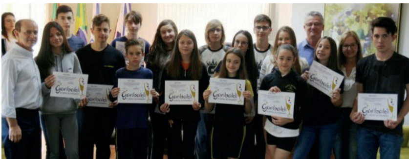
Alunos premiados na OBMEP