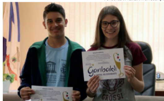
Alunos premiados na OBA