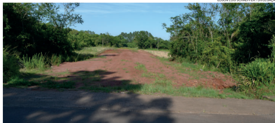
Área destinada ao TeutoPark fica no Centro Administrativo

pla ainda calçadão, pistas de caminhada, ciclovia e iluminação. Já a segunda etapa do projeto, entre a Avenida 1 Oeste e a rodovia Via Láctea, prevê mais oito lotes destinados à gastronomia, quadras esportivas, calçadão, ampliação da pista de caminhada e da ciclovia, entre outras atrações.