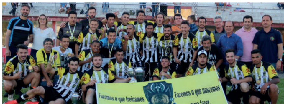
Campeão Principal Espartanos