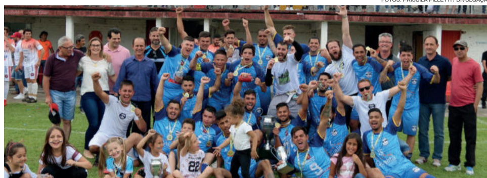
Campeão Aspirante All Blacks

O Campeonato Municipal de Futebol Amador é realizado pela Prefeitura de Garibaldi, por meio da Secretaria Municipal de Esportes e Lazer, e ocorreu aos domingos, em diferentes campos do município.