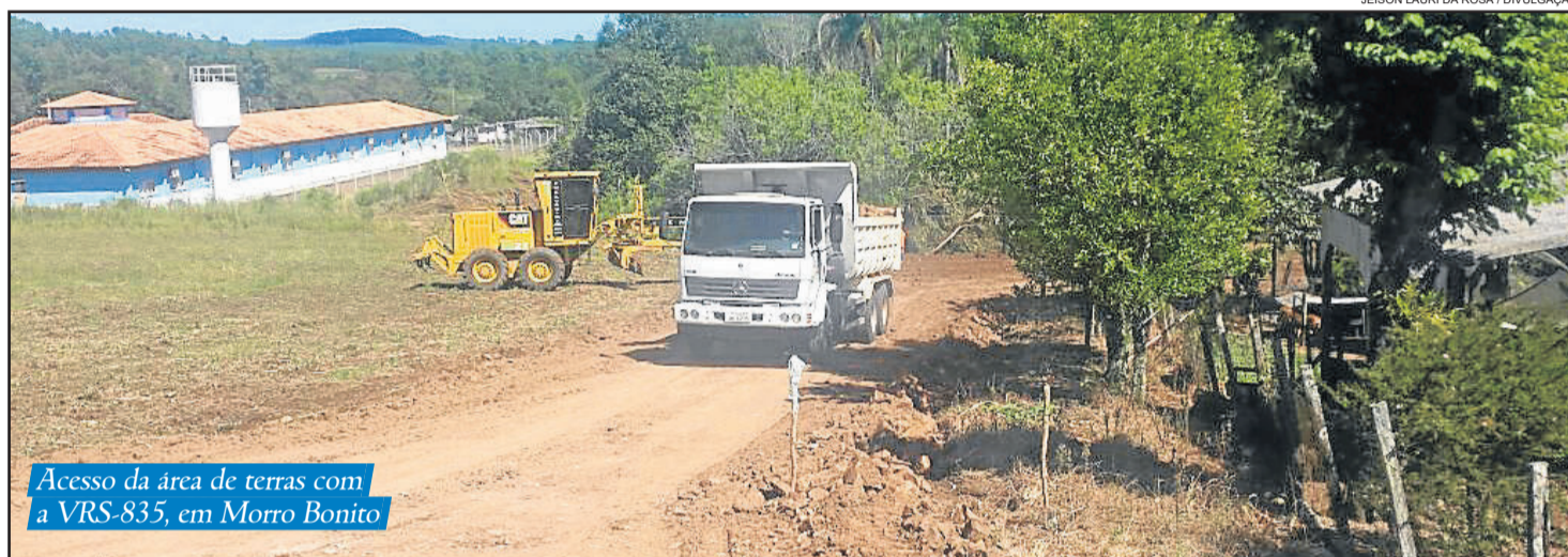
Acesso da área de terras com a VRS-835, em Morro Bonito

Em torno de 103 famílias procuraram o CRAS, durante a semana passada, para se cadastrar ou atualizar seu cadastro. Não há mais prazo para inscrever, pois a Caixa só liberou até o dia 9. O governo municipal realizou uma mobilização de servidores de várias secretarias para conseguir preencher toda a