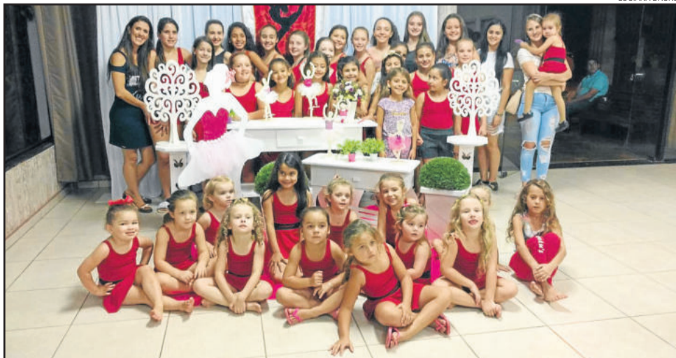
Alunas que marcaram presença no evento