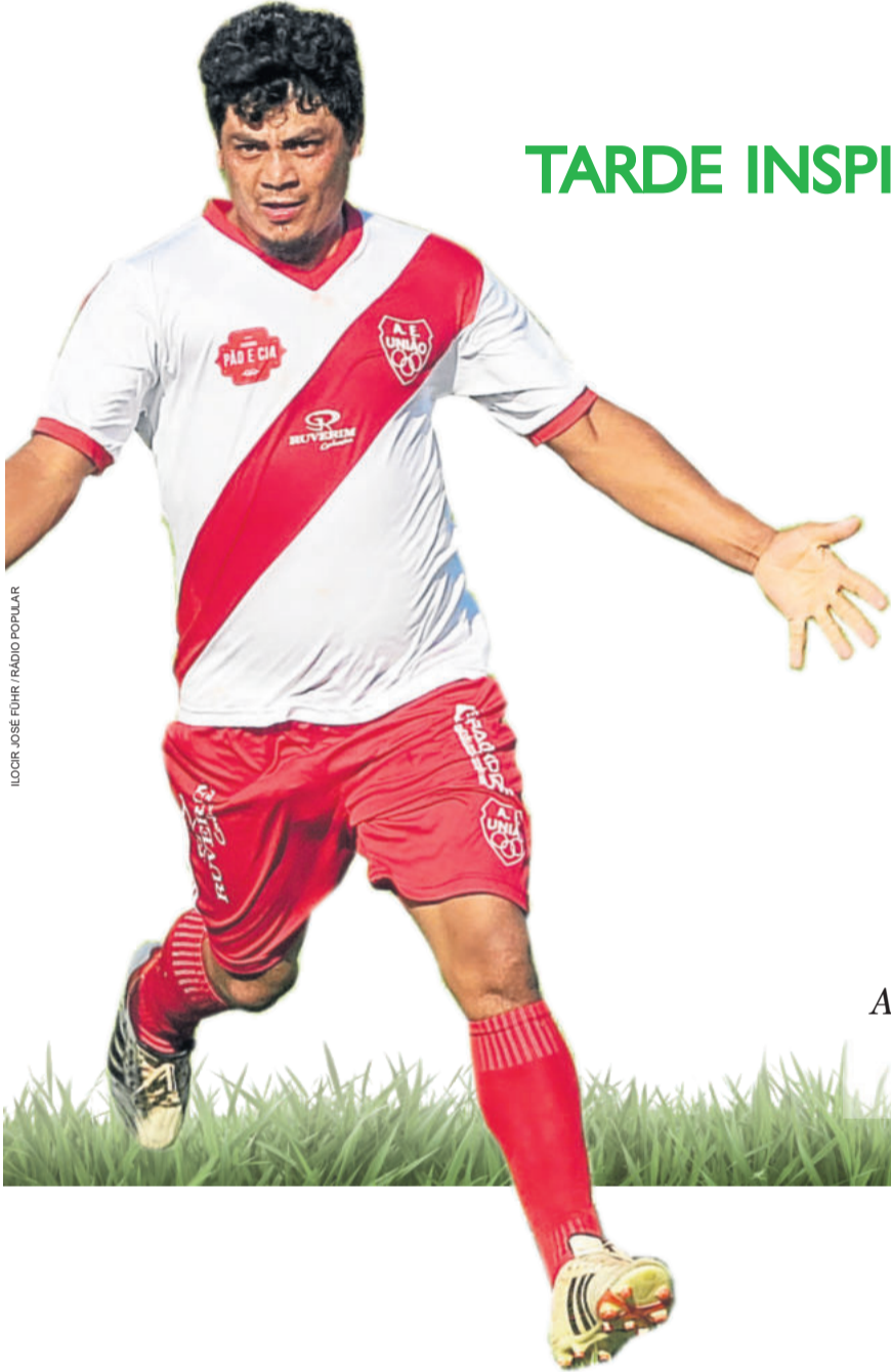
ILUSTR. JOSÉ FUHR / RÁDIO POPULAR