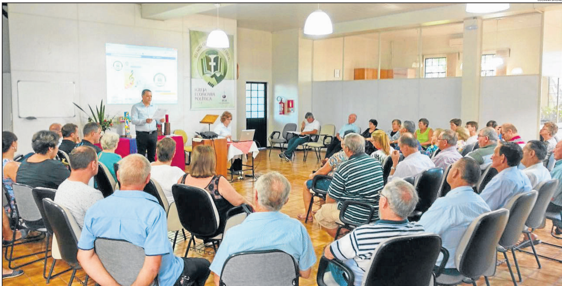
Acote realiza primeiro encontro do ano