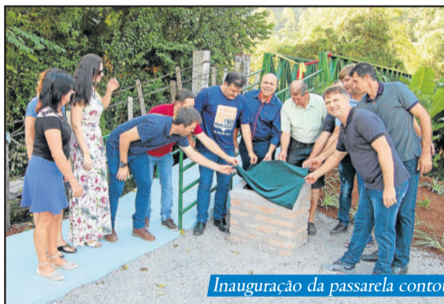
Inauguração da passarela contou com participação da comunidade e autoridades