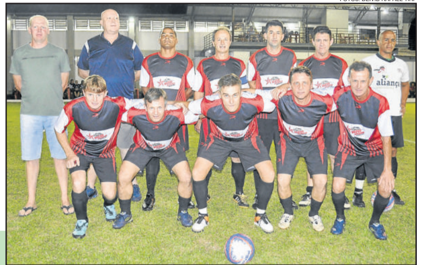
Viévi Automóveis MASTER

No Sub-20, o Karandiru já está na decisão e aguarda o ganhador do outro confronto, entre Rudibar e IMEEC. Já no Força Livre, o Amigos do Corvo/Ludwig encara o Lermen Empreendimentos/Restaurante Pinguim para apurar a vaga na final diante do Amaral DPVAT.