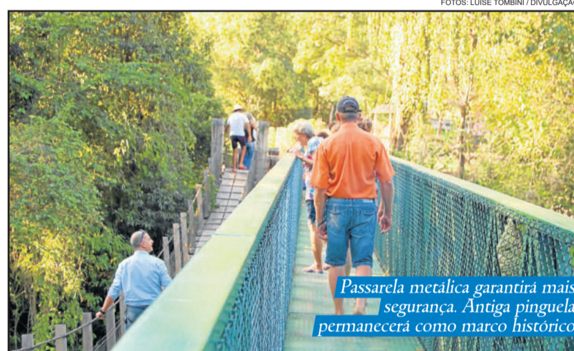
Passarela metálica garantirá mais segurança. Antiga pinguela permanecerá como marco histórico

A antiga pinguela não será removida em razão do apelo turístico e valor histórico que possui.