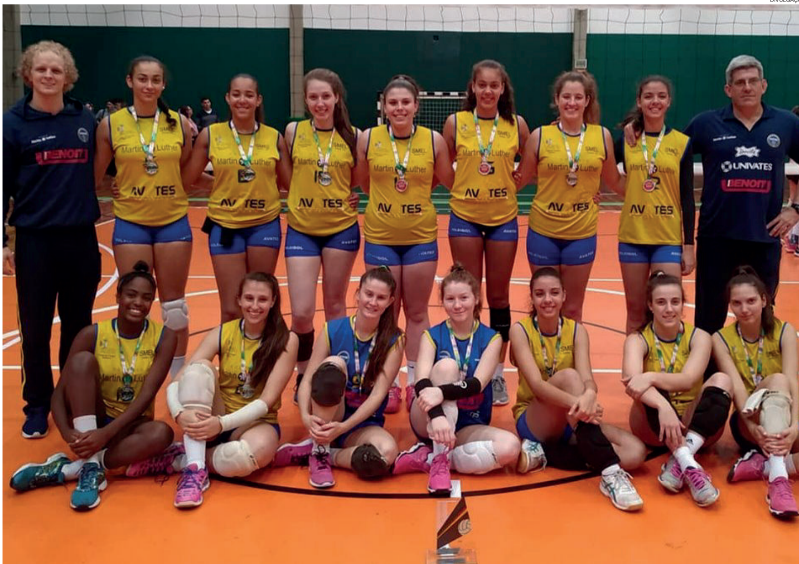
Equipe volta a jogar em competição internacional na próxima semana