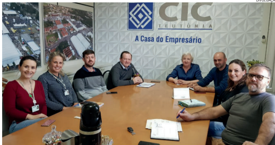
Grupo planeja capacitações e palestras

A Secretaria Municipal de Indústria, Comércio e Turismo tem liderado as iniciativas para o setor. O objetivo é qualificar ainda mais o ramo moveleiro teutoniense, com expressiva representatividade econômica e social para o município, carregando o conceito de qualidade dos produtos e serviços inclusive para outras regiões, como a metropolitana, que realizam negócios com as empresas teutonienses.