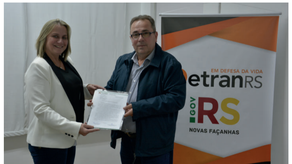
No final de maio, Município também solicitou ao Detran apoio para melhorias na segurança pública