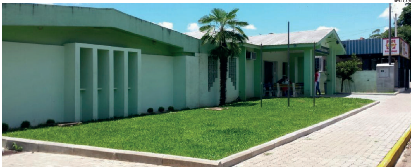
Posto de Saúde do Centro

O que antes era feito de forma quinzenal passa a ser realizado diariamente evitando filas e transtornos em frente ao Posto de Saúde