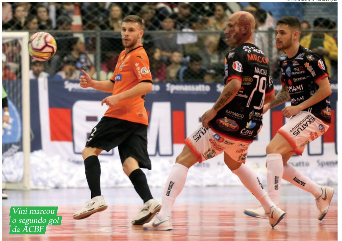
Vini marcou o segundo gol da ACBF

O próximo jogo da ACBF pela Liga Gaúcha será contra o Guarany, em Carlos Barbosa, no dia 19. Antes disso, na sexta-feira, o time laranja recebe o Minas pela LNF.