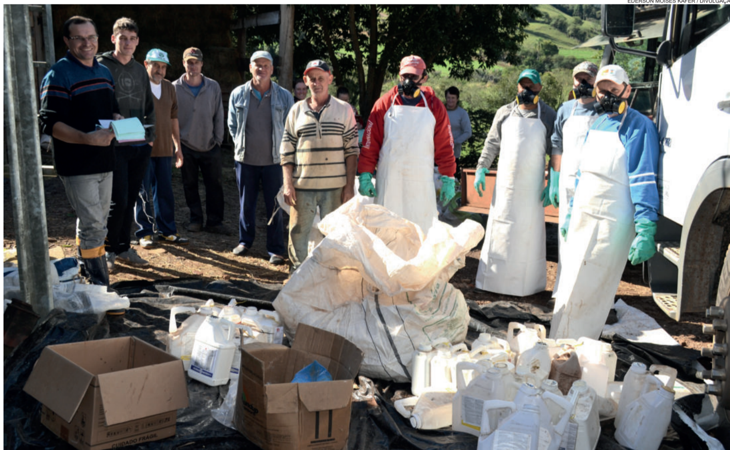
Recolhimento das embalagens ocorre em 16 pontos de coleta